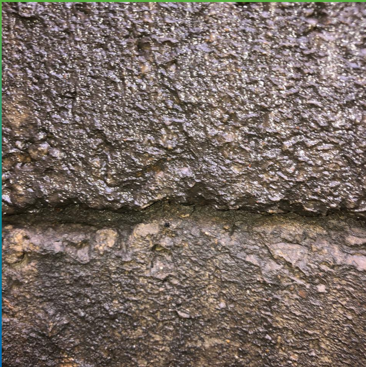
Протечки в швах колодцев