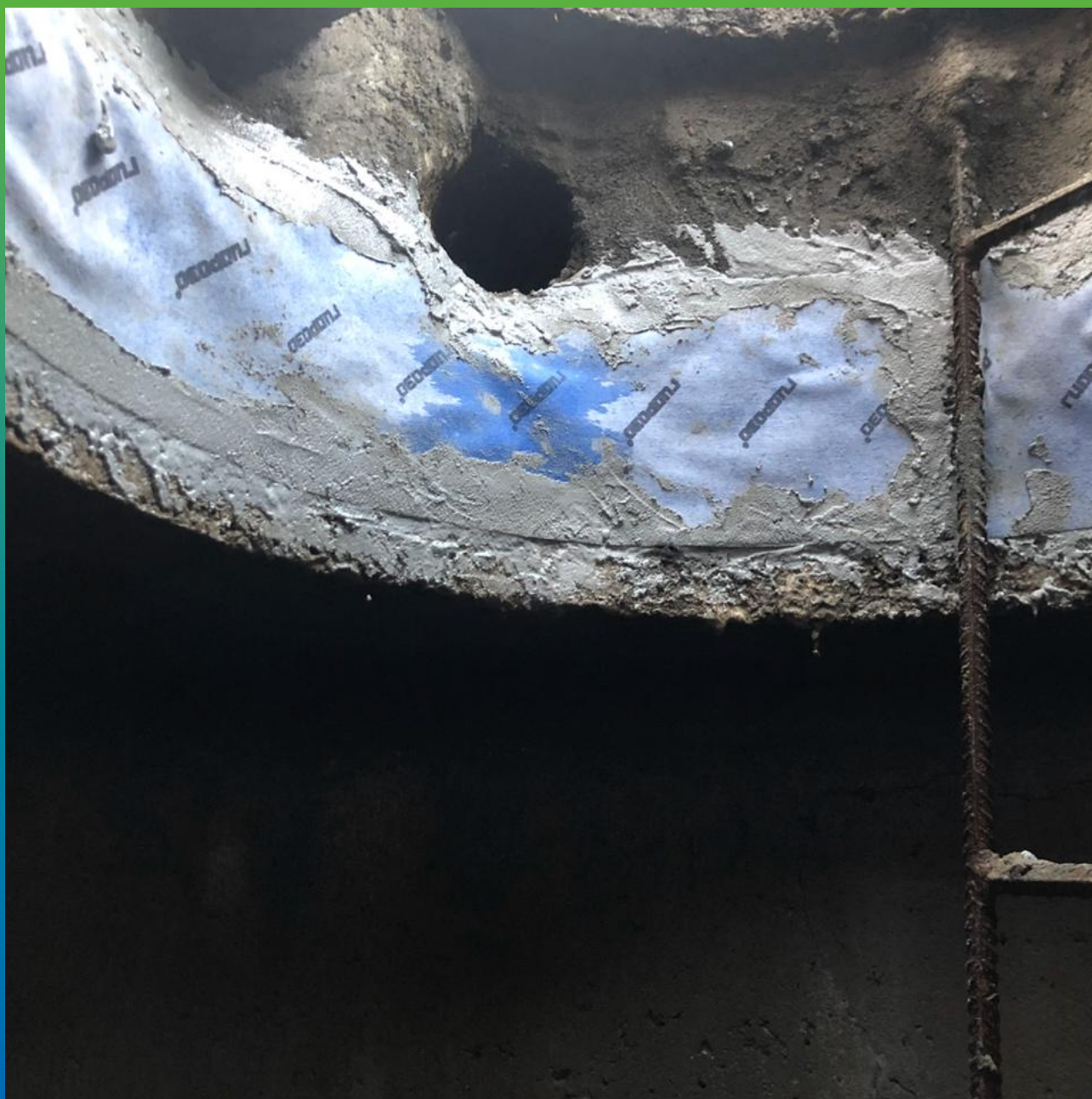
Швы, проклеенные лентой Манодил Гео и Манопокс 331