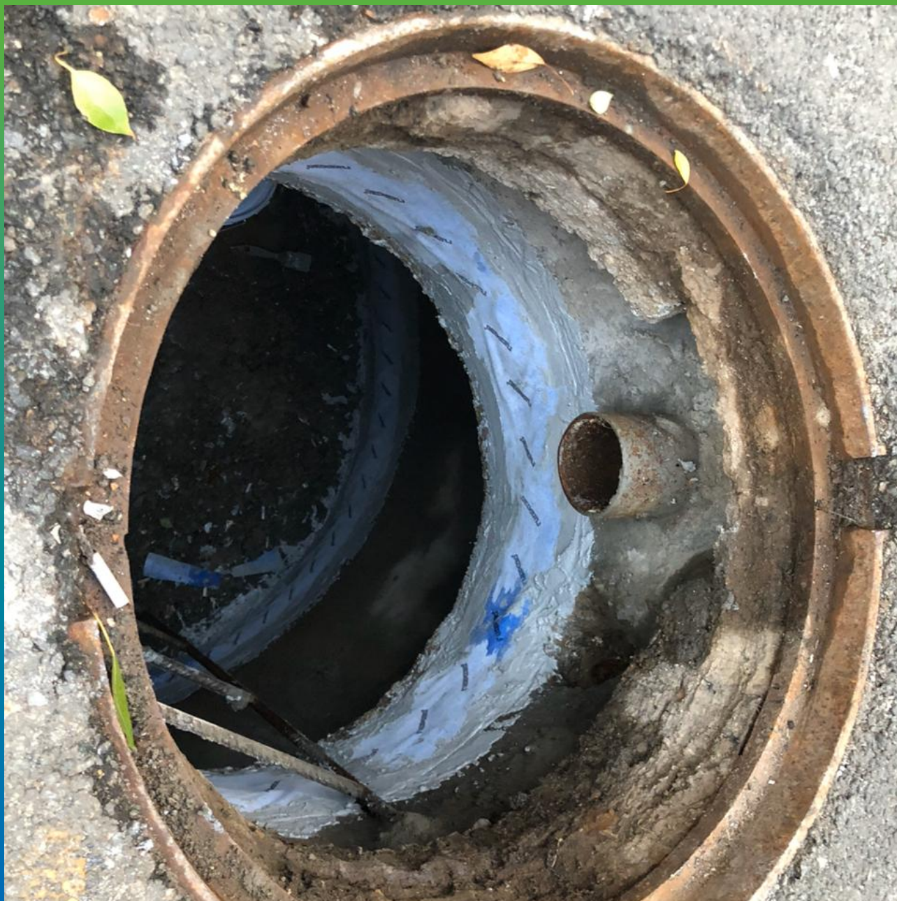
Швы, проклеенные лентой Манодил Гео и Манопокс 331