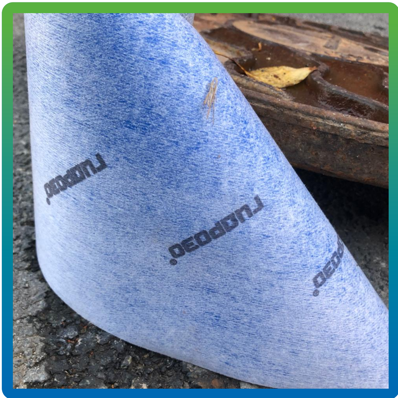
Эластичная лента Манодил Гео