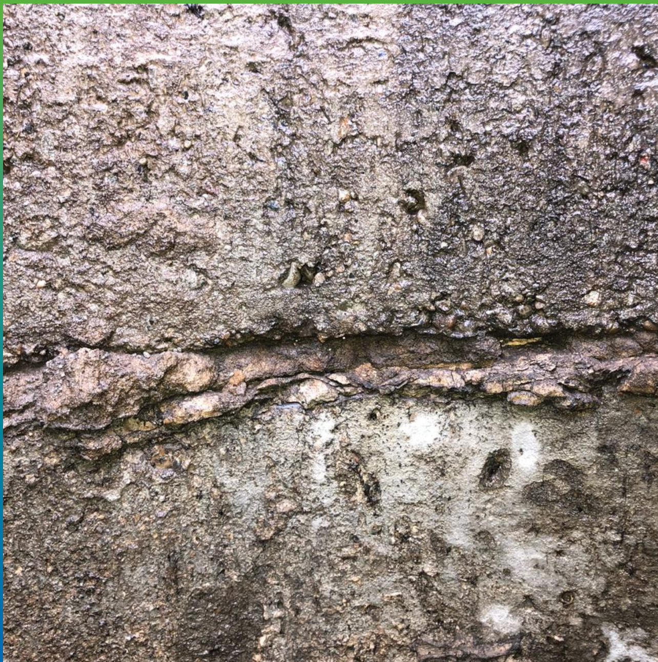
Протечки в швах колодцев