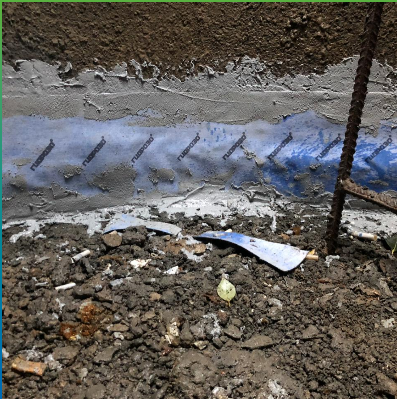
Швы, проклеенные лентой Манодил Гео и Манопокс 331