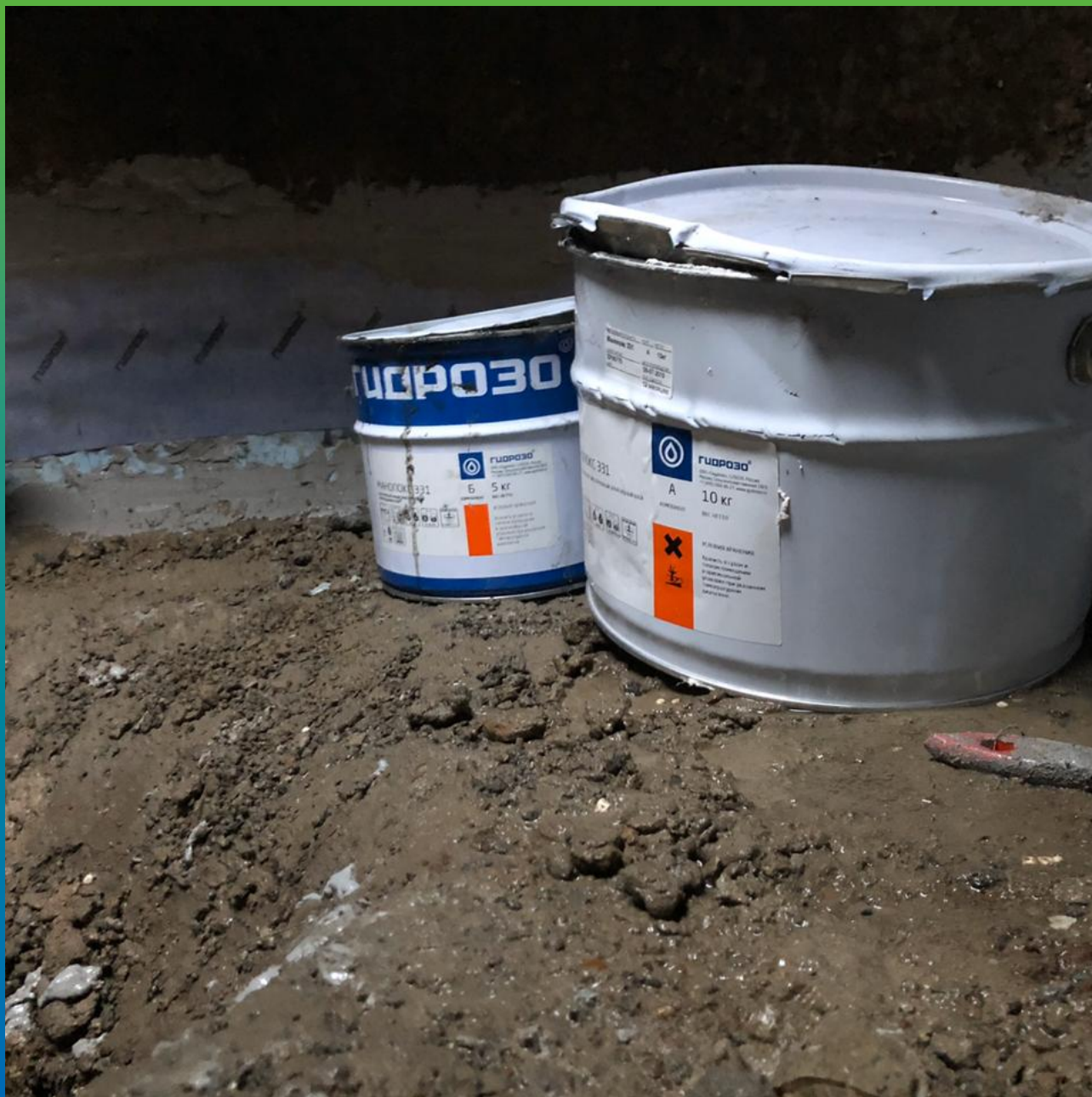
Двухкомпонентный эпоксидный клей Манопокс 331 на объекте