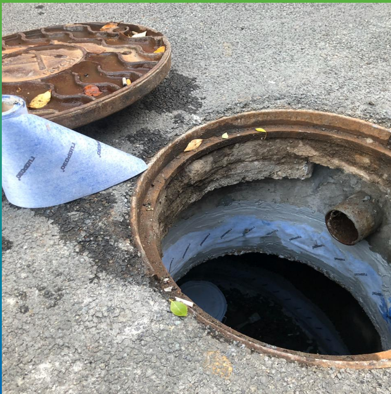
Эластичная лента Манодил Гео