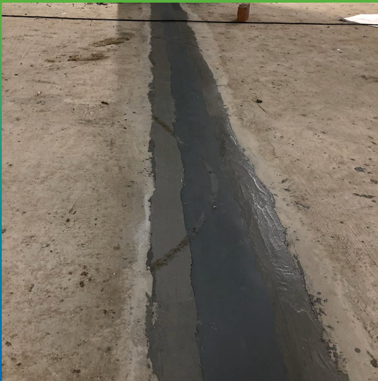
Лента Манодил Про, монтированная на шов