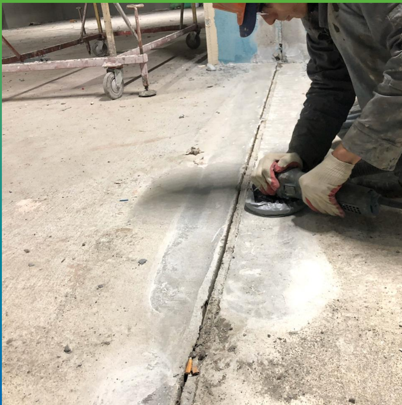
Подготовка поверхности для монтажа ленты Манодил Про