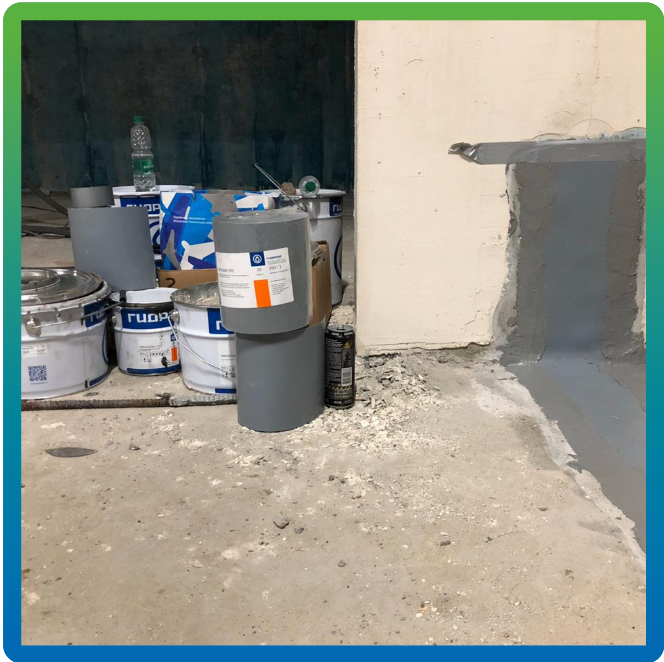
Лента Манодил Про, монтируемая на шов