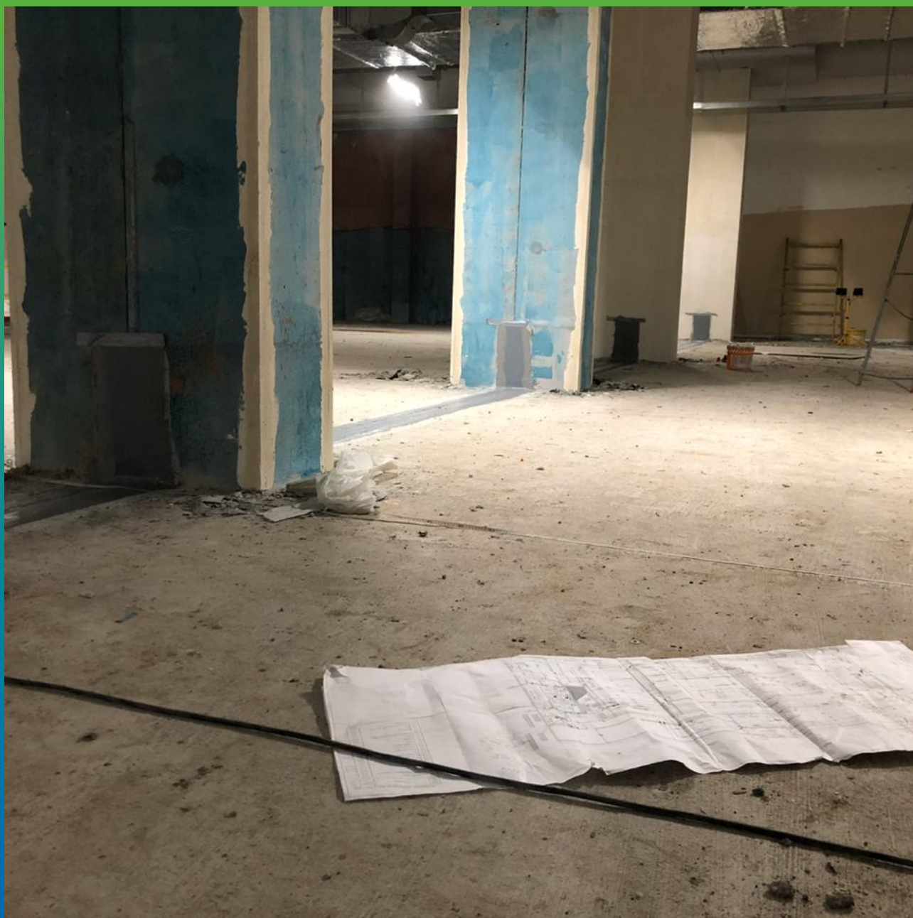
Лента Манодил Про, монтированная на шов