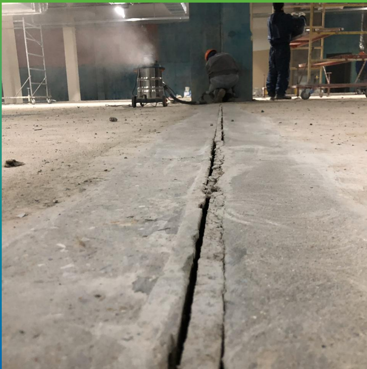
Подготовка поверхности для монтажа ленты Манодил Про