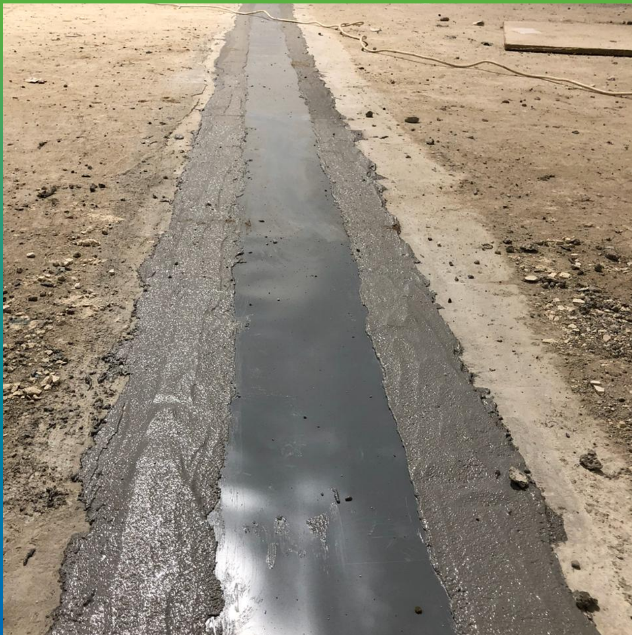
Лента Манодил Про, монтированная на шов