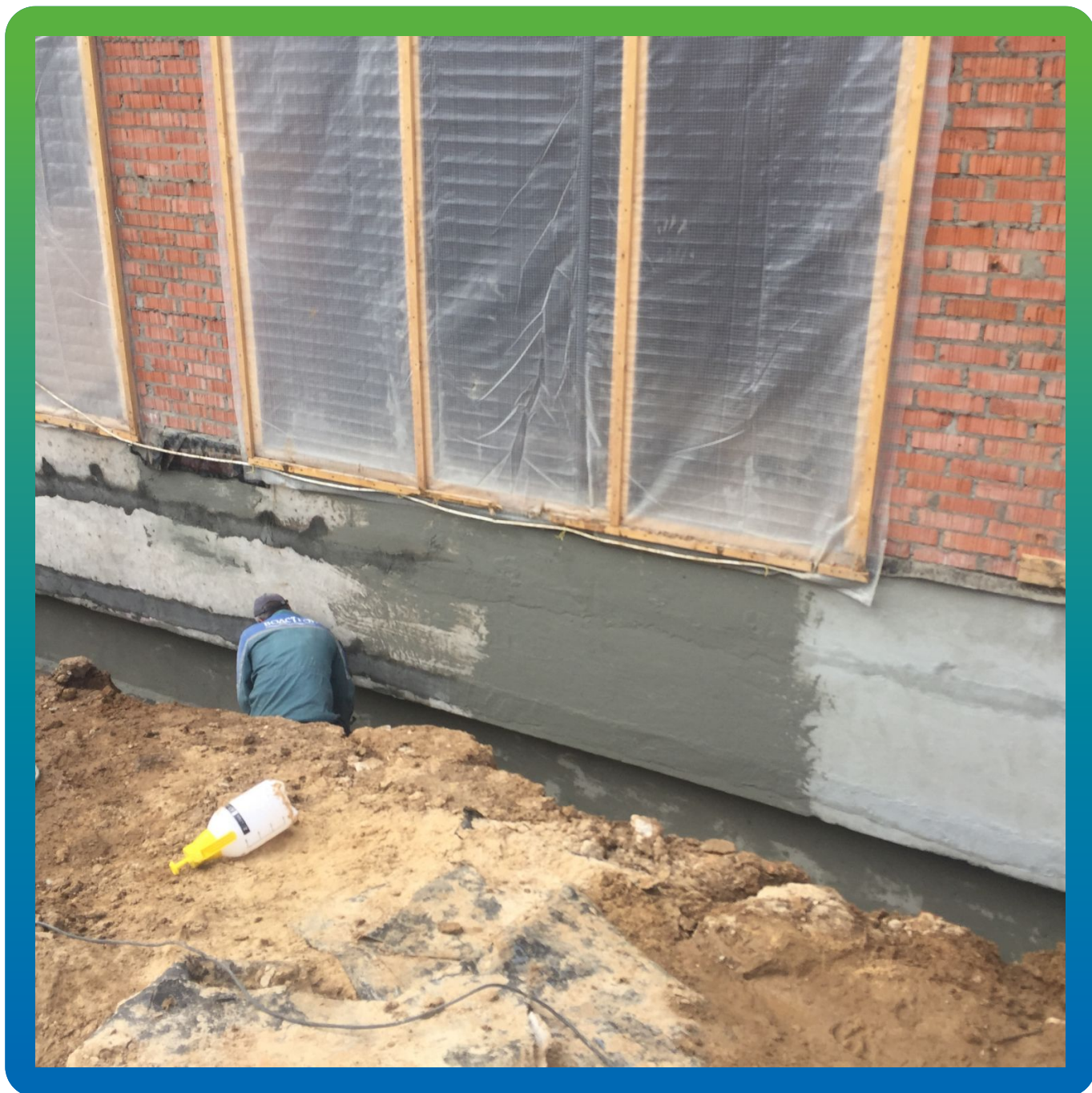
Нанесение Стармекс Сил Флекс на подземную часть здания