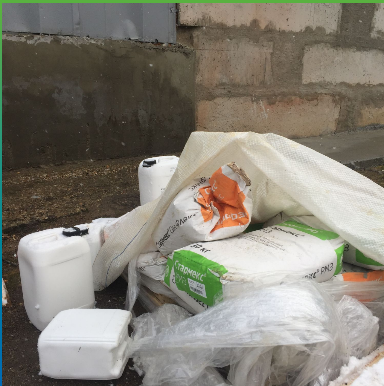
Материалы Стармекс Сил флекс и Стармекс РМЗ на объекте