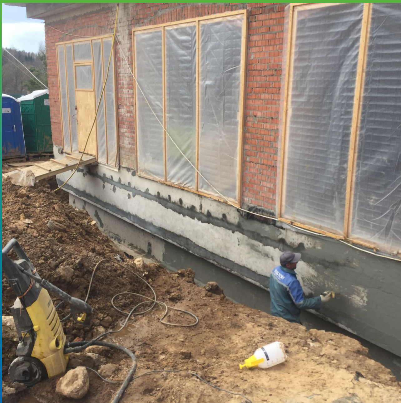
Гидроизоляция Стармекс Сил Флекс на подземную часть дома