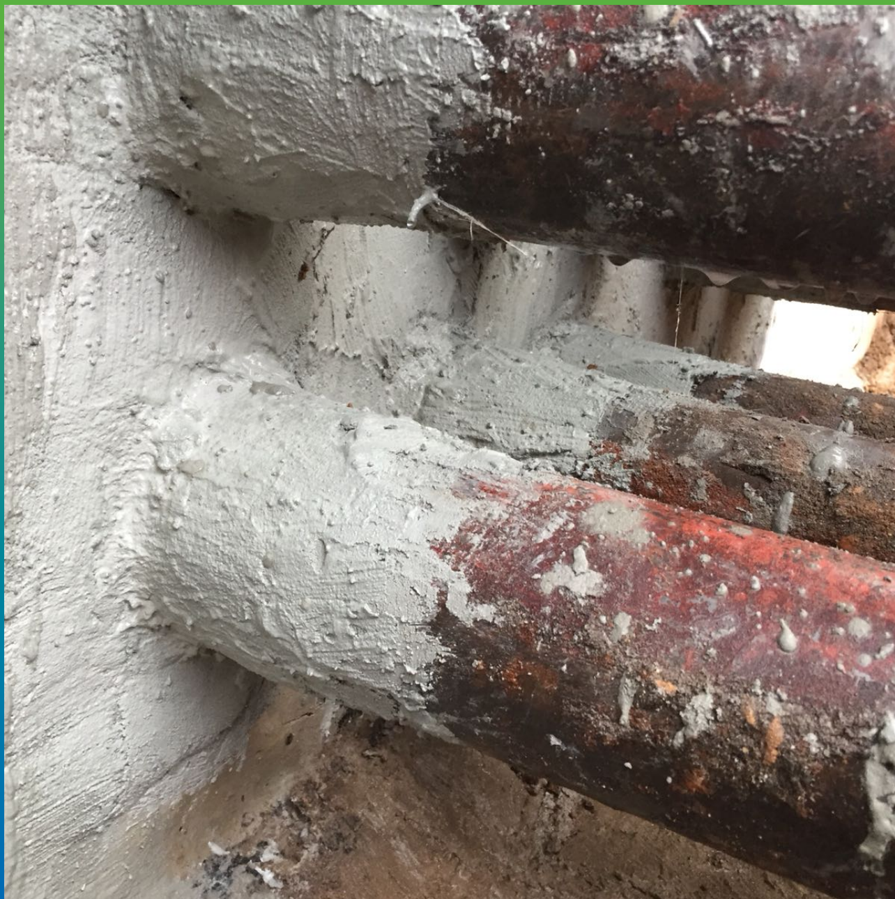
Гидроизоляция вводом коммуникаций