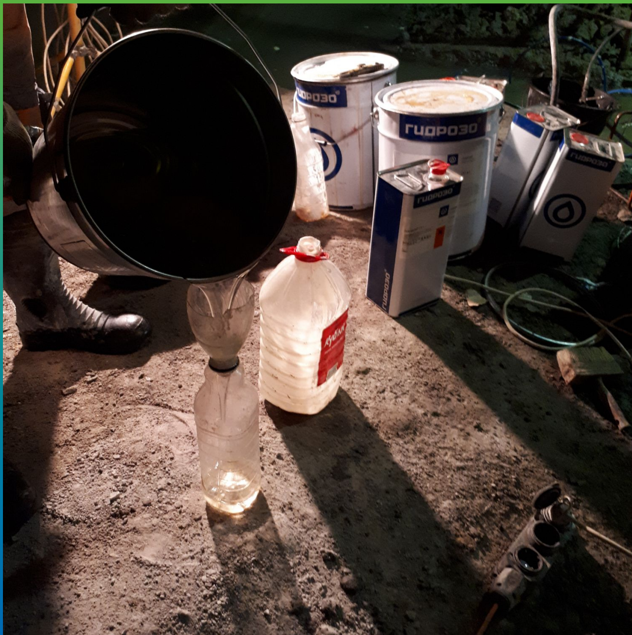
Подготовка инъекционного материала к работе