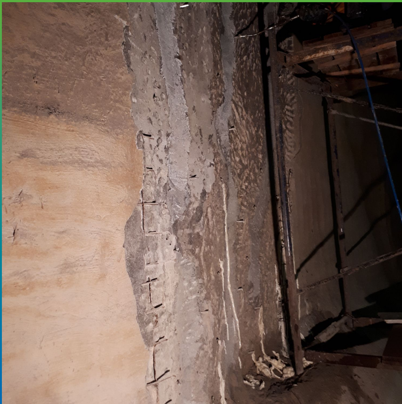
Прокачка вертикального шва составом Манопур 15