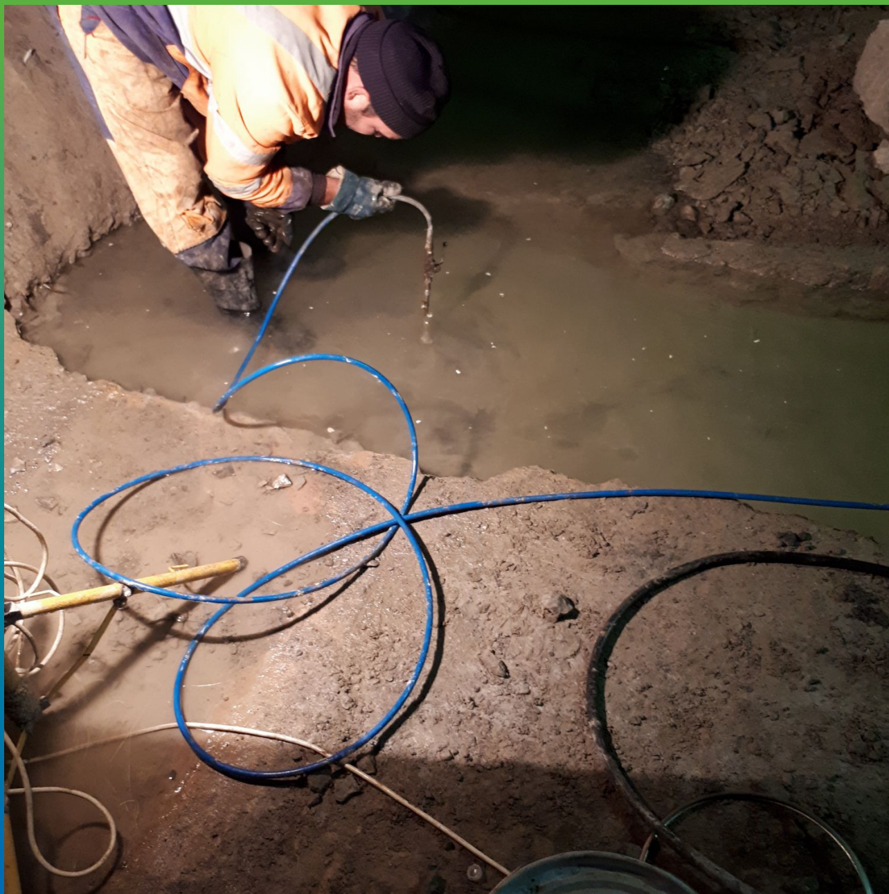
Прокачка деф. шва гидроактивным полиуретаном Манопур 15