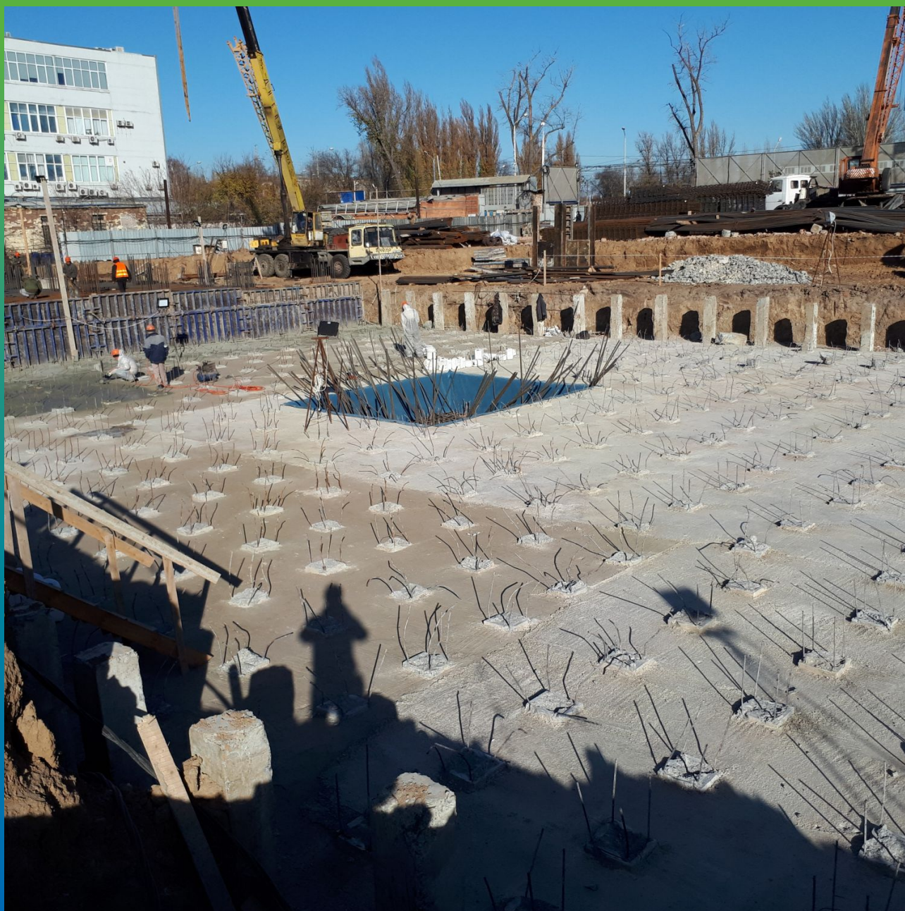
В процессе гидроизоляции основания