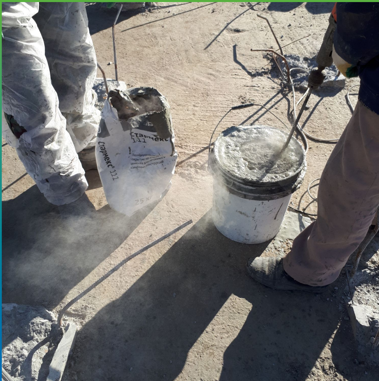
Затворение Стармикс 111 с Манокрил Сетмикс