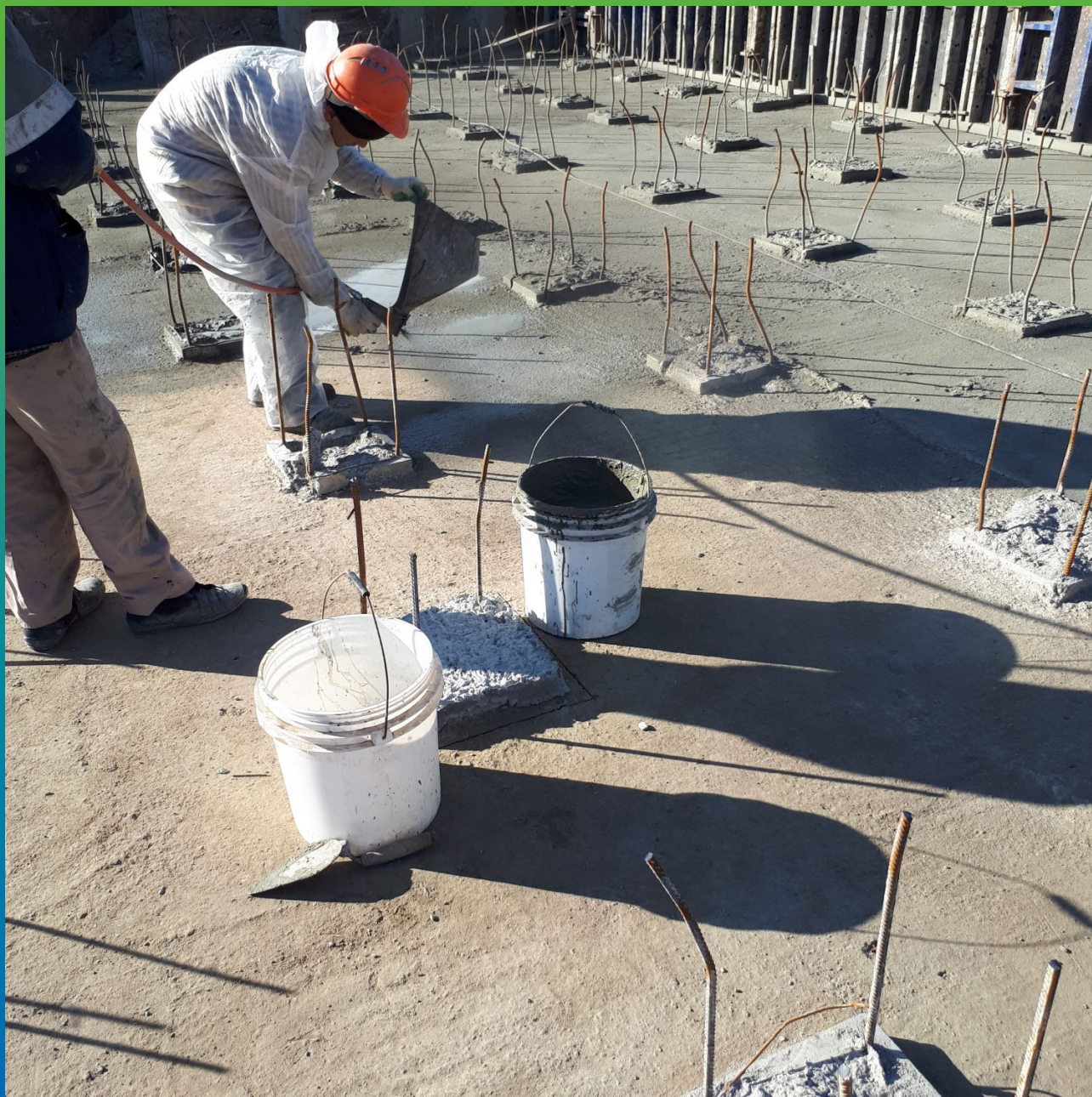
Нанесение гидроизоляции методом набрызга