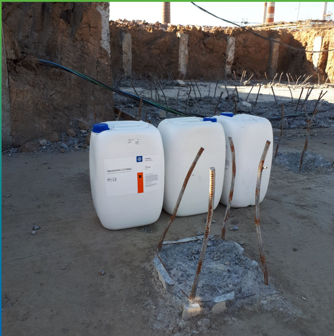
Манокрил Сетмикс на объекте