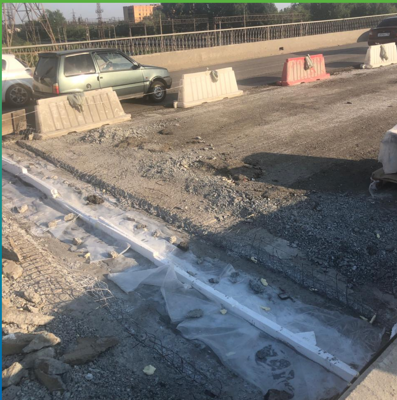
Вид укрытого подливочного состава Стармекс ФМ7