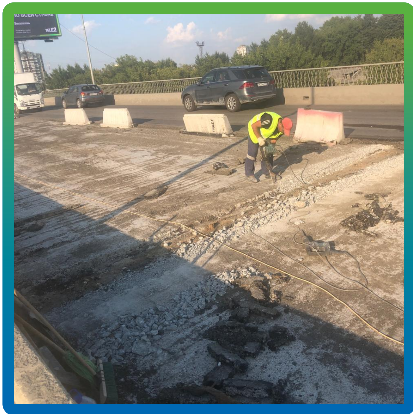
Вскрытие зоны деформационного шва