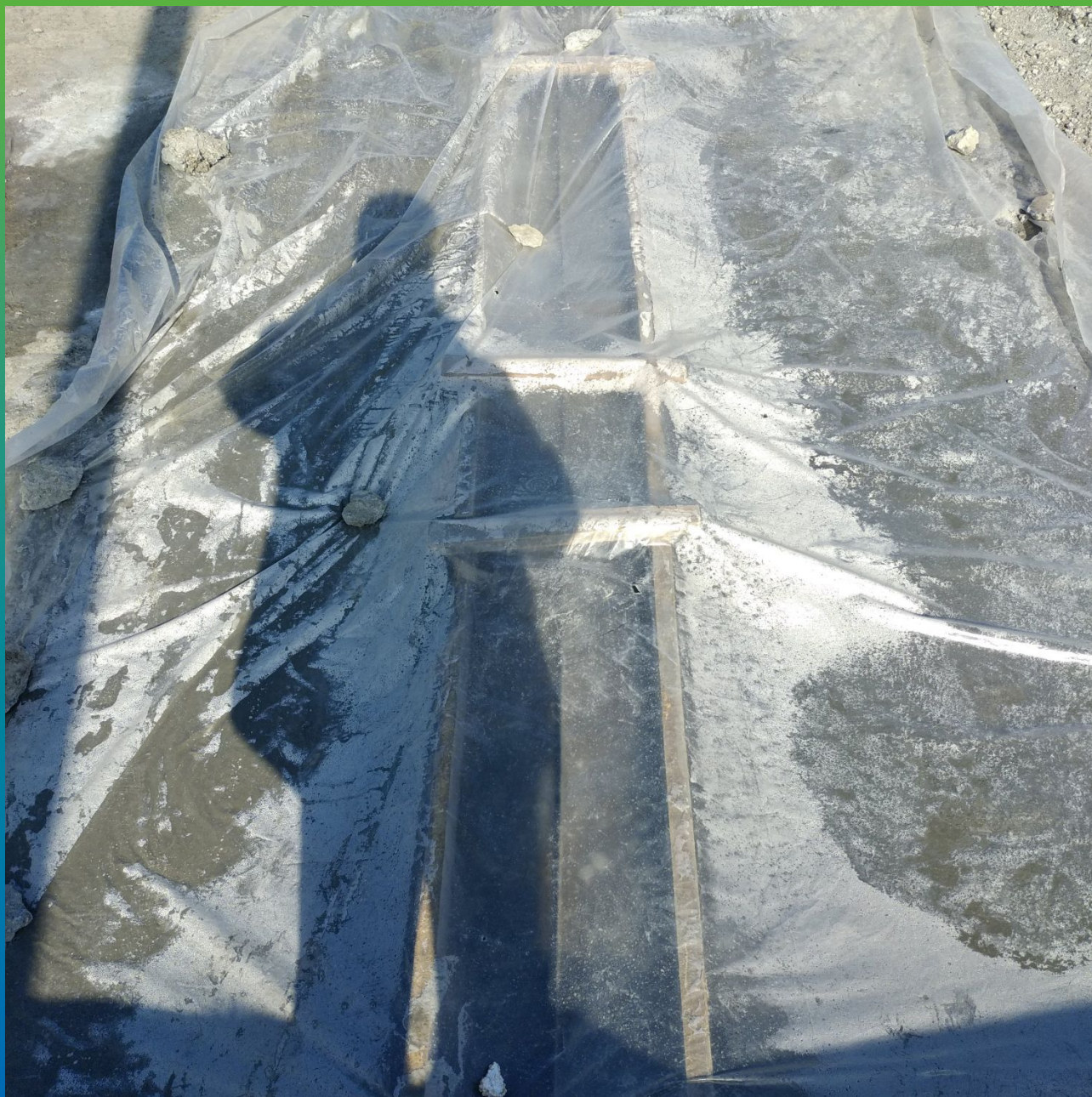
Вид укрытого подливочного состава Стармекс ФМ7