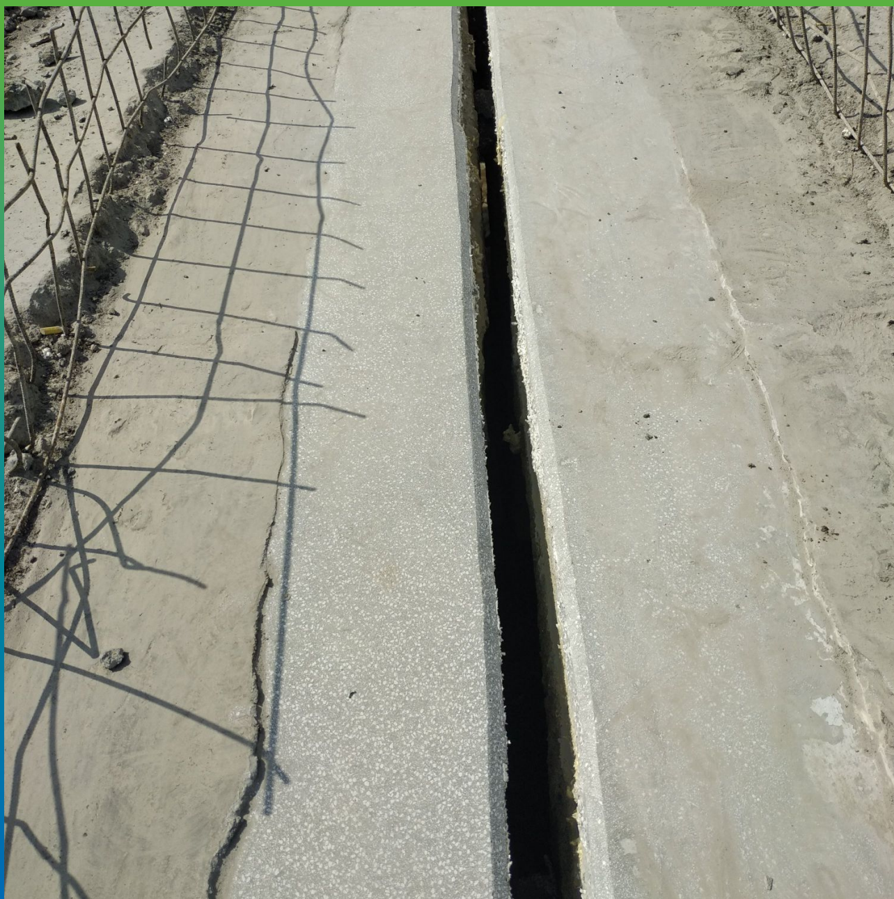
Вид восстановленного и подготовленного деформационного шва