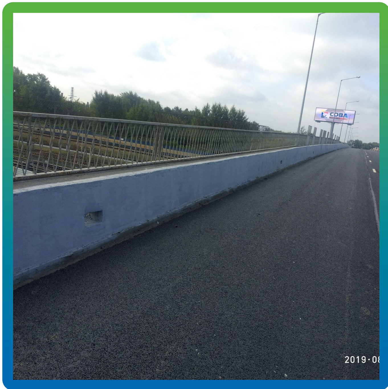
Финальный вид моста