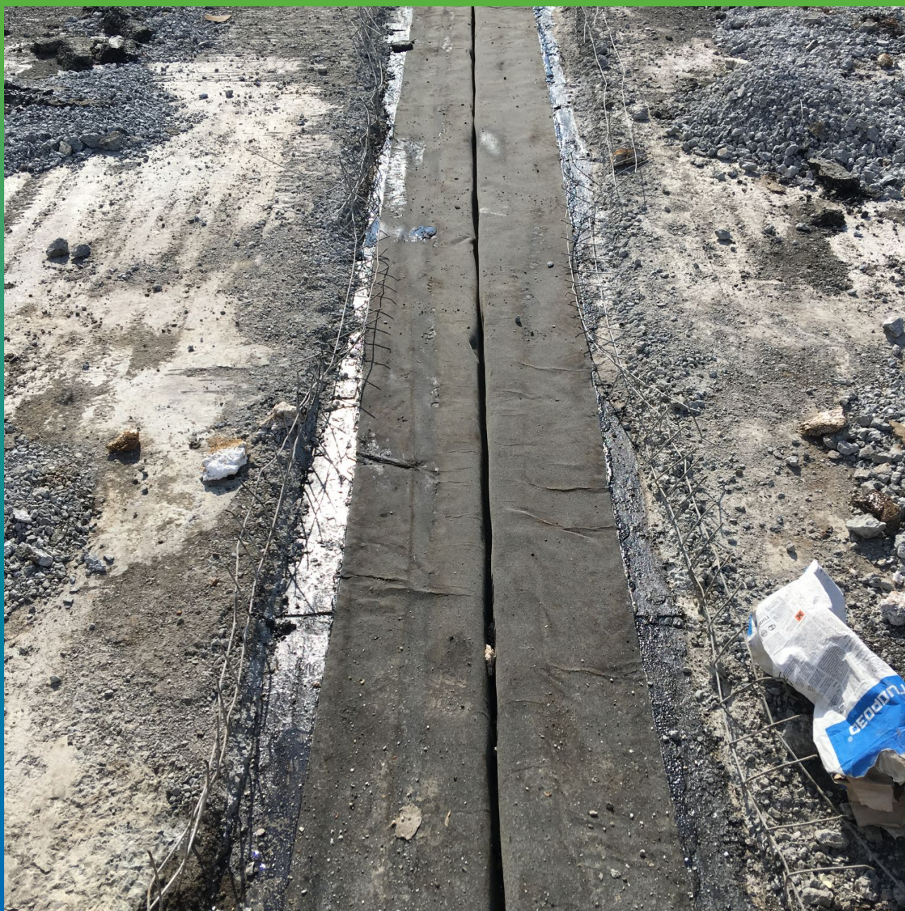
Устройство гидроизоляции деформационного шва