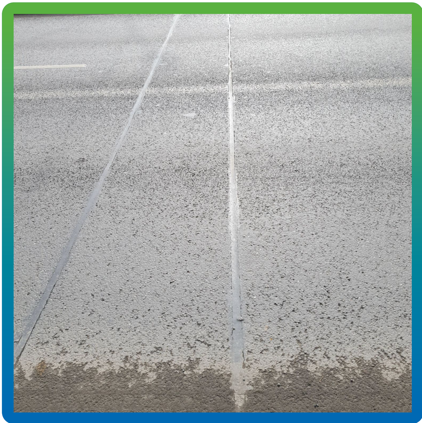
Финальный вид деформационного шва