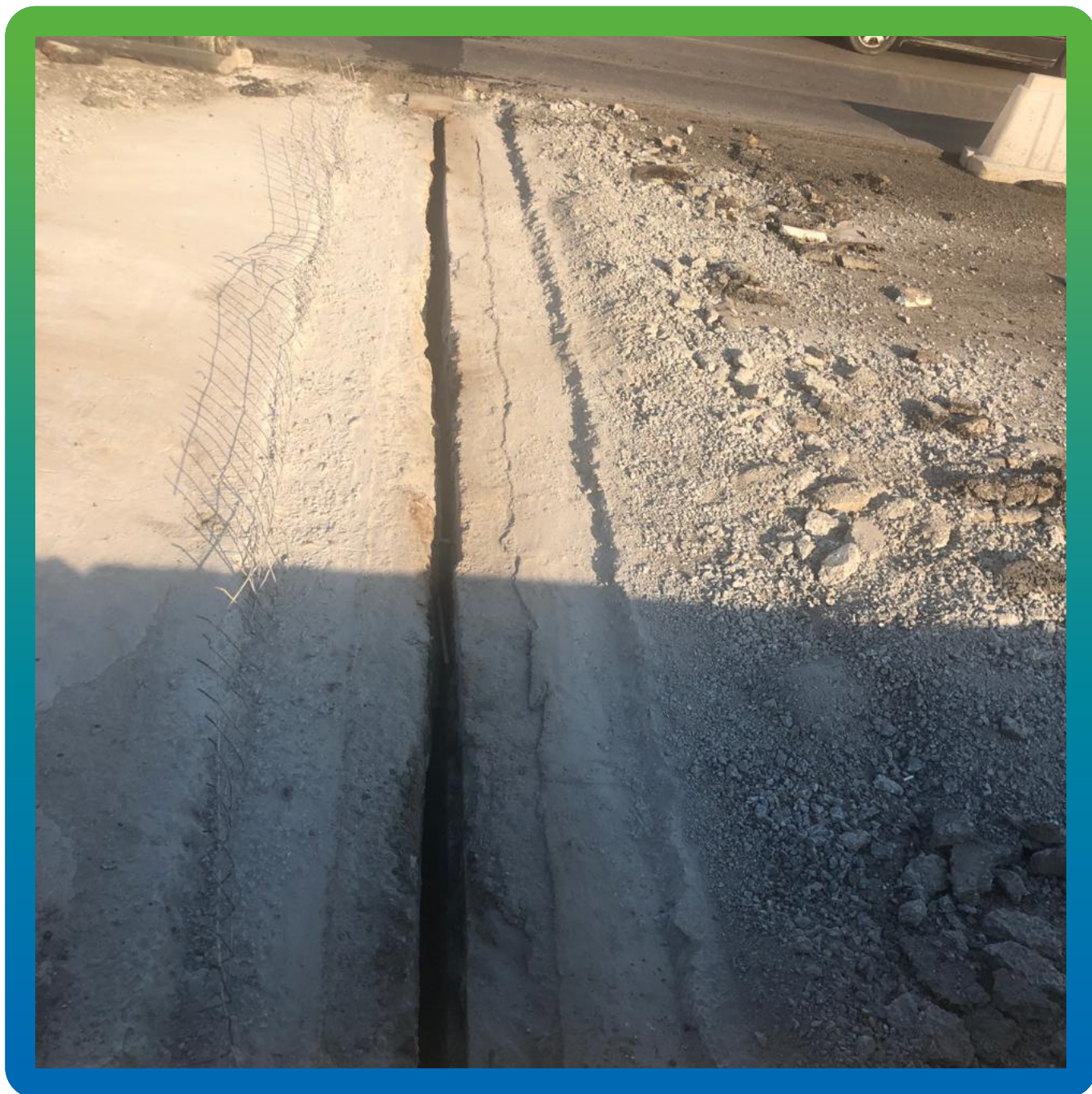
Вид вскрытого деформационного шва