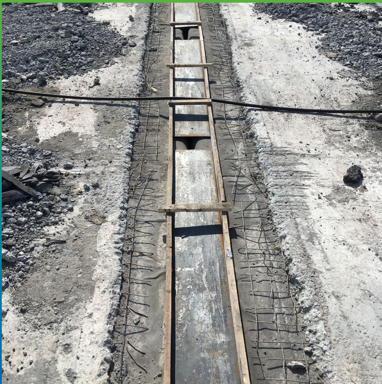
Установка опалубки для восстановления защитного слоя