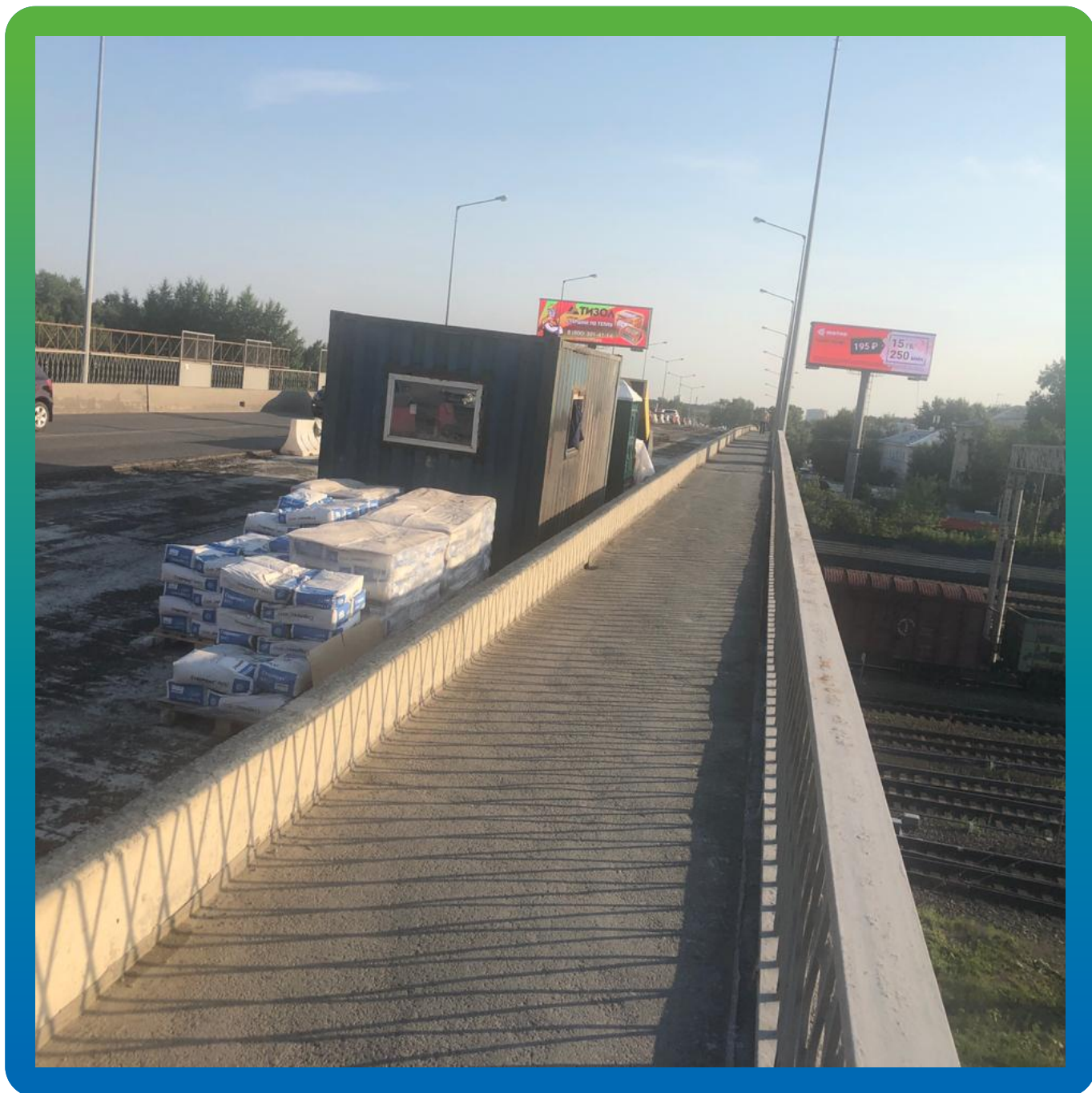
Вид материала на объекте