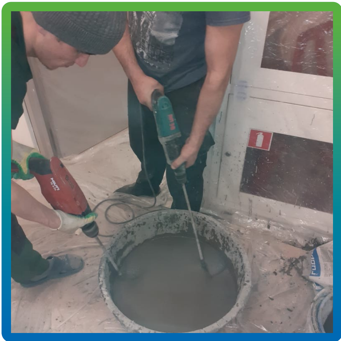
Замешивание материала Стармекс ФМ7