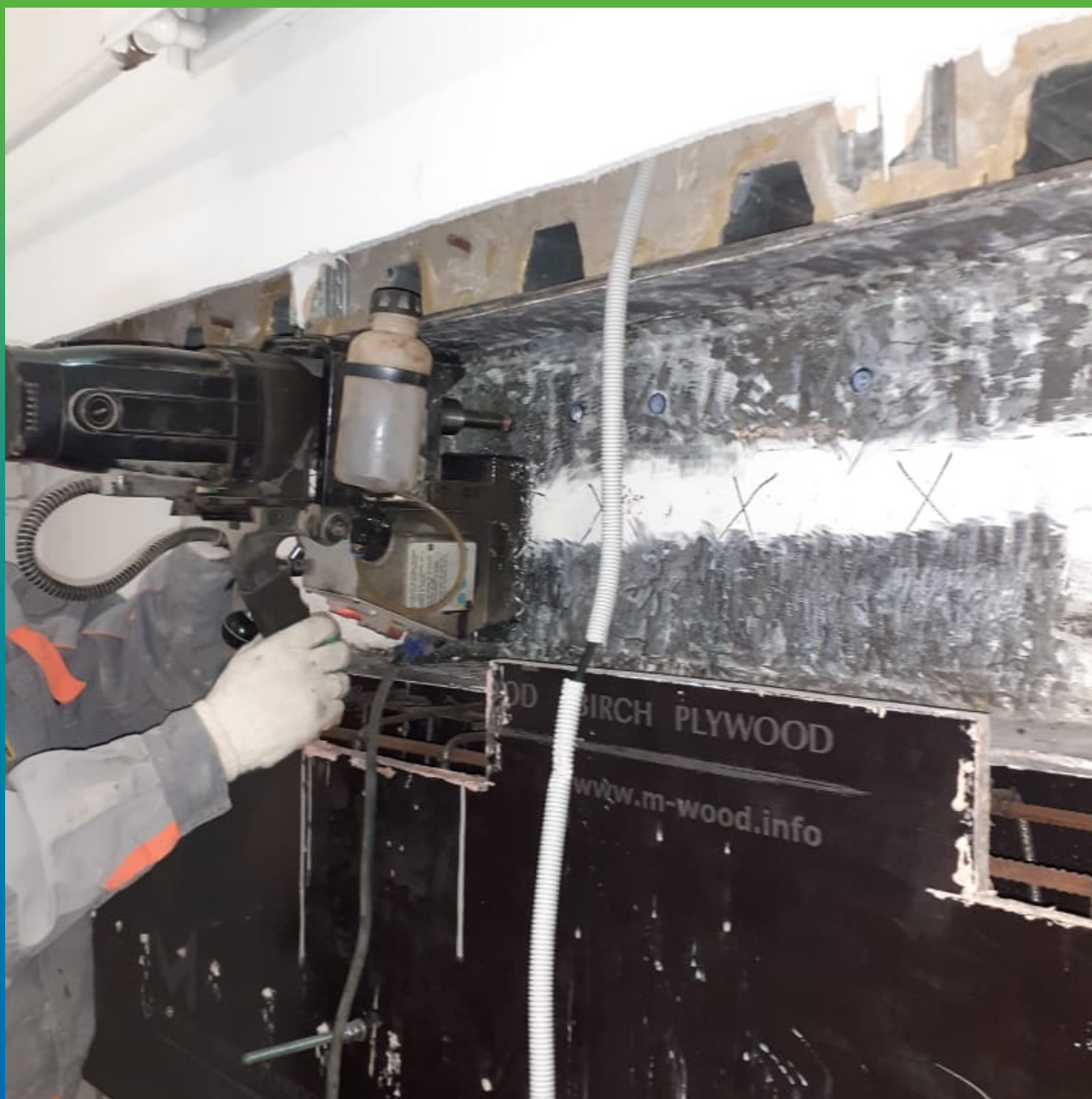
Подготовка опалубки перед заливкой материала