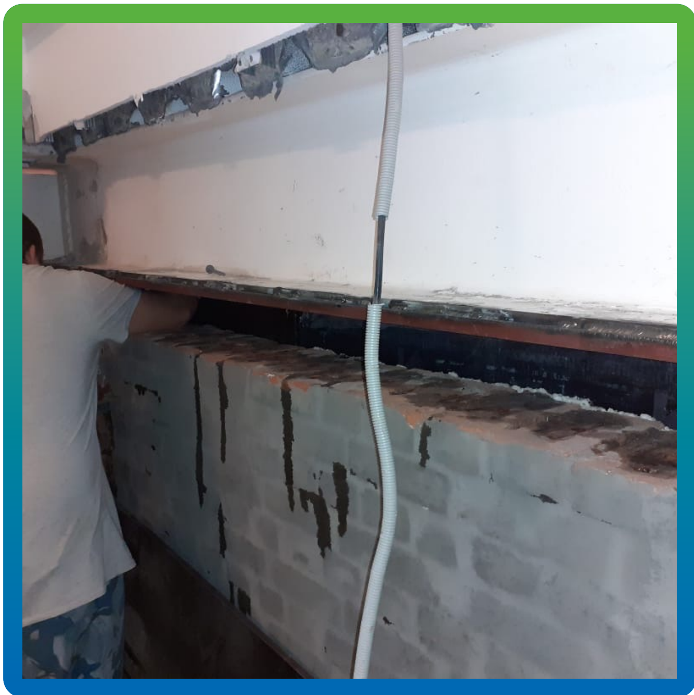
Заливка материала в подготовленную нишу