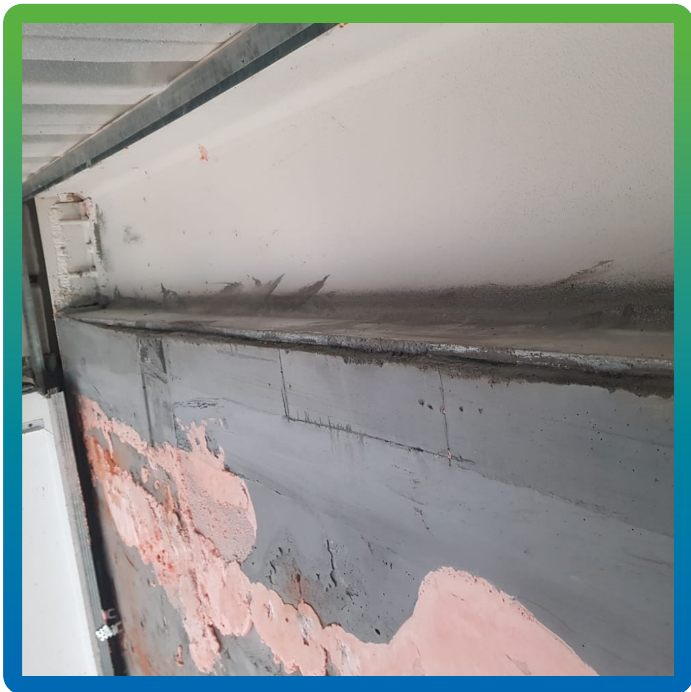
Финишный вид отлитой стены