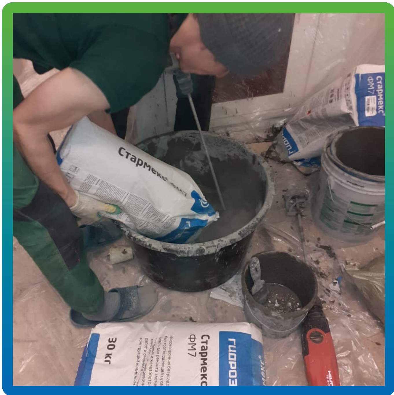
Замешивание материала Стармекс ФМ7