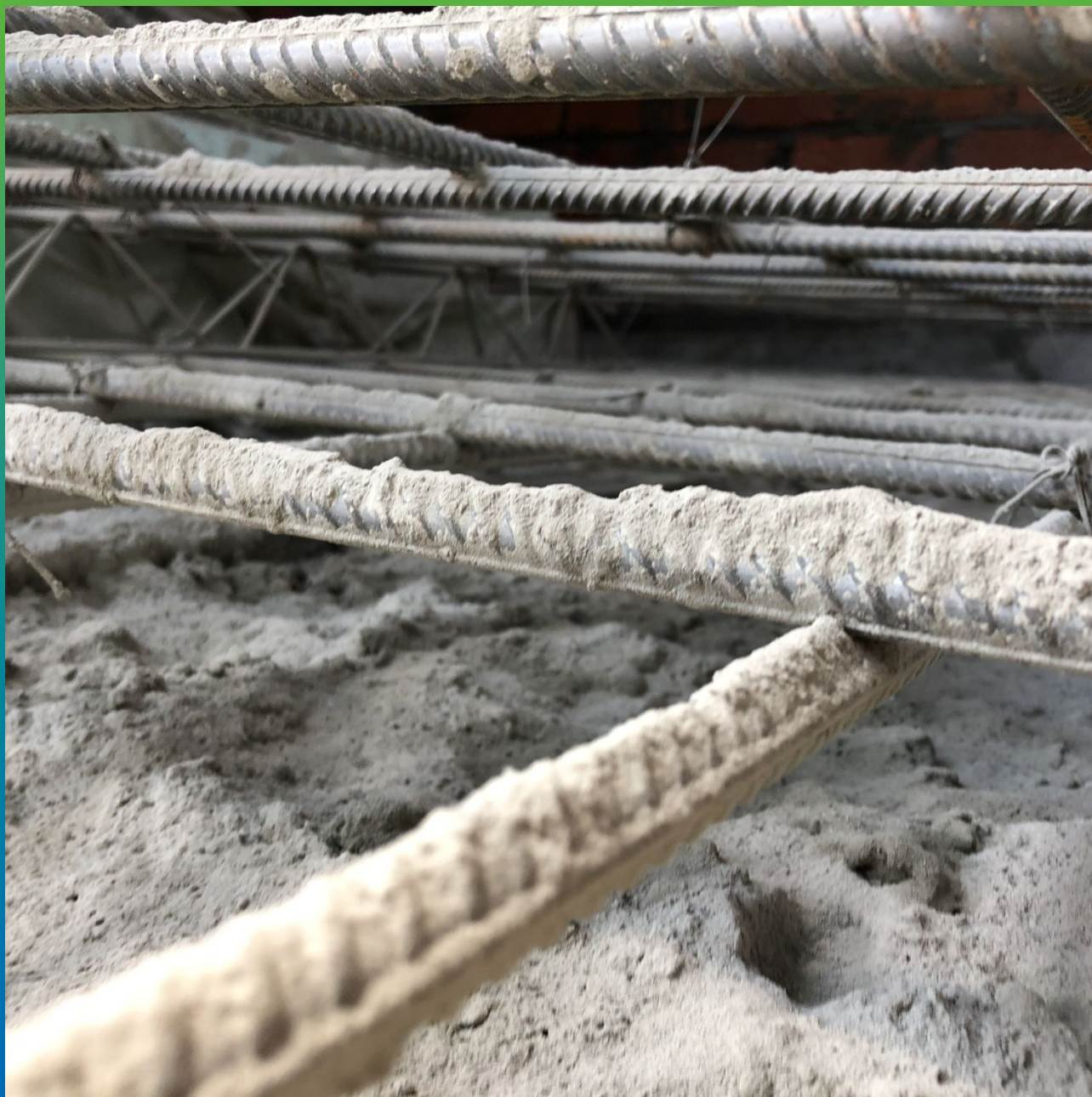
Просыпка состава Стармекс Сил на увлажненное основание