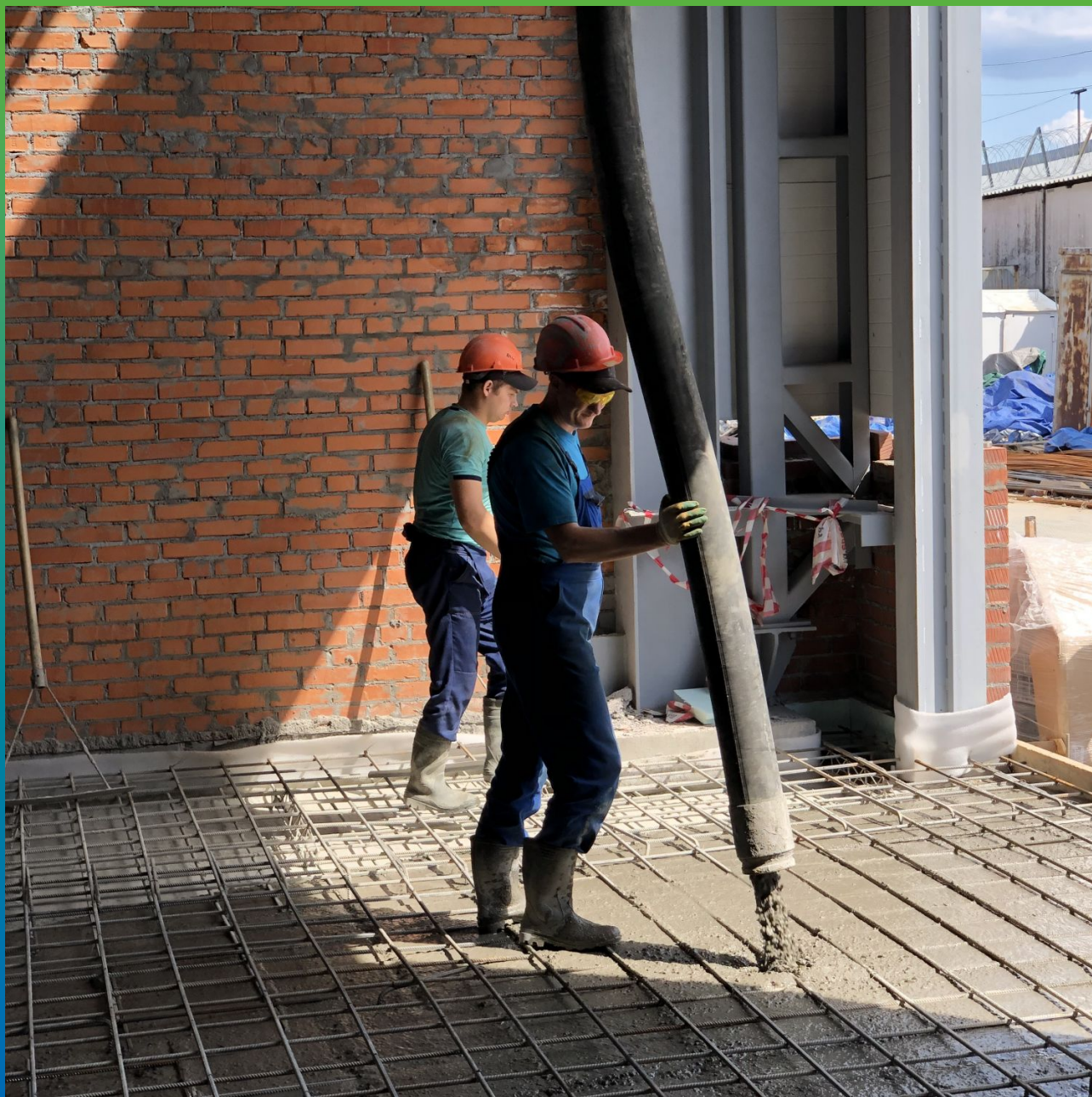
Заливка и укладка бетона