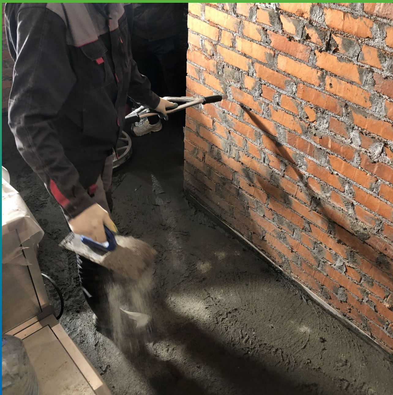
Распределение топпинга Стармекс Топ КР ручным способом в стесненных условиях