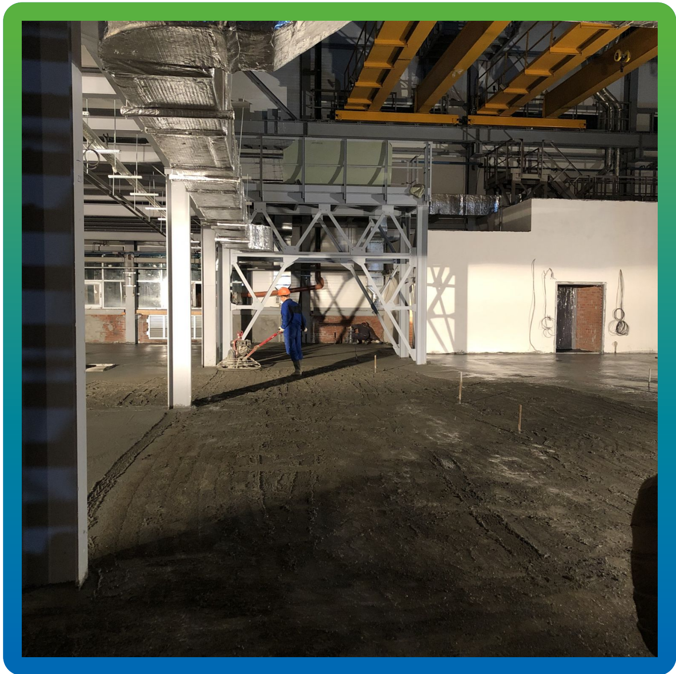
Затирка топпинга специальными машинами (вертолётными)