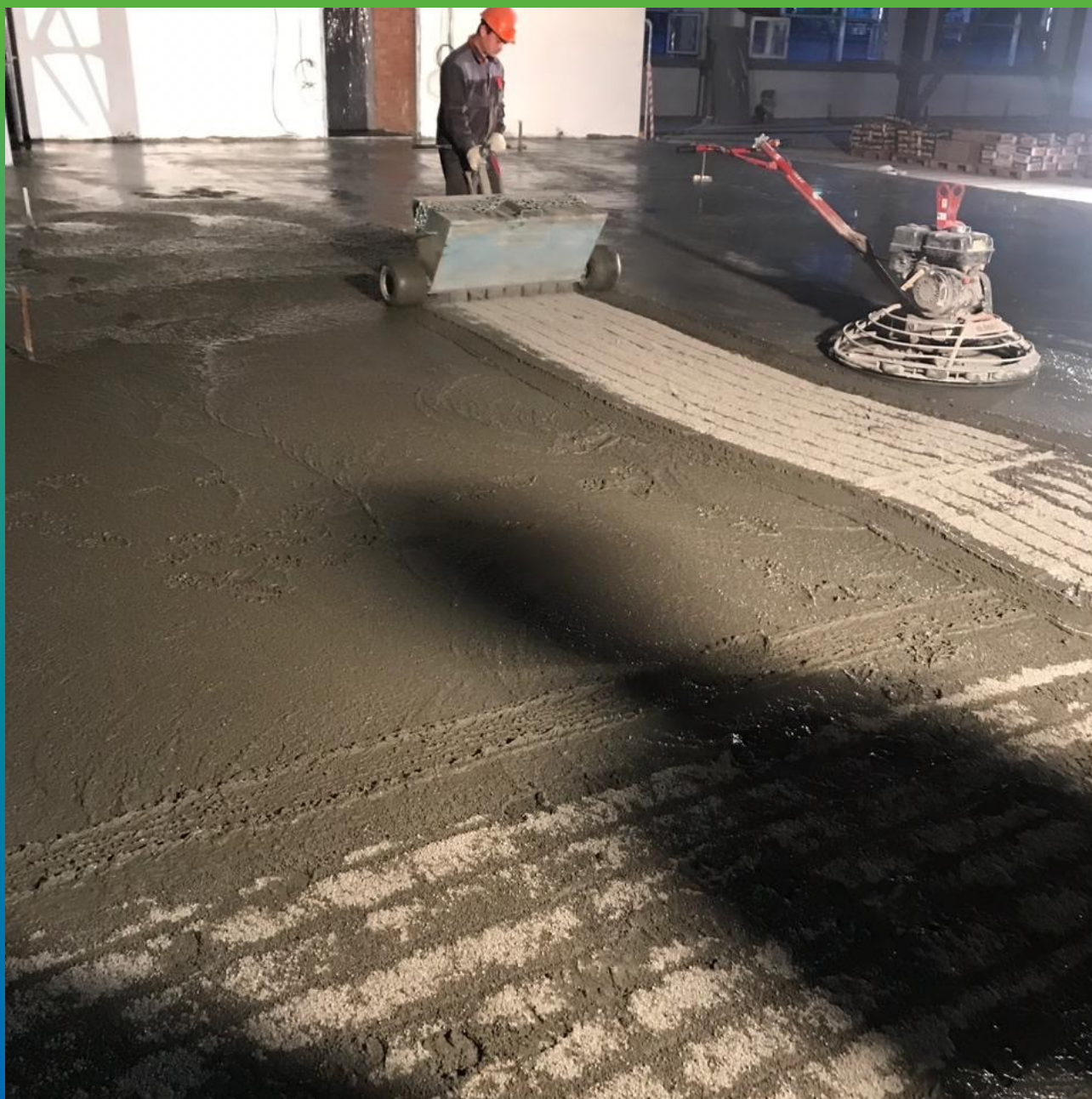
Распределение топпинга Стармекс Топ КР скридбоксами