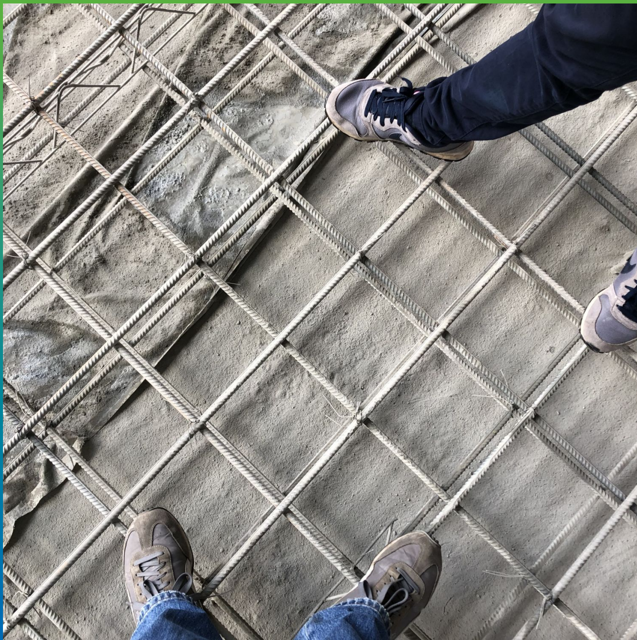
Просыпка состава Стармекс Сил на увлажненное основание