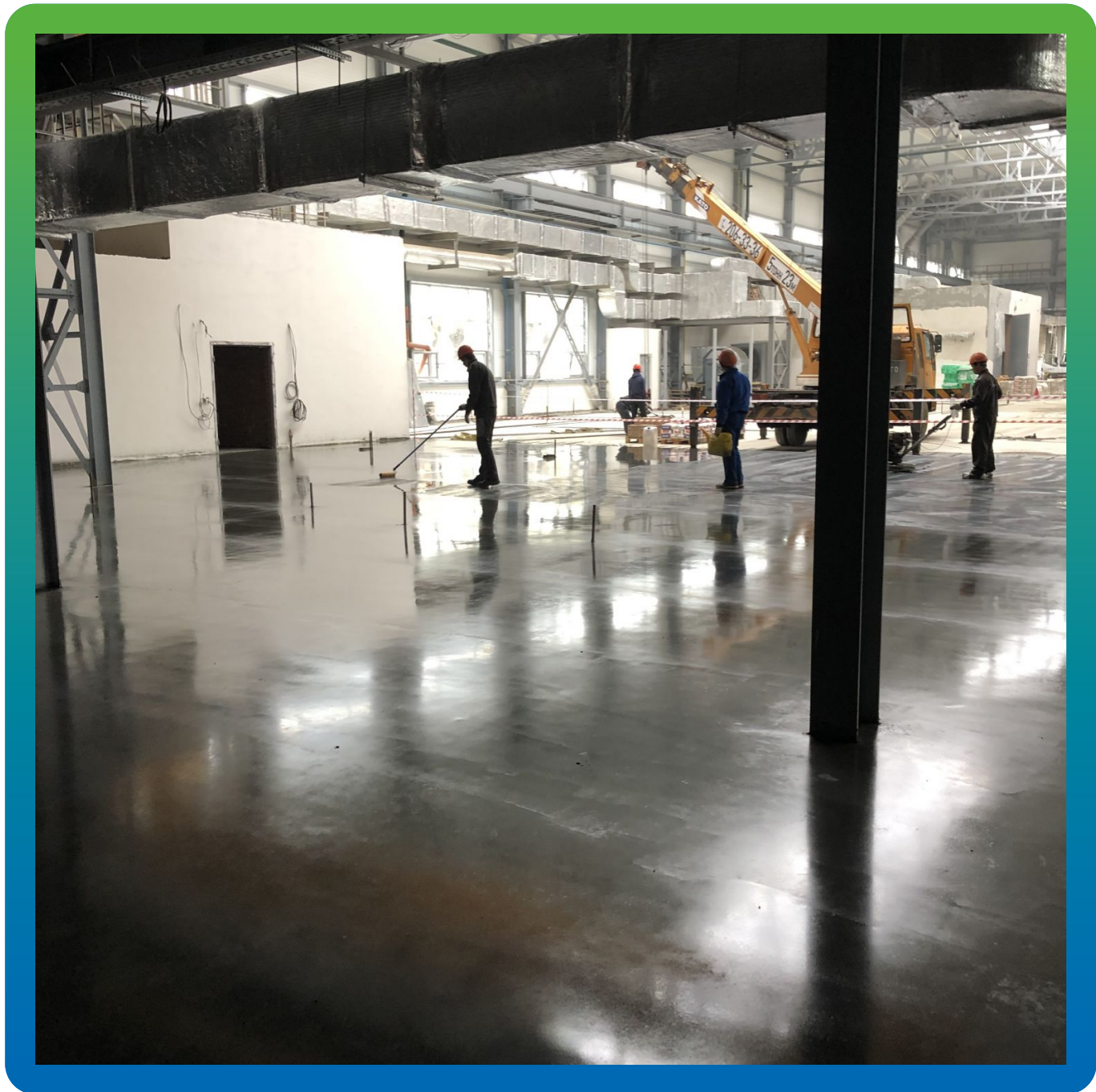
Нанесение средства для ухода за топпингами - кюринга Маногард Топ 120