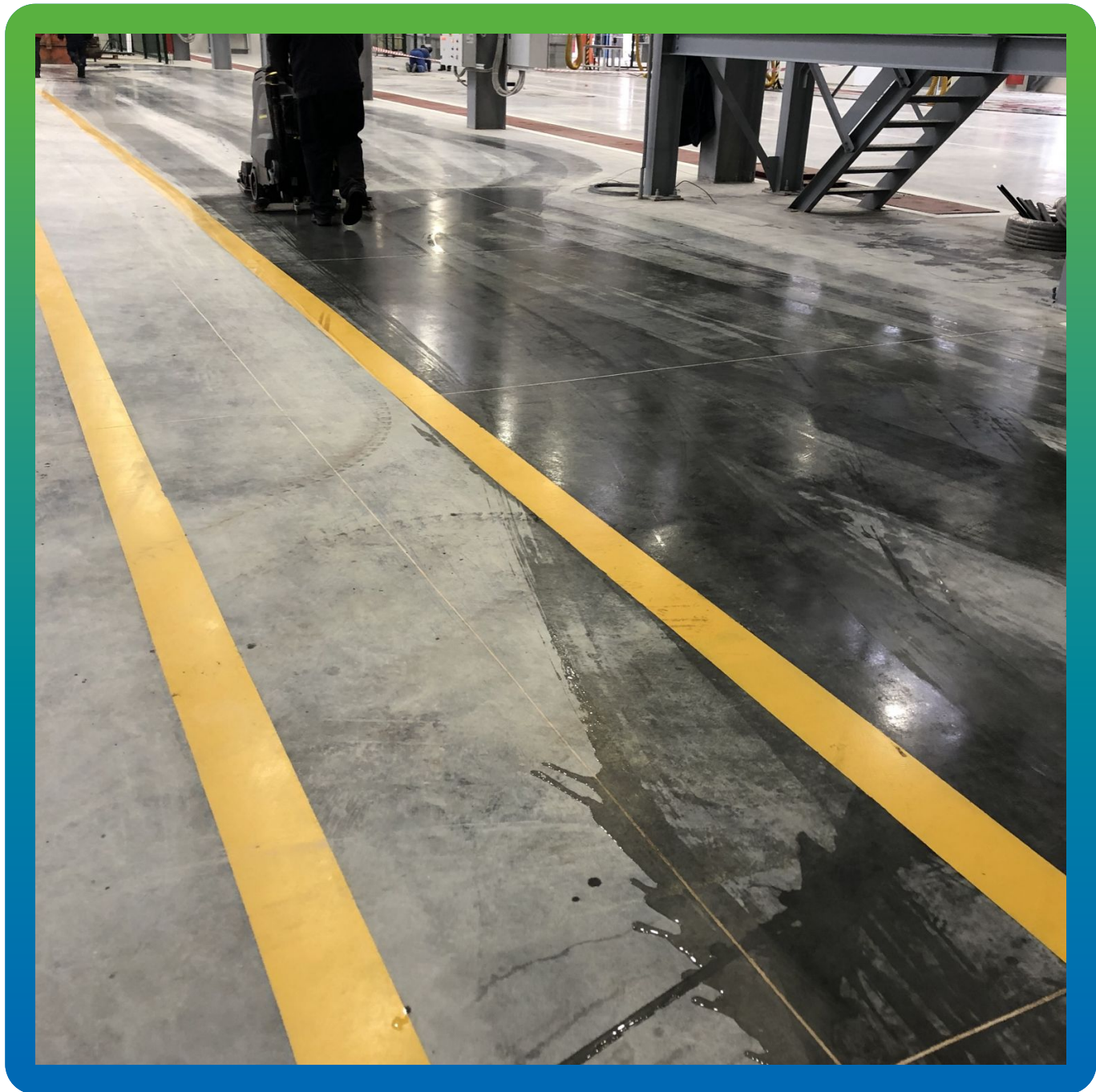
Отмытый и эксплуатируемый топпинг Стармекс Топ КР