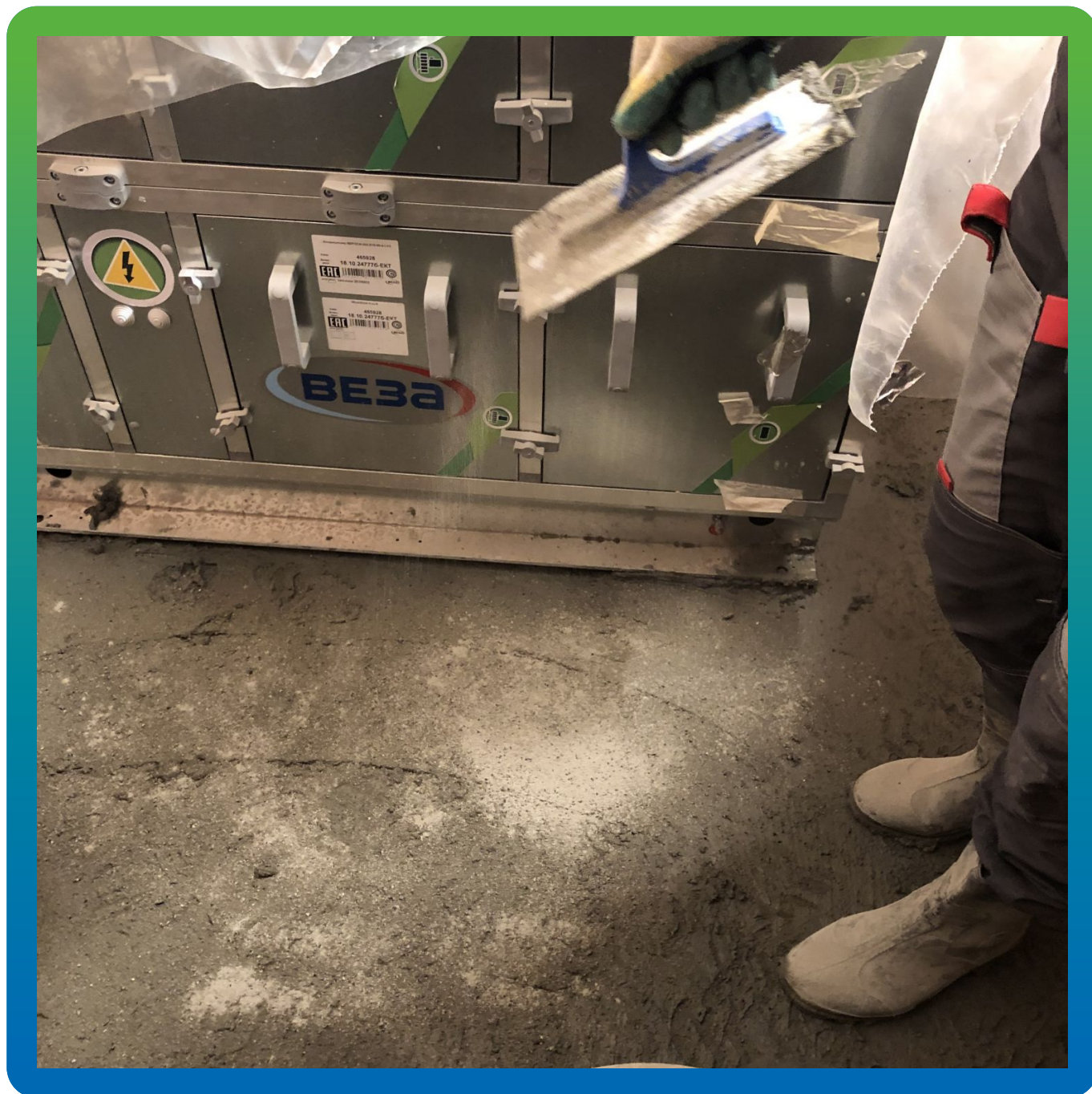
Распределение топпинга Стармекс Топ КР ручным способом в стесненных условиях