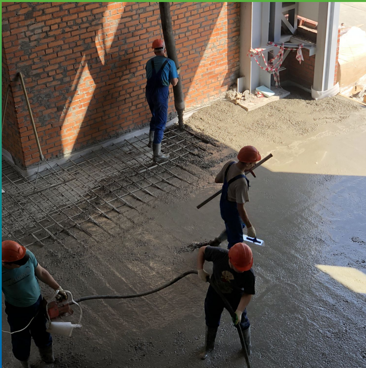
Заливка и укладка бетона