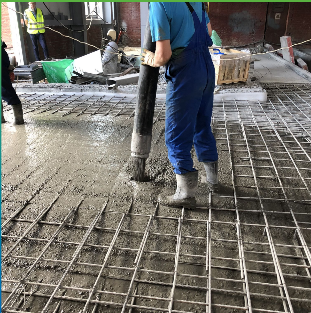
Заливка и укладка бетона