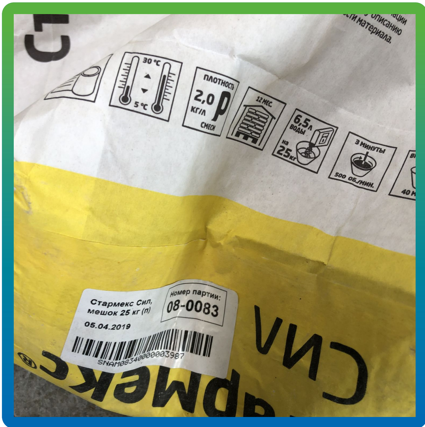
Материалы на объекте