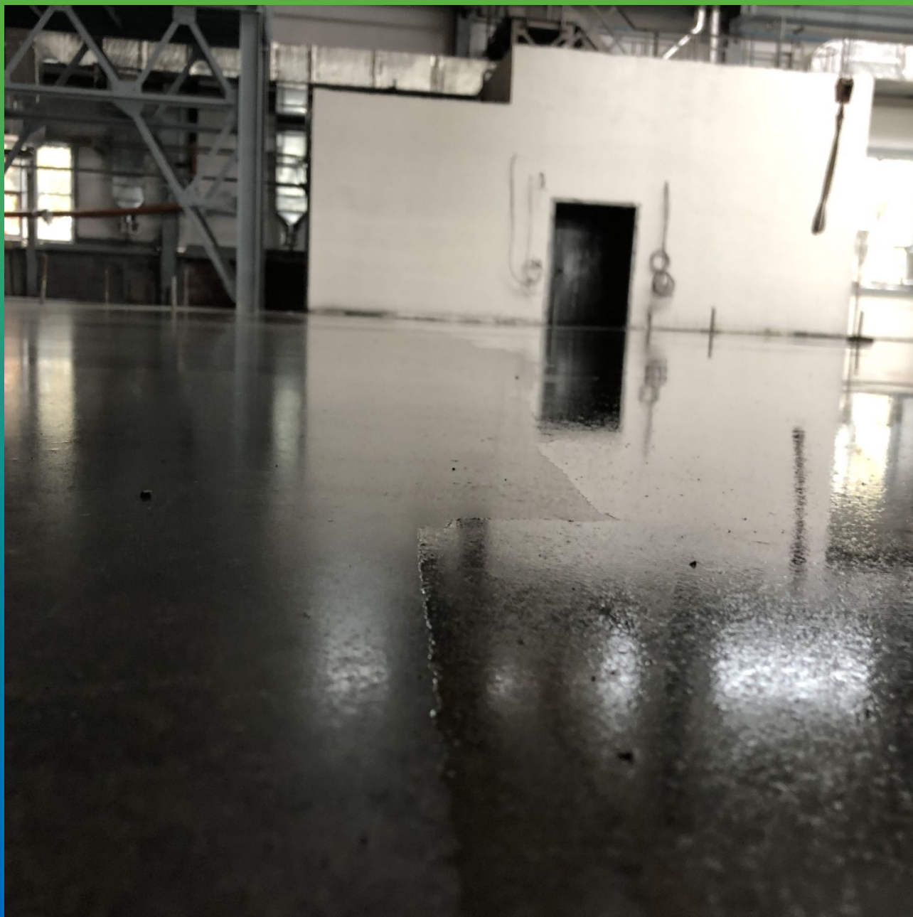
Высыхающий кюринг матовеет