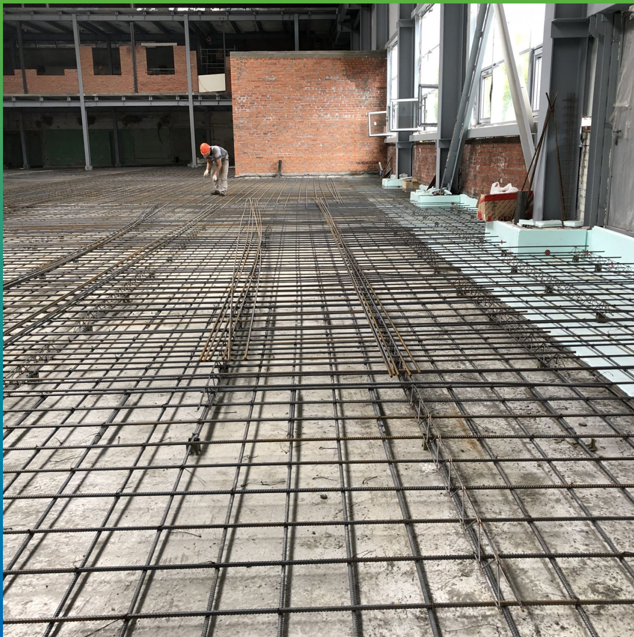
Укладка и вязка арматуры