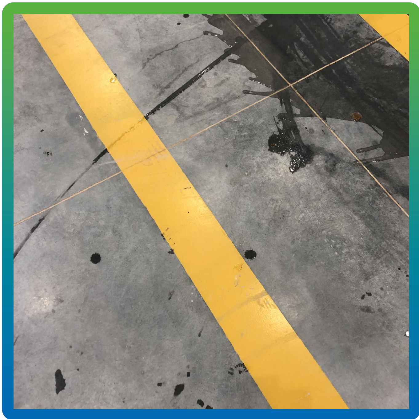
Отмытый и эксплуатируемый топпинг Стармекс Топ КР