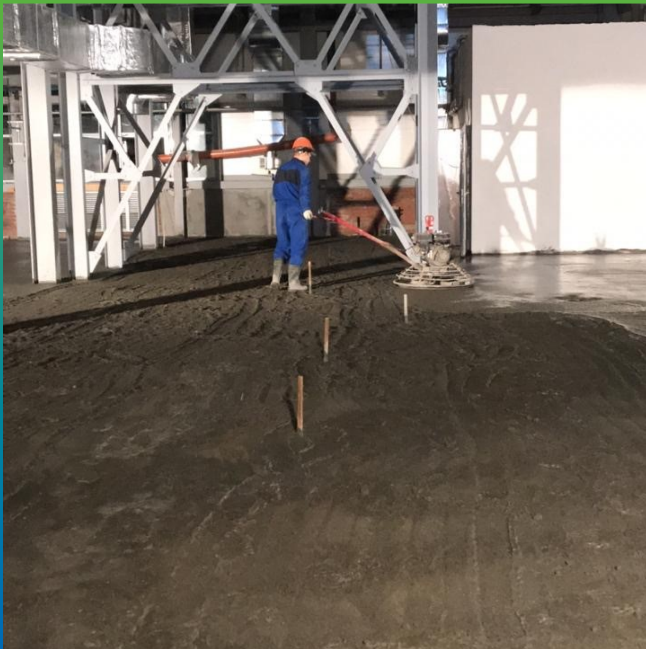
Затирка топпинга специальными машинами (вертолётками)