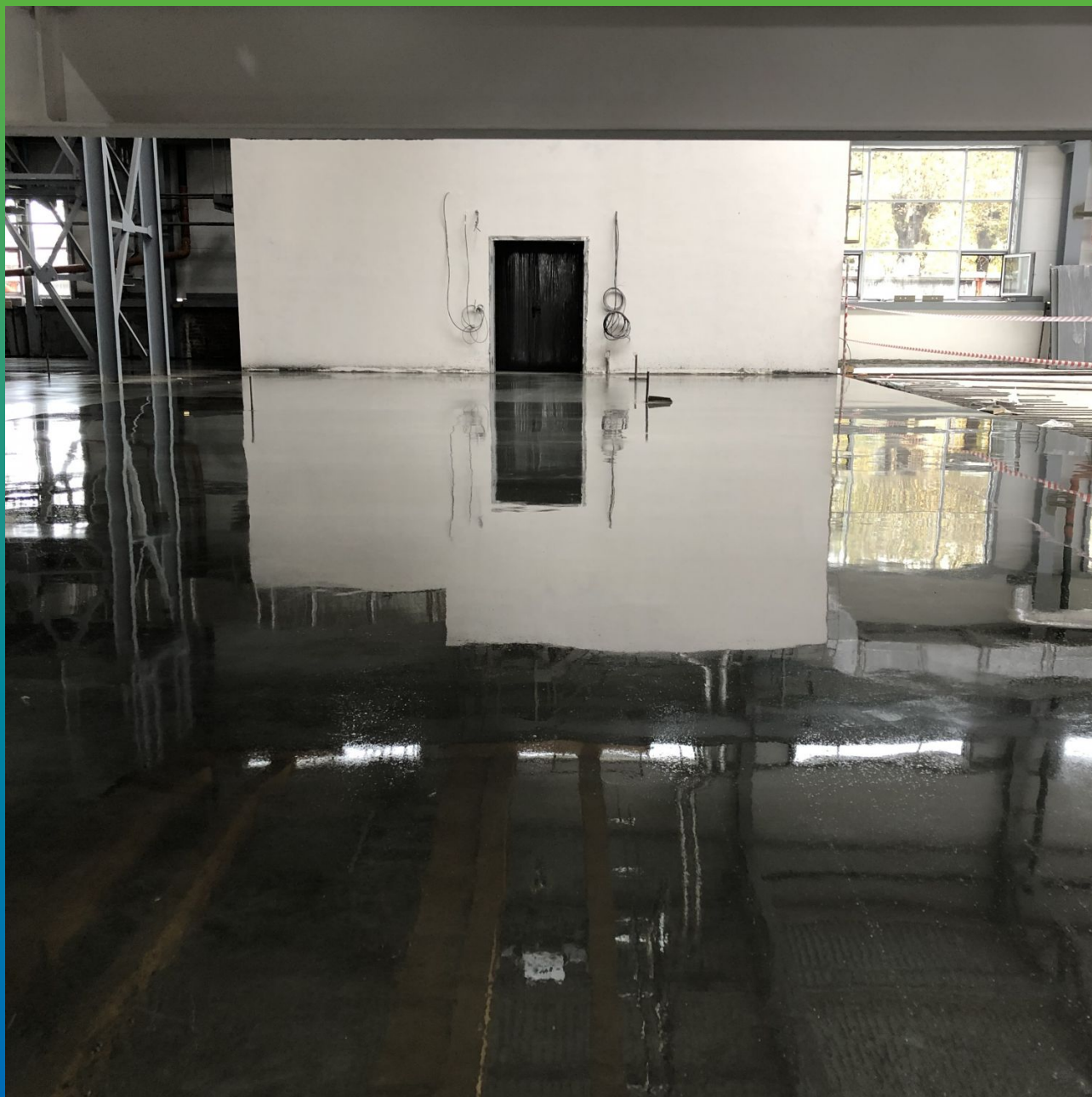
Нанесенный кюринг Маногард Топ 120