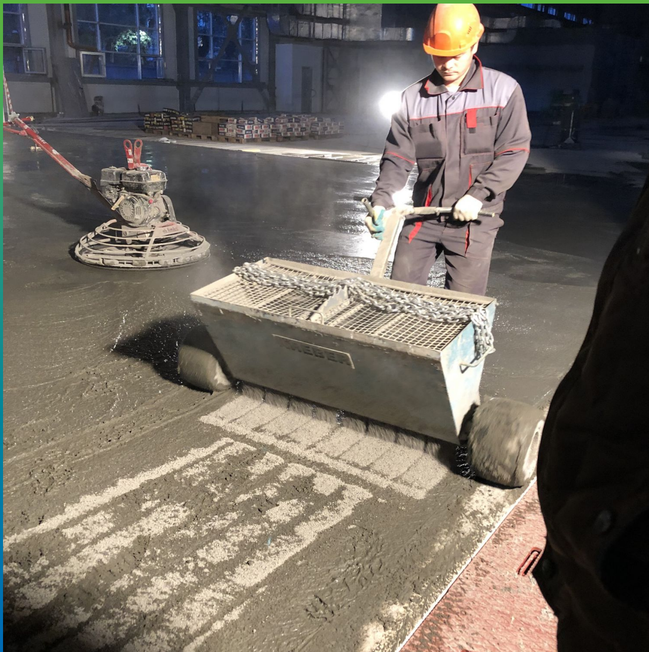
Распределение топпинга Стармекс Топ КР скриббоксами