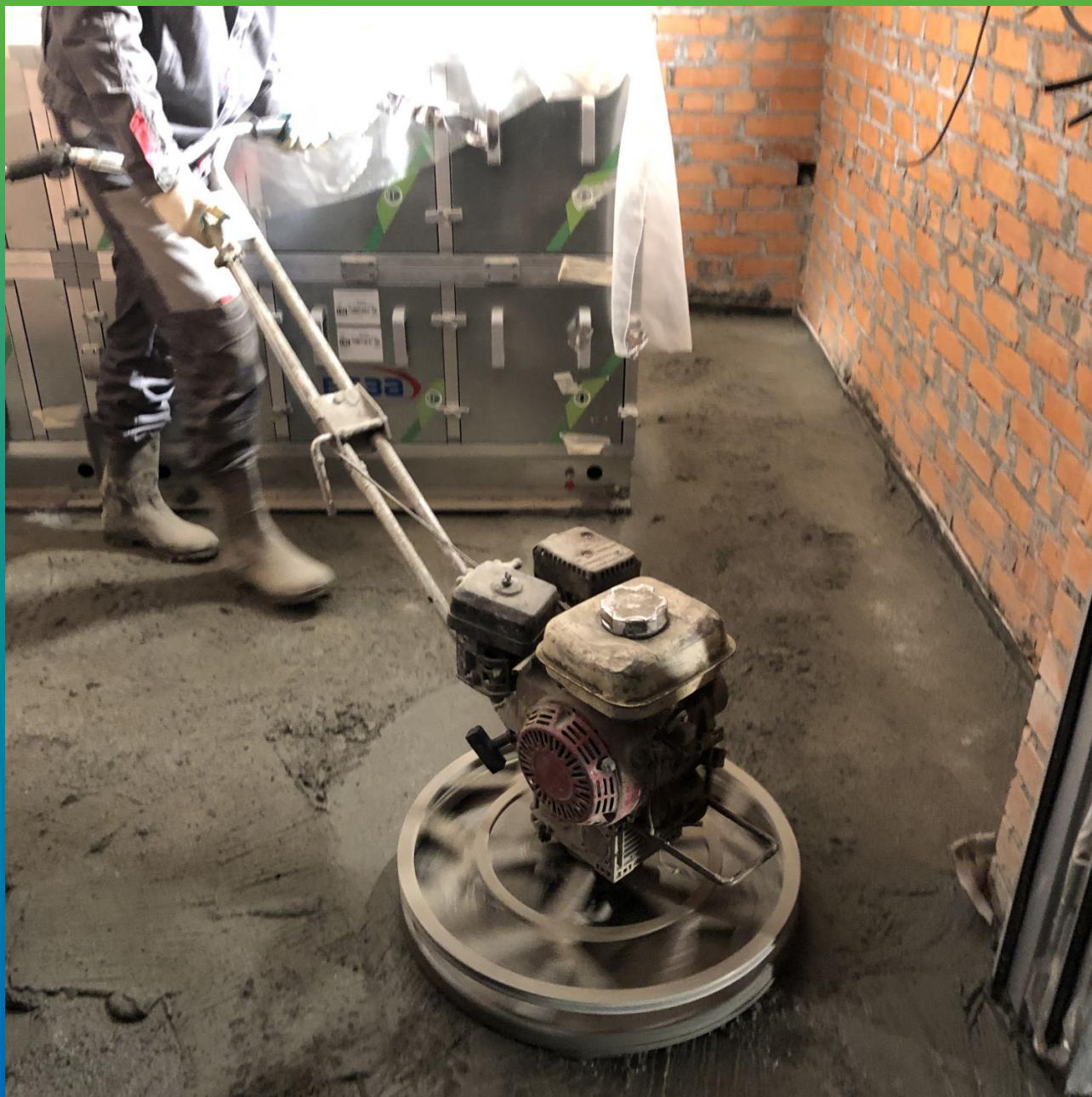
Затирка топпинга специальными машинами (вертолётными)