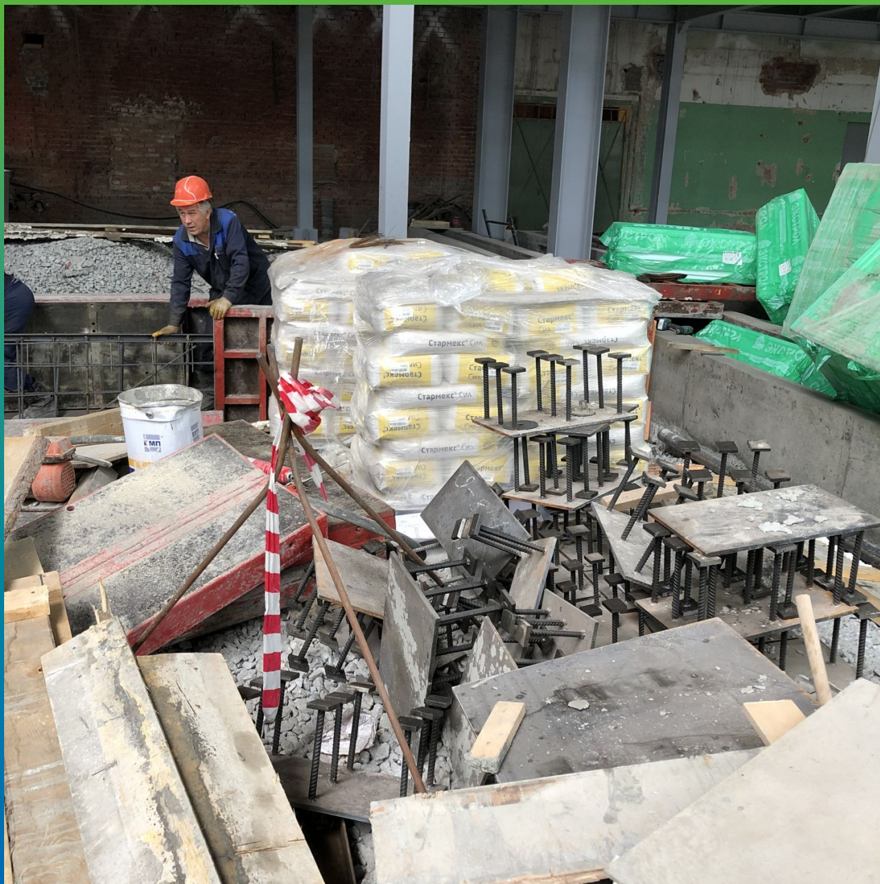
Материалы на объекте