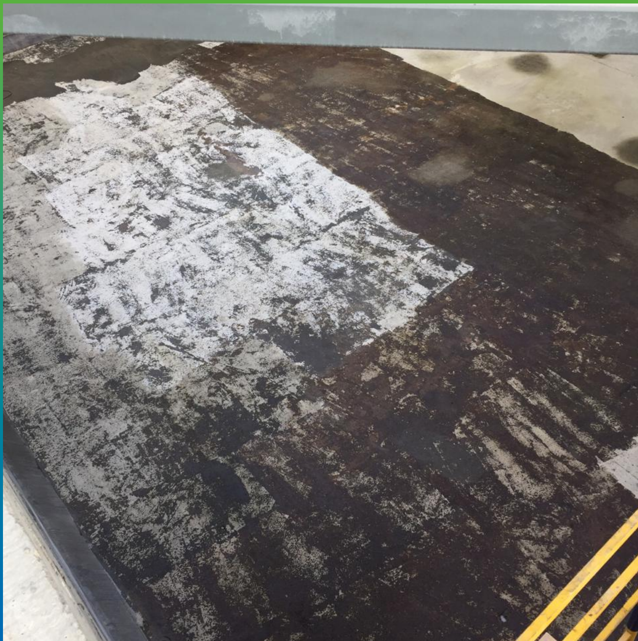
Финишный вид ёмкости, обработанной эпоксидной пропиткой ДенсТоп ЭП 100