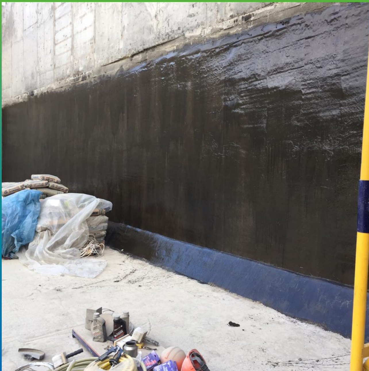
Поверхность стен резервуара, обработанной упрочняющей пропиткой.