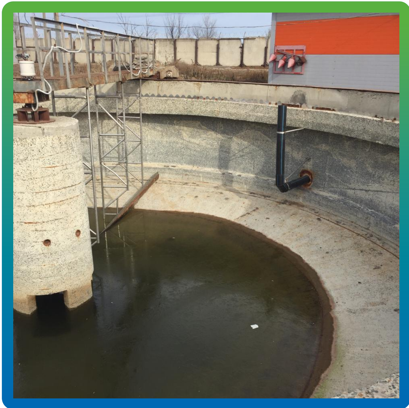
Общий вид отстойника перед выполнением ремонтных работ.