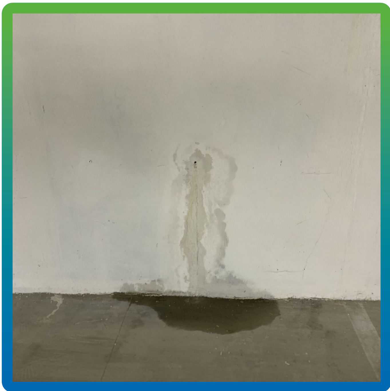
Участки с протечками