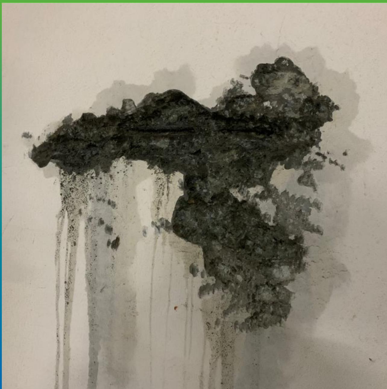
Подготовка дефектных участков к чеканке