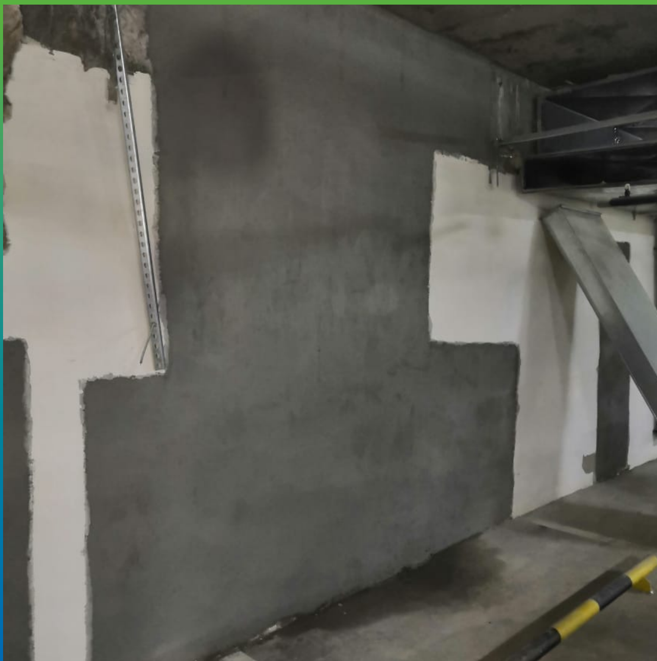
Стармекс Сил, нанесенный на дефектные участки