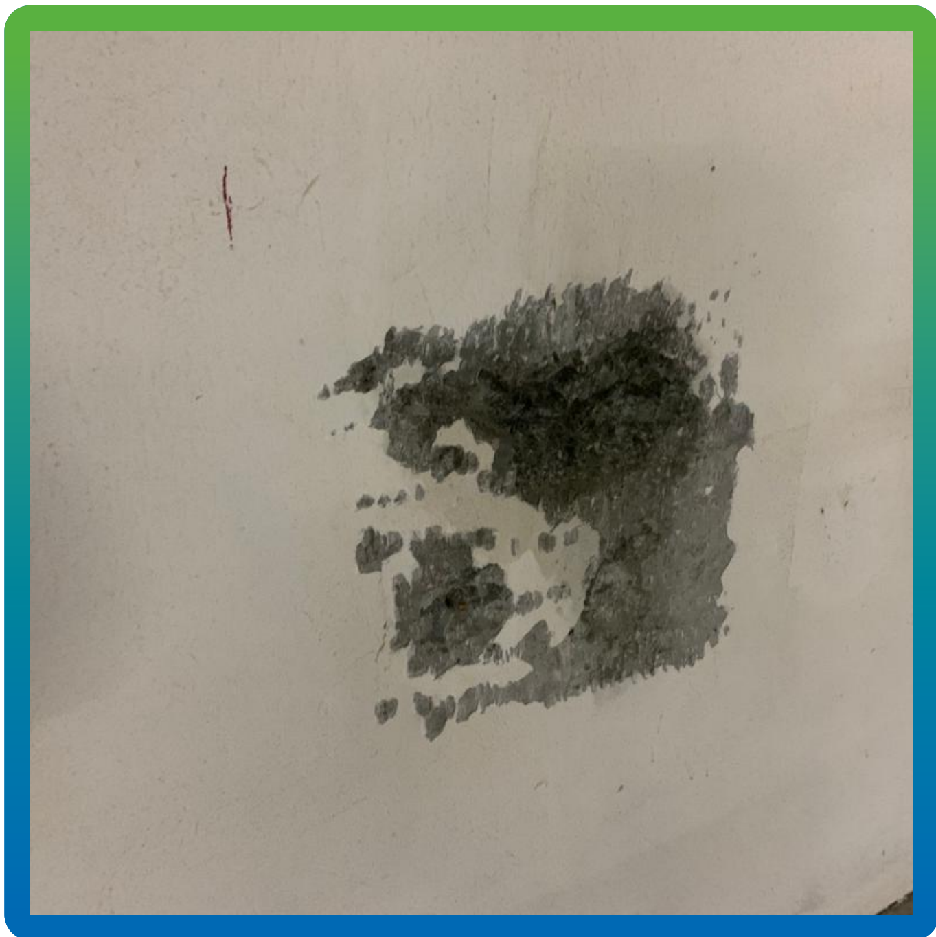
Подготовка дефектных участков к чеканке