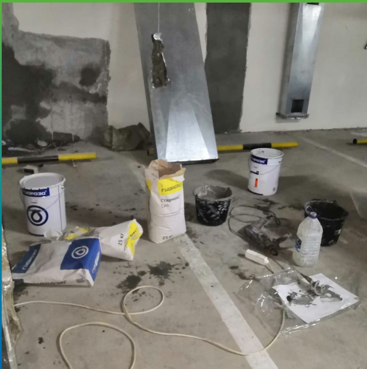
Подготовка материалов и оборудования для проведения работ