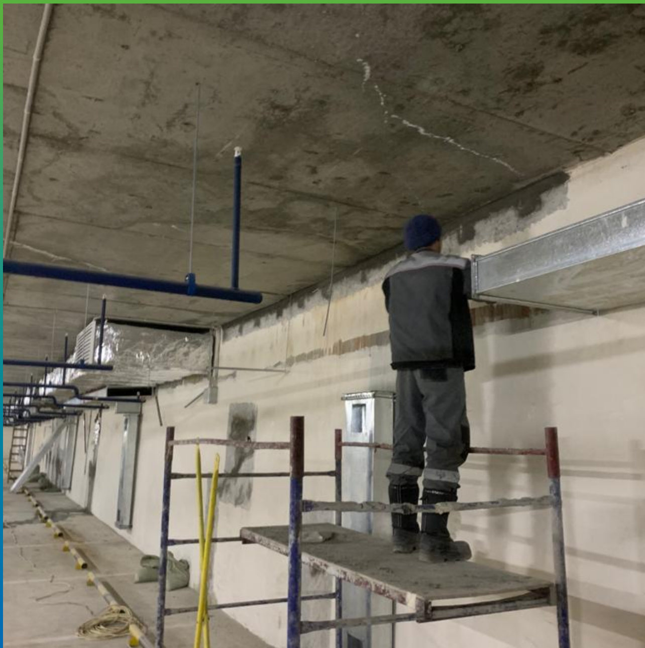
Инъектирование швов и пустот составом Манопур С