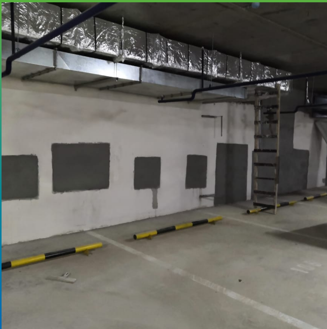
Стармекс Сил, нанесенный на дефектные участки