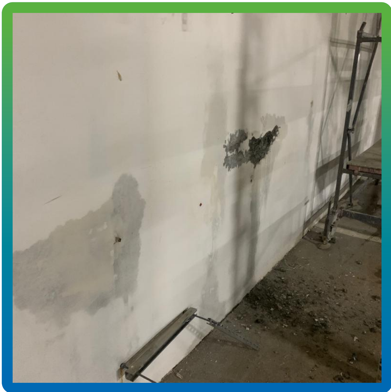
Участки с протечками