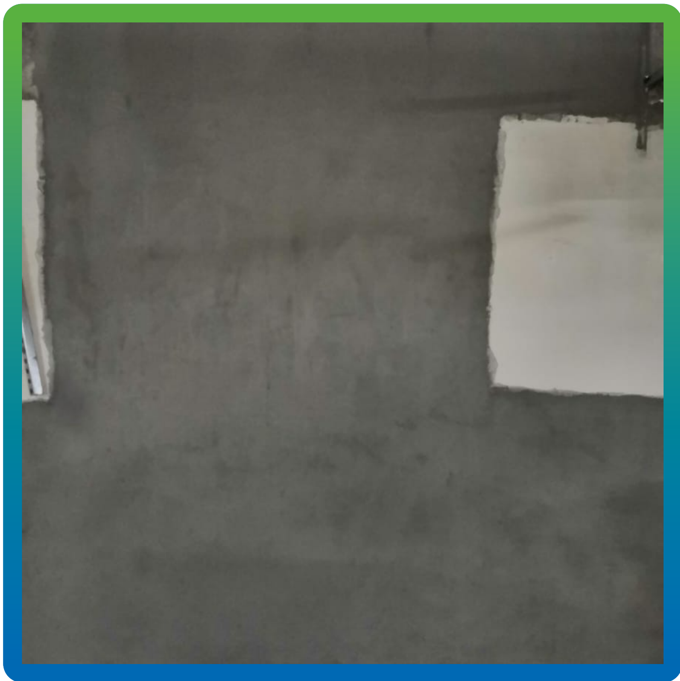
Стармекс Сил, нанесенный на дефектные участки