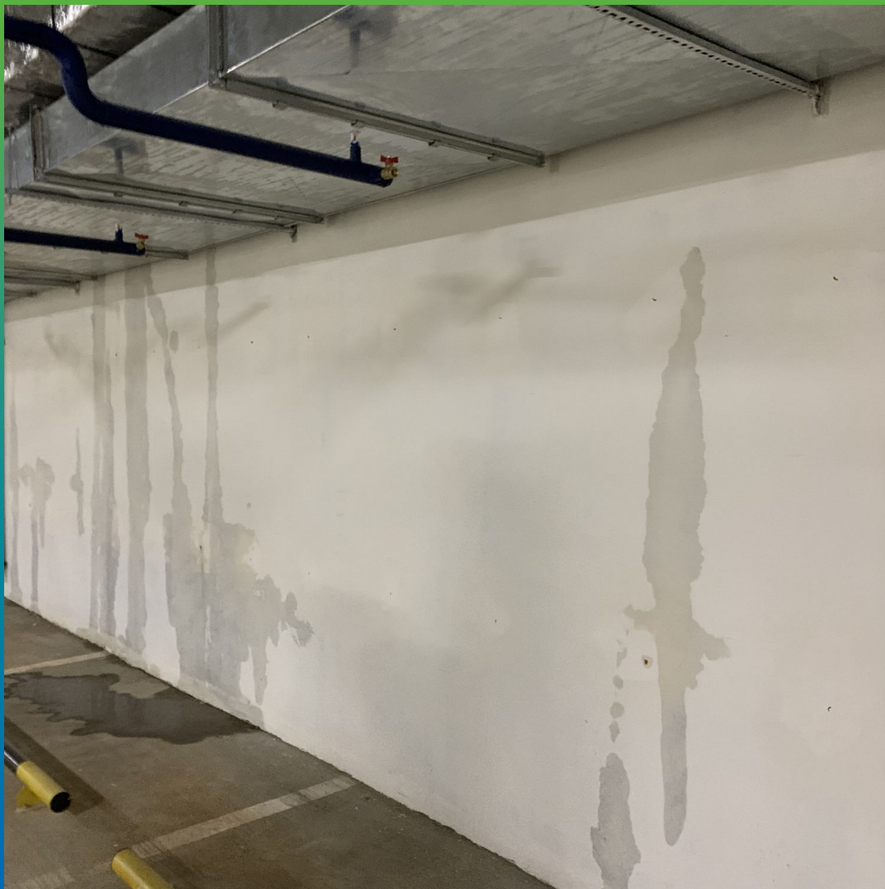
Участки с протечками