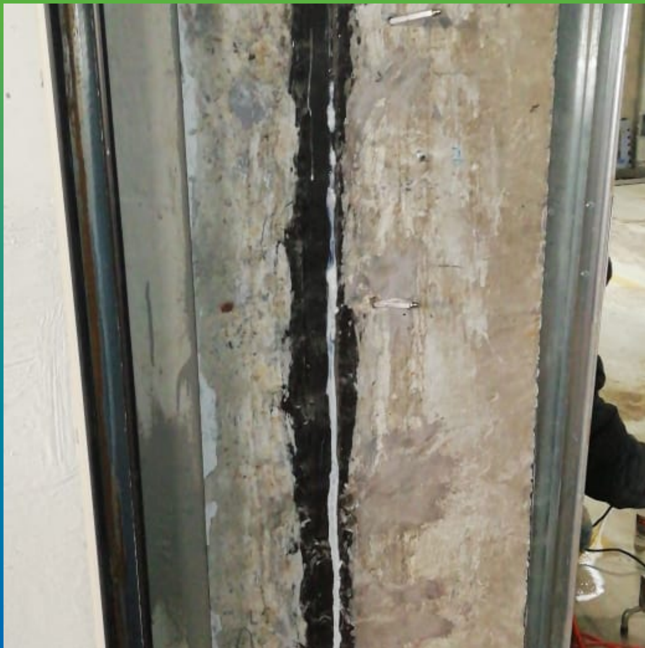
Инъектирование деформационного шва