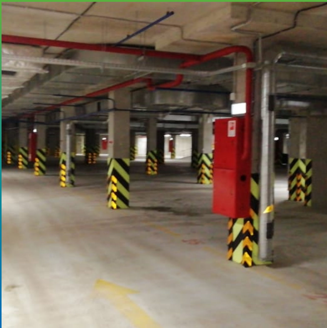
Общий вид паркинга