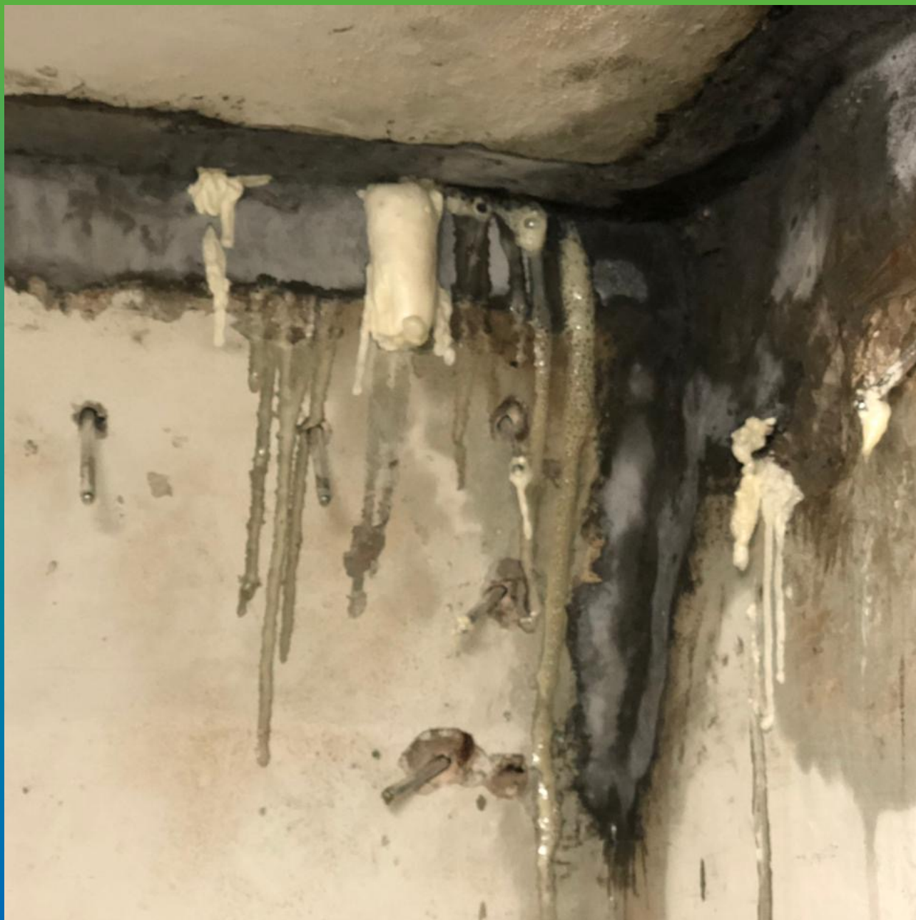
Вид после инъецирования Манопур 15, далее последует подача состава Манопур 143 в те же пакеры