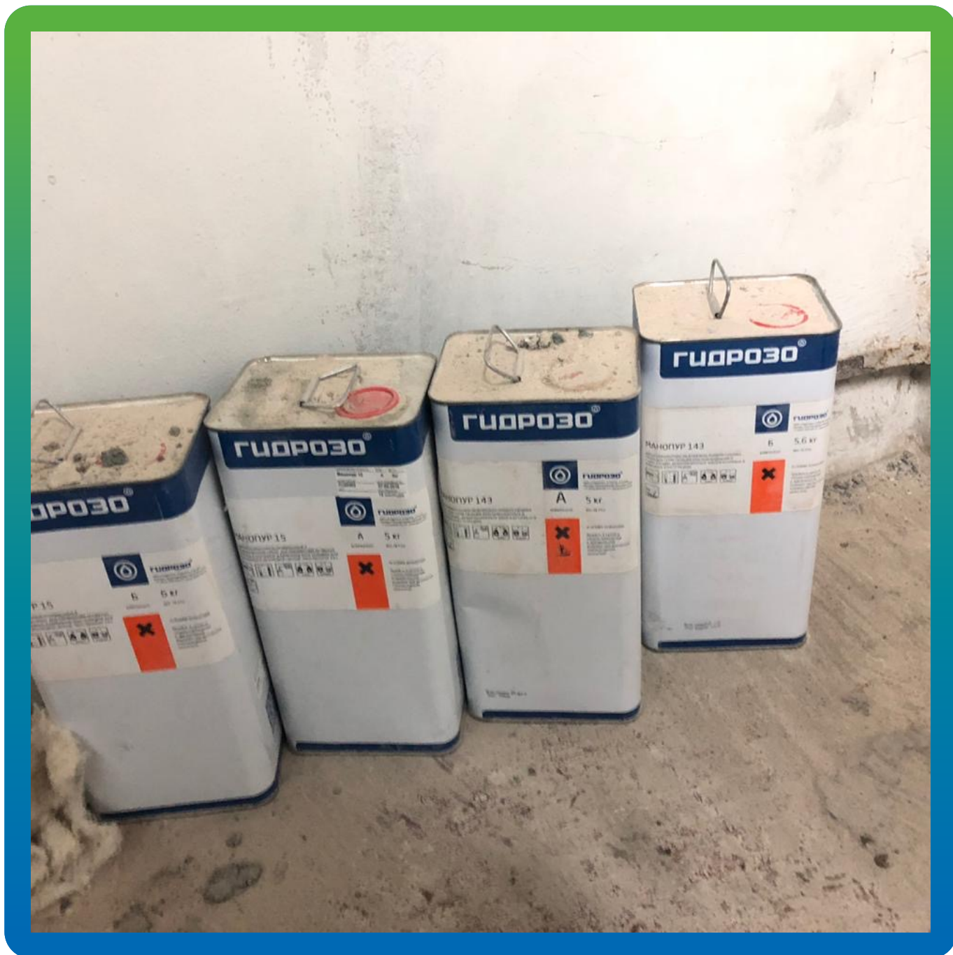
Полиуретановые инъекционные составы Гидрозо - Манопур 15 и Манопур 143