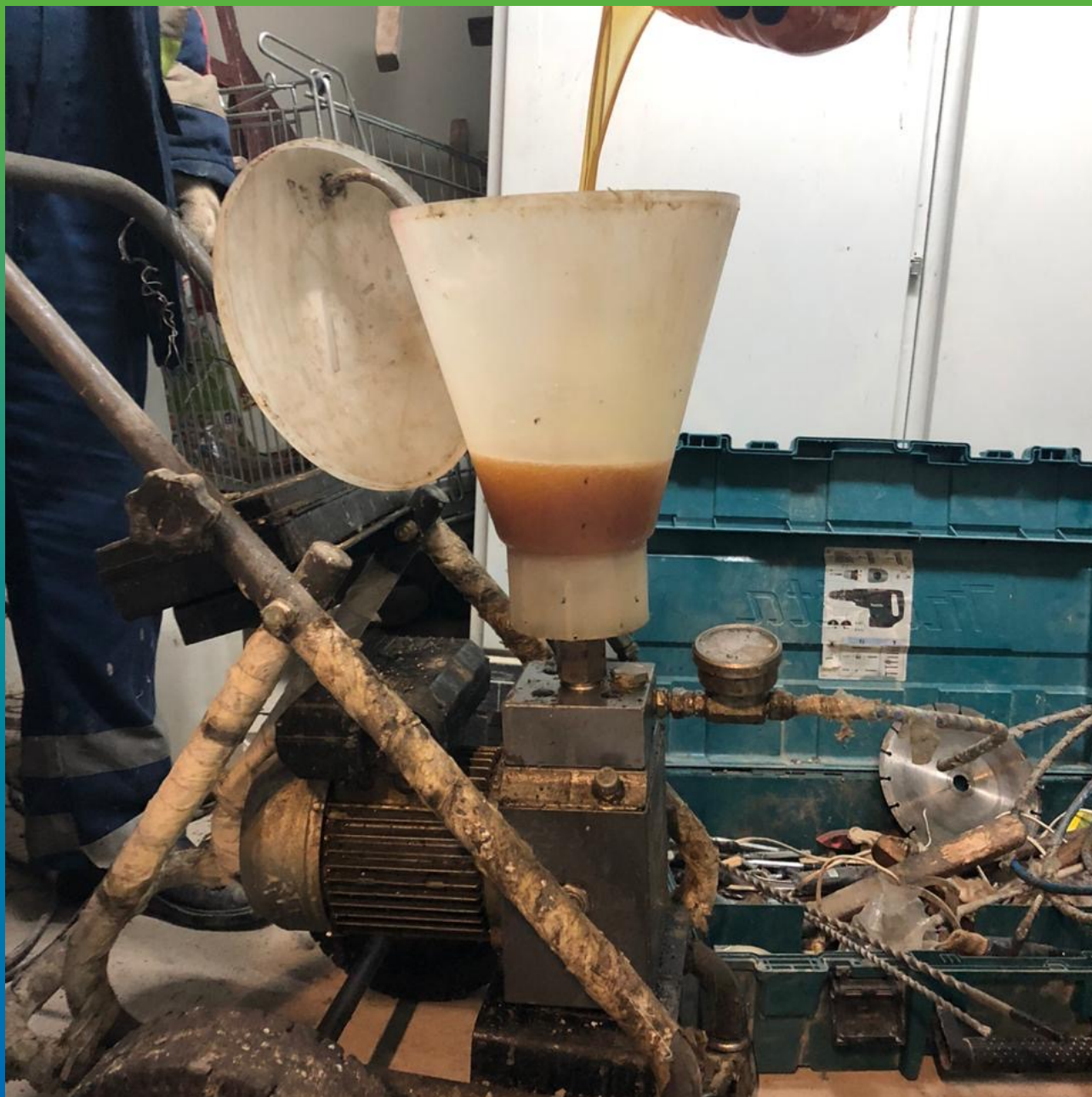
Заливка инъекционного состава в приемный бункер насоса