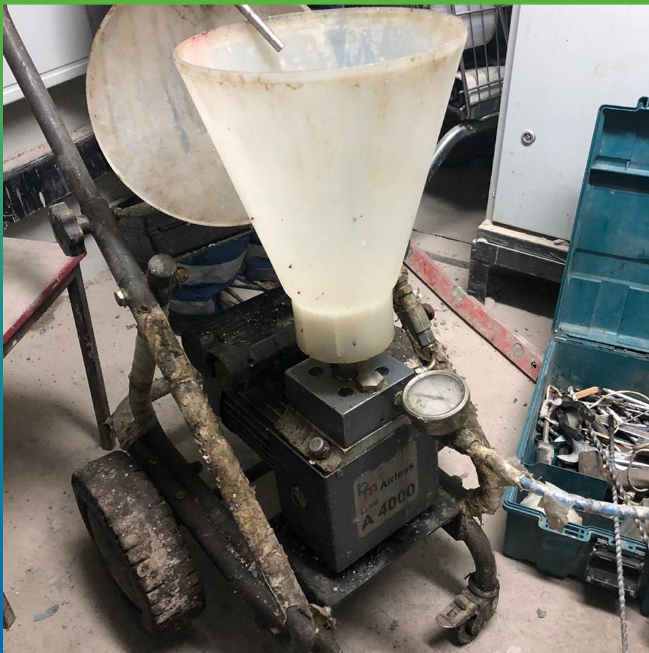
Подготовка мембранного инъекционного насоса БМ 1200