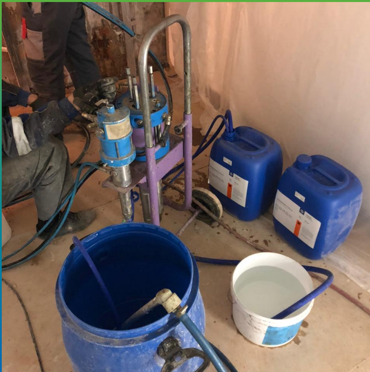
Прокачка Манокрил Гель Р через насос БМ 1425