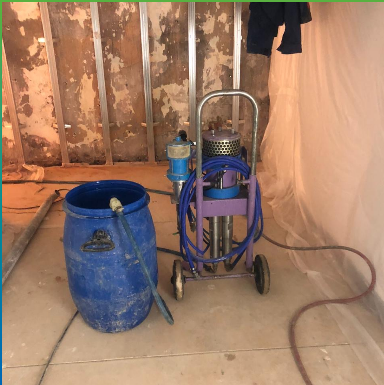
Промывка насоса Манокрил Клинер