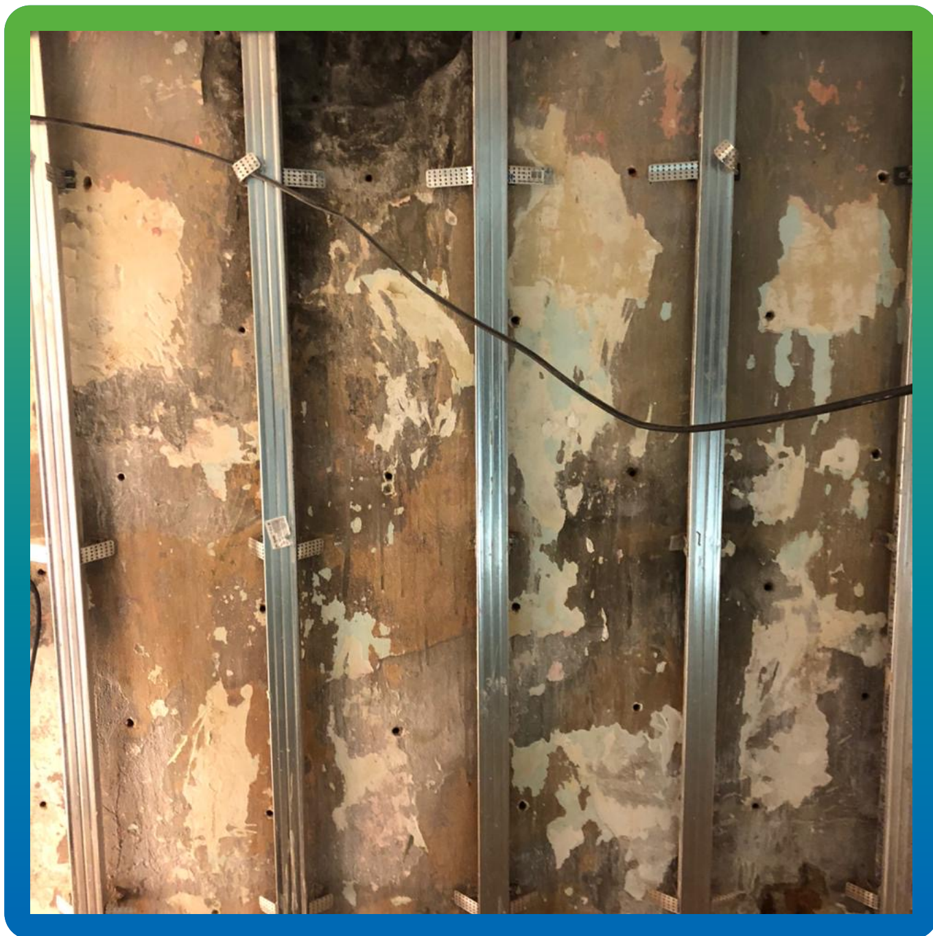
Подготовленная стена для установки пакеров