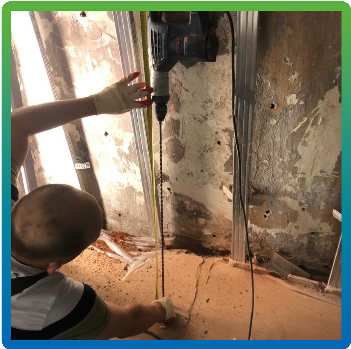
Подготовка к инъектированию