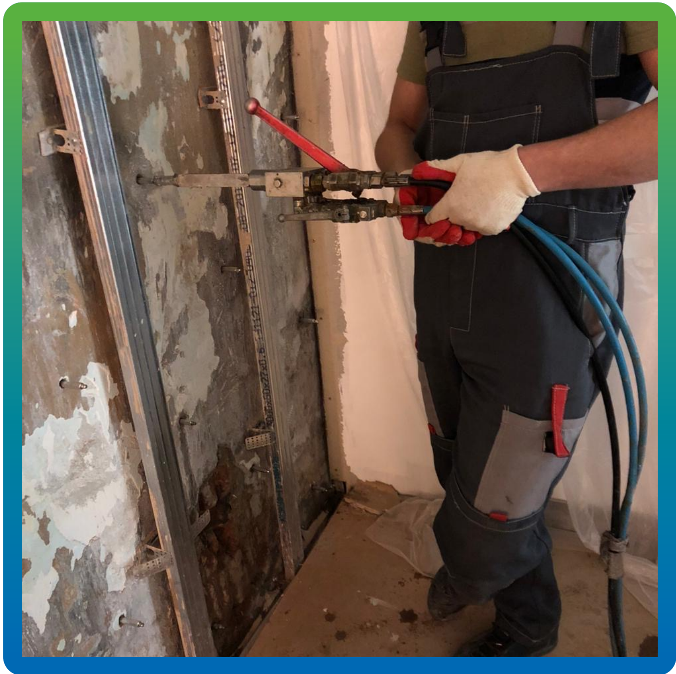
Инъектирование состава Манокрил Гель Р