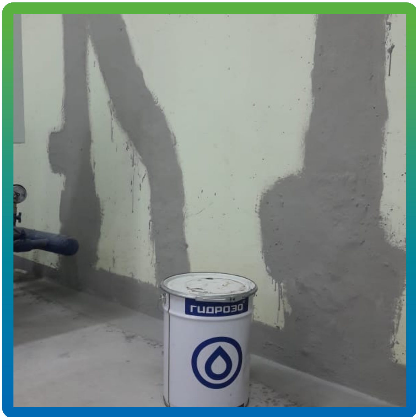
Заделка швов Манопокс 331