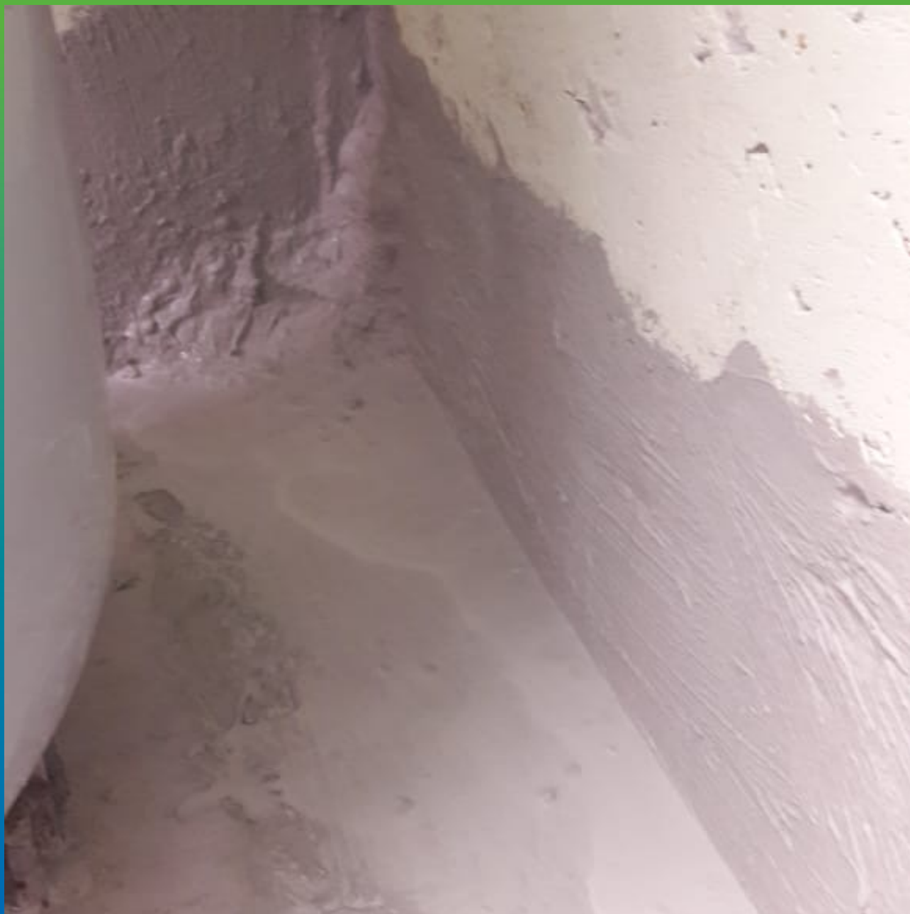
Гидроизоляция швов Стармекс Сил Флекс