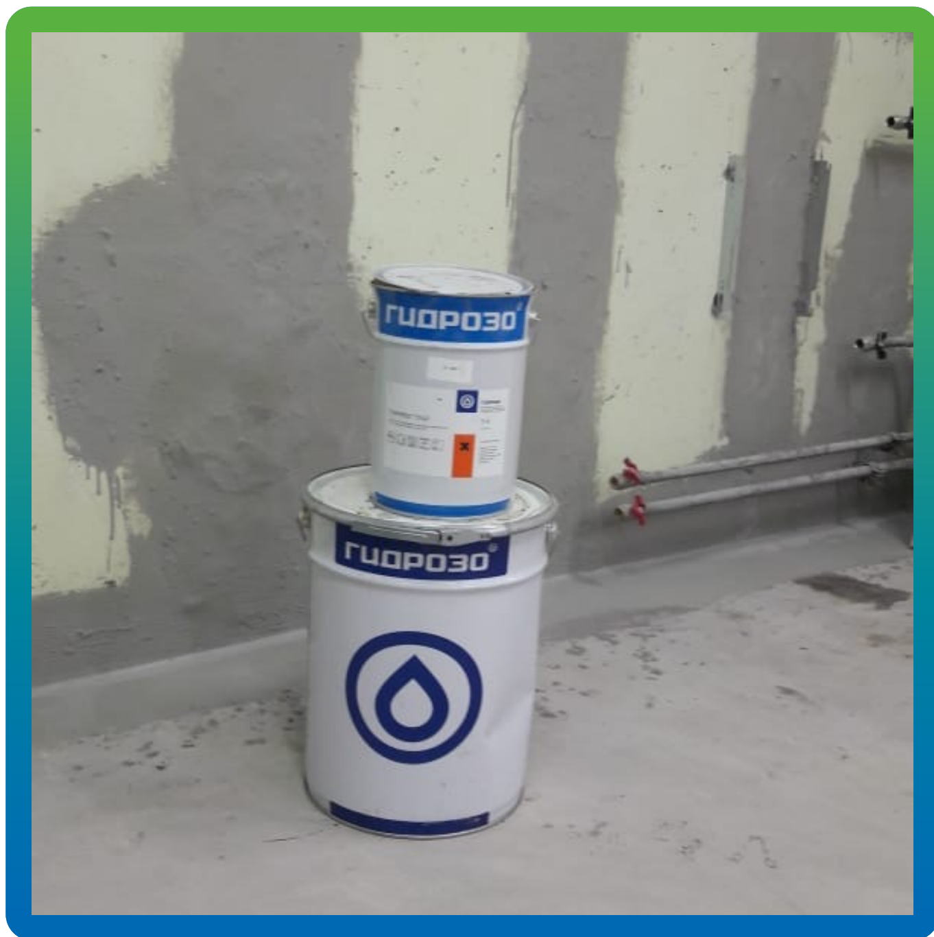
Заделка швов Манопокс 331