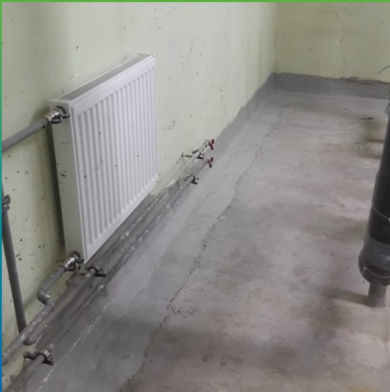
Гидроизоляция швов Стармекс Сил Флекс