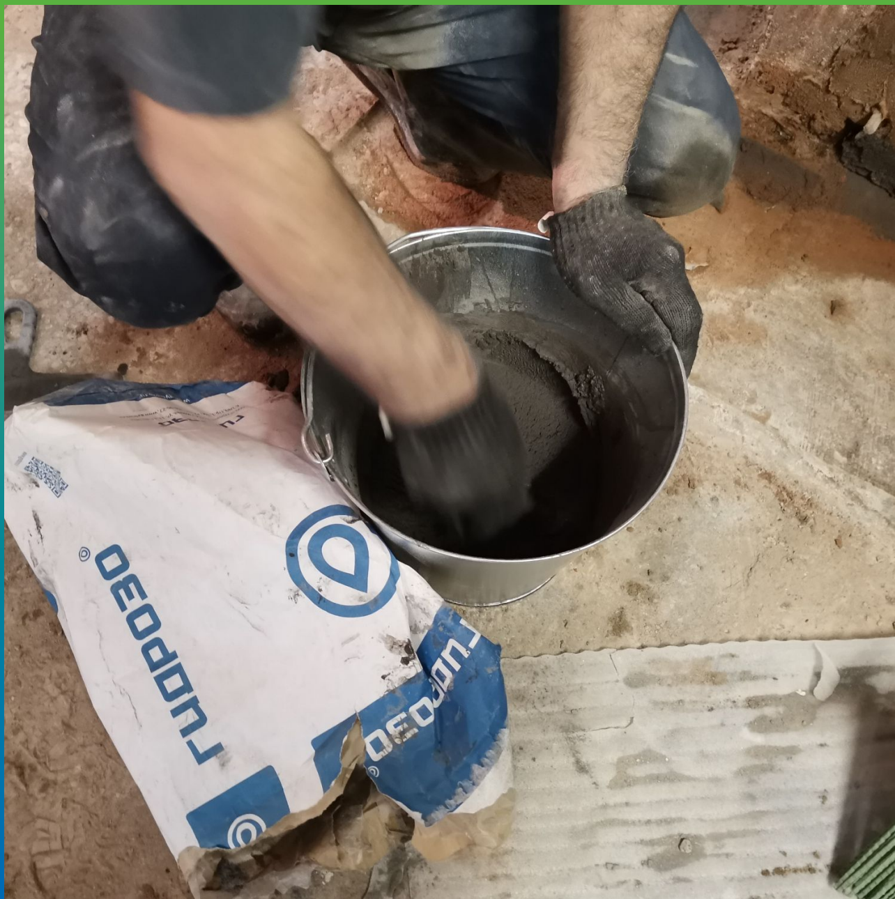
Затворение с водой материала Стармекс Чекан