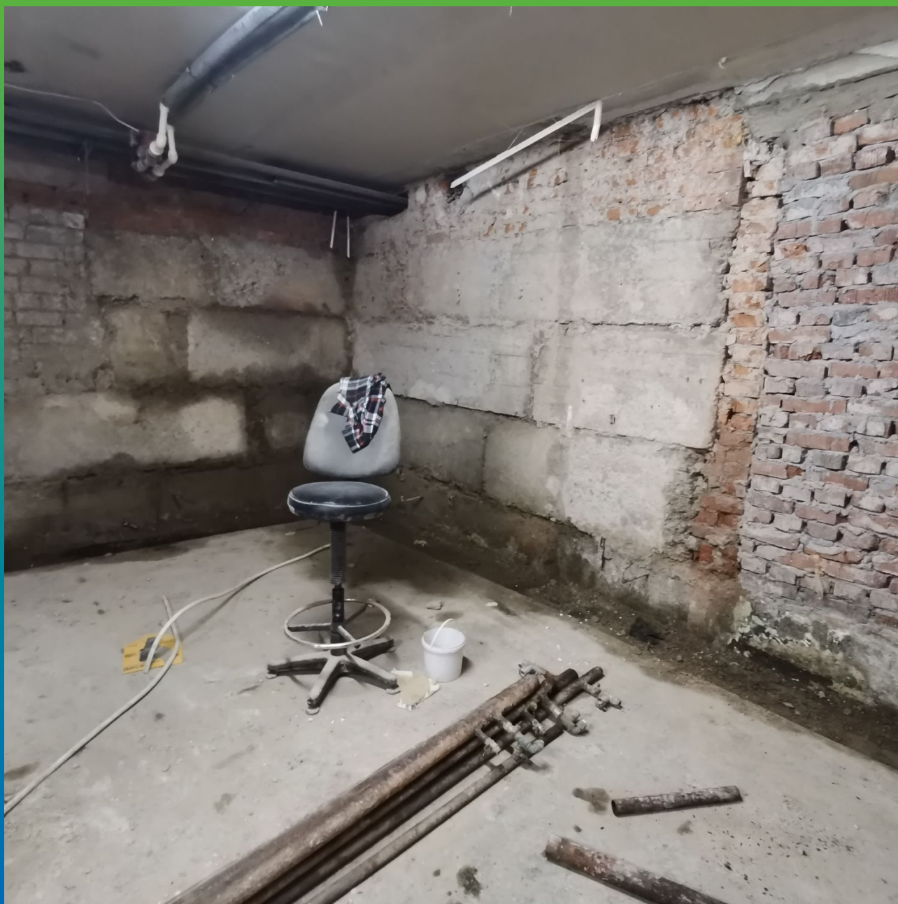
Здание изнутри до проведения работ по гидроизоляции