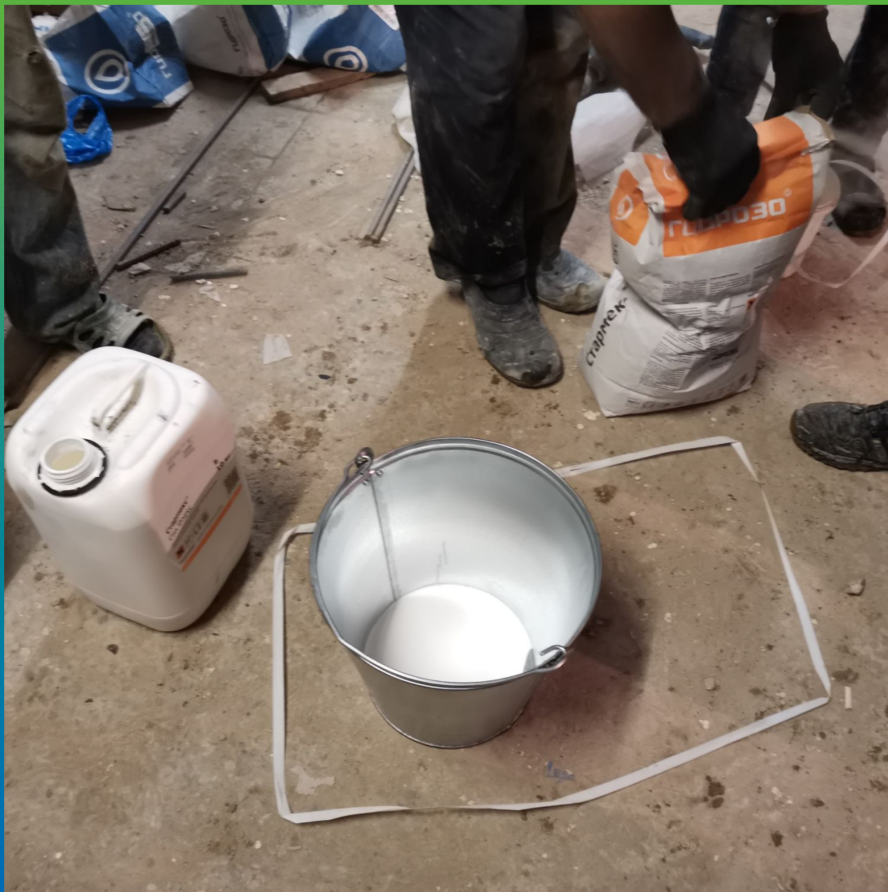
Затворение двух компонентов эластичной полимерцементной гидроизоляции Стармекс Сил Флекс