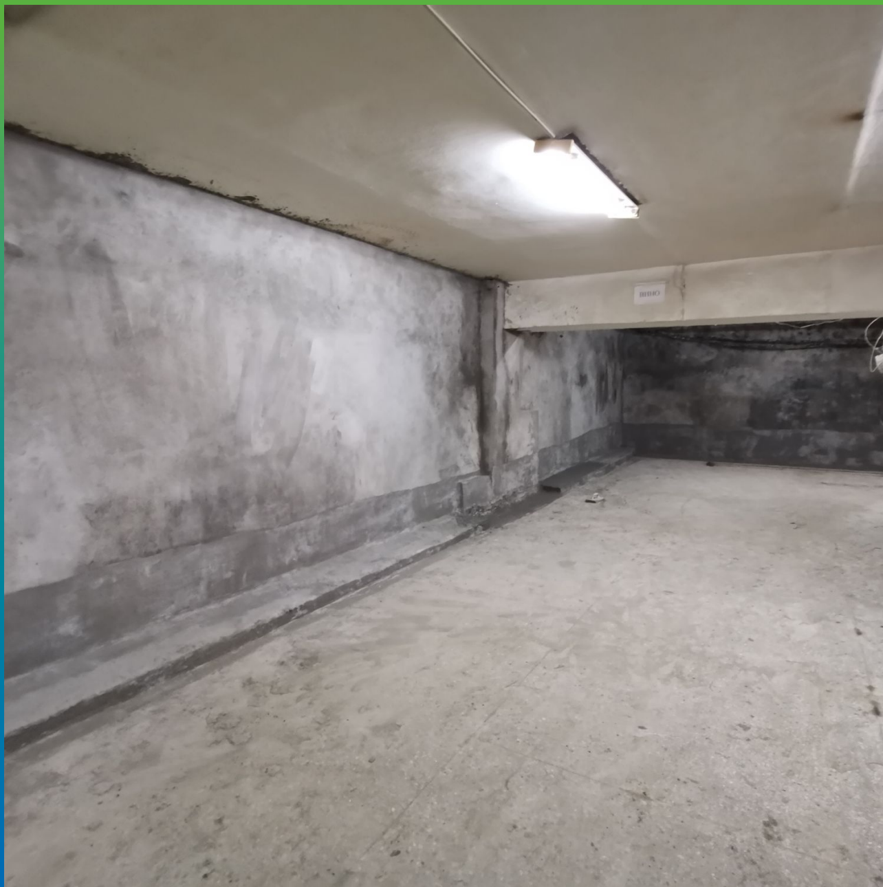
Объект после проведения всех работ по гидроизоляции