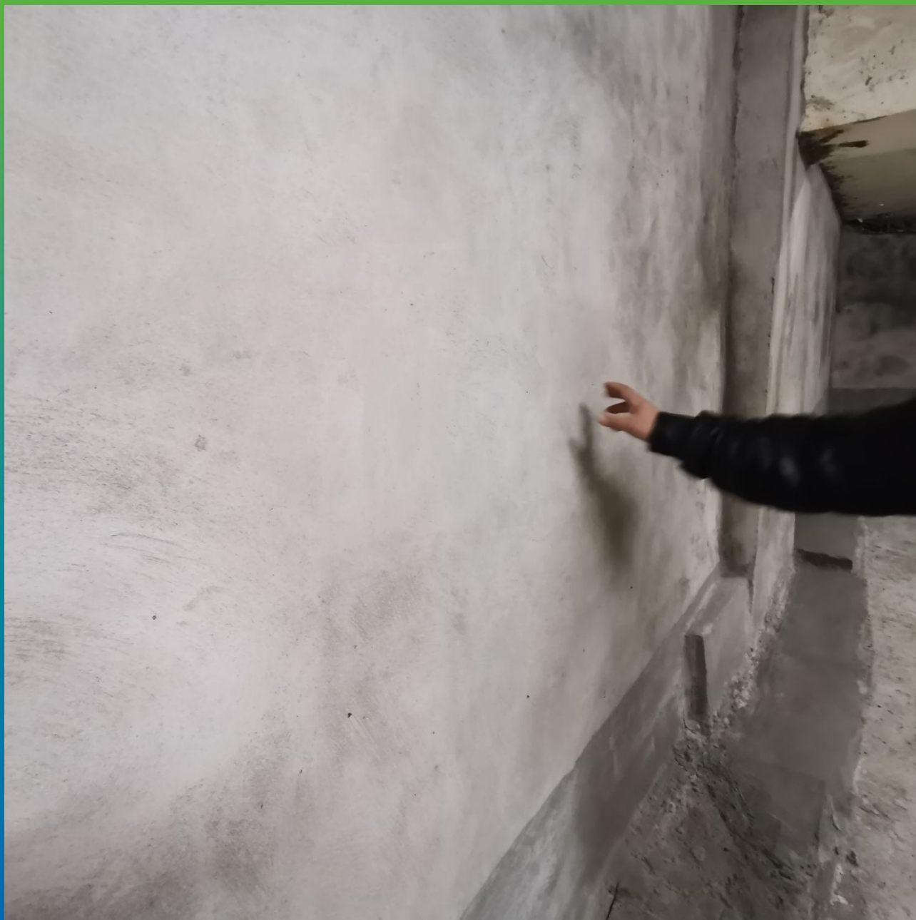
Приемка заказчиком работ по гидроизоляции