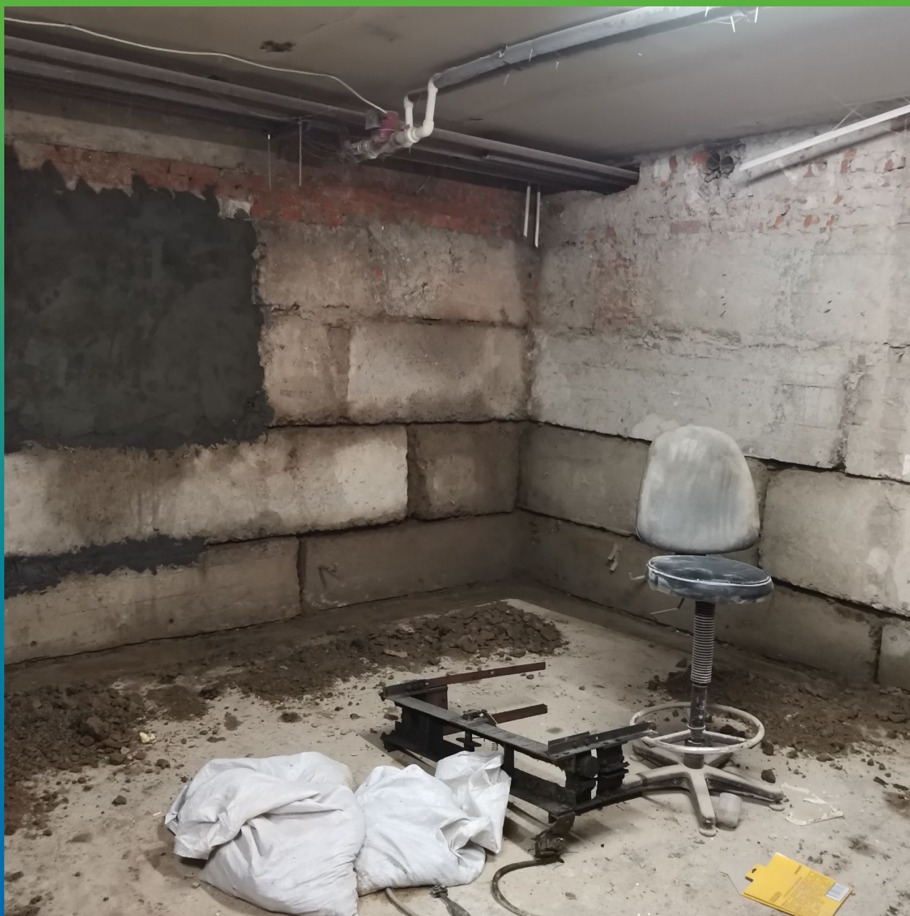
Ремонт швов ФБС составом Стармекс Чекан