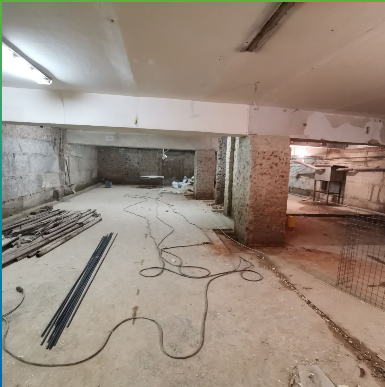
Здание изнутри до проведения работ по гидроизоляции