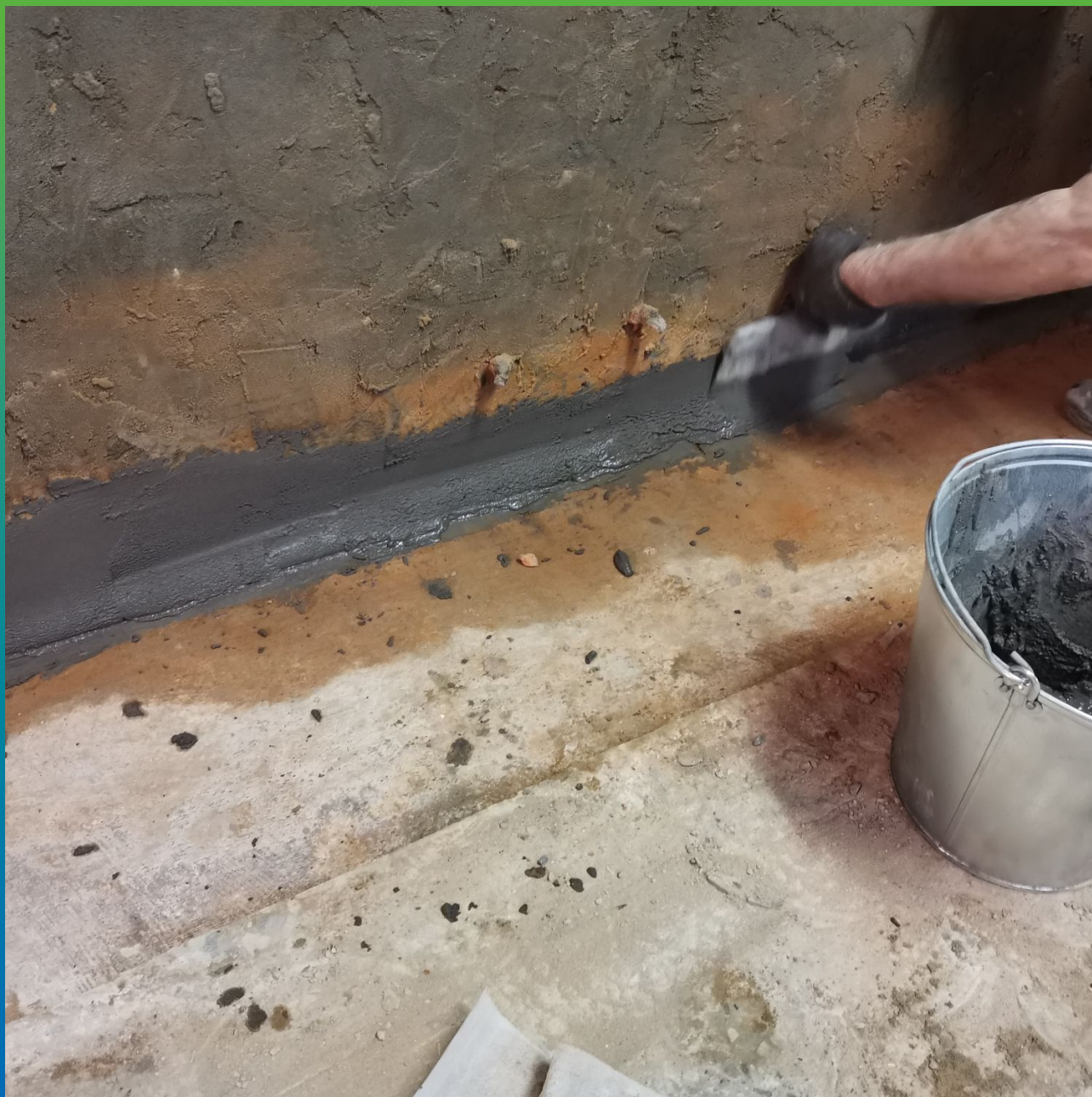
Ремонт примыканий по всему периметру составом Стармекс Чекан