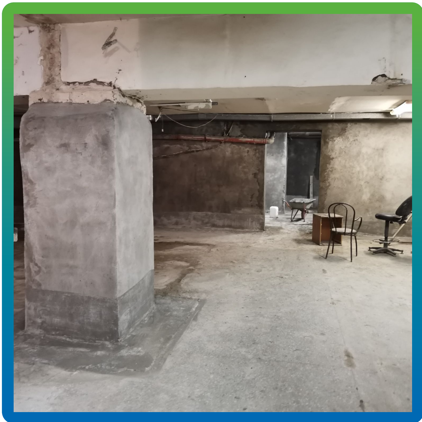
Объект после проведения всех работ по гидроизоляции