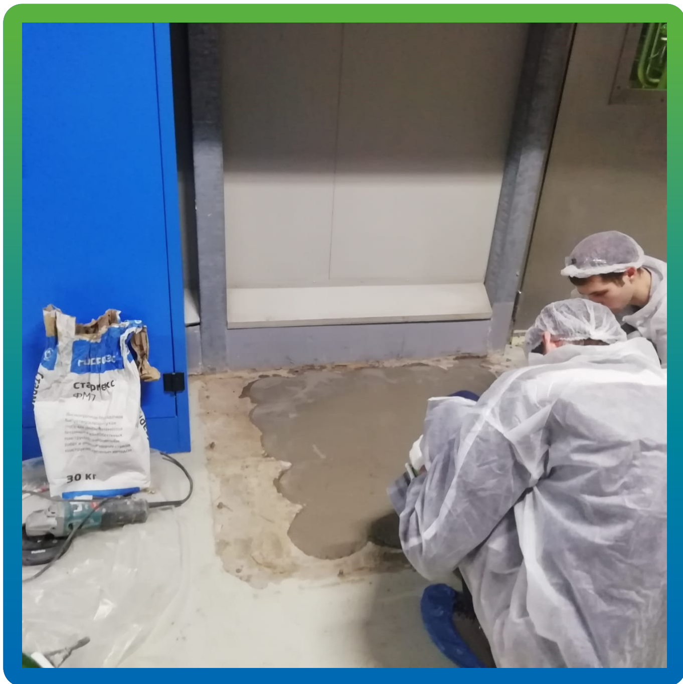
Заливка дефектов составом Стармекс ФМ7