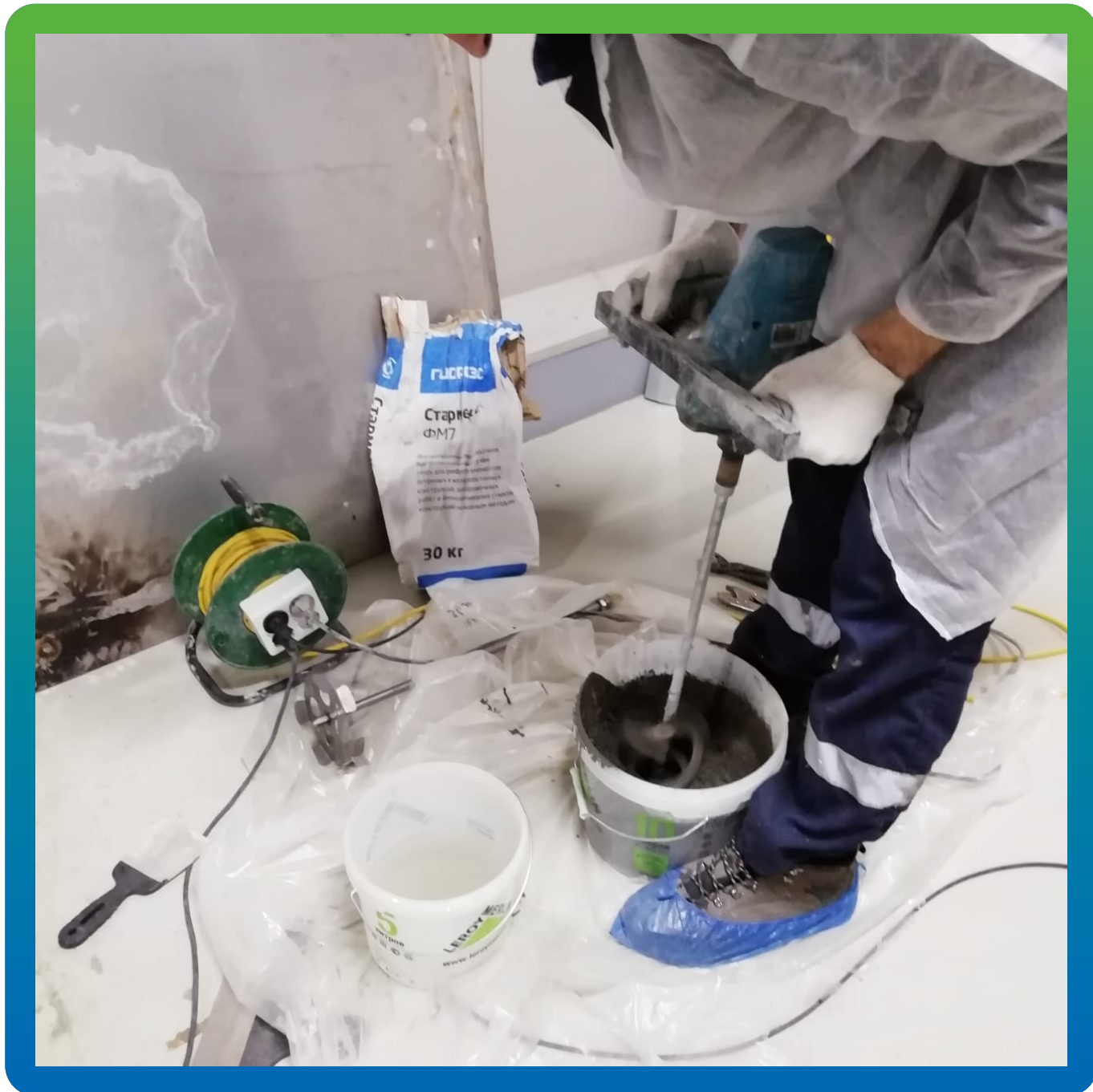
Приготовление ремонтного состава Стармекс ФМ7