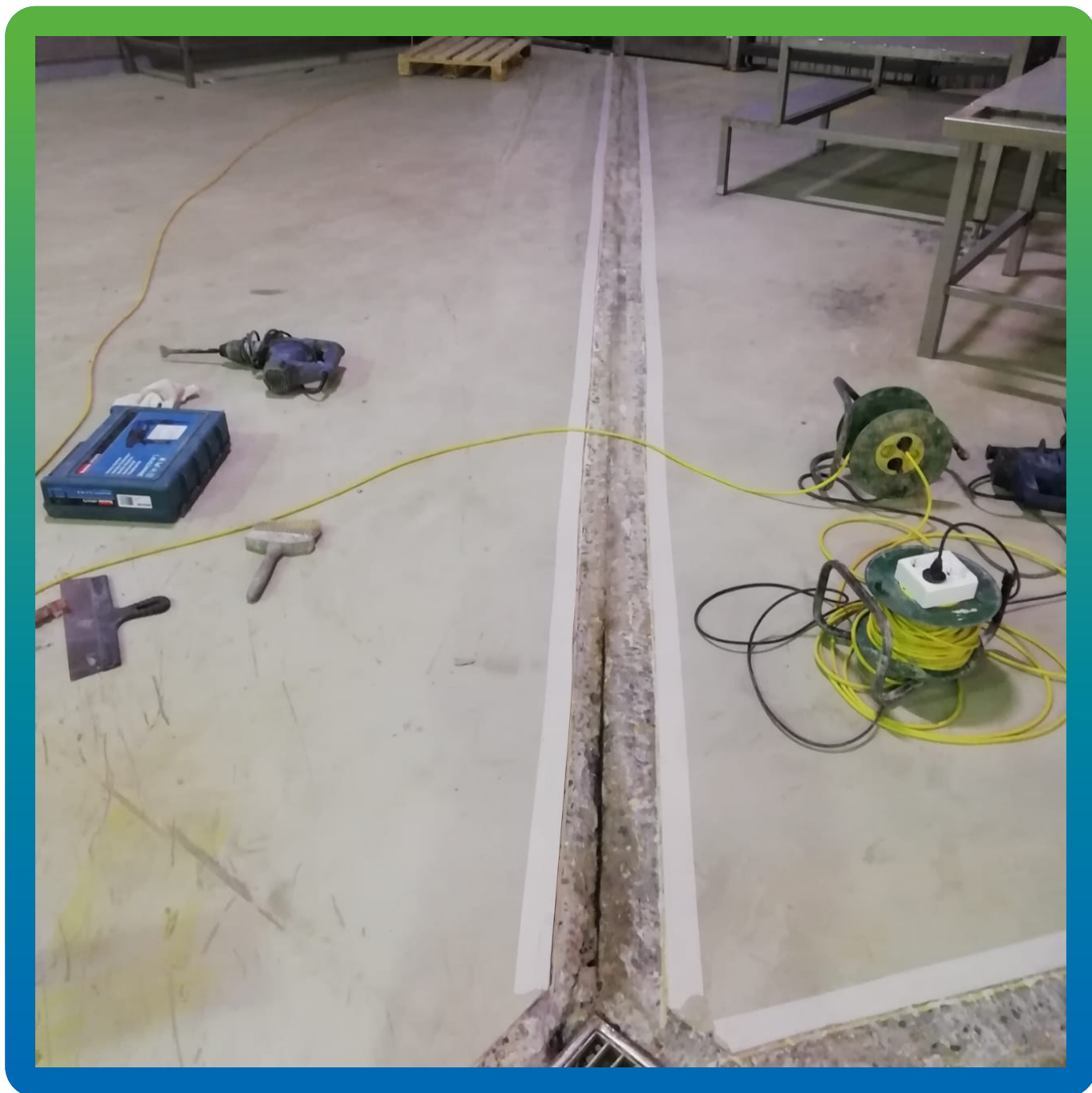
Подготовленный участок перед ремонтными работами