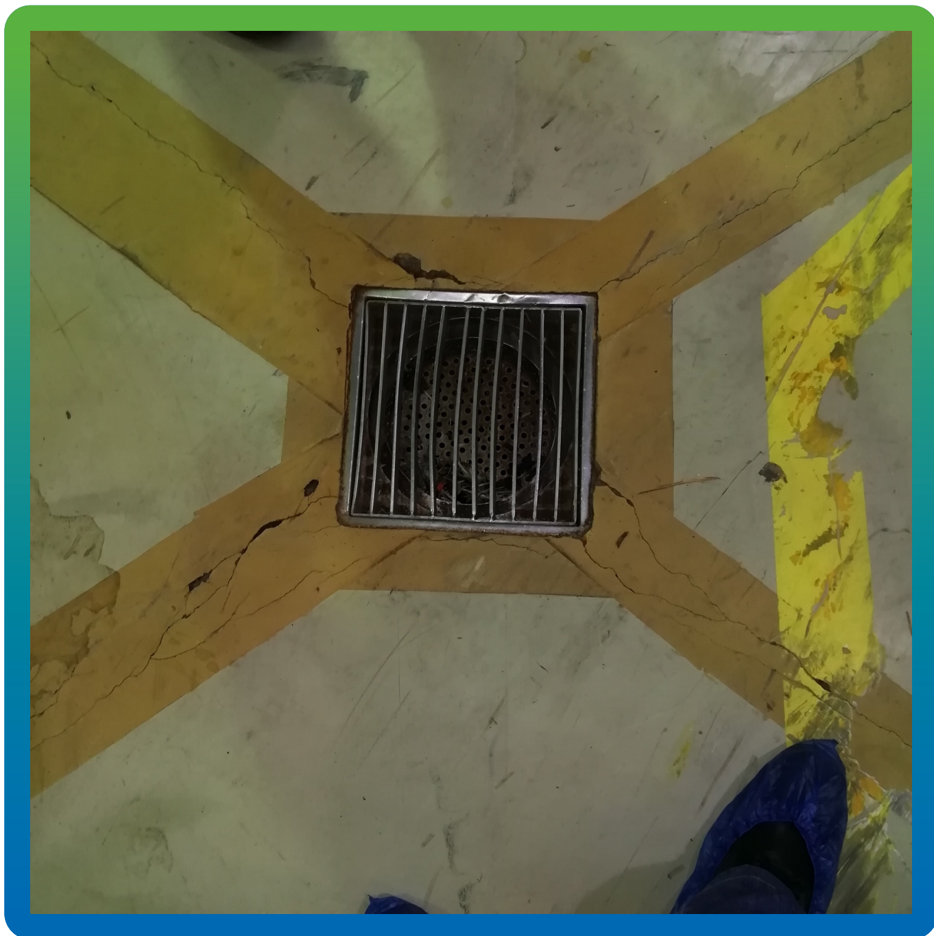
Трещины в существующем покрытии пола