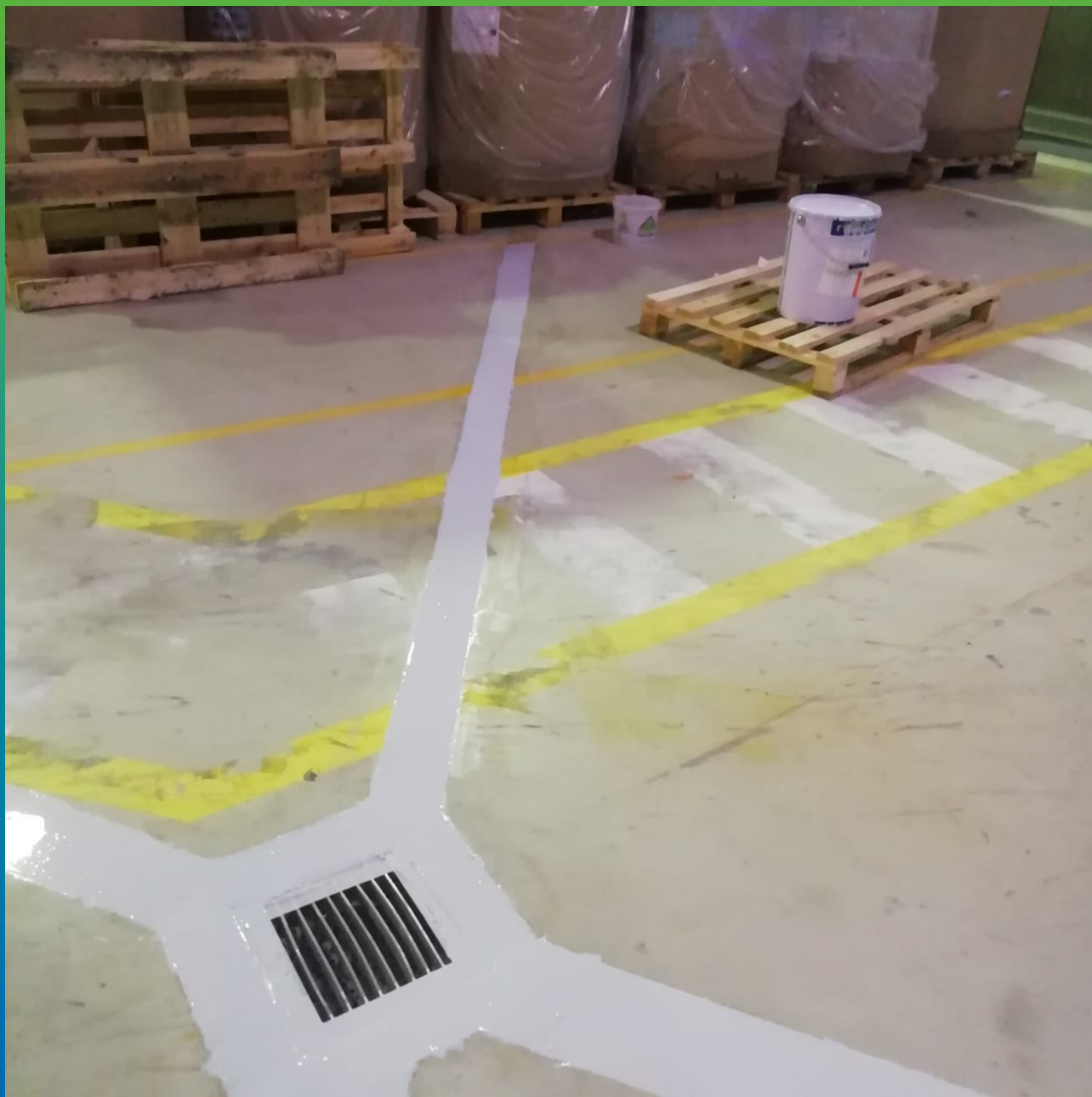
Отремонтированный участок полимерного пола