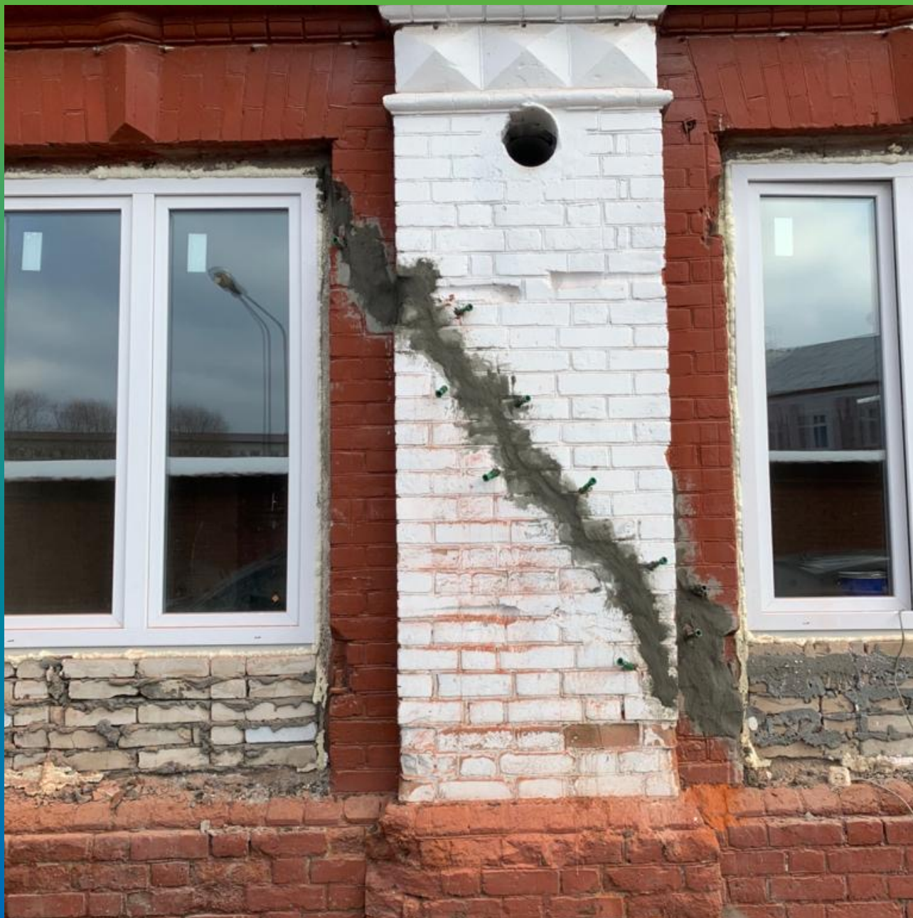
Трещина, проинъецированная составом Маноцем Грут