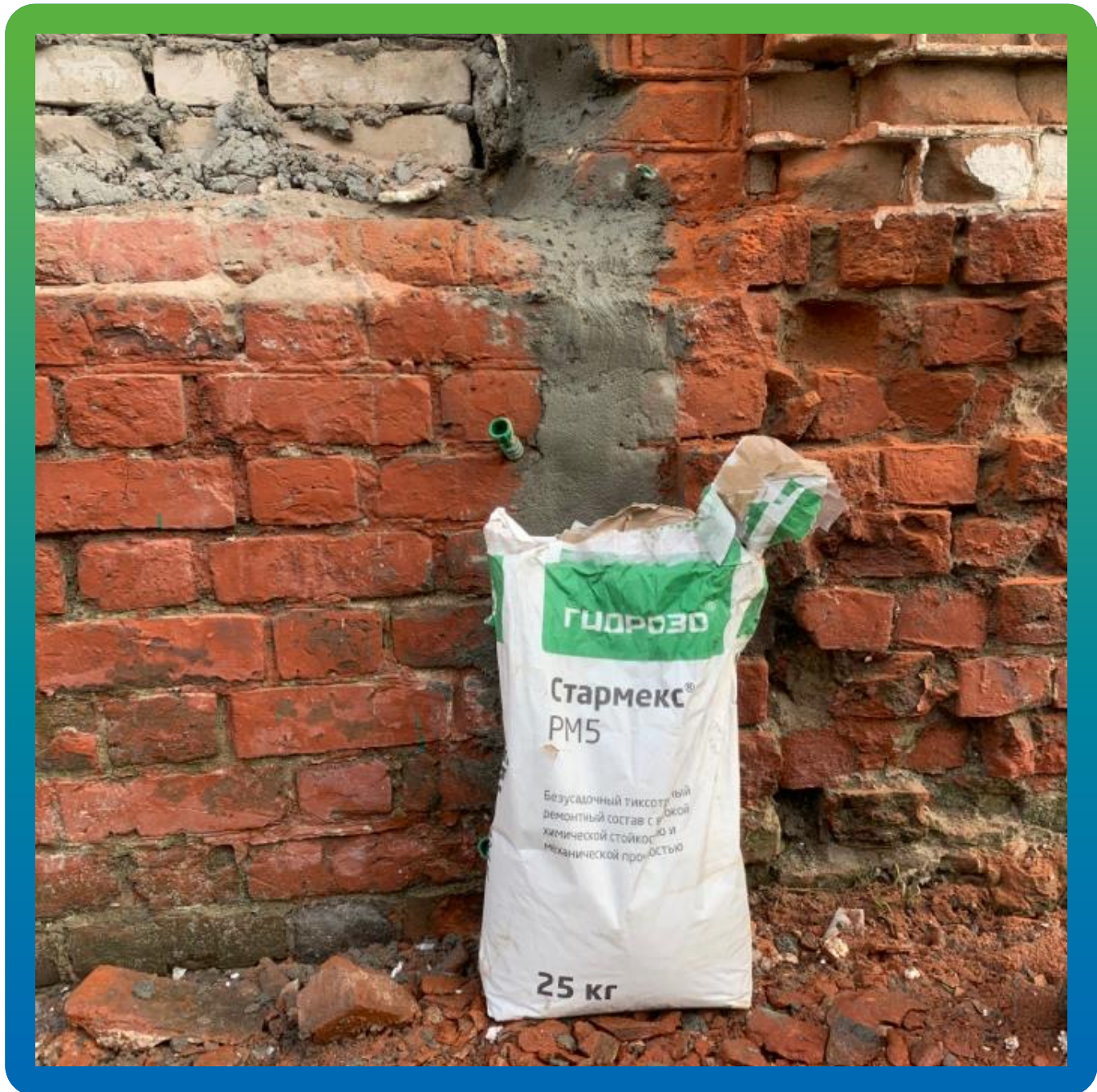
Трещина, зачеканенная составом Стармекс РМ5