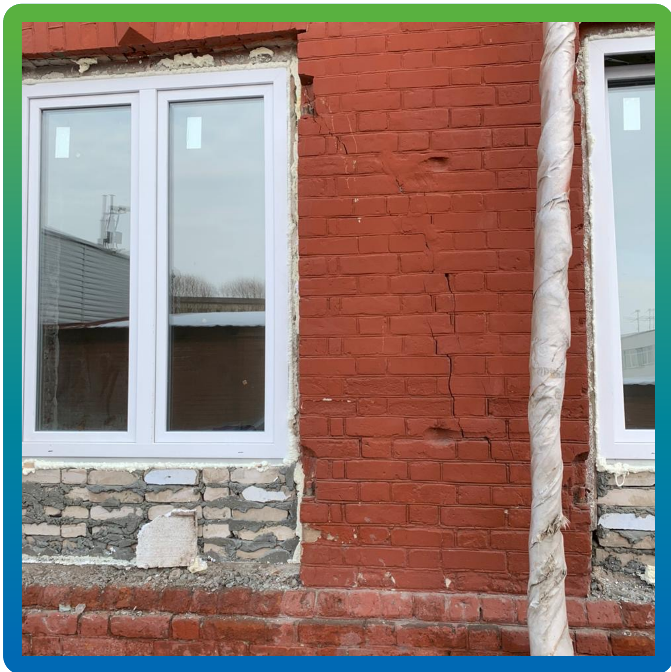
Трещины в кирпичной кладке