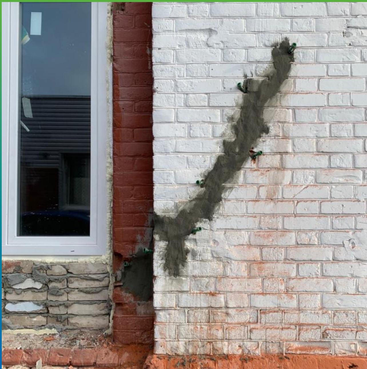
Трещина, проинъецированная составом Маноцем Грут