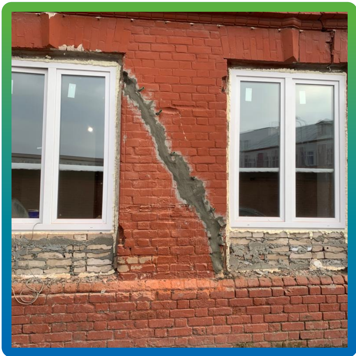
Трещина, проинъецированная составом Маноцем Грут