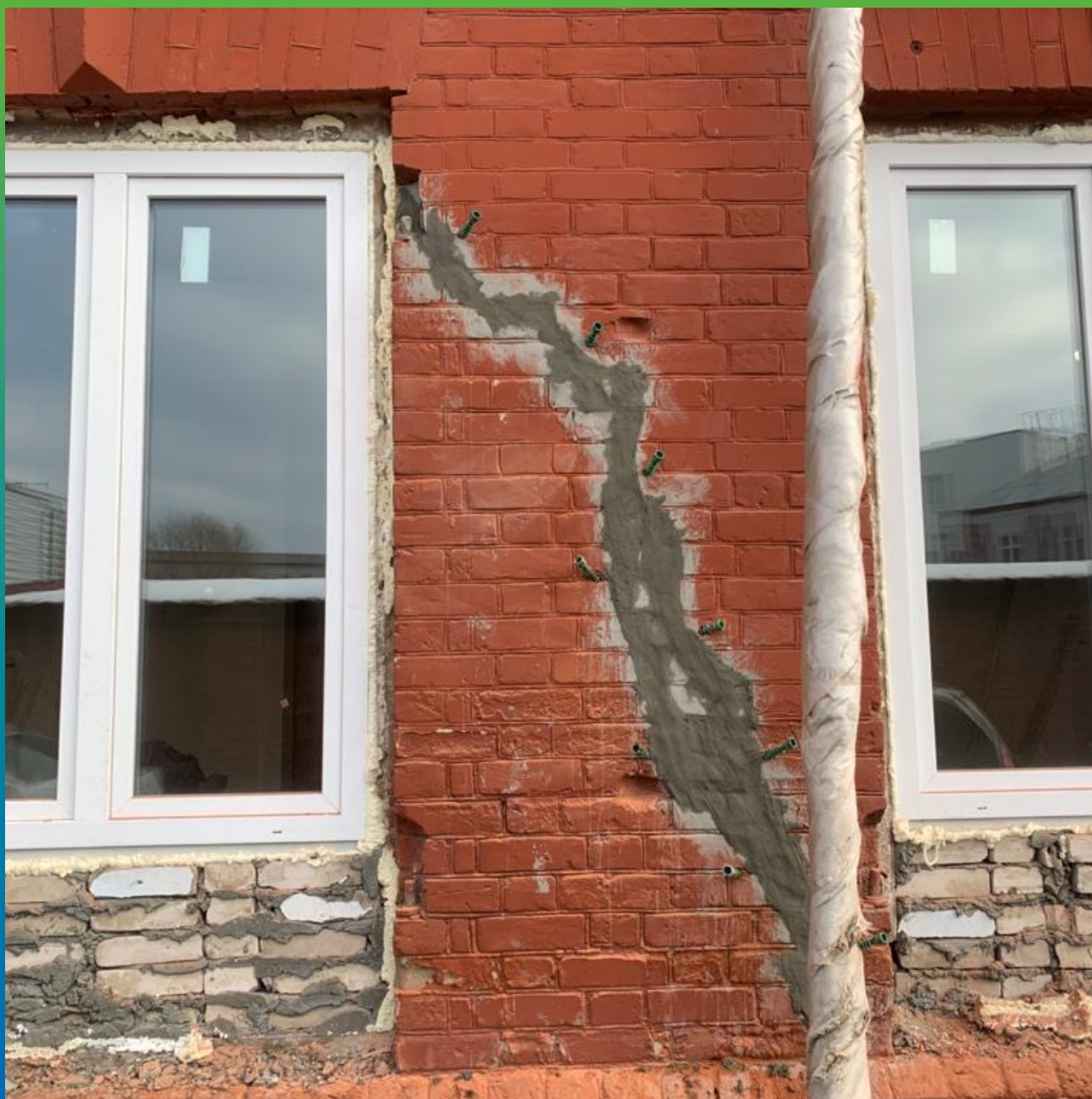
Трещина, проинъектированная составом Маноцем Гроут