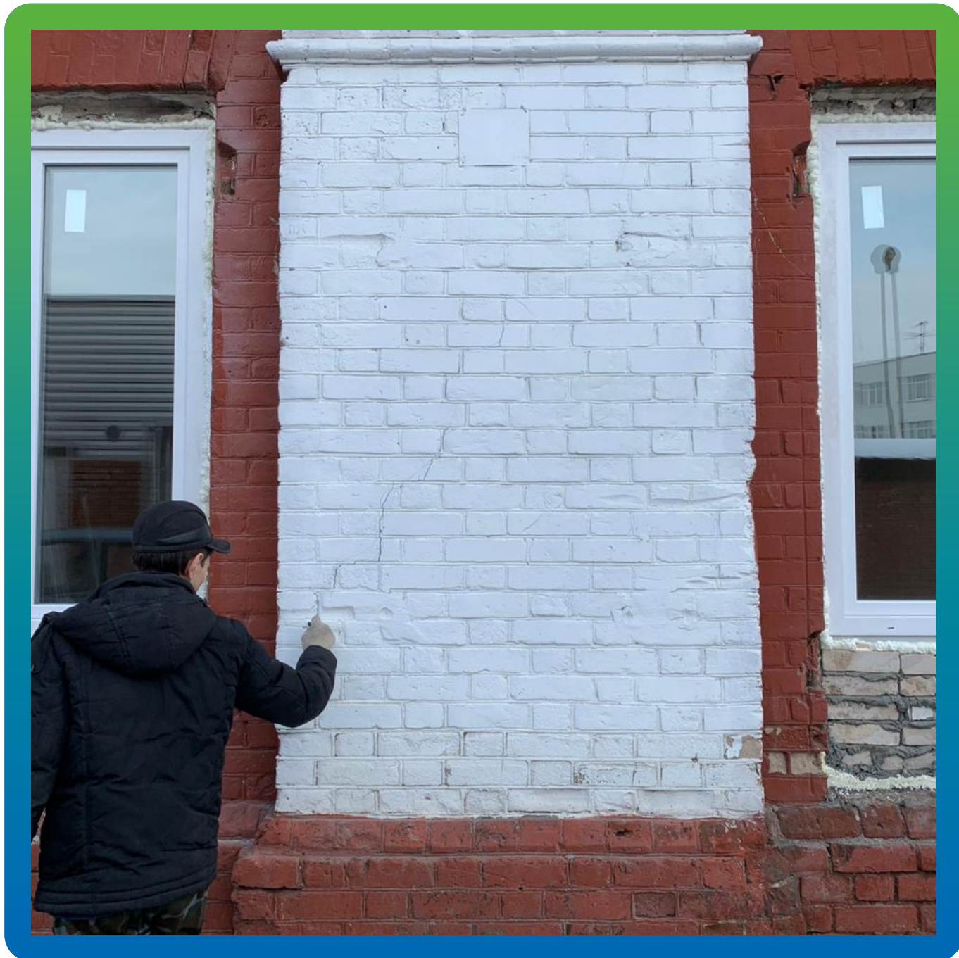
Трещины в кирпичной кладке