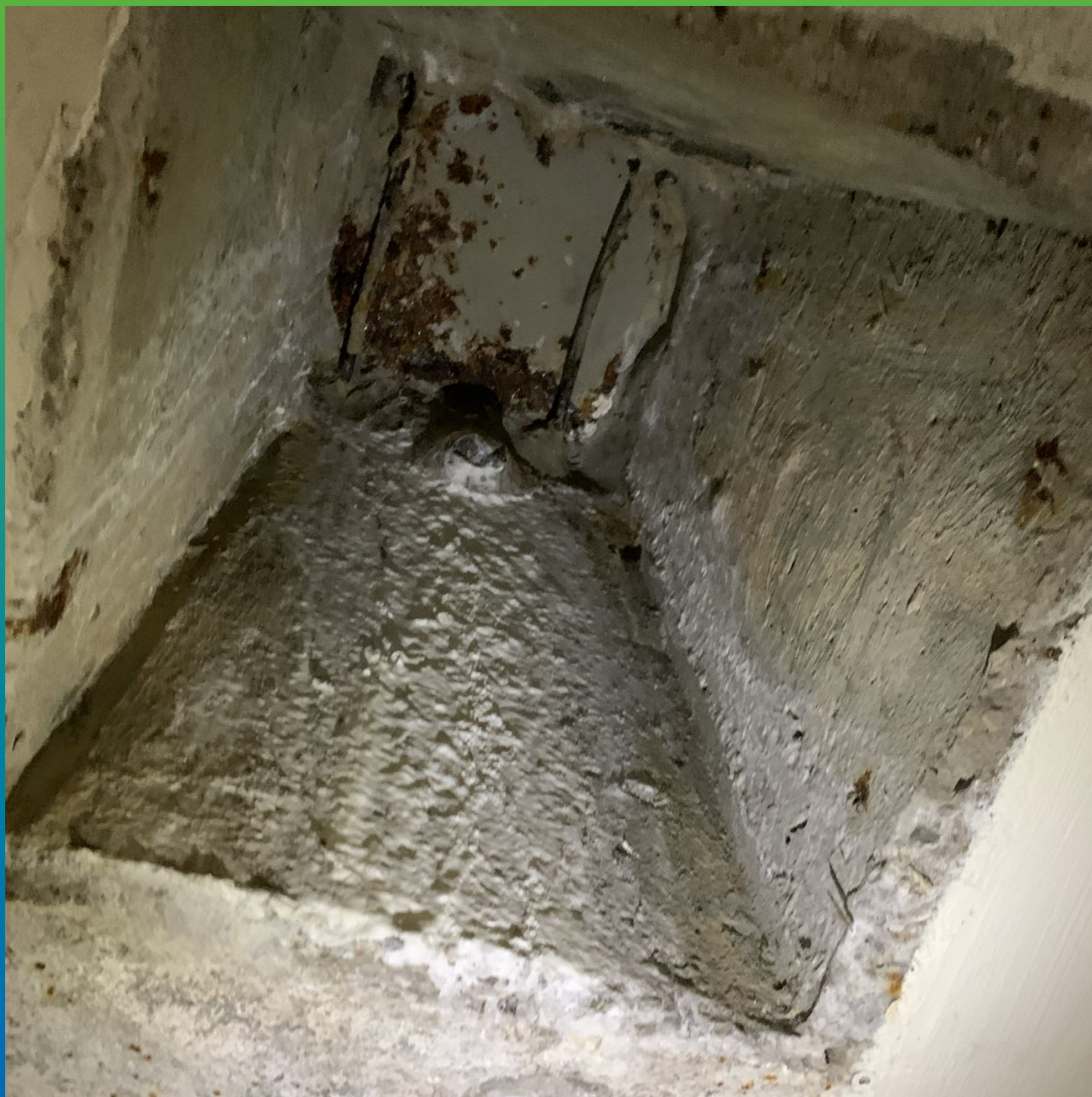
Отверстия, имеющие активные протечки