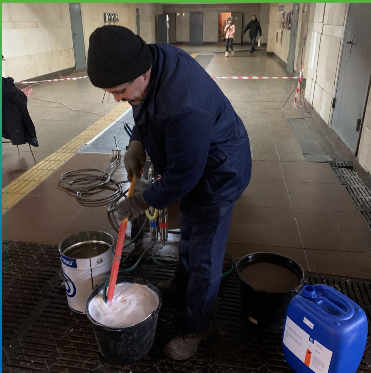
Смешивание компонентов геля