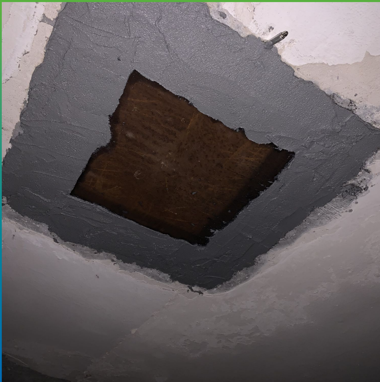
Отверстия с замененным металлическим листом, зачеканенные составом Манопокс 331