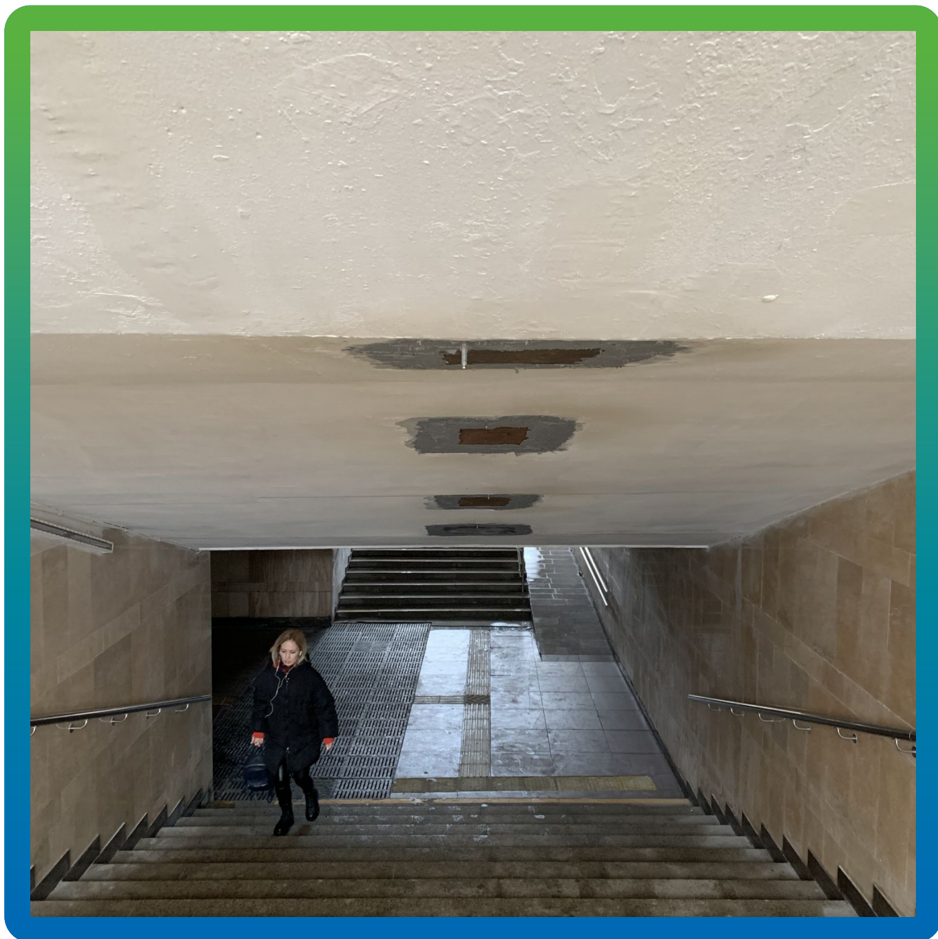
Отверстия с замененным металлическим листом, зачеканенные составом Манопокс 331