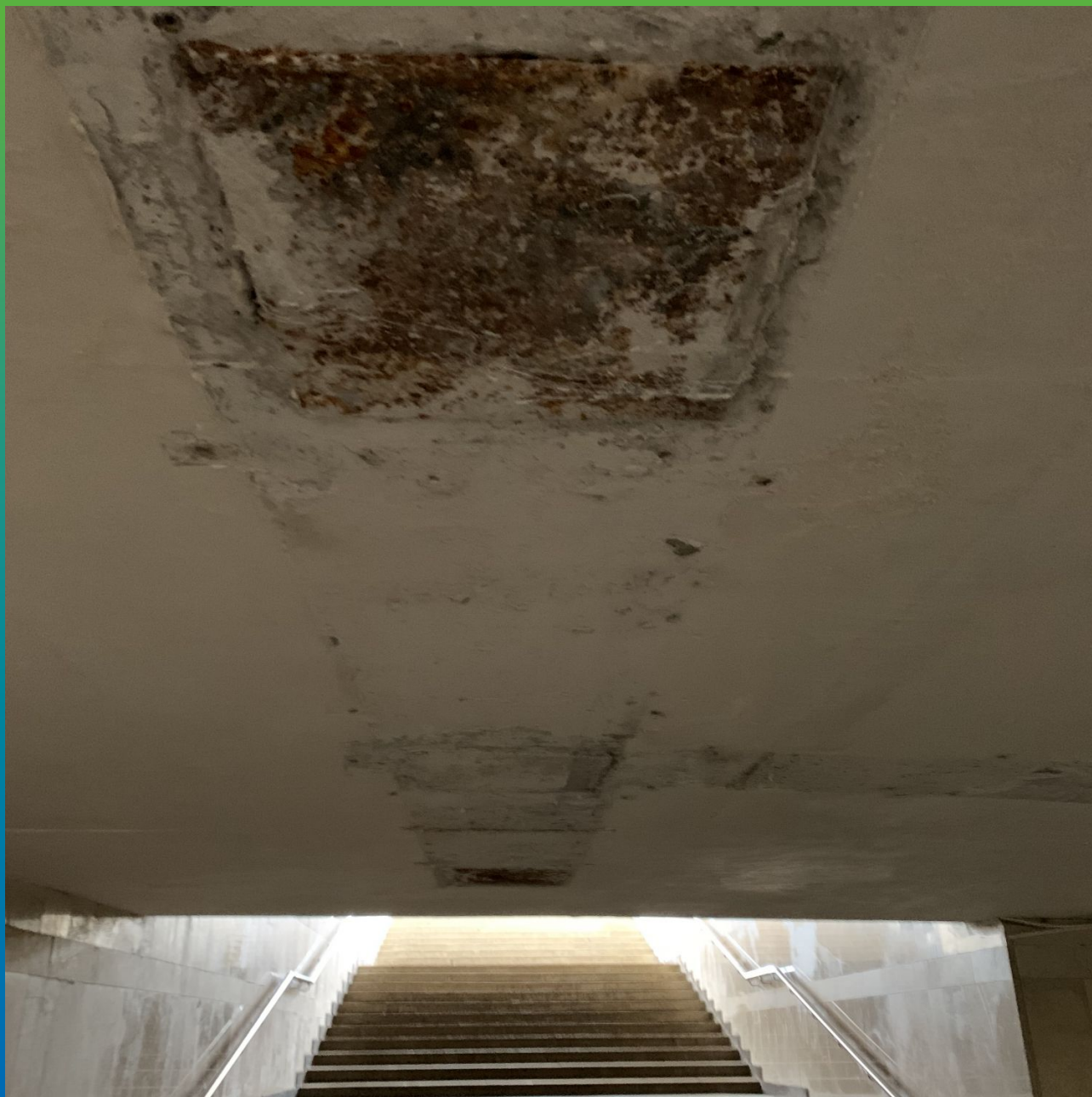
Отверстия, имеющие активные протечки