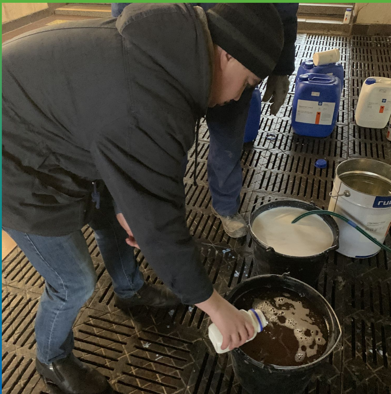
Смешивание компонентов геля