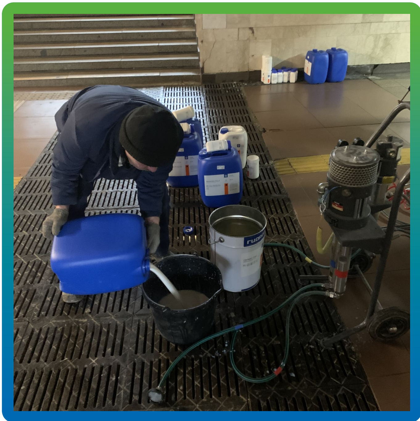
Смешивание компонентов геля