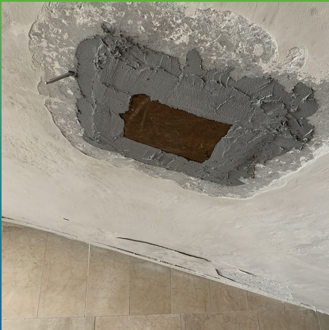
Отверстия с замененным металлическим листом, зачеканенные составом Манопокс 331