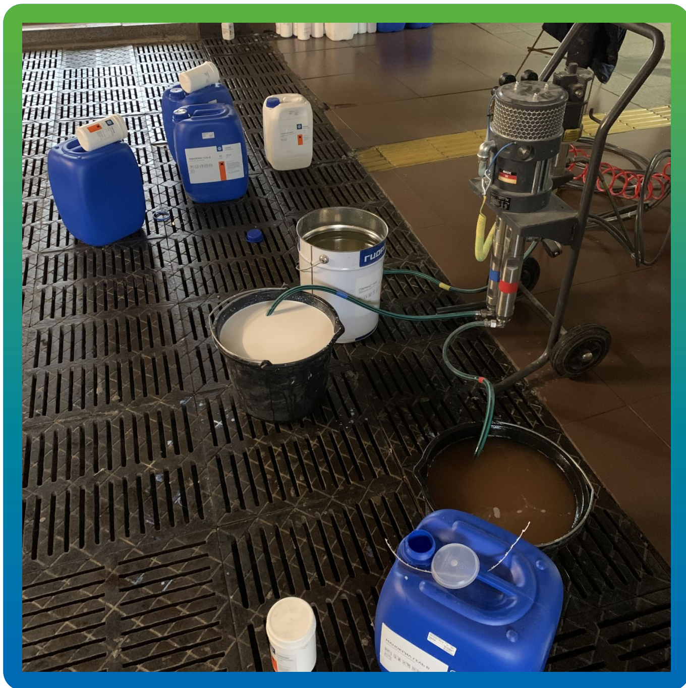
Материал, подготовленный к работе