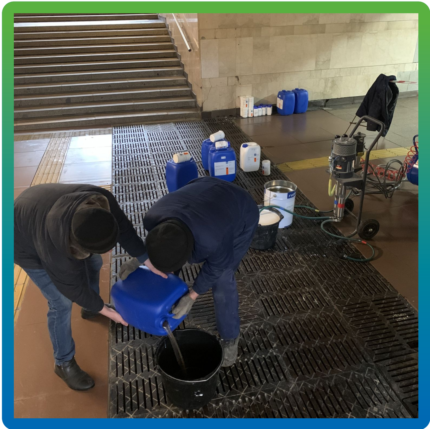
Смешивание компонентов геля