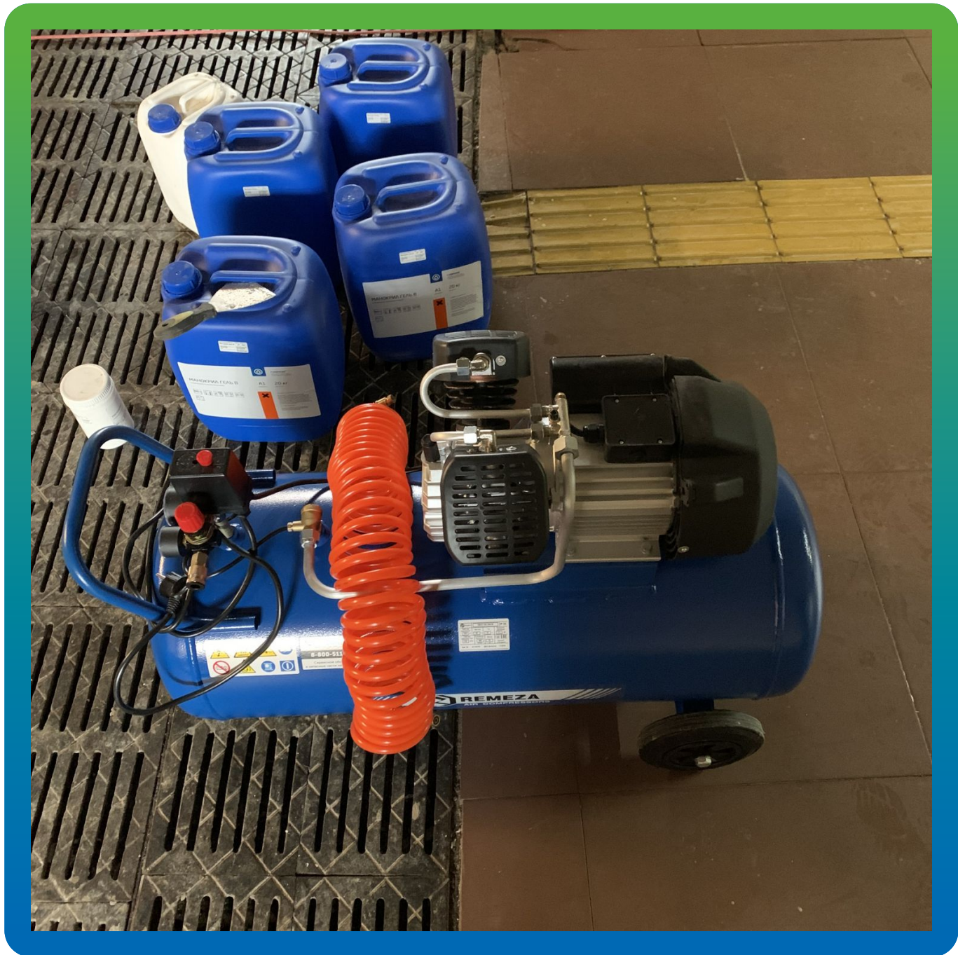
Подготовка материала и оборудования