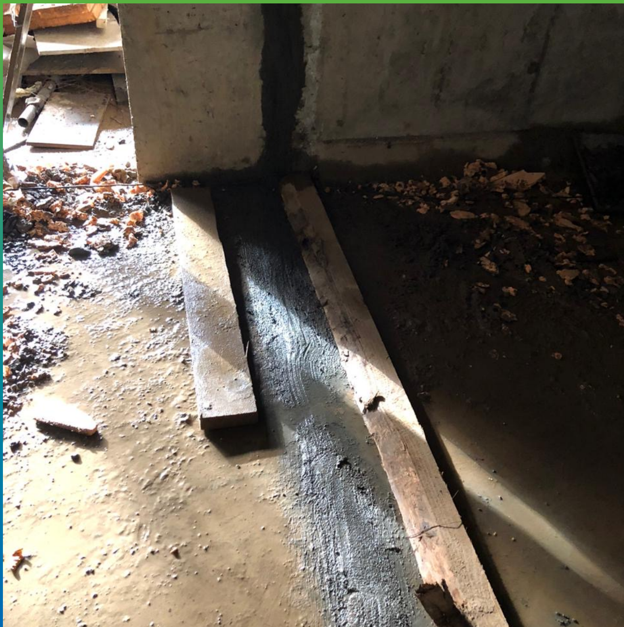
Вид после гидроизоляции шва Манопур С