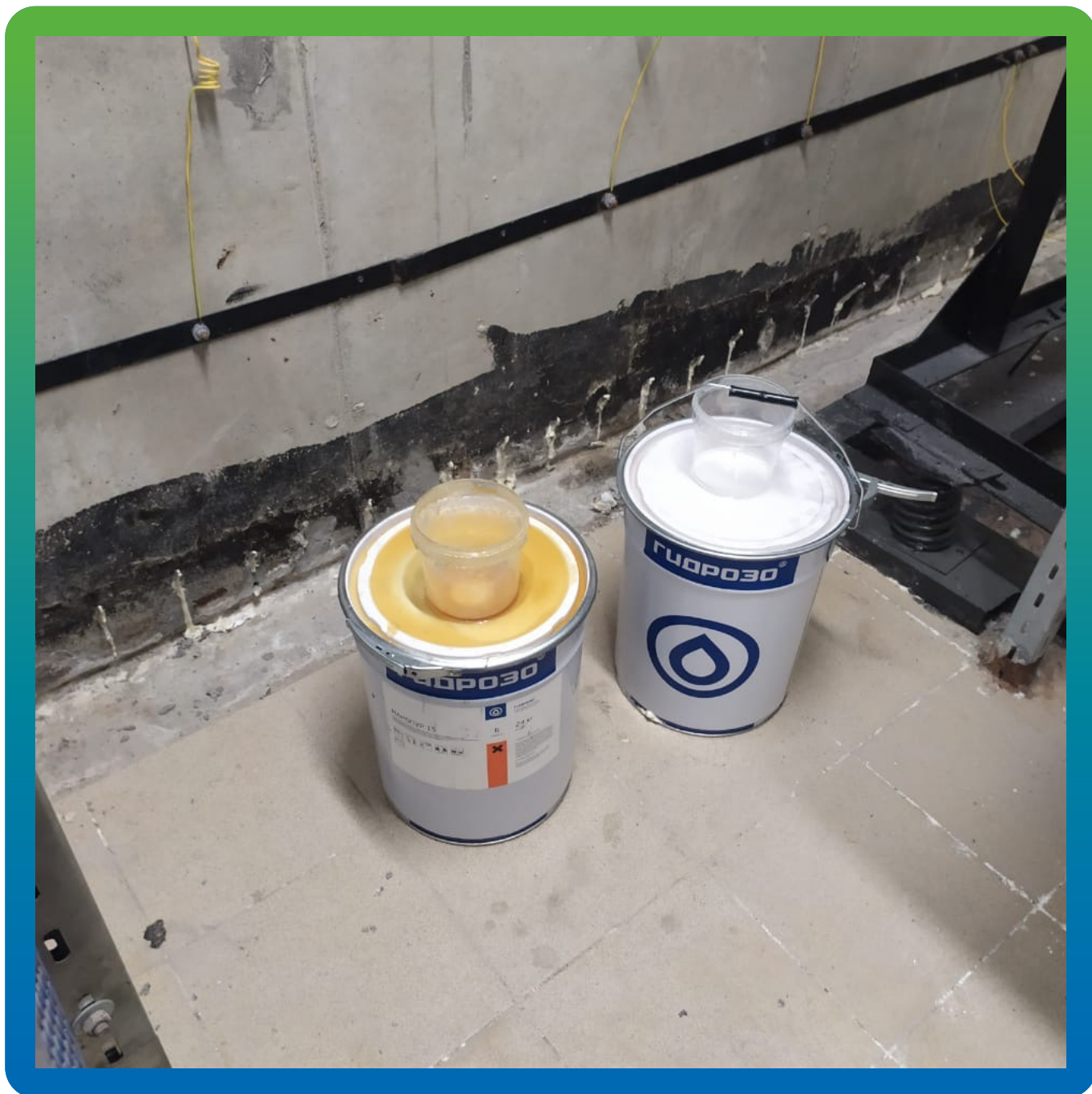
Вид после прокатки шва манопур 15