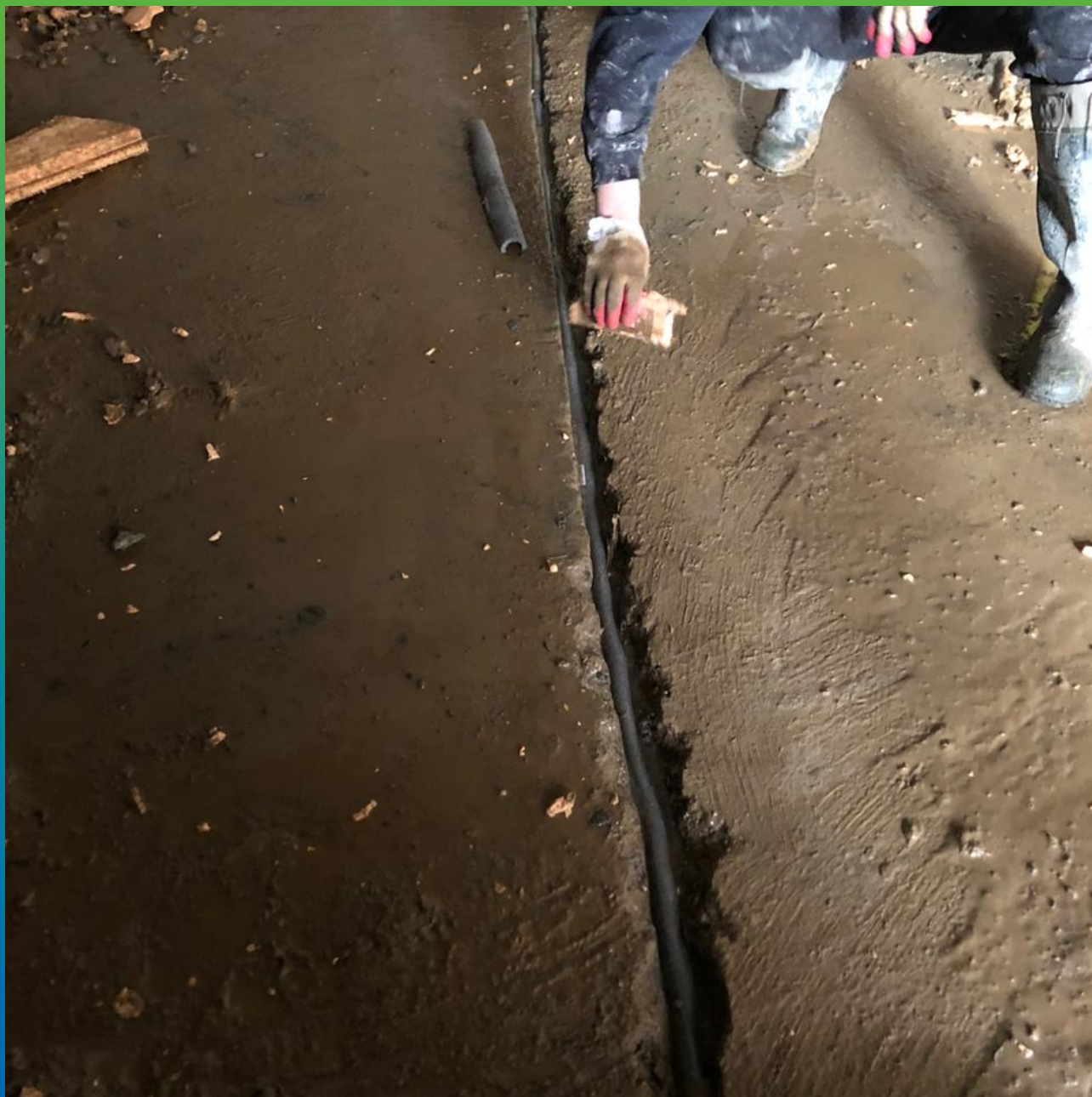
Подготовка к гидроизоляции.