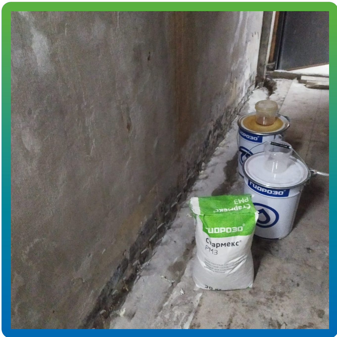
Вид после ремонта шва примыканий. Манопур 15, Стармекс РМЗ