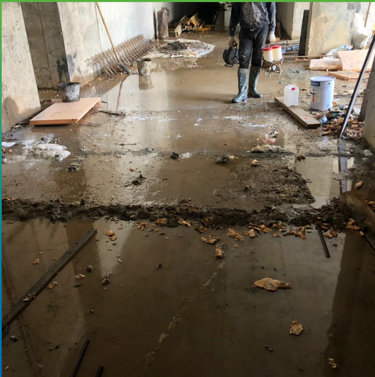
Подготовка к гидроизоляции.