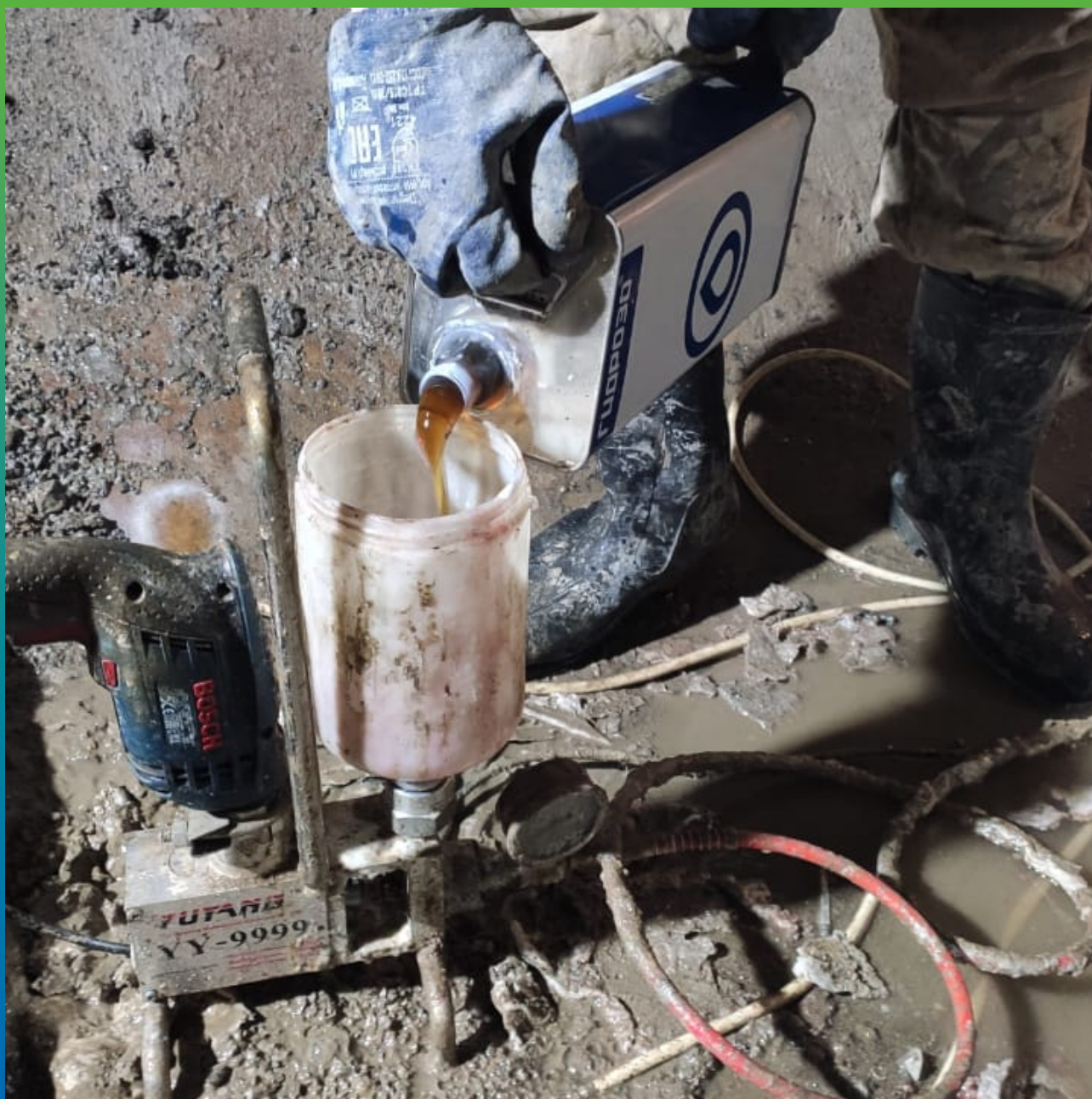
Заливка Манопур У Флекс в однокомпонентный насос.