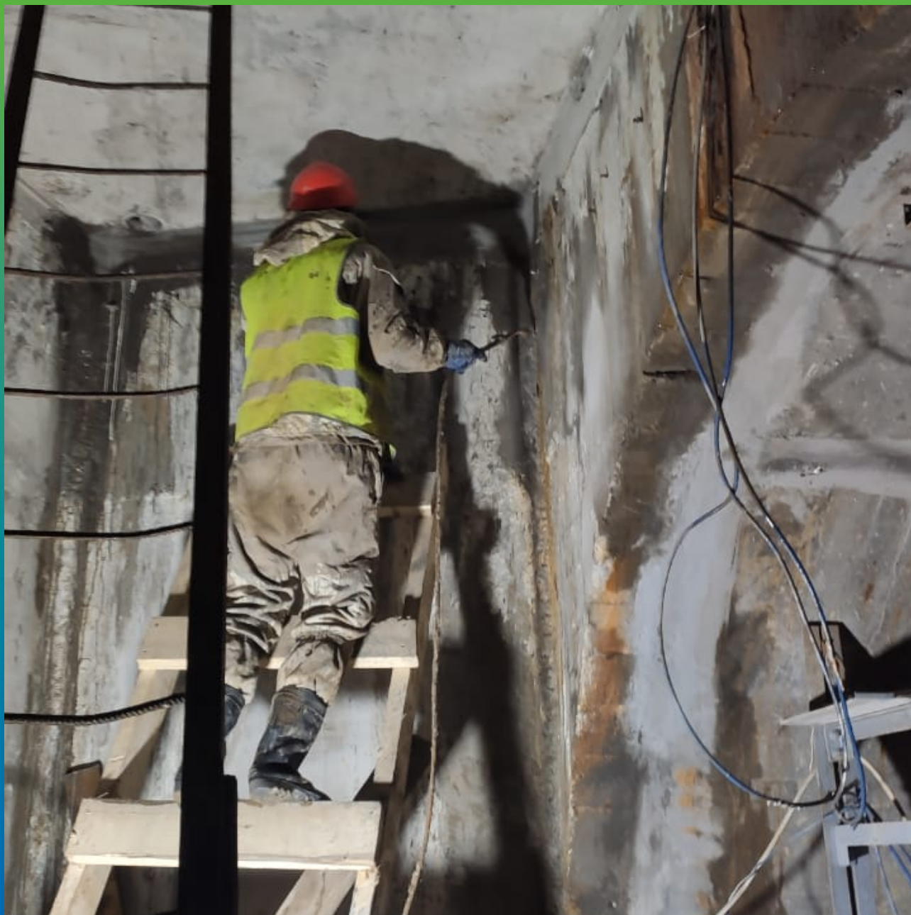
Инъектирование Манопур У Флекс