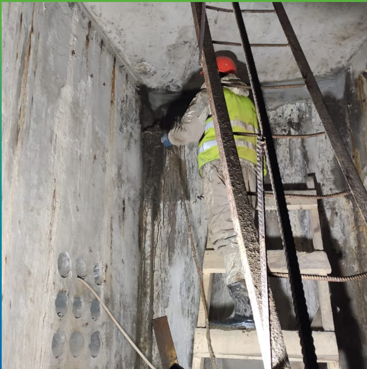
Инъектирование Манопур У Флекс