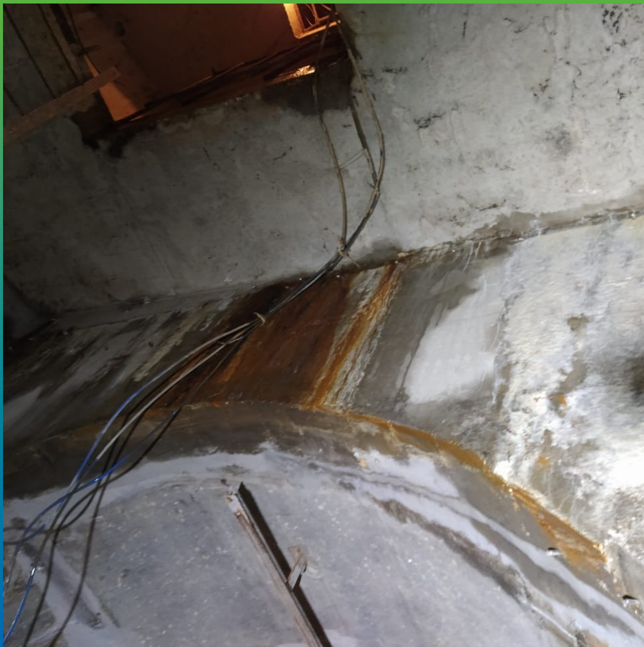
Проблемные зоны намокания.