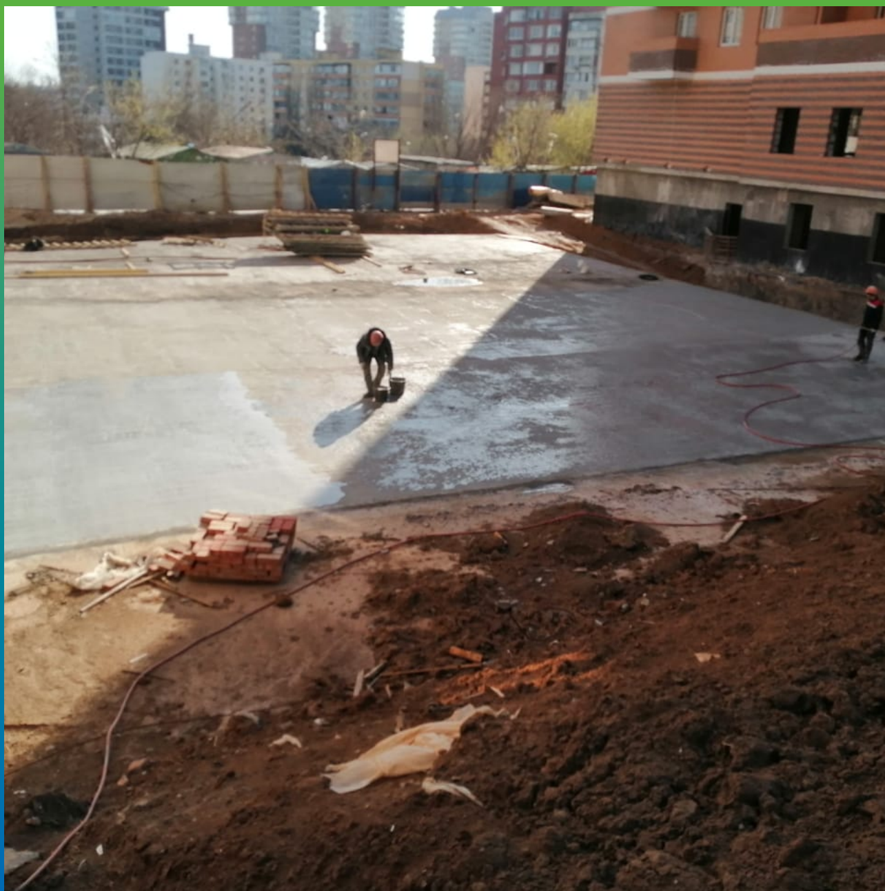
В процессе нанесения Стармекс Сил по поверхности