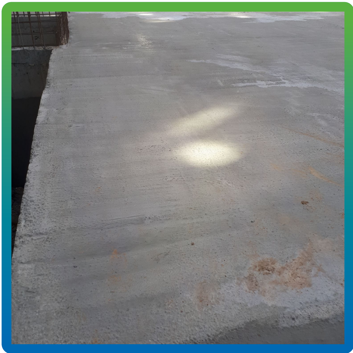
Вид плиты после покрытия Стармекс Сил