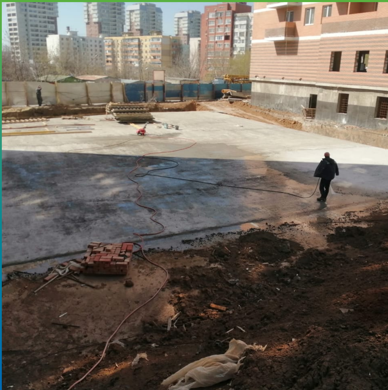
Увлажнение плиты перед нанесением гидроизоляции