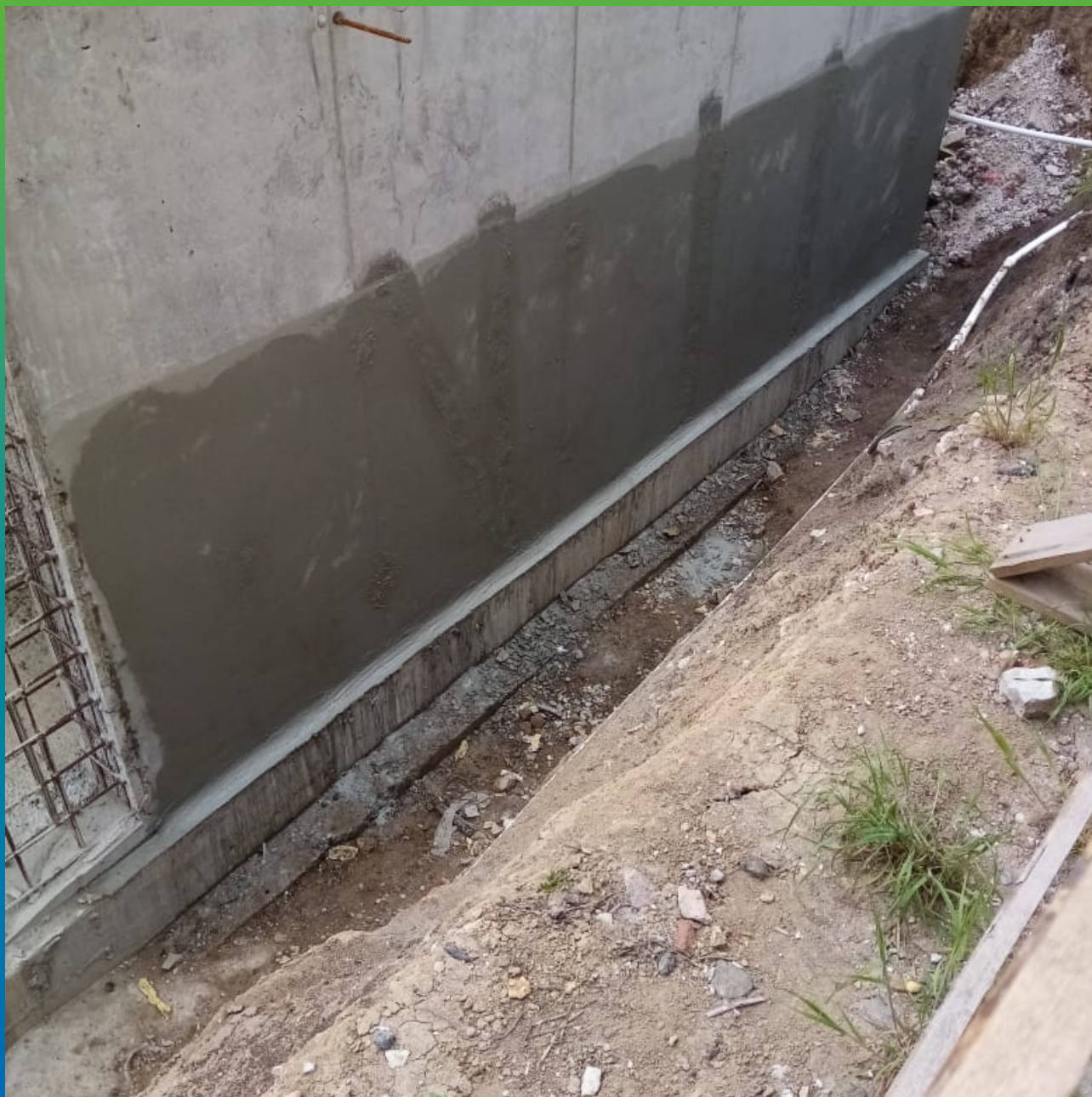
Покрытие стен составом Стармекс Сил