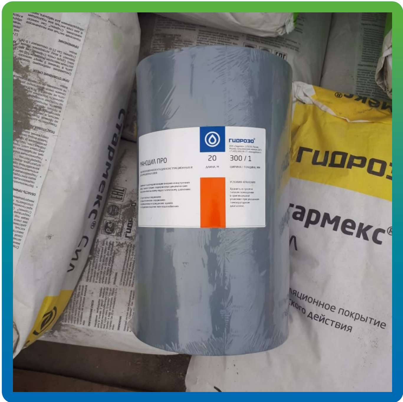
Лента для устройства деф. швов Манодил Про