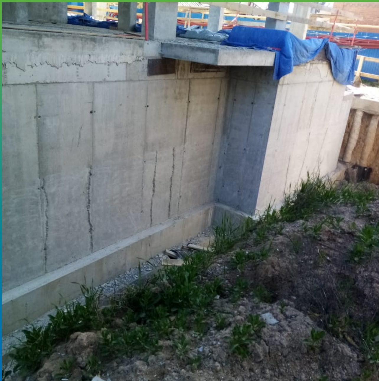
Расшивка трещин и примыкания плита-стена