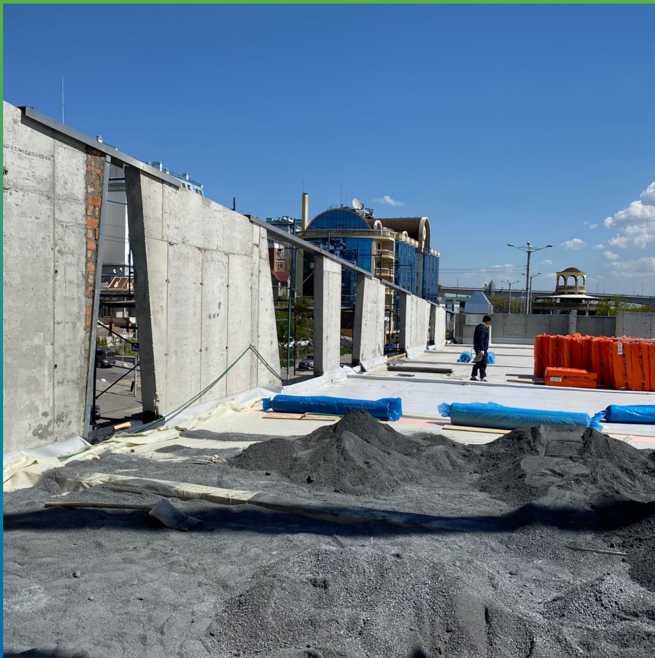
Общий вид верхнего этажа с проемами