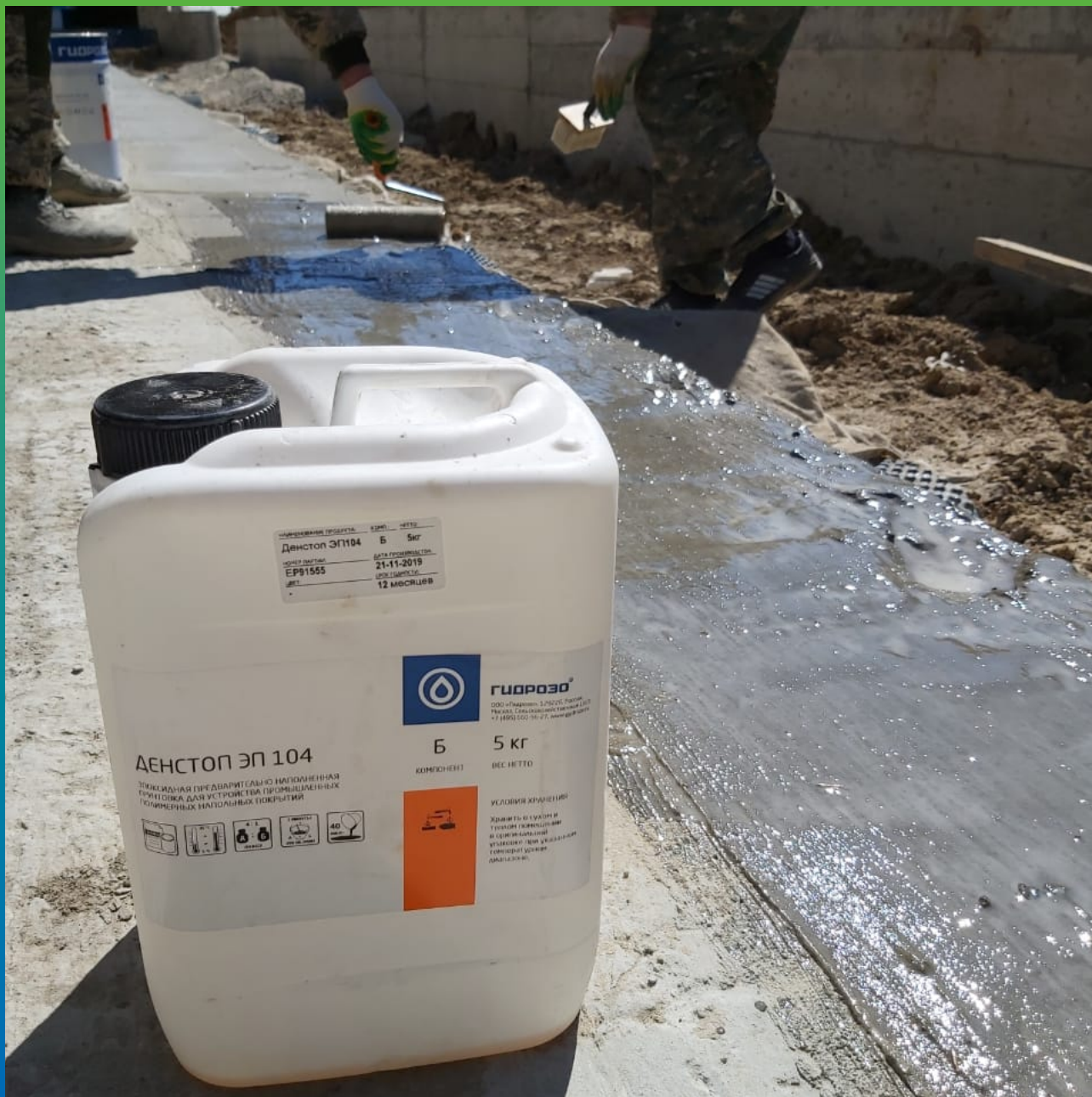
Компонент Б грунтовочного состава ДенТоп ЭП 104