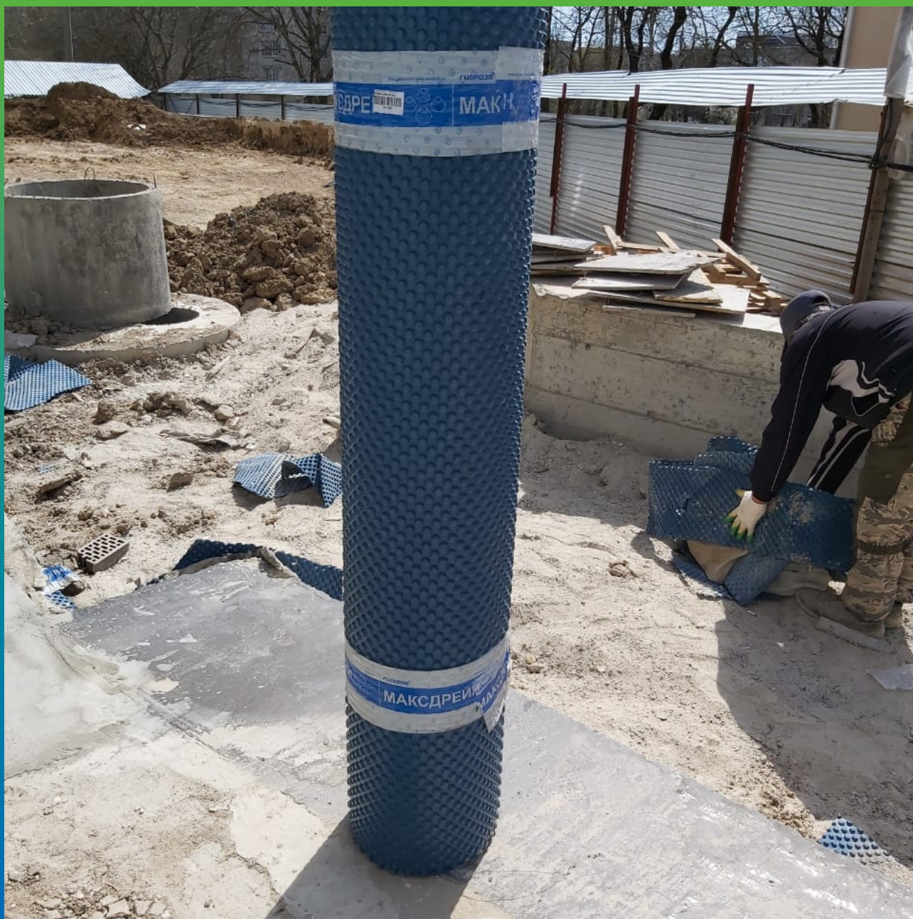
Профилированная дренажная мембрана Максдрейн 8