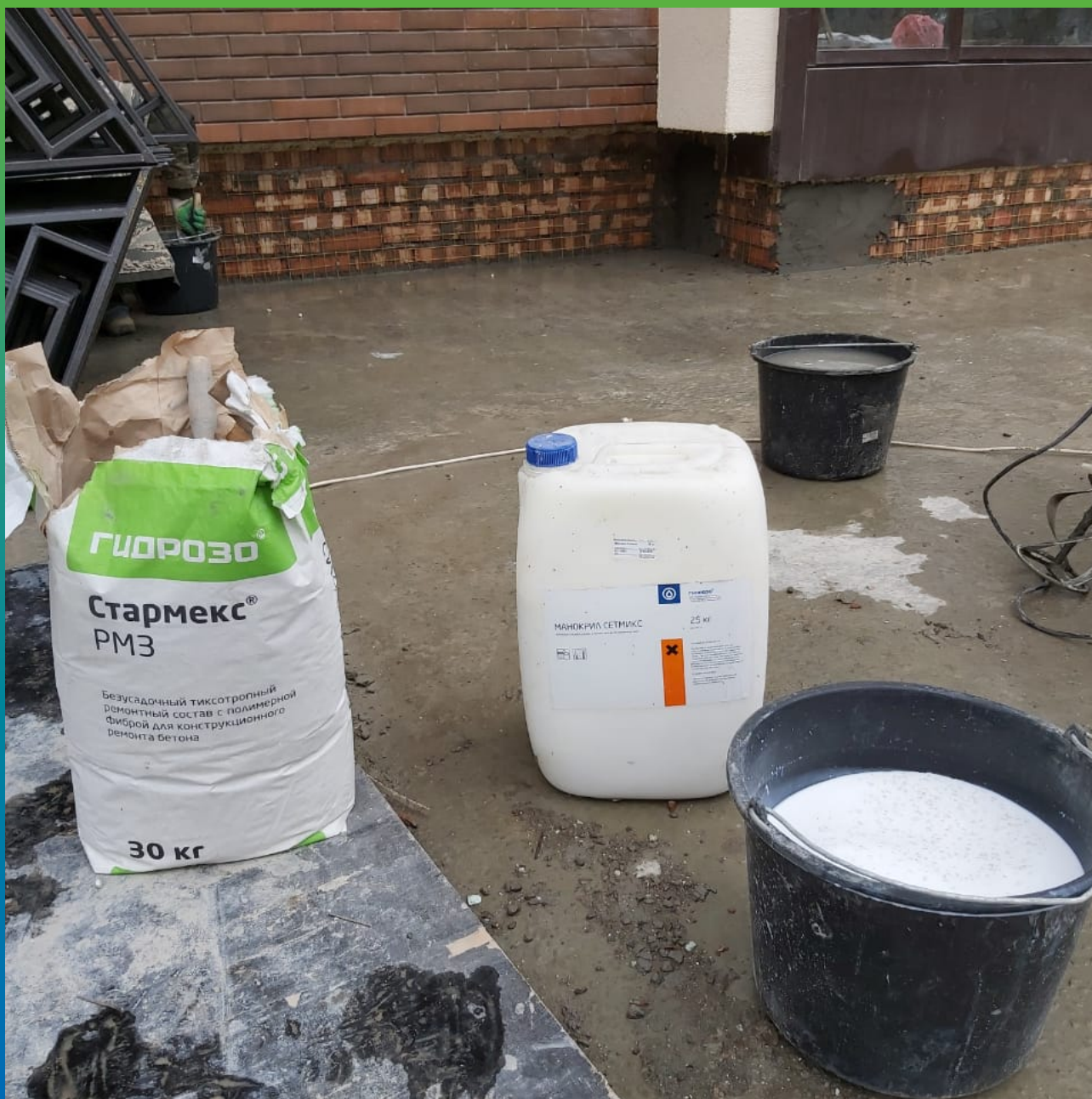
Приготовление раствора для оштукатуривания цоколя