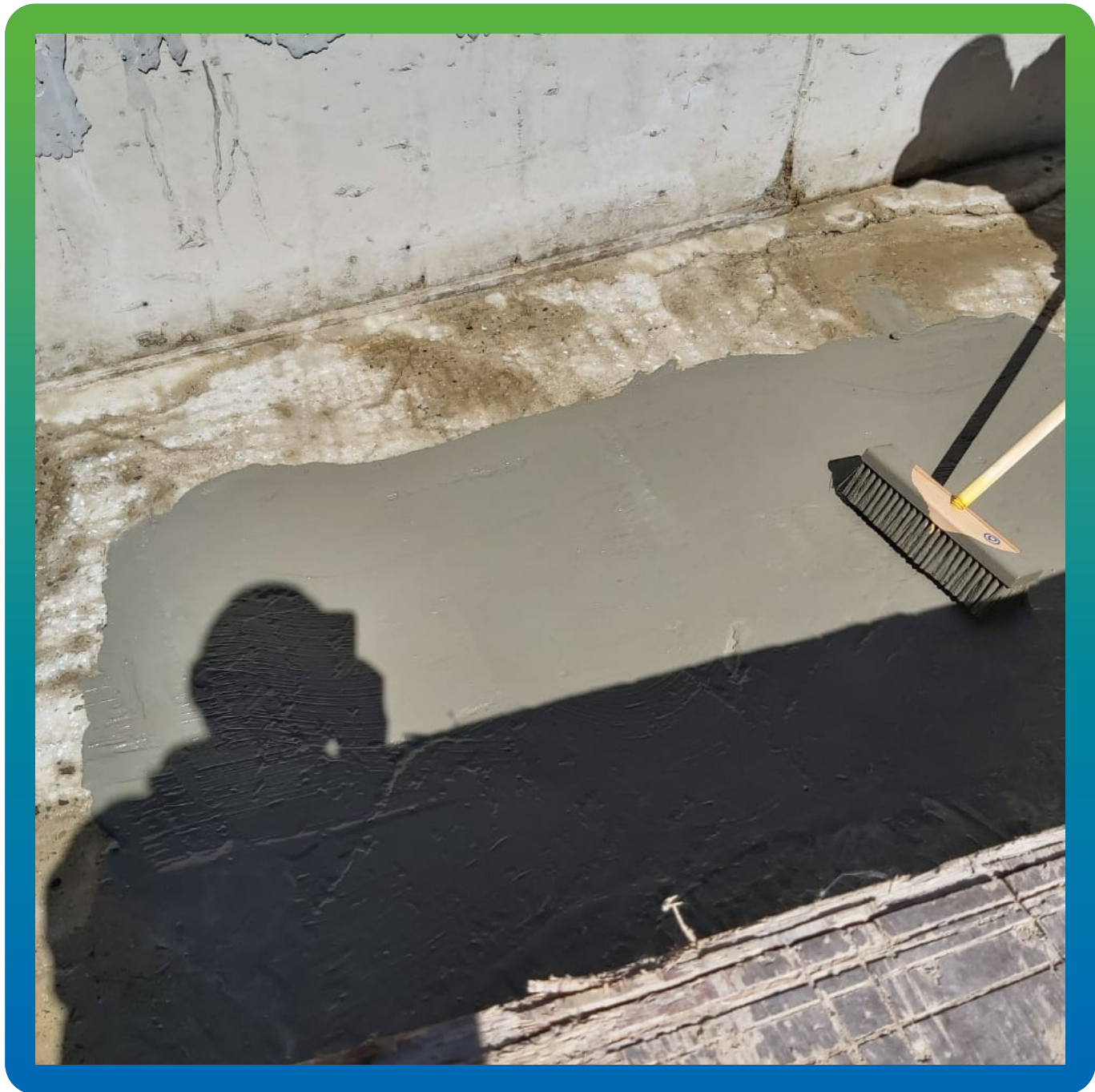
Нанесение первого слоя из смеси Стармекс 111 и Манокрил Сетмикс