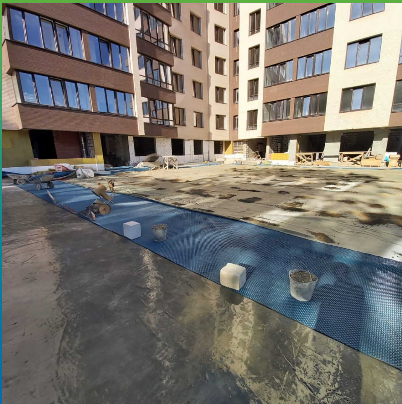
Укладка дренажного полотна Максдрейн 8