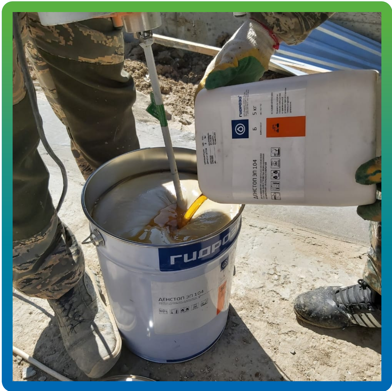
Процесс смешивания эпоксидной состава ДенСтон ЭП 104