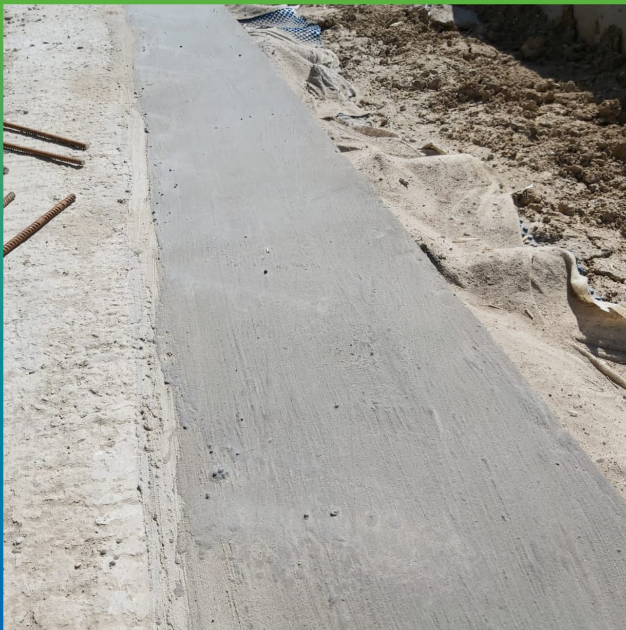
Вид покрытия после нанесения эластичного полимерцемента Стармекс Эласт