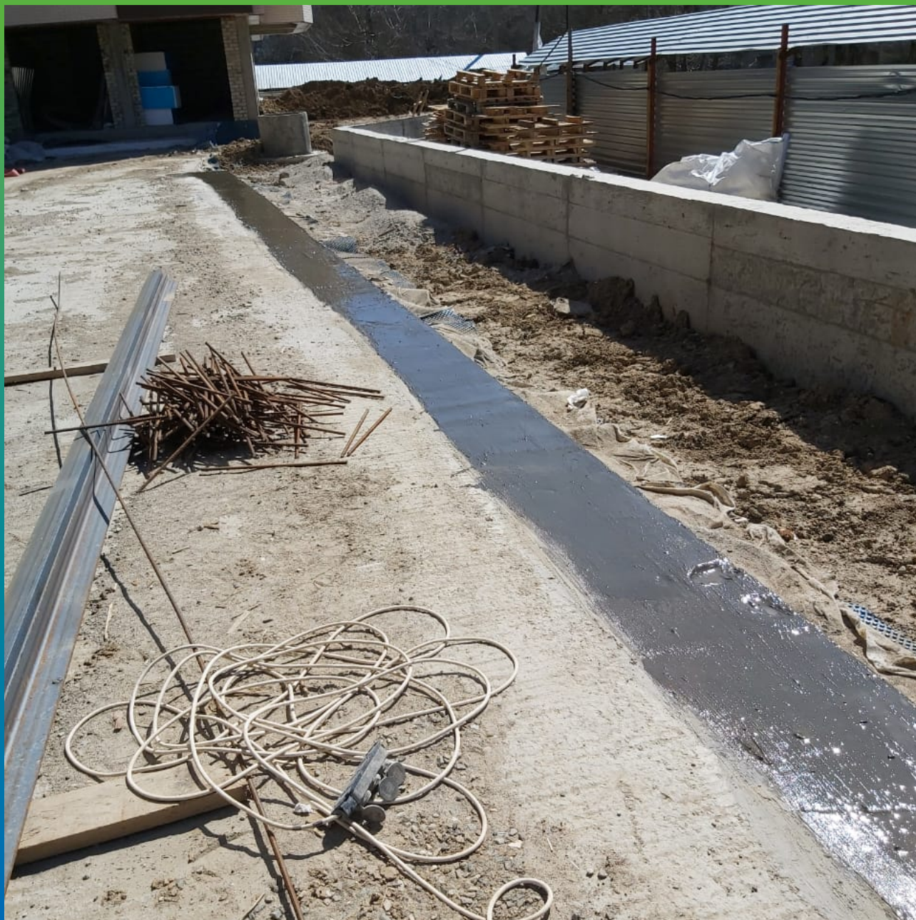
Вид покрытия после нанесения эпоксидной пропитки ДенТоп ЭП 104