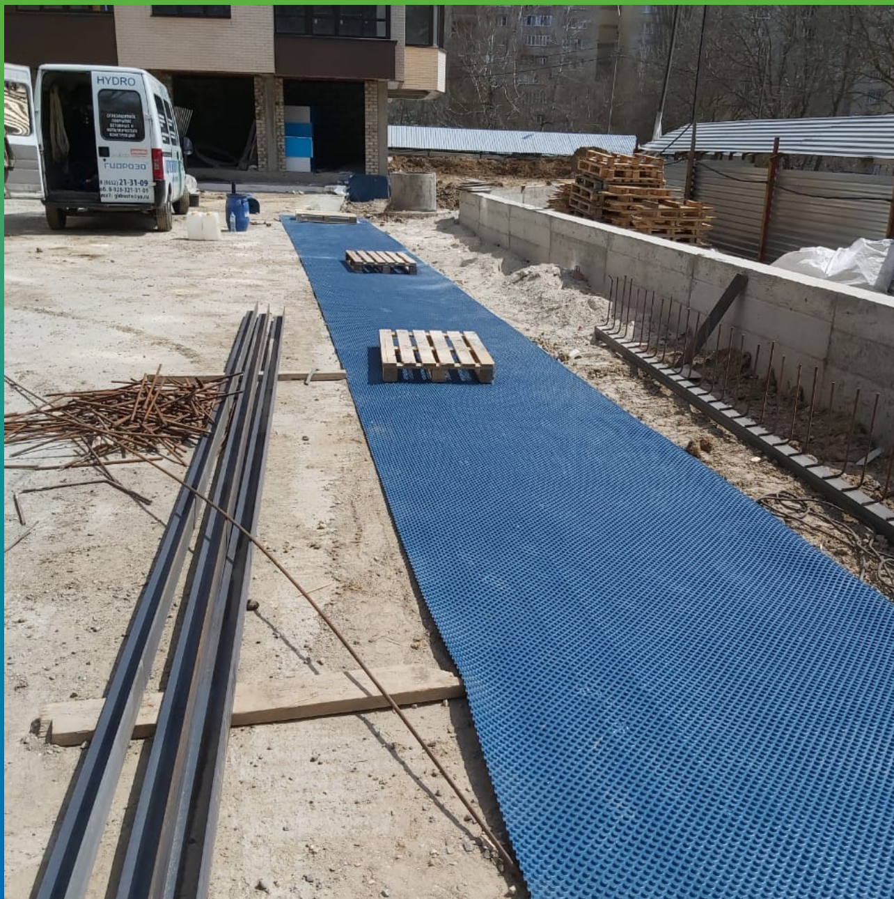
Укладка мембраны по плите