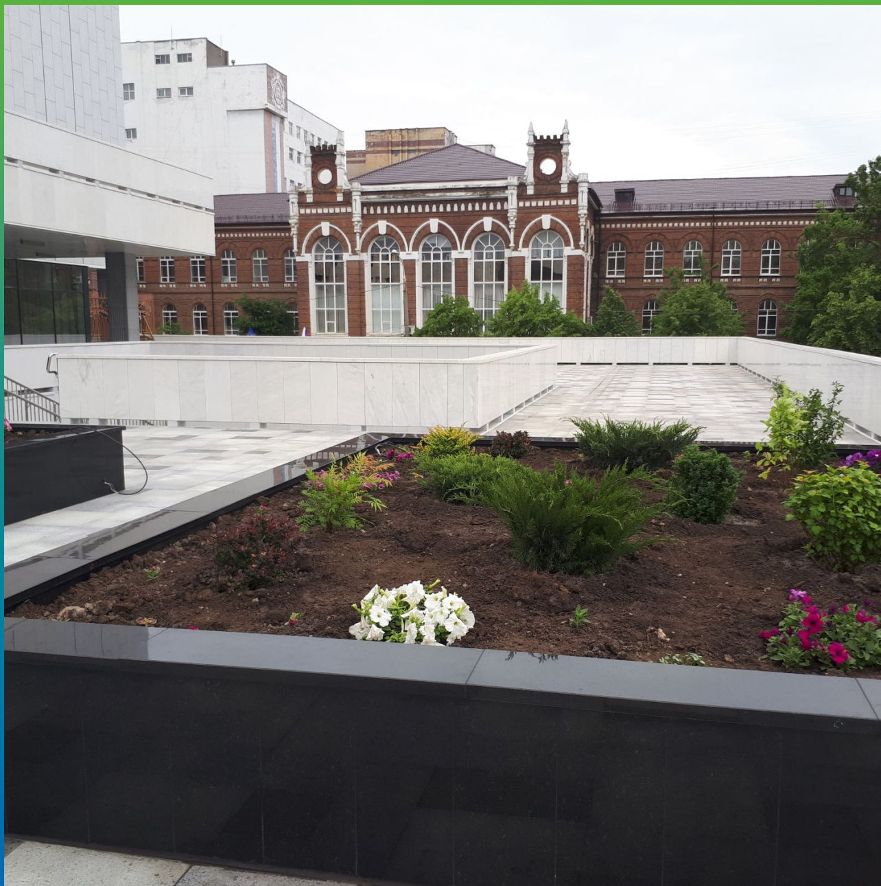
Финишный вид клумбы