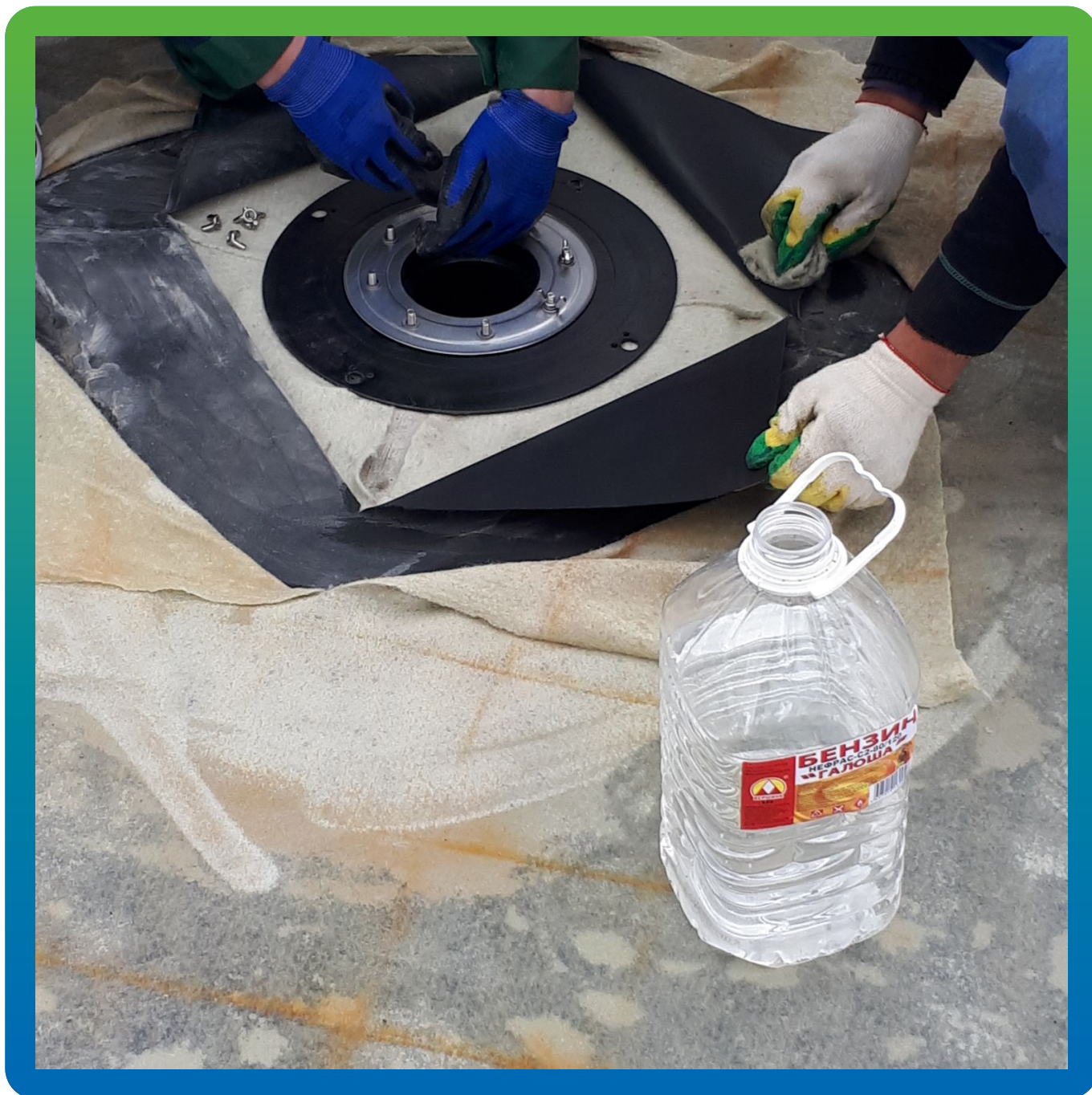
Обезжиривание ЭПДМ и лотка перед герметизацией