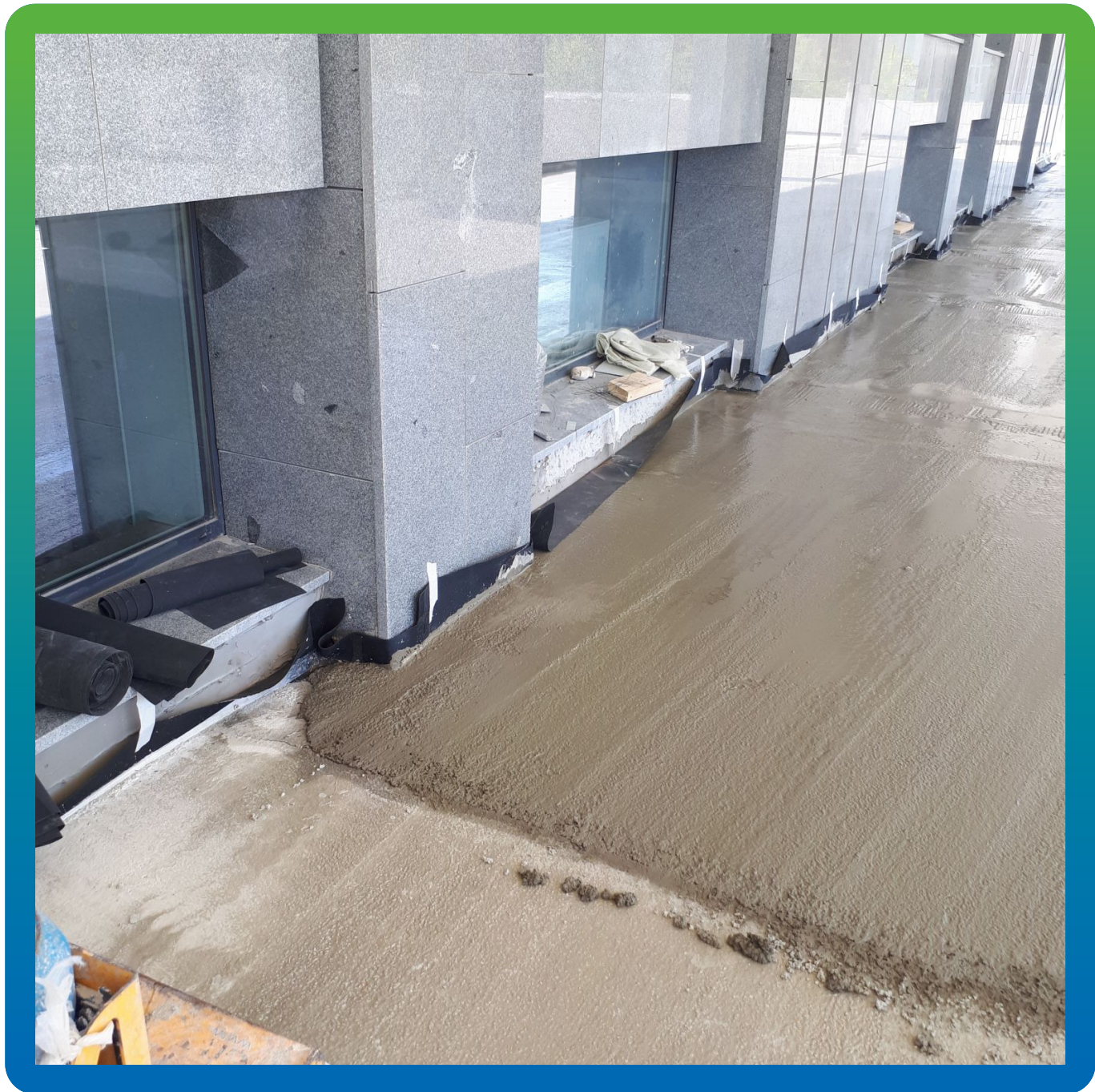
Стяжка перед укладкой гранита