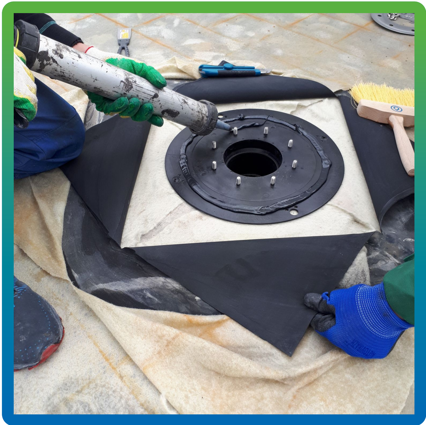
Нанесение герметика Манодил Бонд Ф на лоток