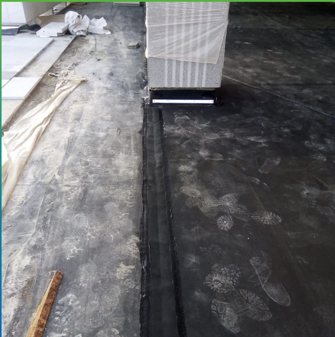
Примыкание ЭПДМ к колонне