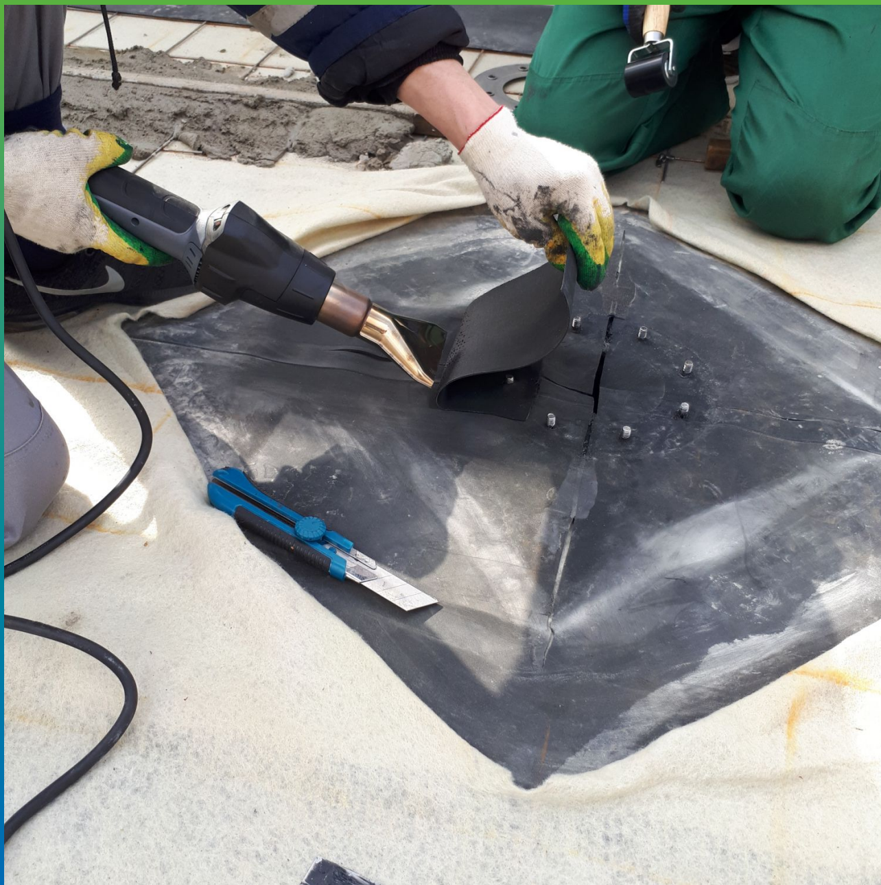
Сварка с помощью Термобонд мест резки ЭПДМ