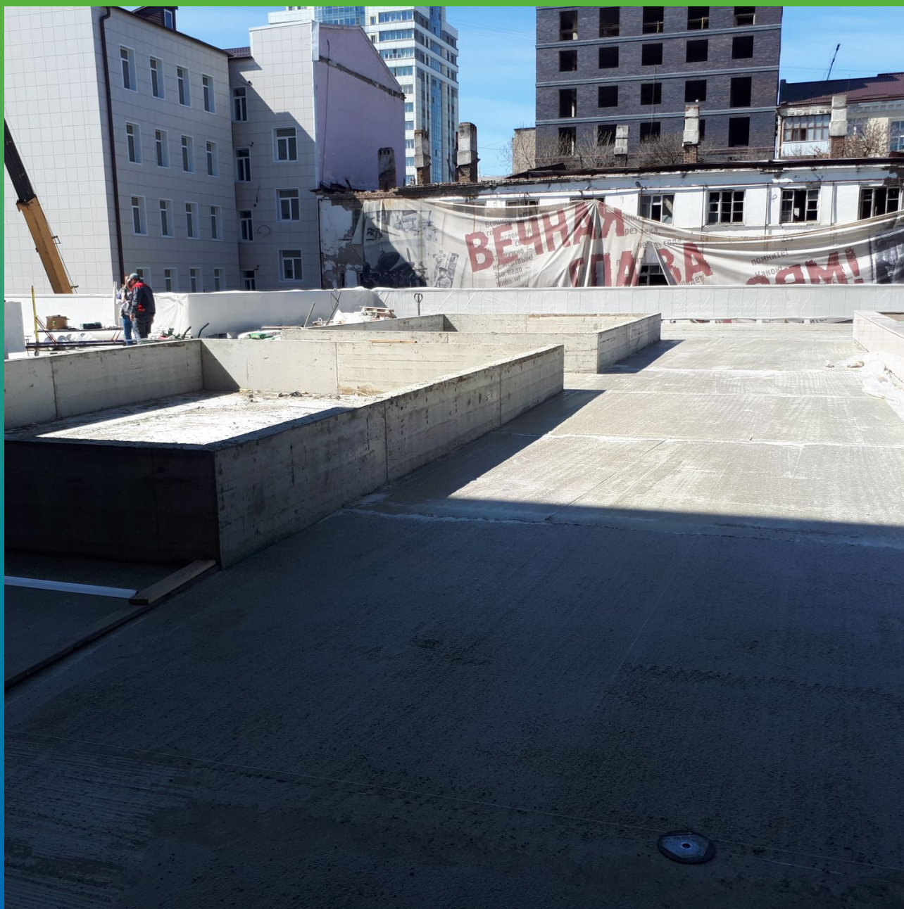
Выравнивающая стяжка перед гидроизоляцией