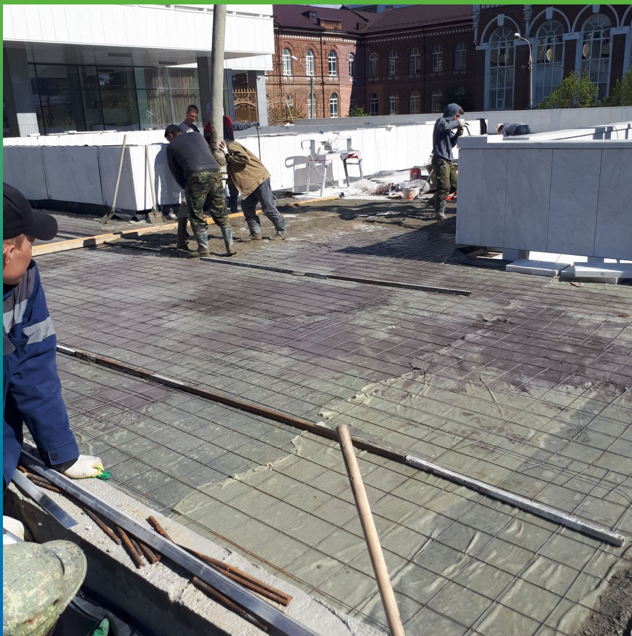
Устройство стяжки с сеткой по геотекстилю