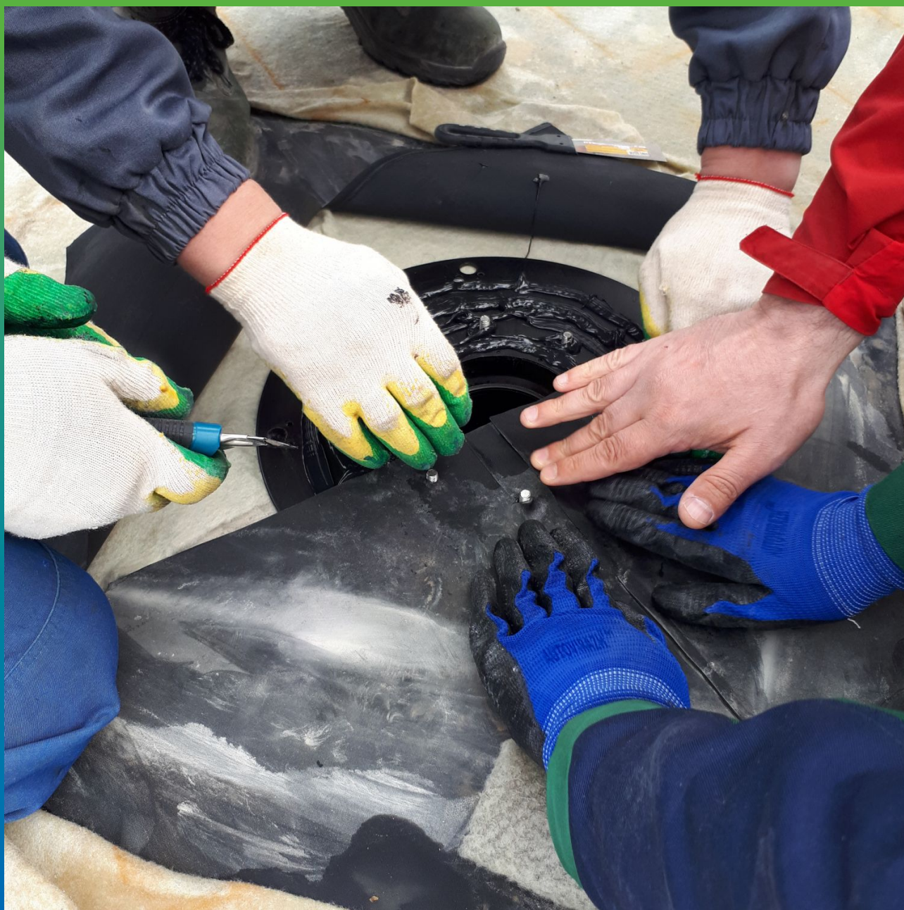
Прижим ЭПДМ к лотку