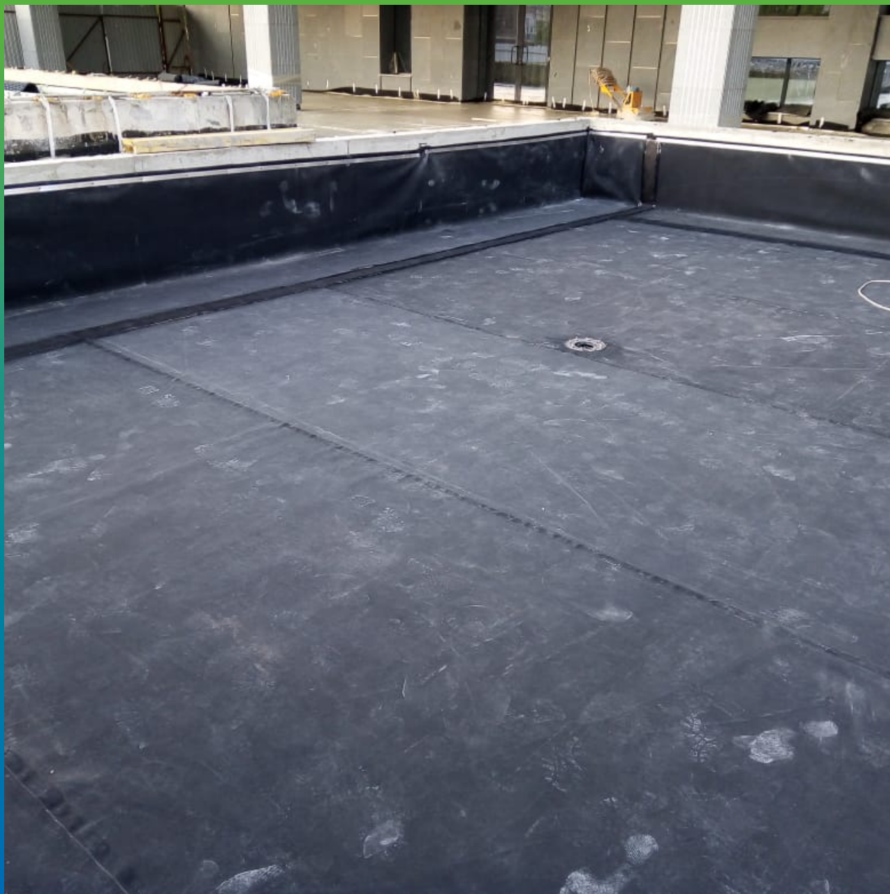
Гидроизоляция клумб с помощью ЭПДМ