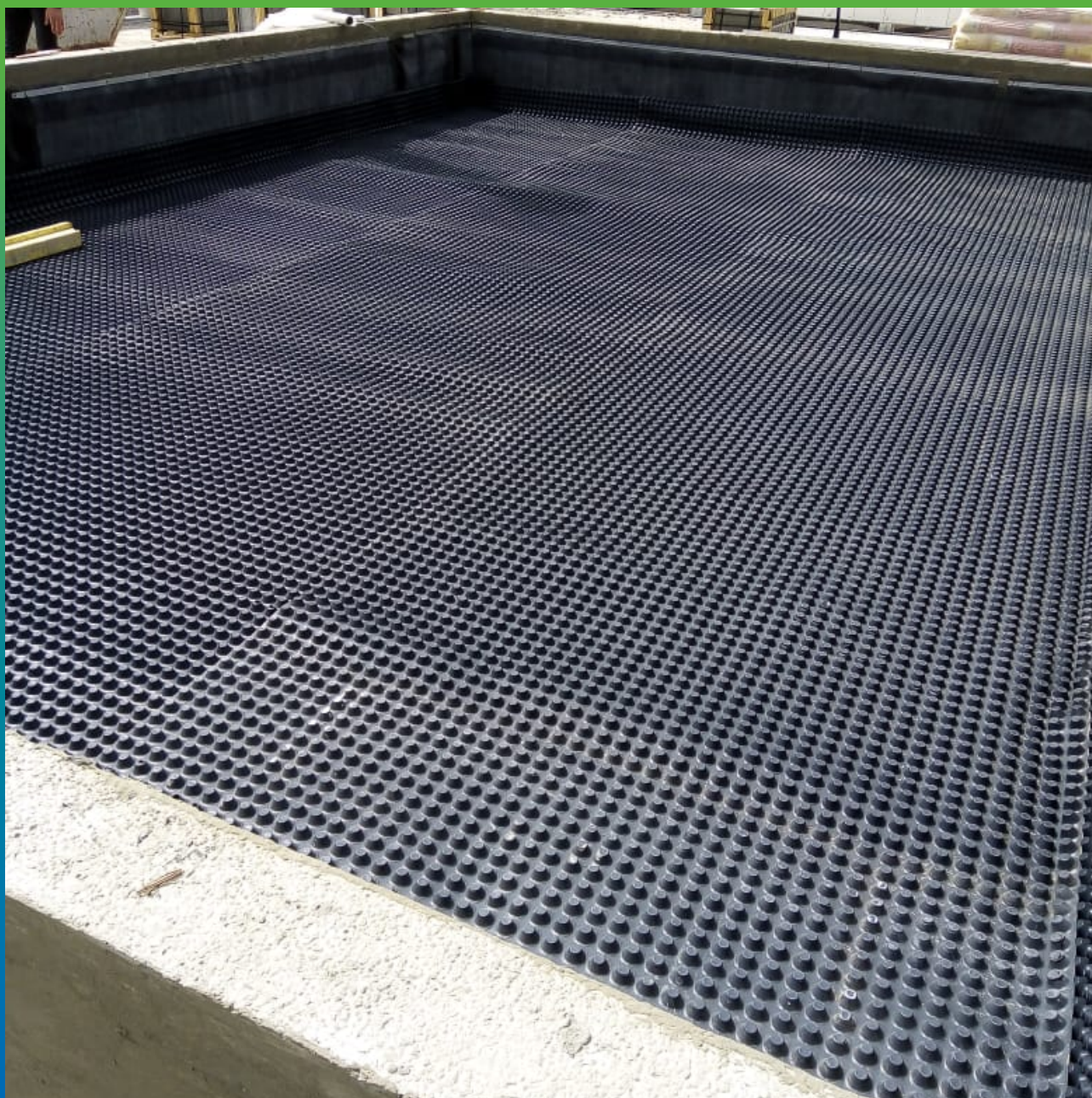
Укладка дренажной мембраны Максдрейн П20 в клумбе