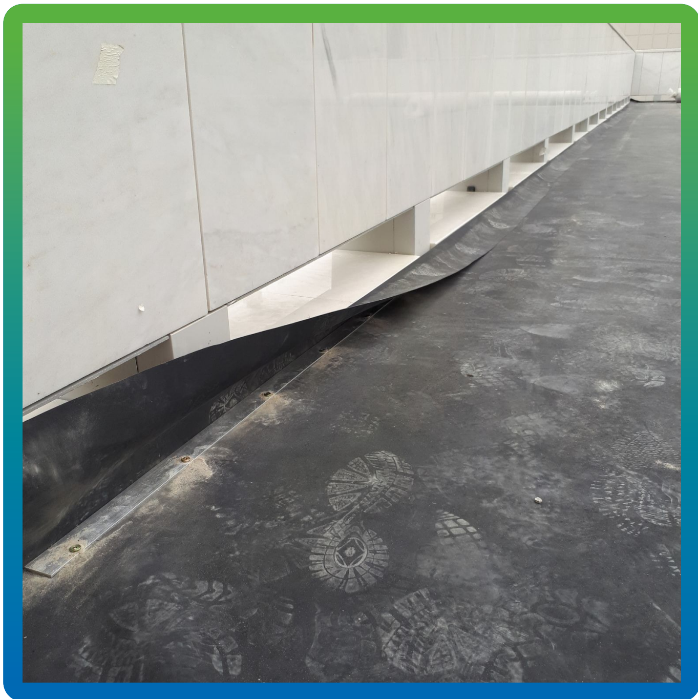
Крепление мембраны через планку по периметру