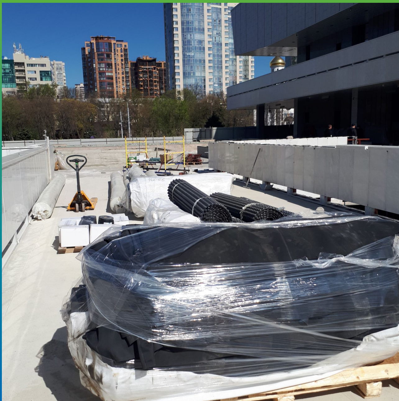
Материалы Гидрозо на объекте