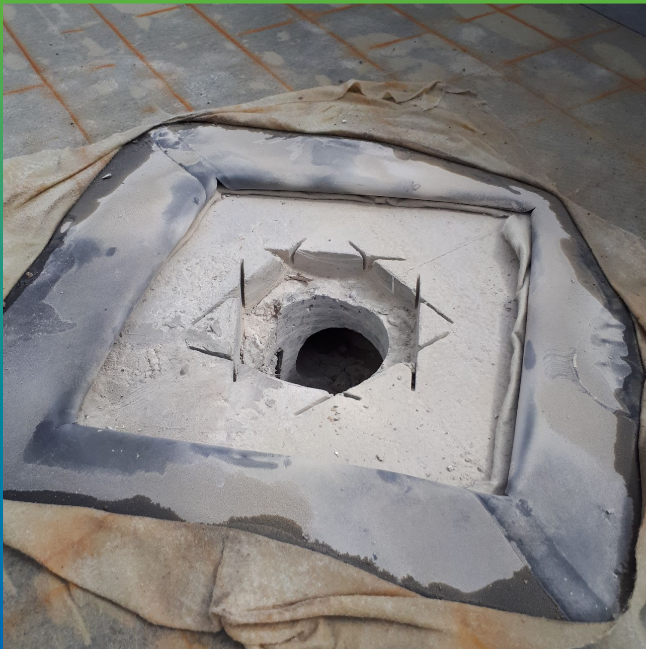
Подготовка к монтажу лотка