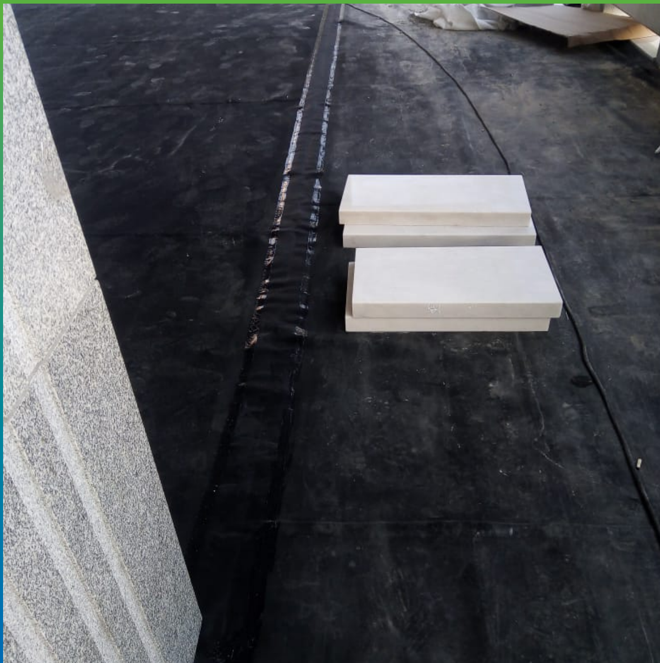
Сварка через Термобонд двух цельных полотен