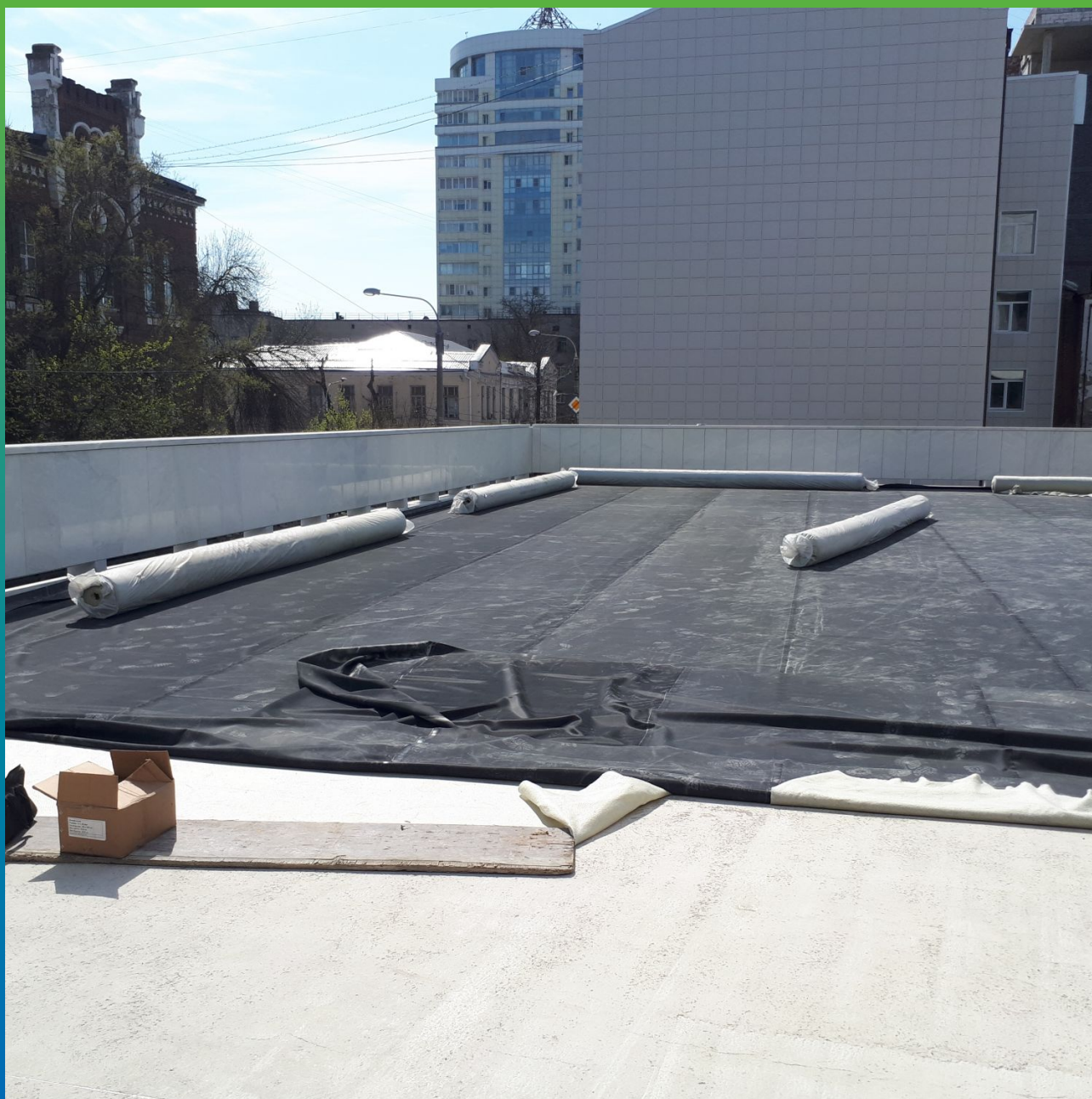
Расстиланье полотна ЭПДМ мембраны Преласта СТ 1.2 по геотекстилю