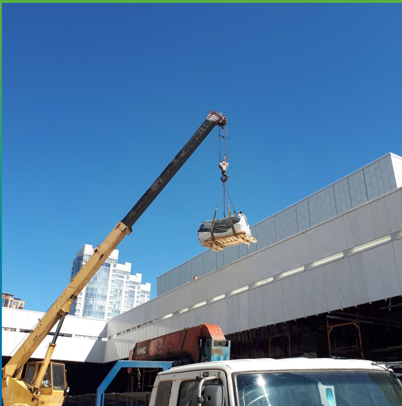
Выгрузка цельносваренных полотен ЭПДМ мембраны на объект