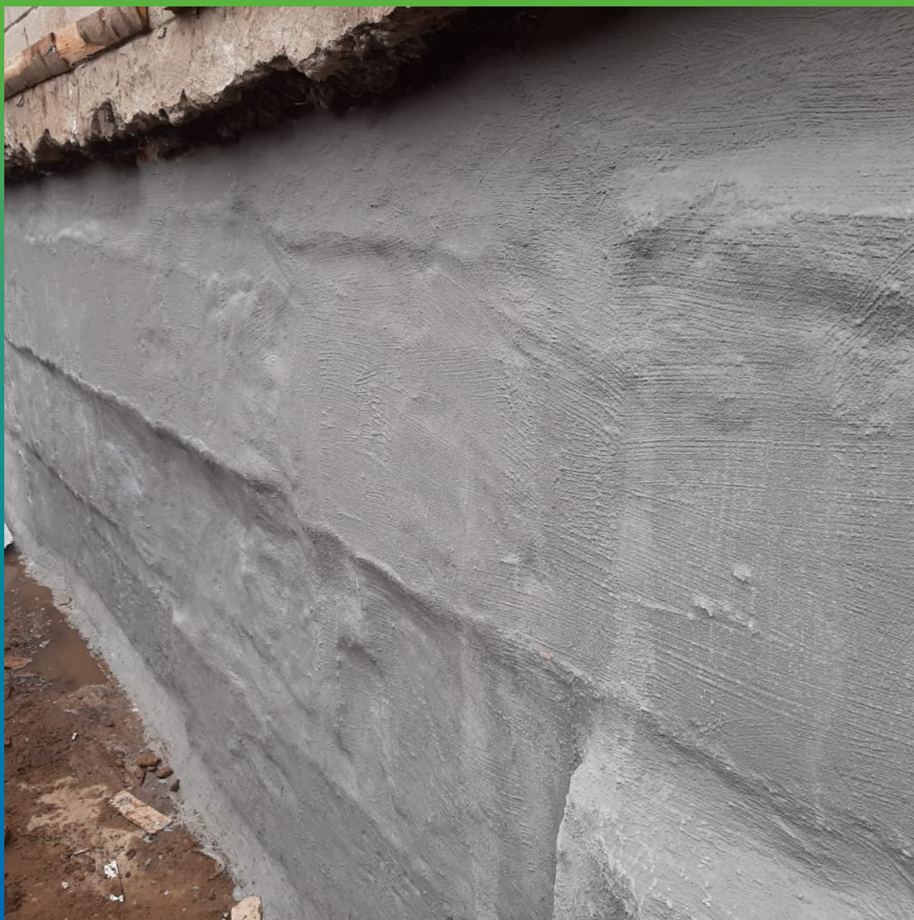
Нанесение обмазочного гидроизоляционного состава Стармекс Сил Флекс.