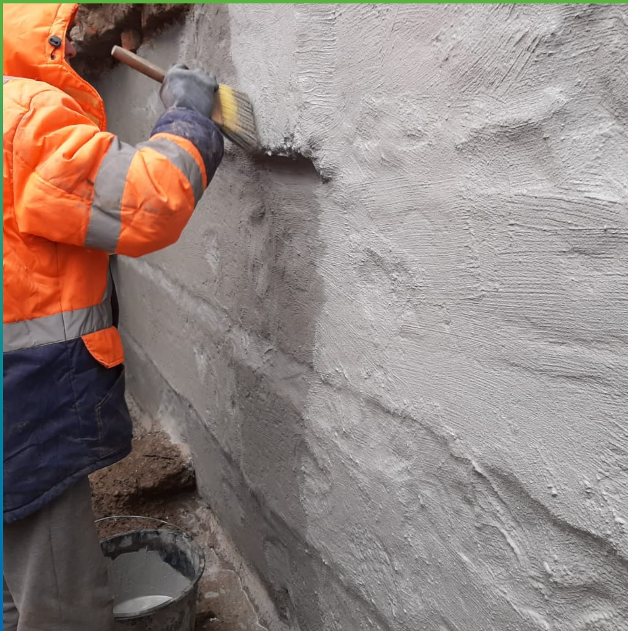
Нанесение обмазочного гидроизоляционного состава Стармекс Сил Флекс.