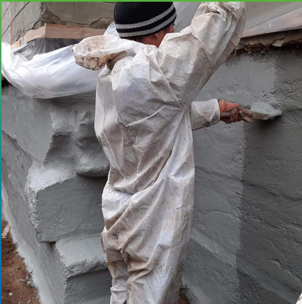
Нанесение обмазочного гидроизоляционного состава Стармекс Сил Флекс.