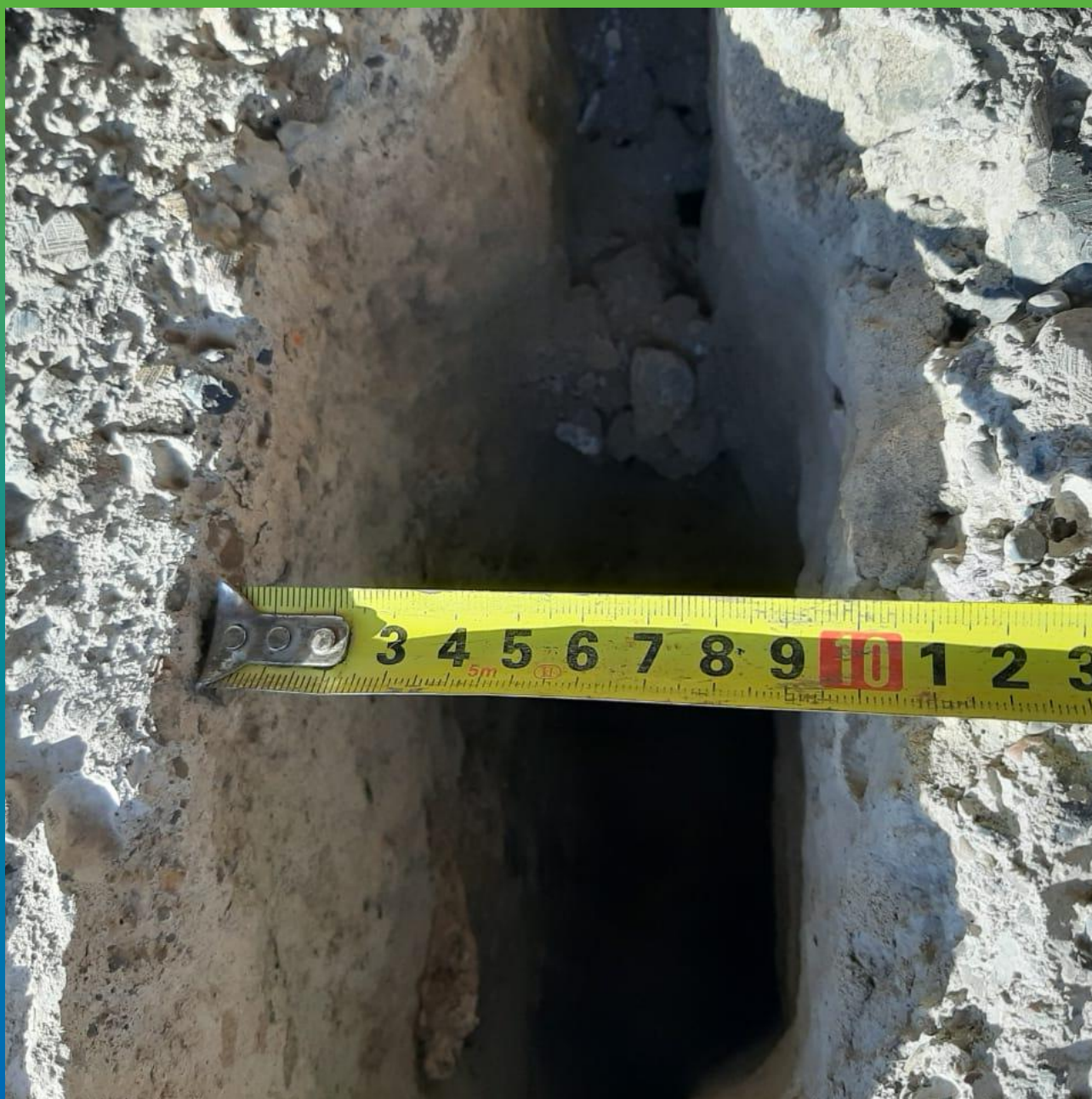
Первоначальный вид дефектов