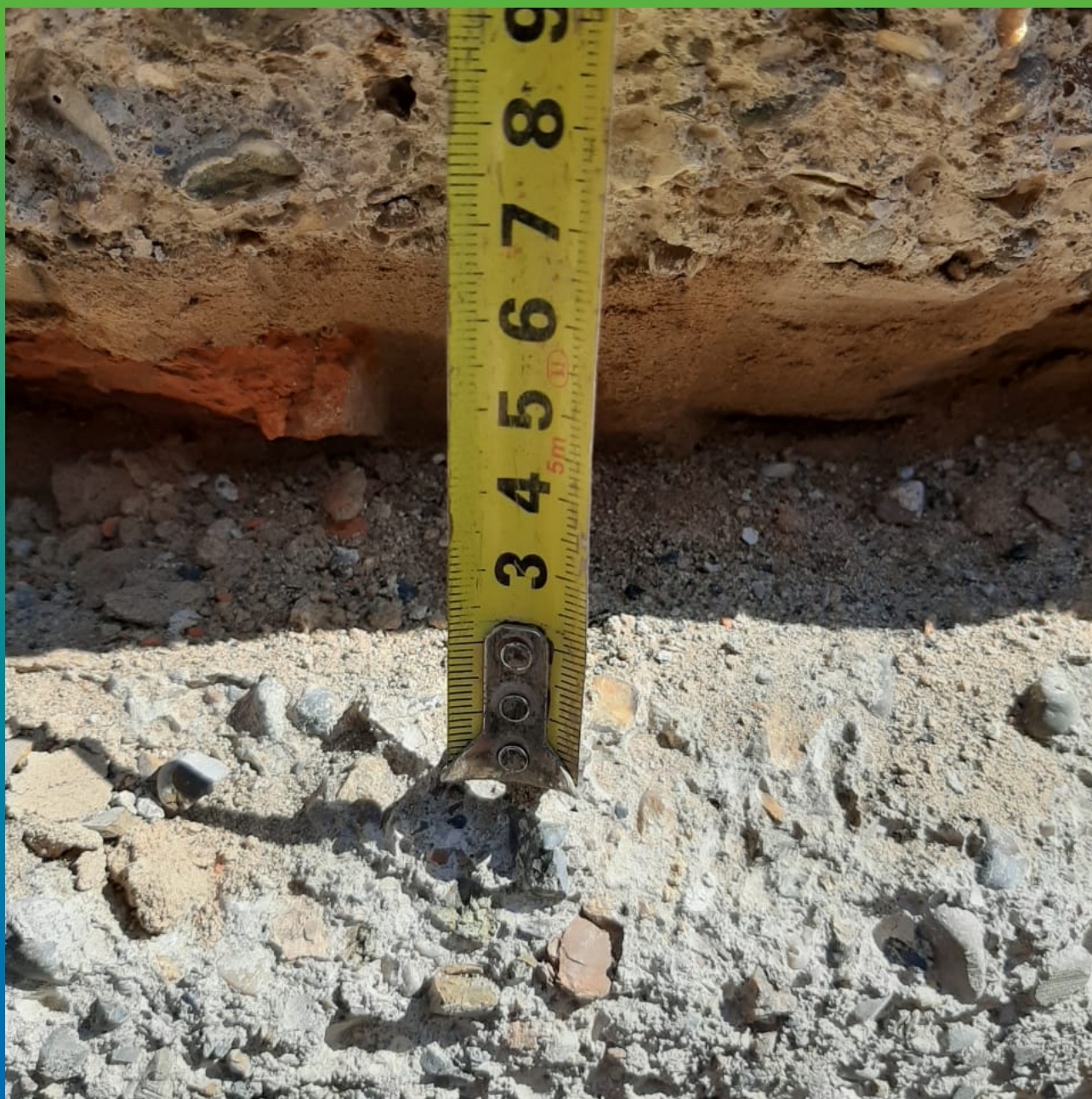
Первоначальный вид дефектов