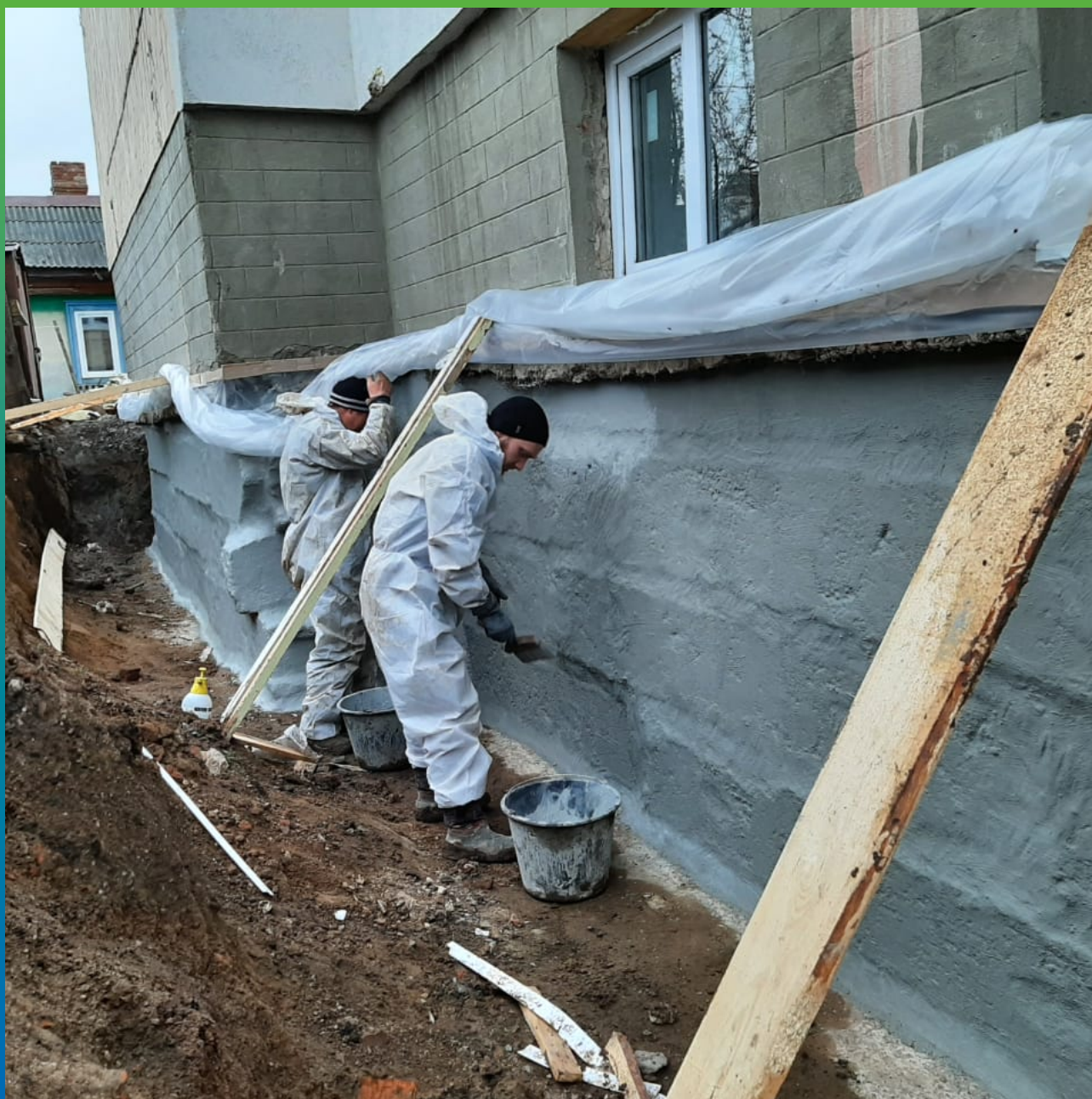
Выполненная гидроизоляция блочного фундамента.