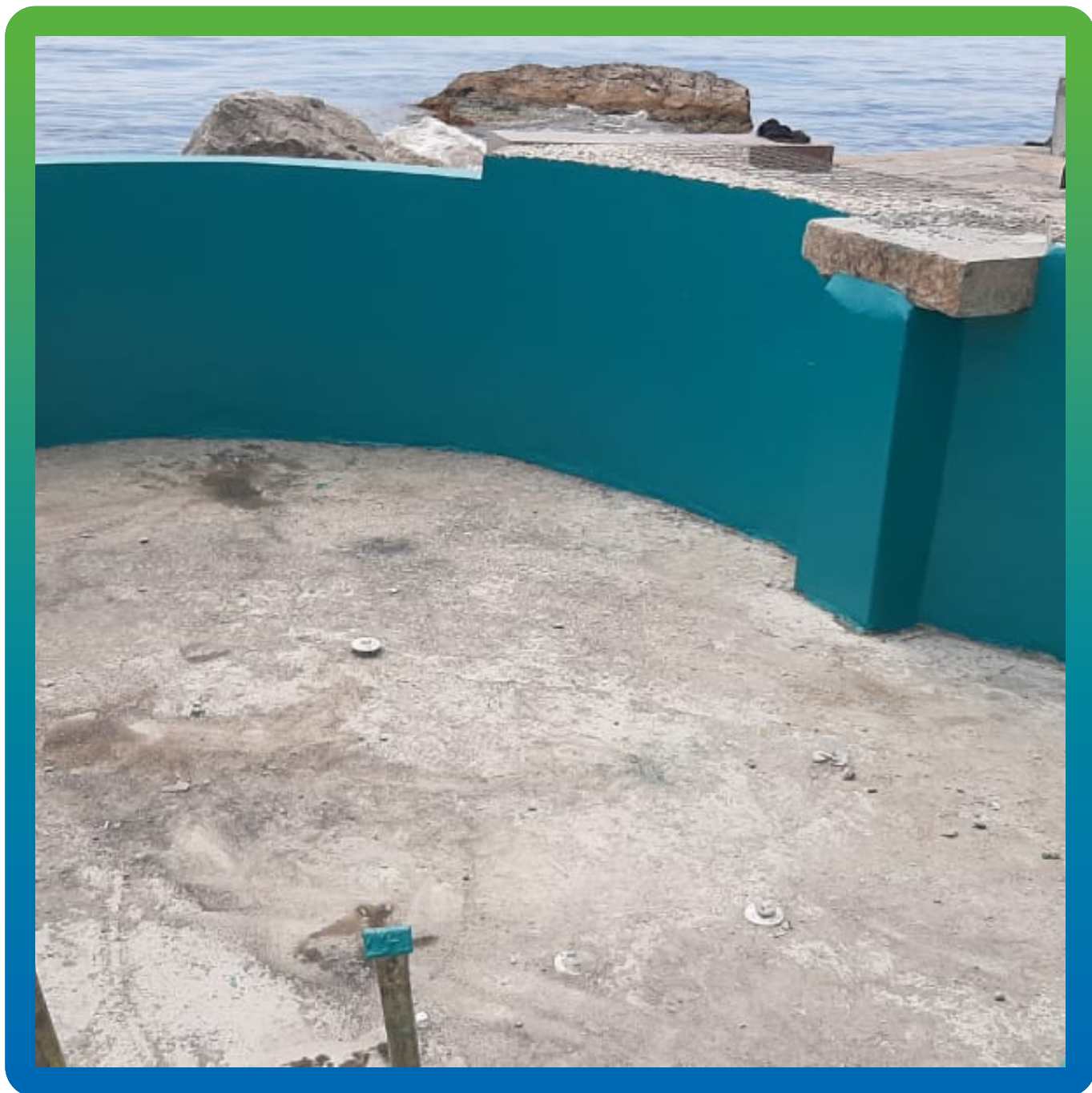
Нанесение эпоксидного гидроизоляционного покрытия ДенсТоп ЭП 201