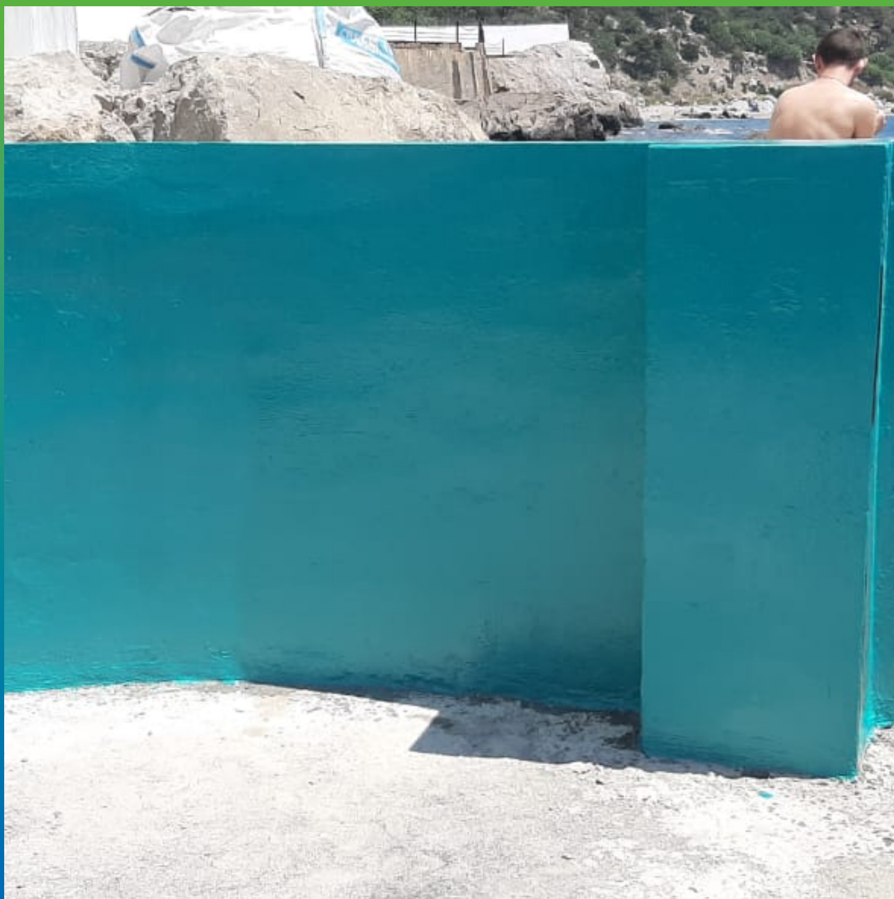
Нанесение эпоксидного гидроизоляционного покрытия ДенсТоп ЭП 201