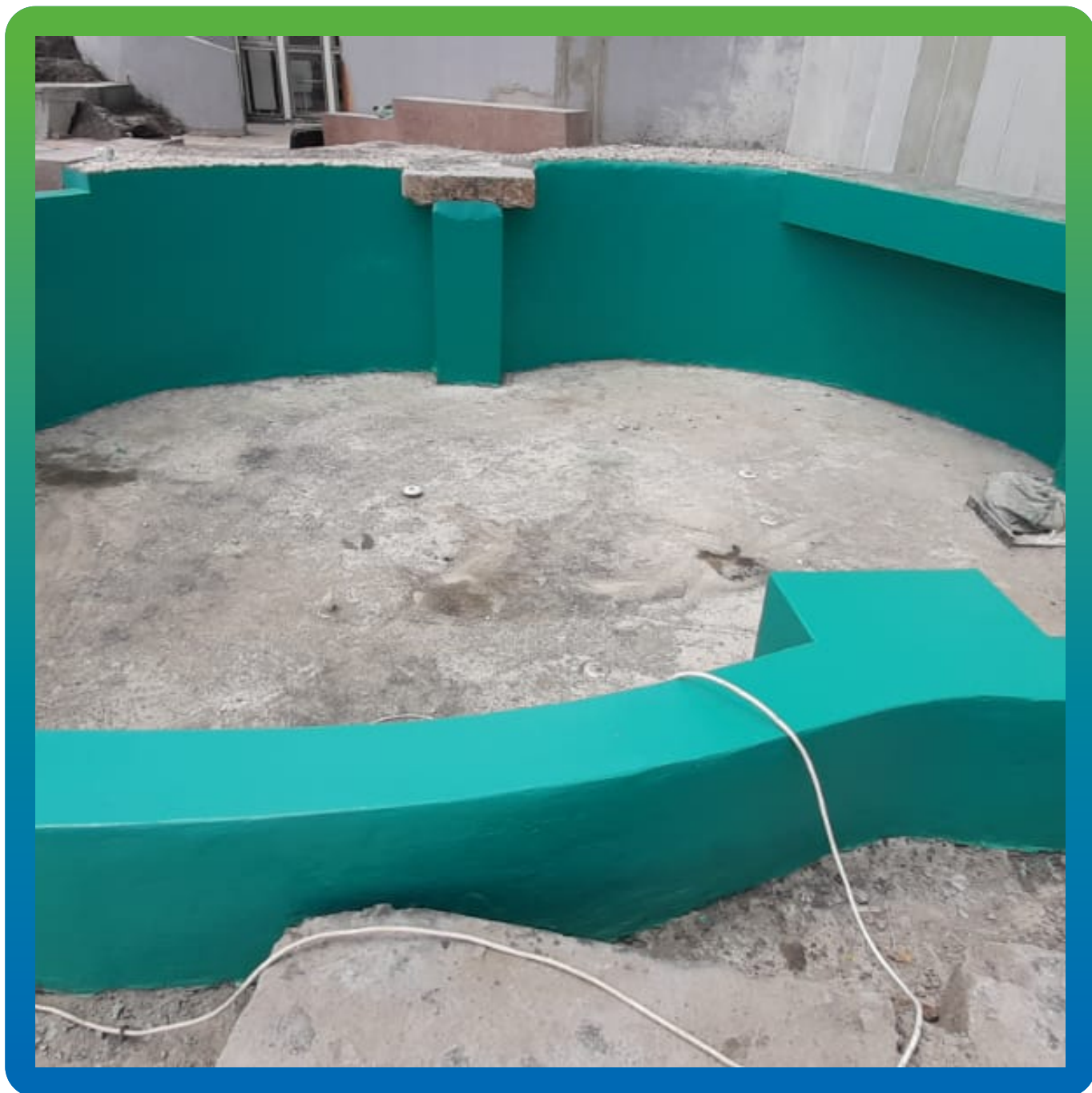
Финишный вид чаши бассейна