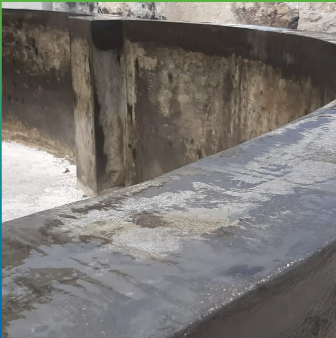
Нанесенный эпоксидный праймер ДенсТоп ЭП 100