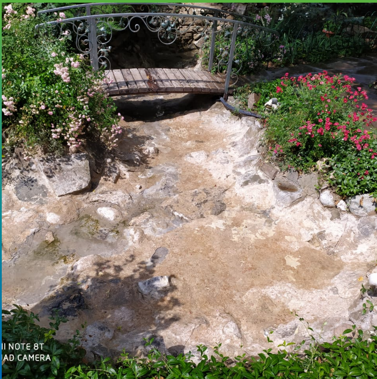
Состояние до ремонта