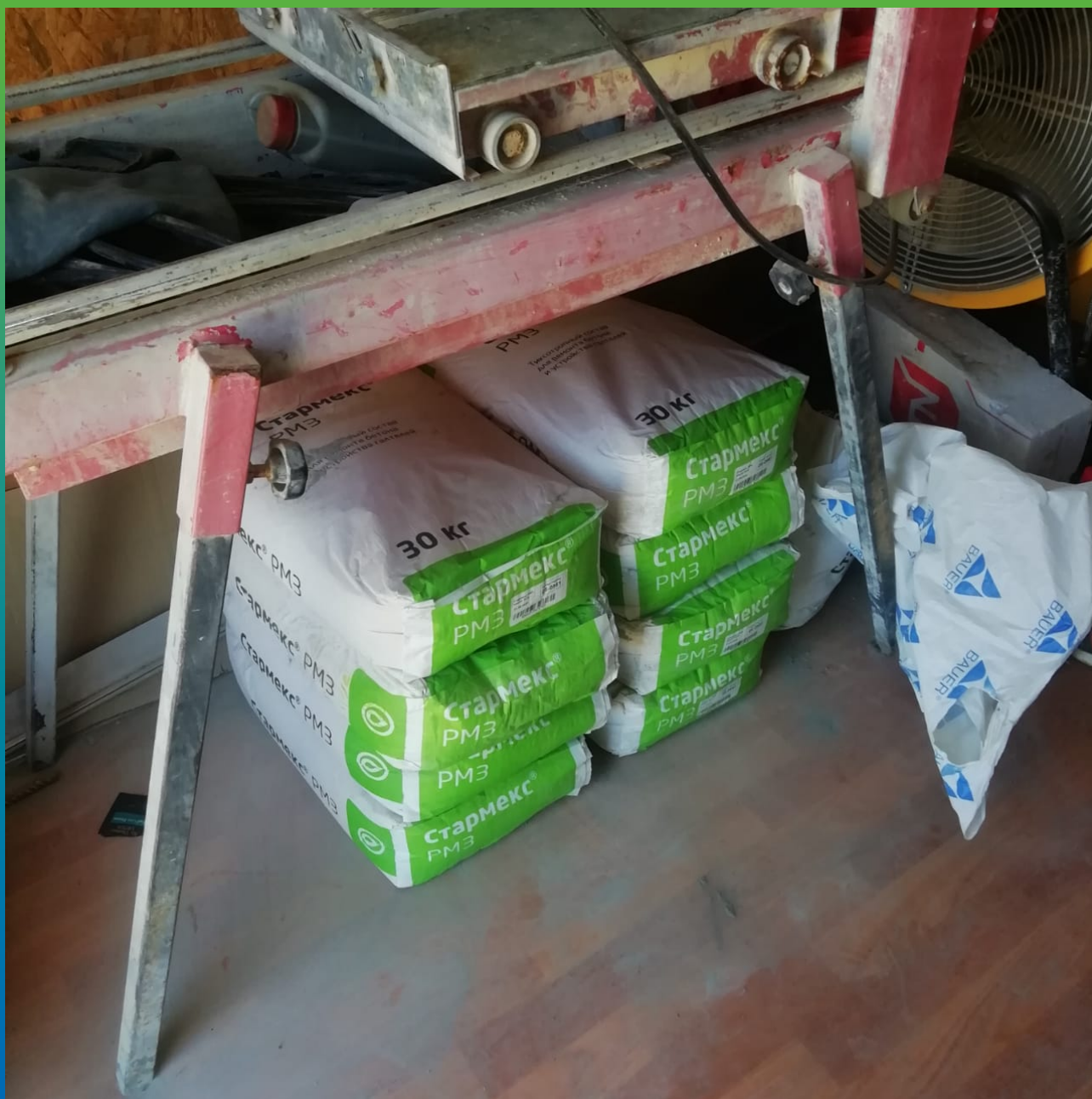
Рем. состав Стамекс PM3 на объекте