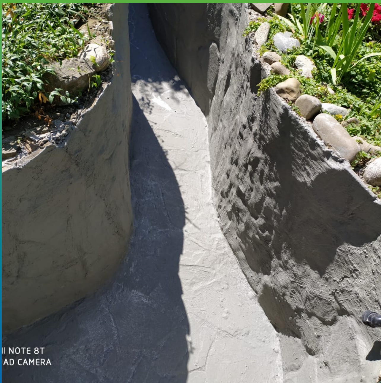
Отремонтированный водоем после покрытия Стармекс Сил Флекс