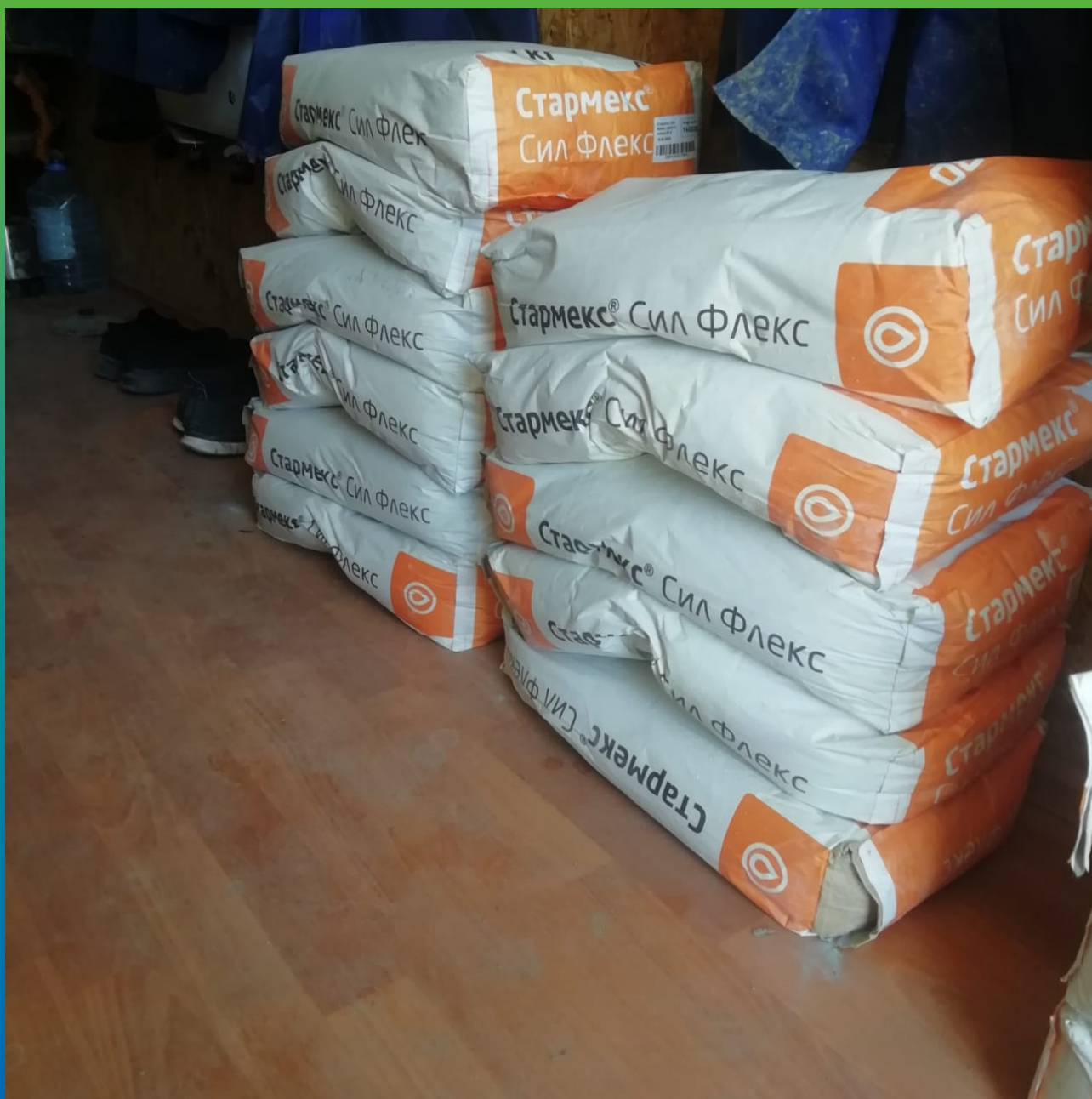
Стармекс Сил Флекс на объекте