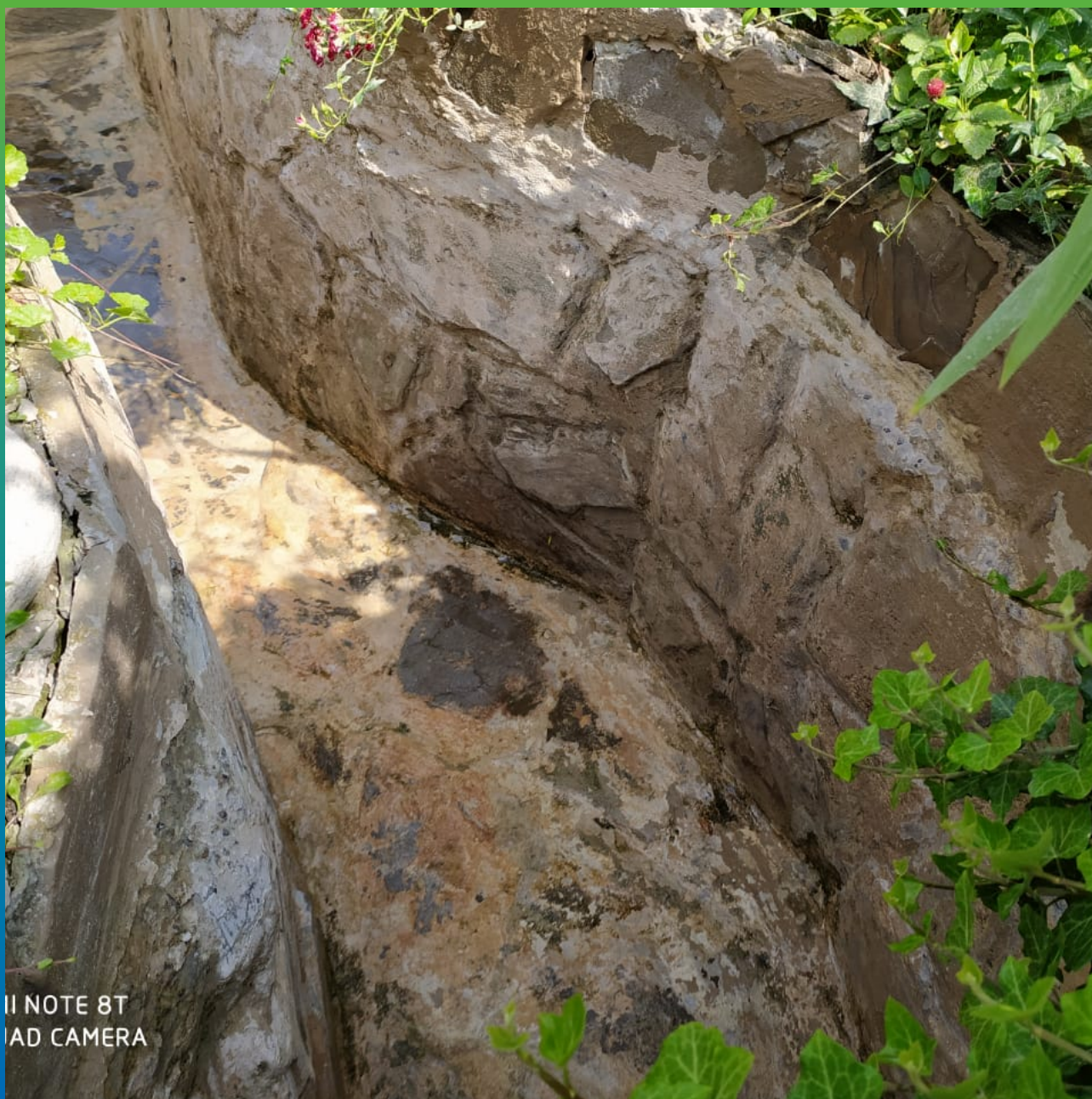
Вид водоема до ремонта