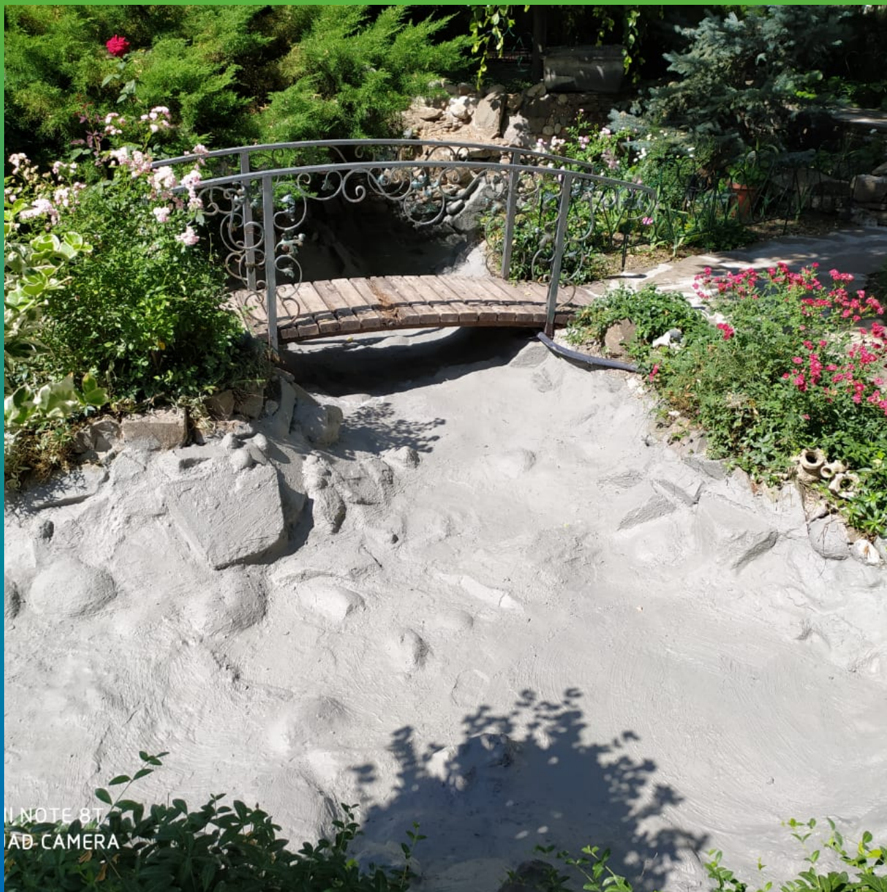
Финишный вид после нанесения гидроизоляции Стармекс Сил Флекс