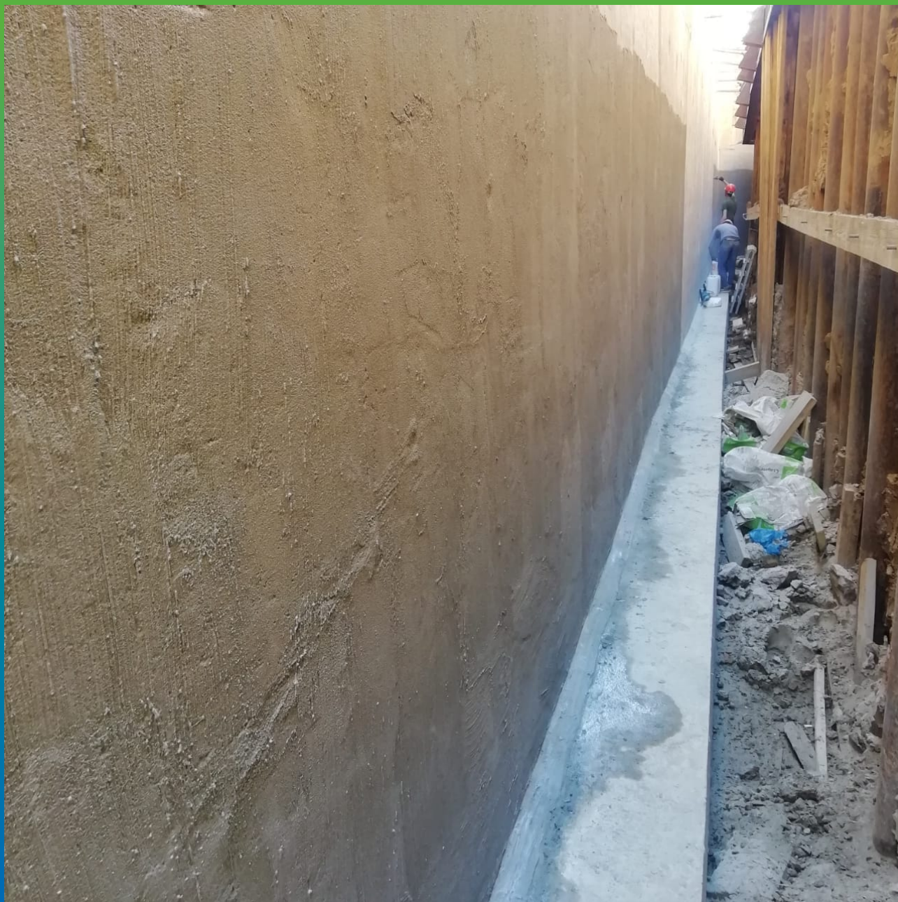
Финишный вид после нанесения гидроизоляции