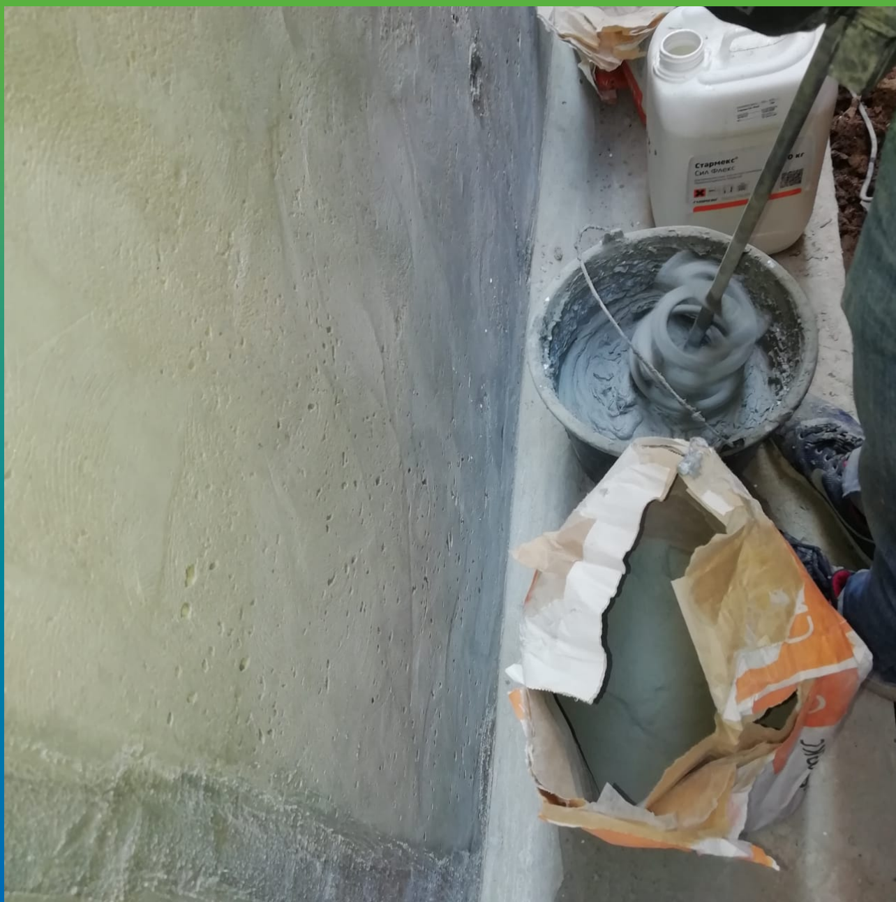
Смешивание эластичной гидроизоляции Стармекс Сил Флекс