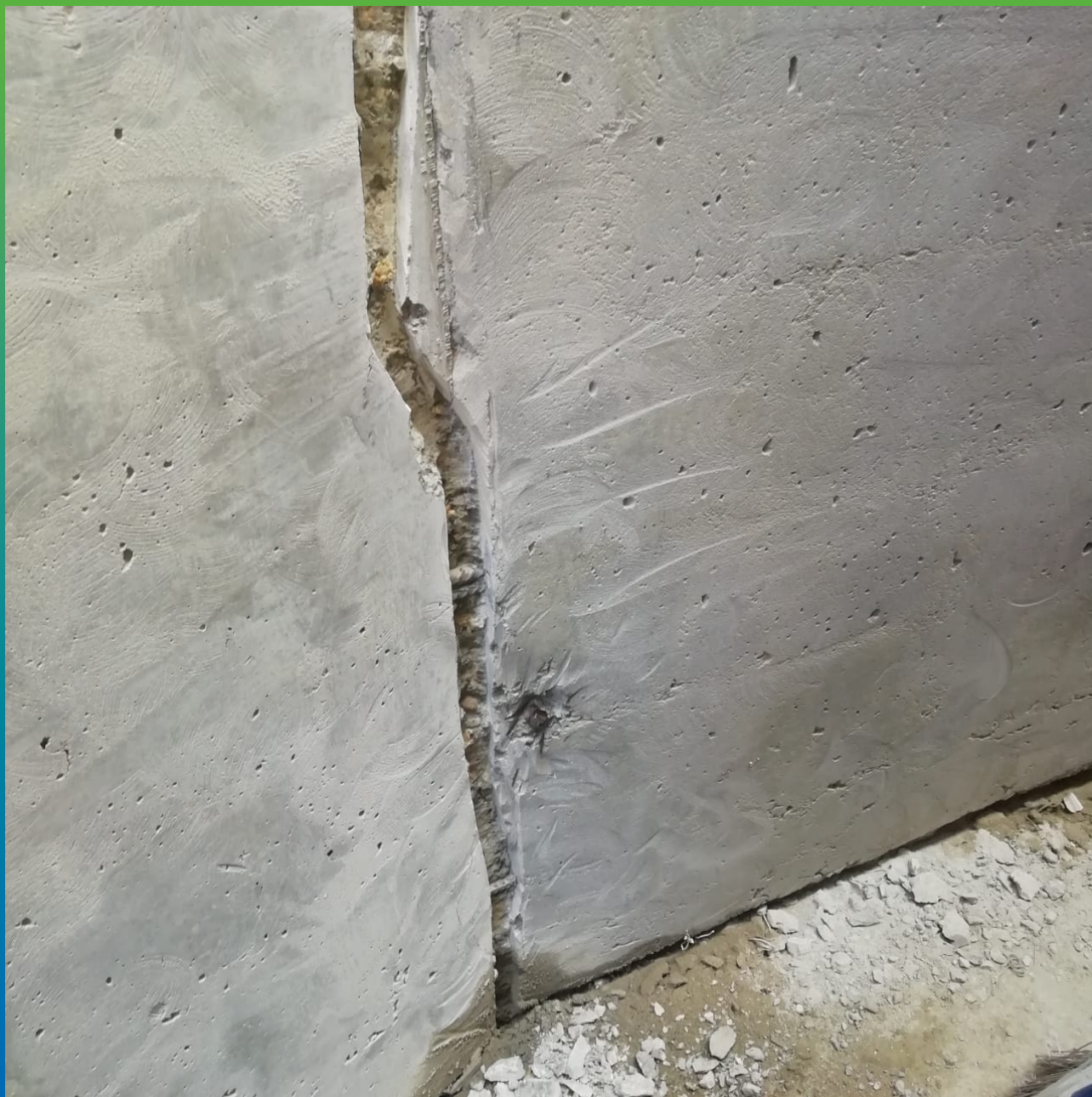
Расшивка усадочных трещин и холодных швов