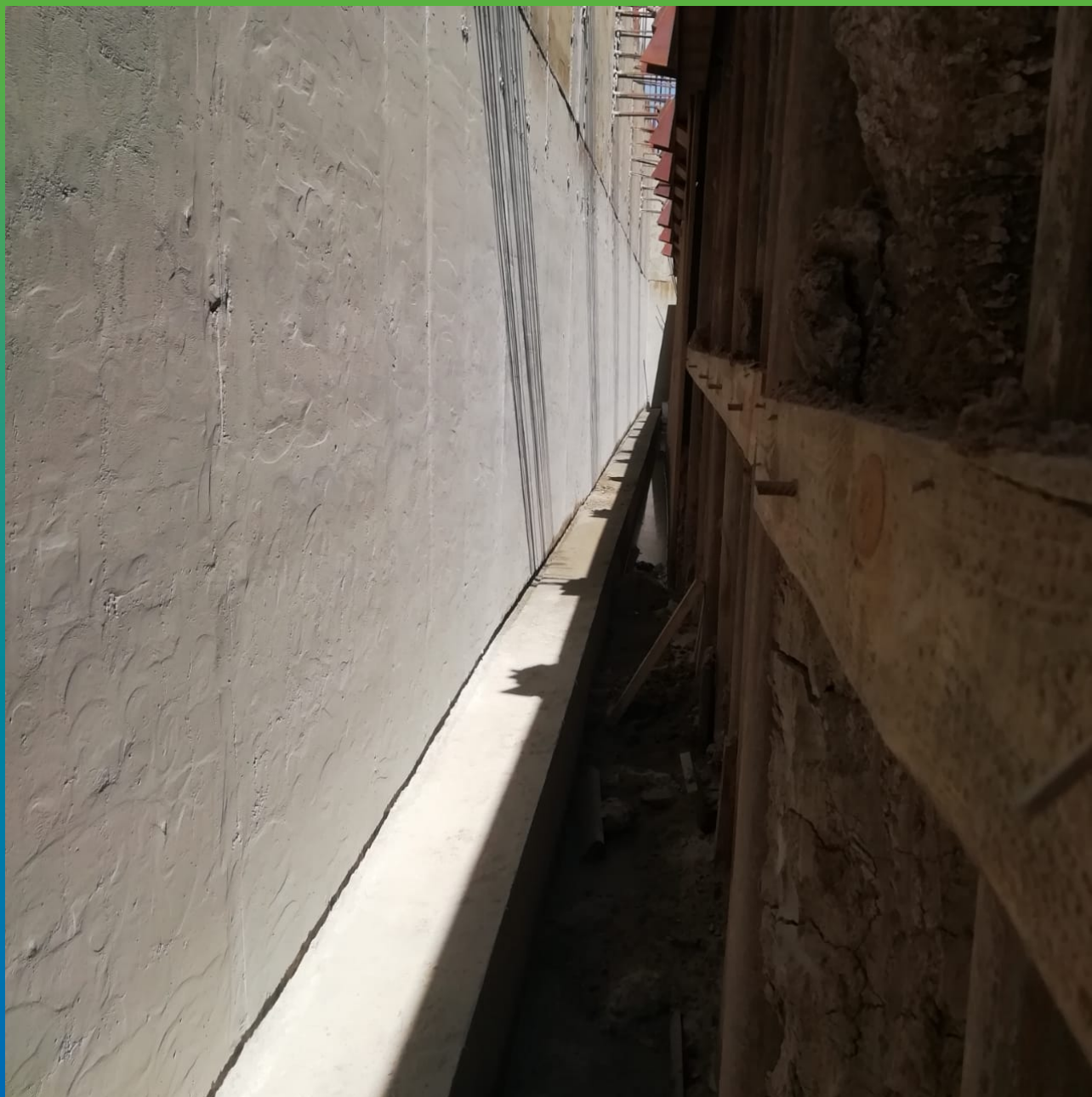
Подготовка основания перед нанесением гидроизоляции