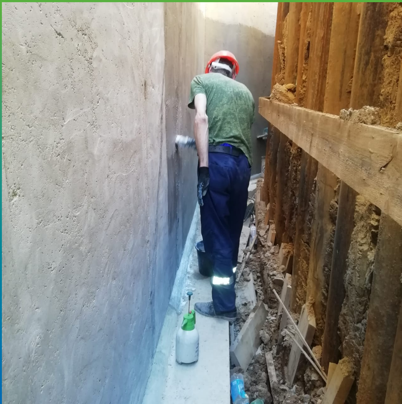
Покрытие стены гидроизоляцией Стармекс Сил Флекс