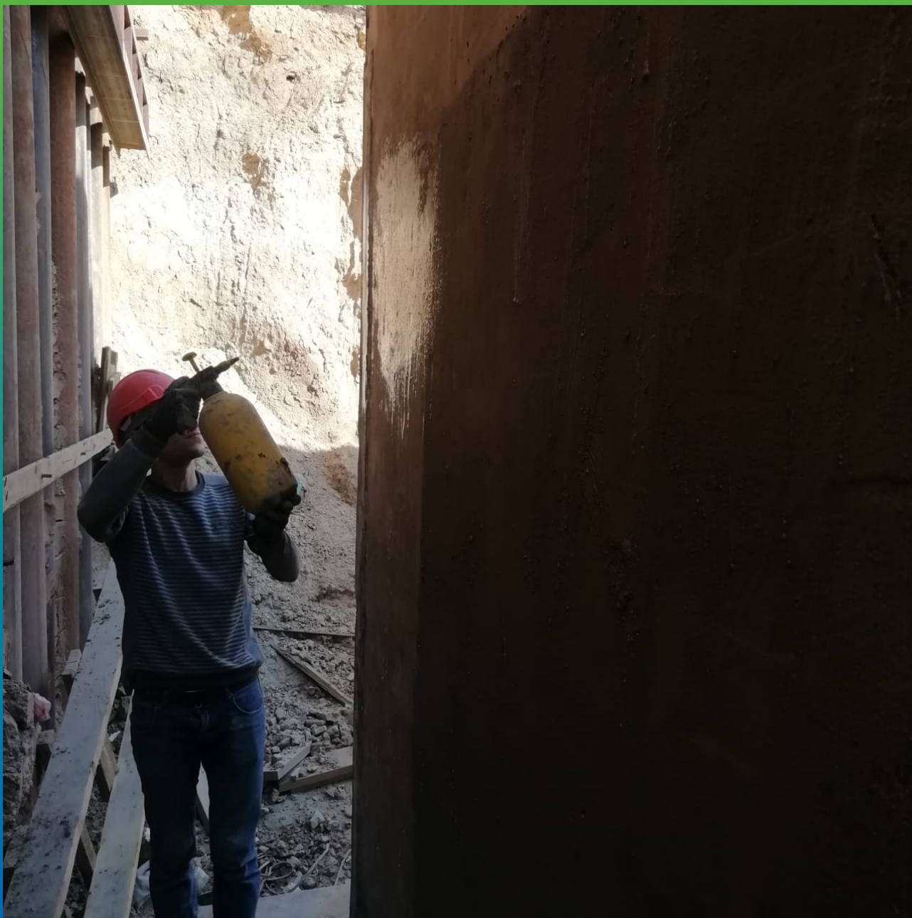
Увлажнение основания перед нанесением