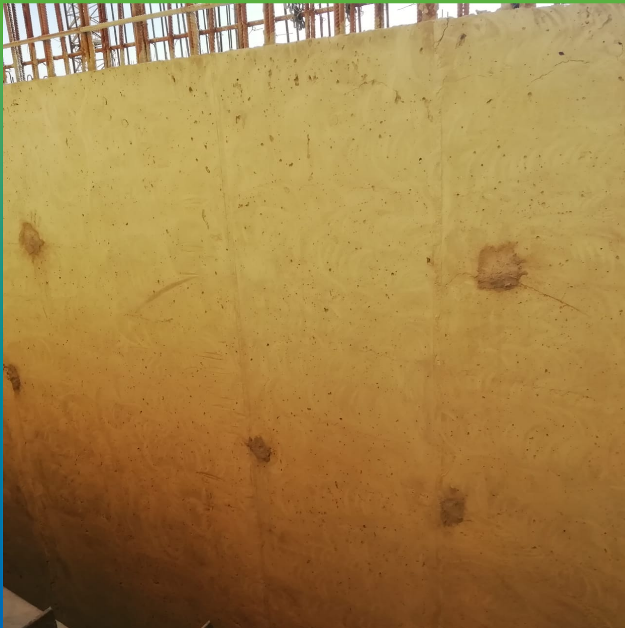
Заделка отверстий от опалубки составом Стармекс РМЗ