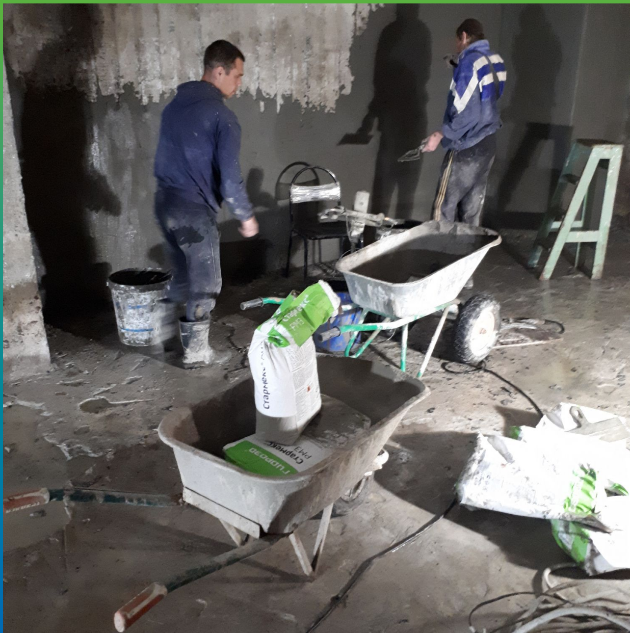
Ремонт колонн и стен составом Стармекс PM3