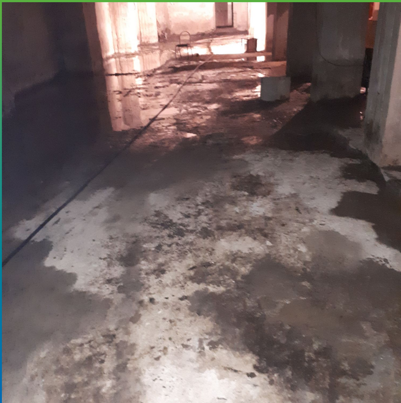
Состояние после демонтажа стяжки