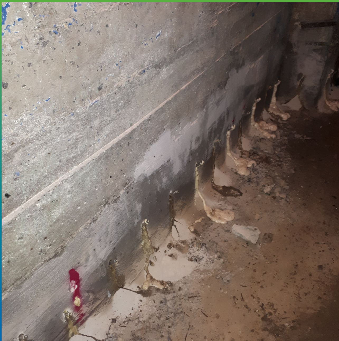
После инъектирование Манопур 15