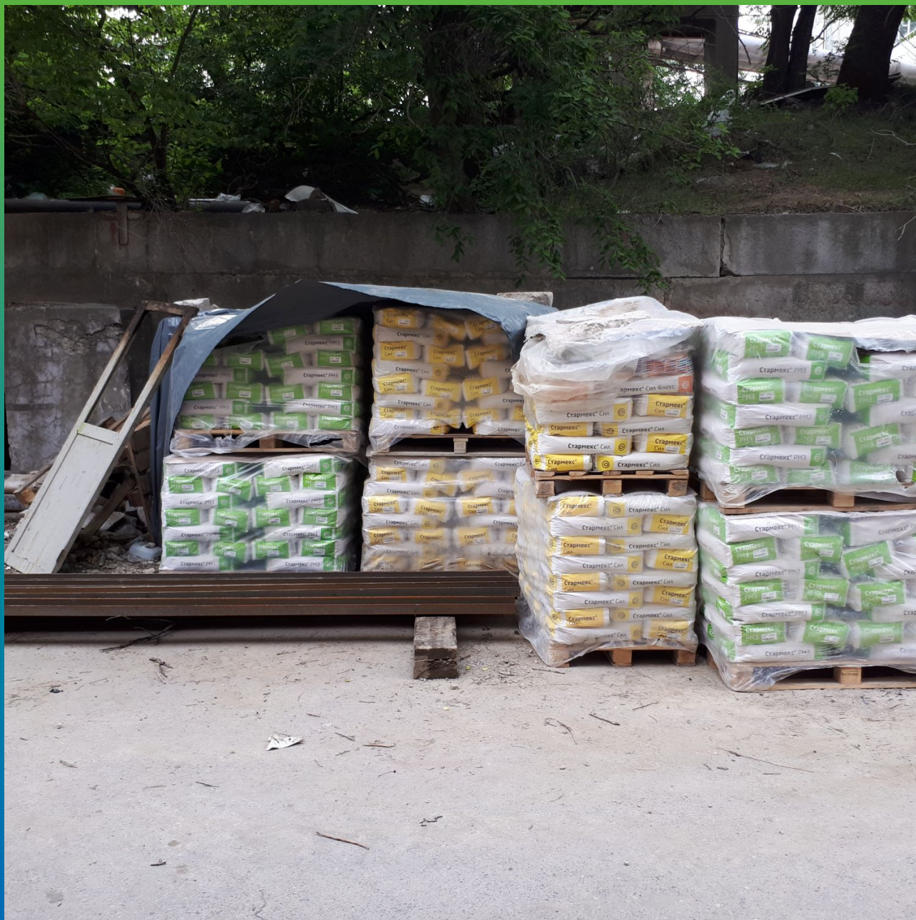
Материалы Гидрозо на объекте