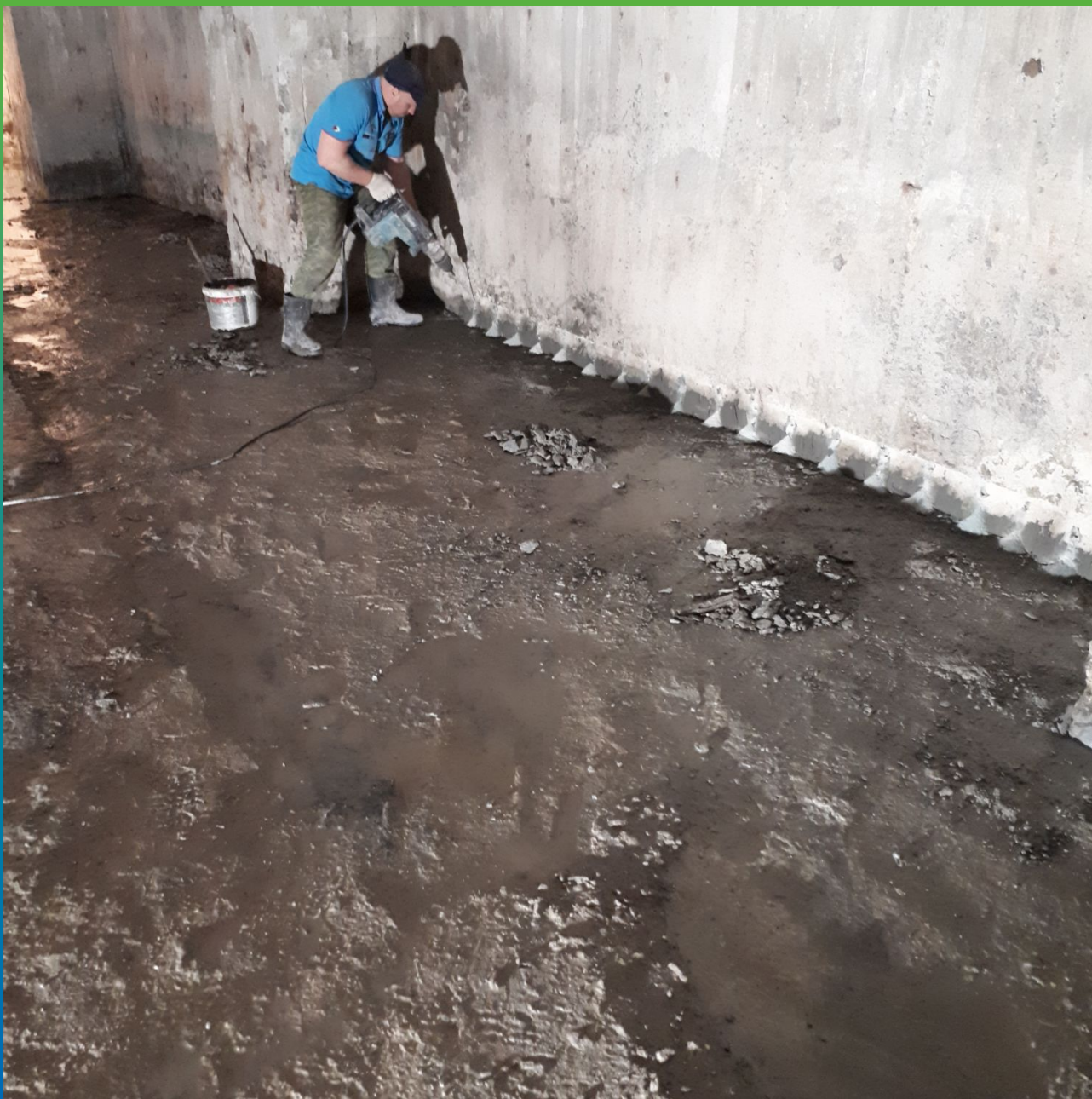
Бурение шпуров под пакеры