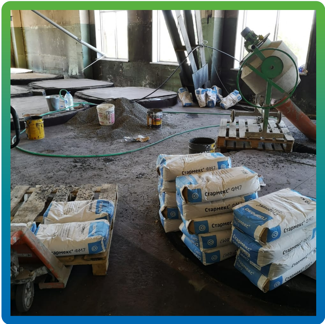
Ремонтный подливочный состав Стармекс ФМ7