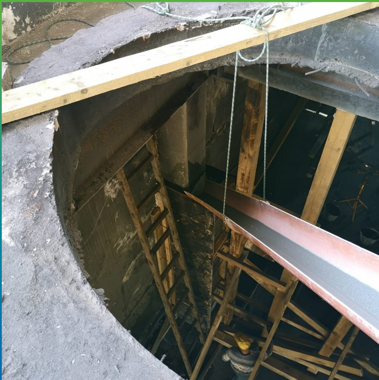
Заливка Стармекс ФМ7 в опалубку