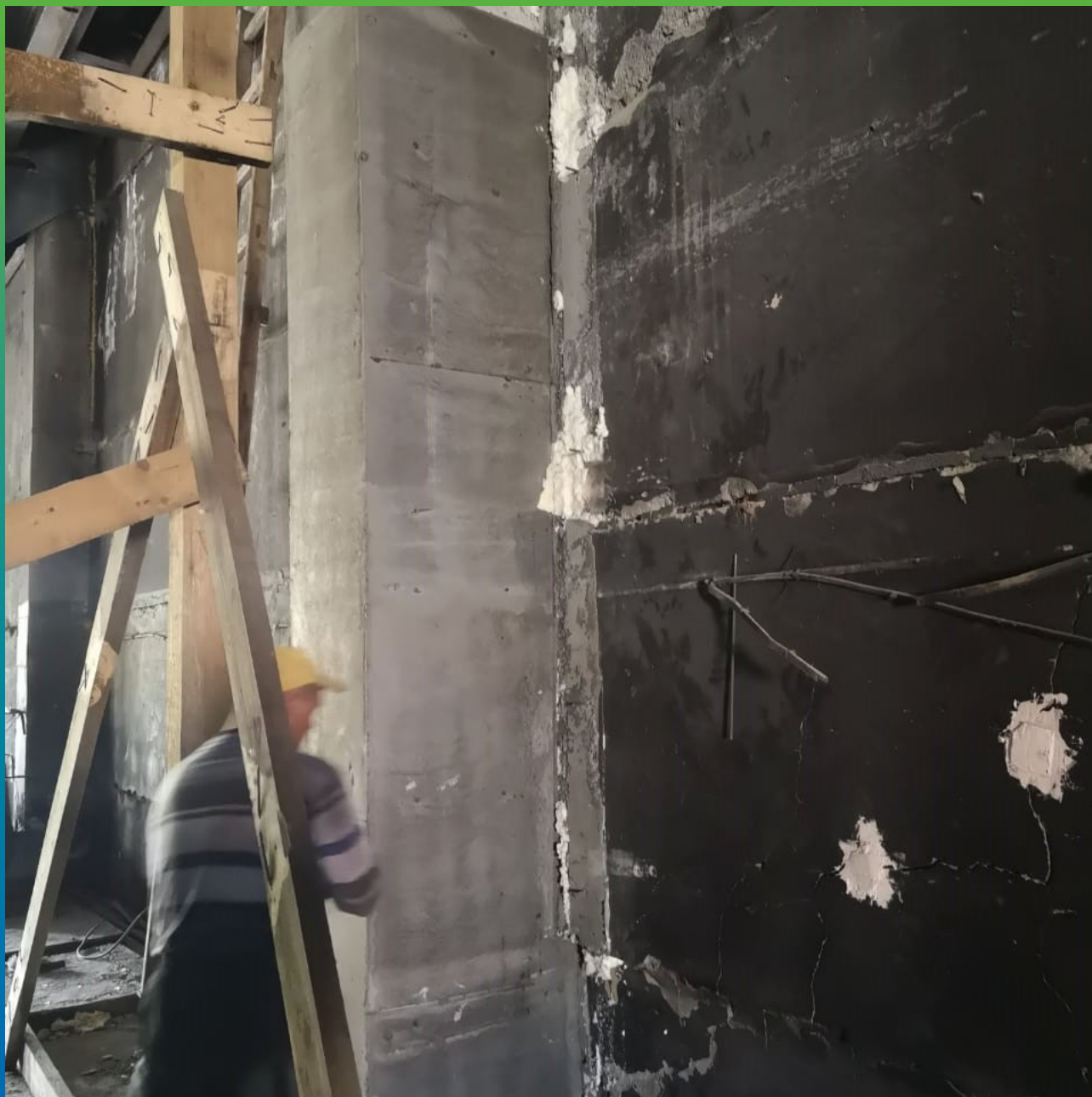
Финишный вид колонны после демонтажа опалубки