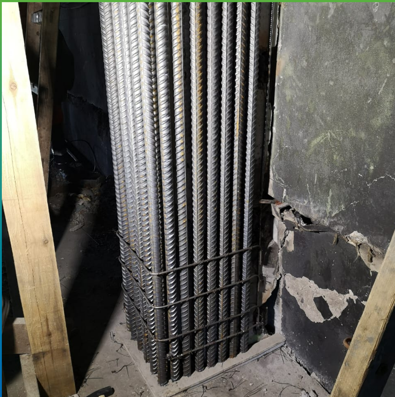
Армирование колонны перед начало работ