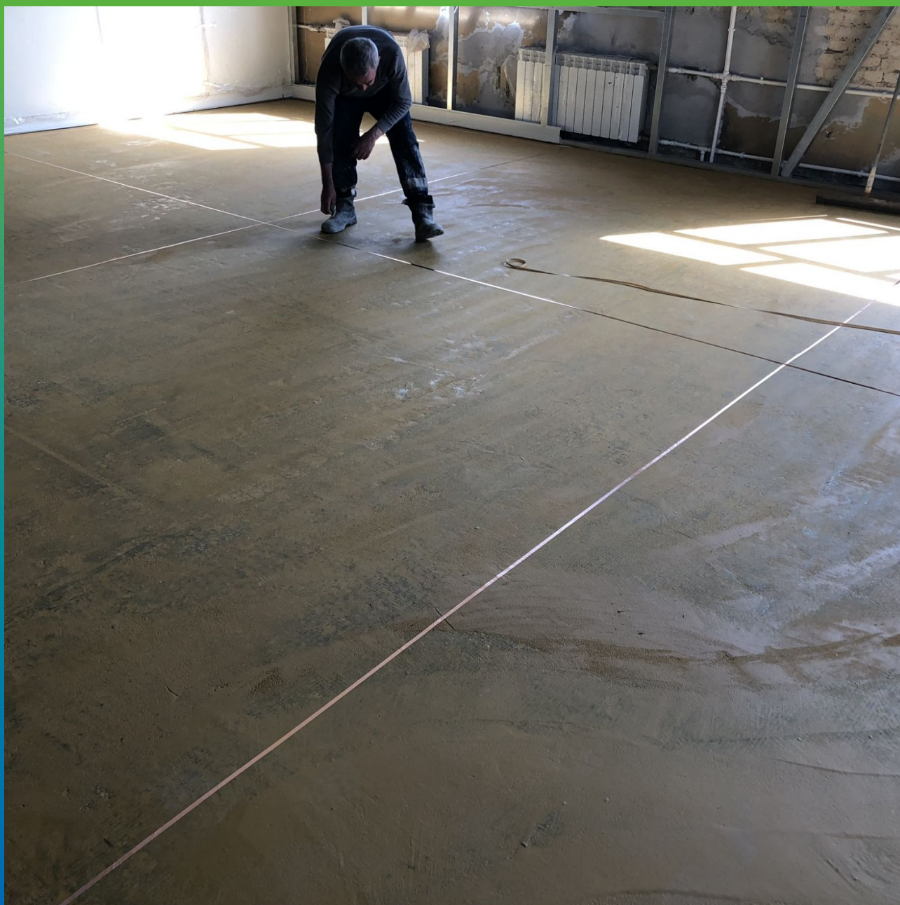
Устройство токопроводящей ленты ДенТоп Купрум