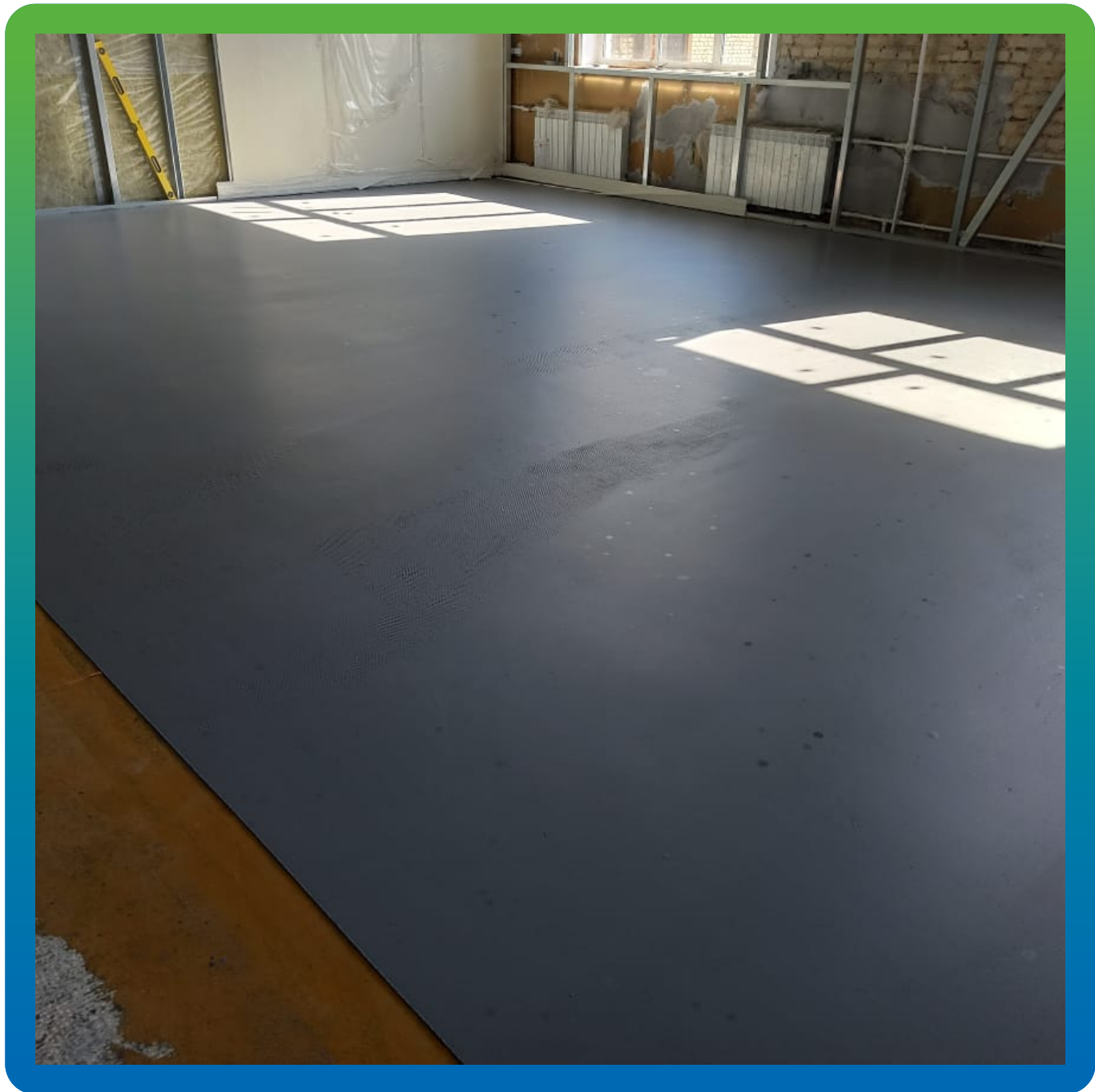
Финишный вид покрытия