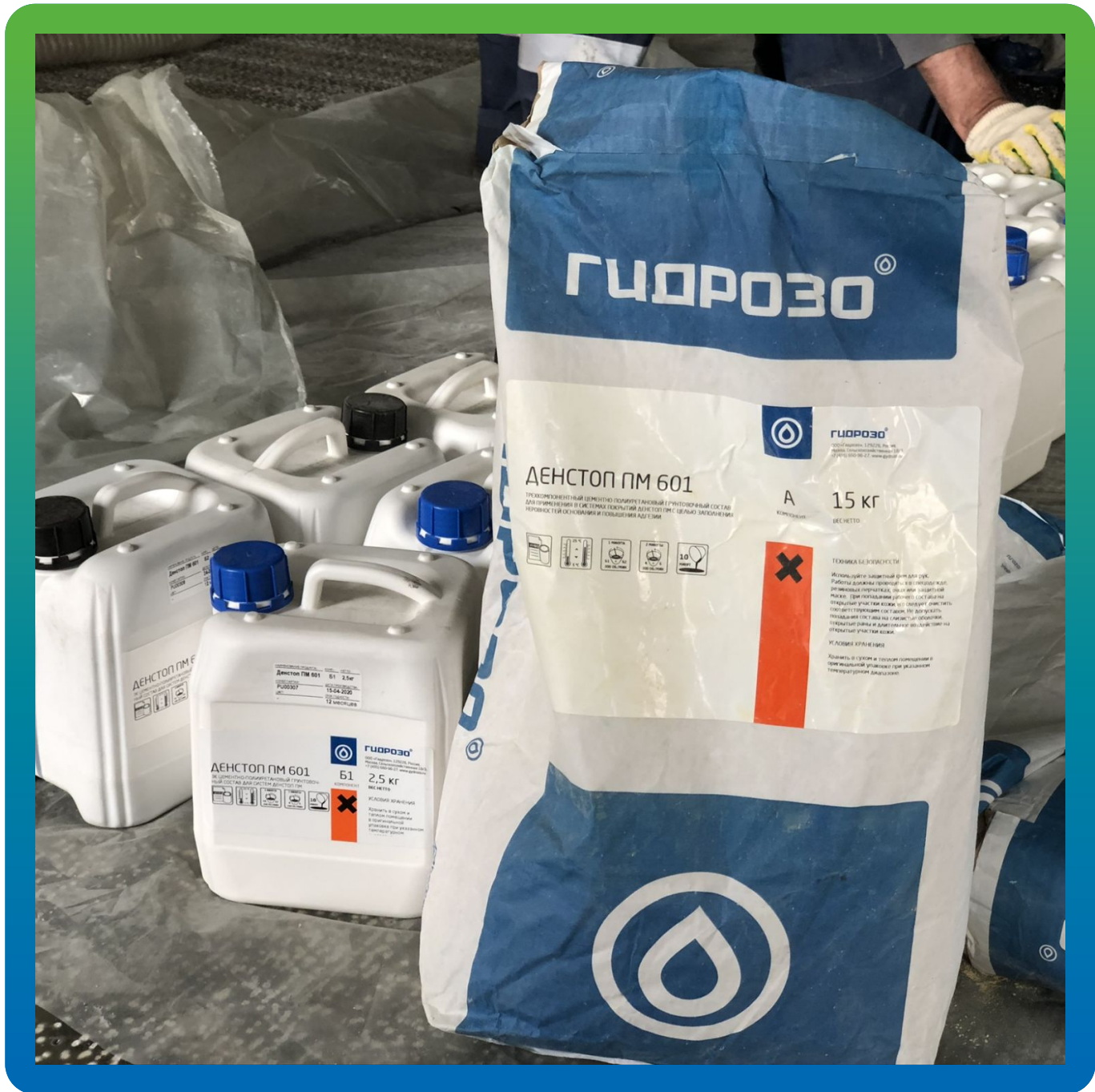
Цементно-полиуретановая грунтовка ДенСтон ПМ 601