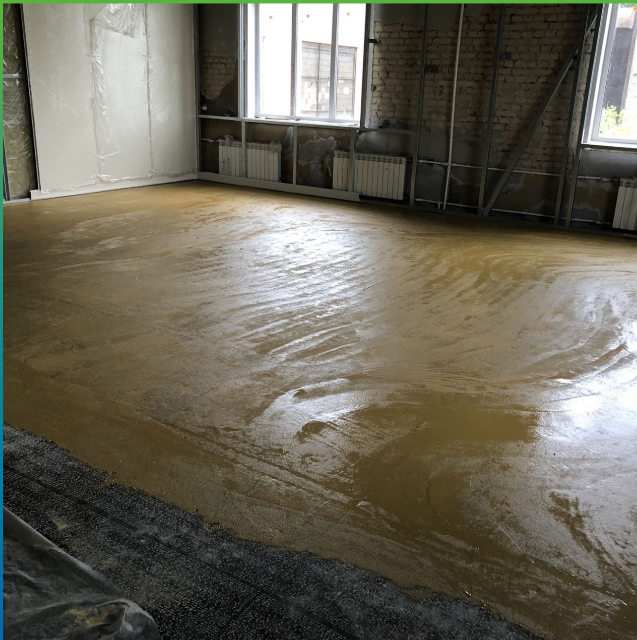
Покрытие после грунтования