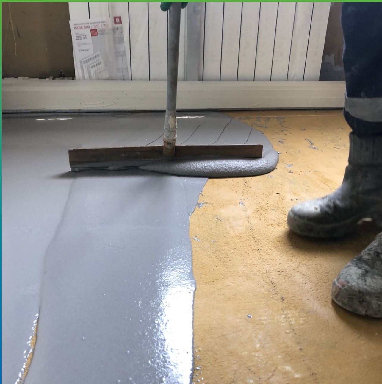
Устройство антистатического полиуретан-цементного покрытия ДенсТоп ПМ 605 Флоу Ас