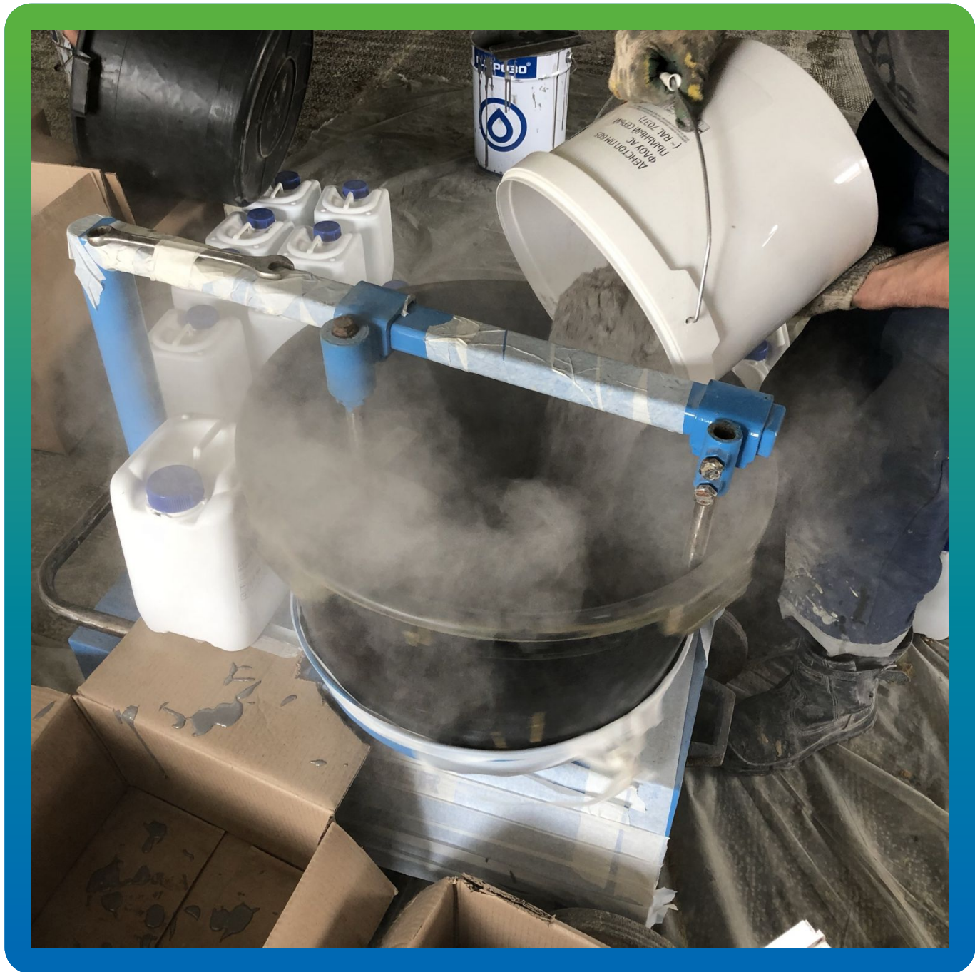
Замешивание ДенсТоп ПМ 605 Флоу Ас