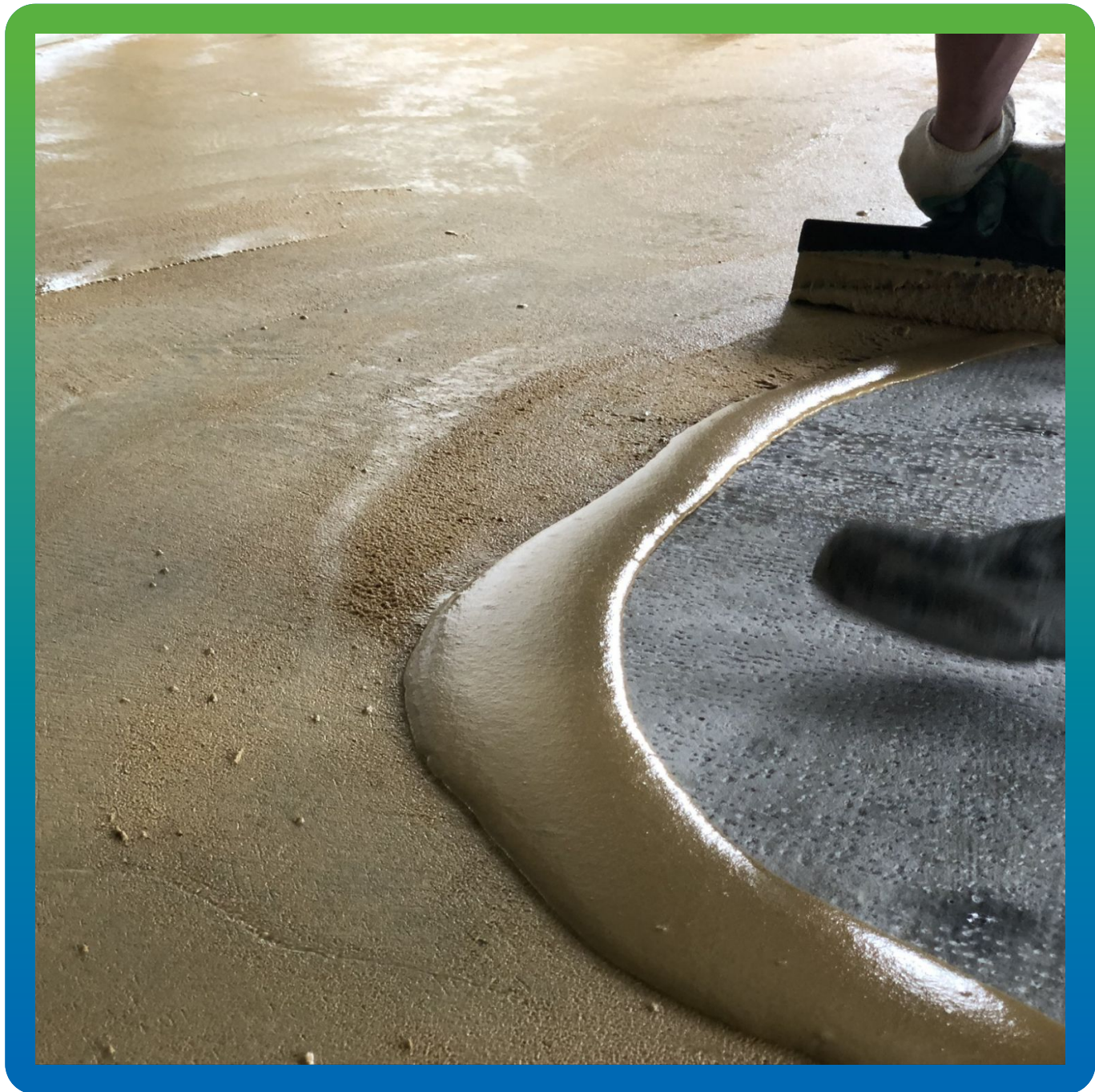
Грунтование поверхности ДенсТоп ПМ 601