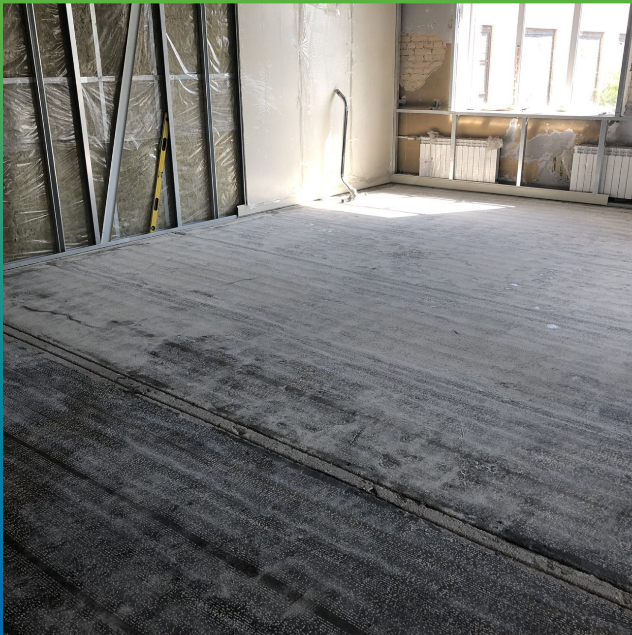
Вид покрытия после фрезерования