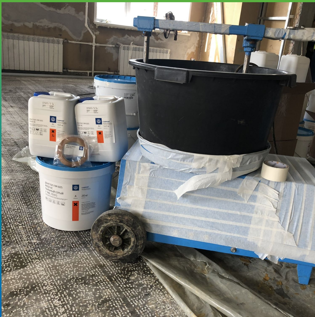
Подготовка к смешиванию компонентов ДенСтон ПМ 605 Флоу АС