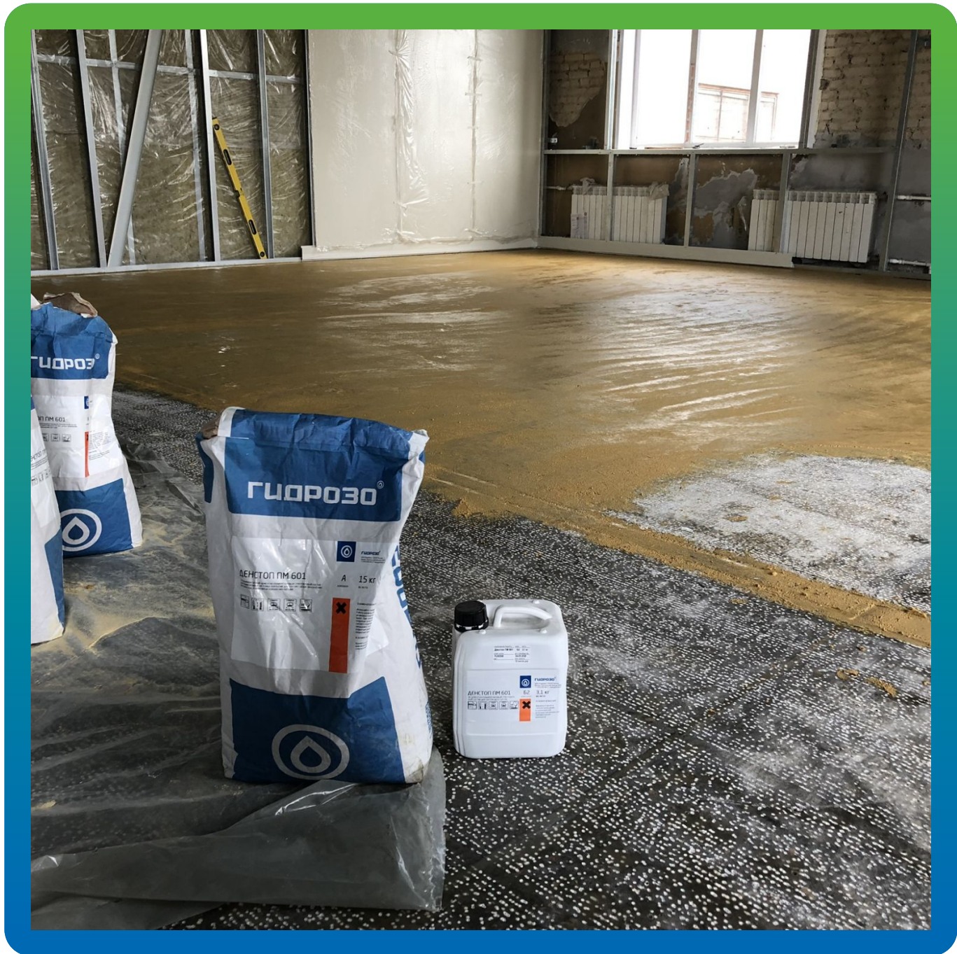
Грунтование поверхности ДенТоп ПМ 601