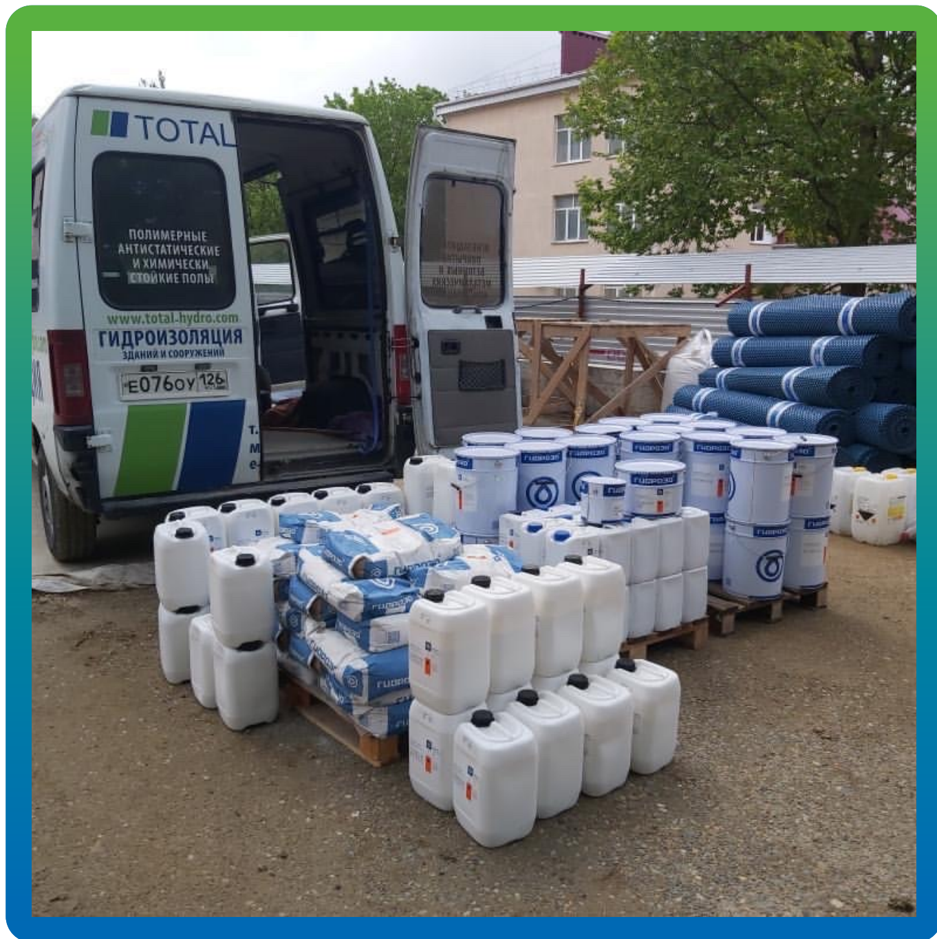
Материалы на объекте: Стармекс 111, ДенТоп ЭП 104, Стармекс Эласт