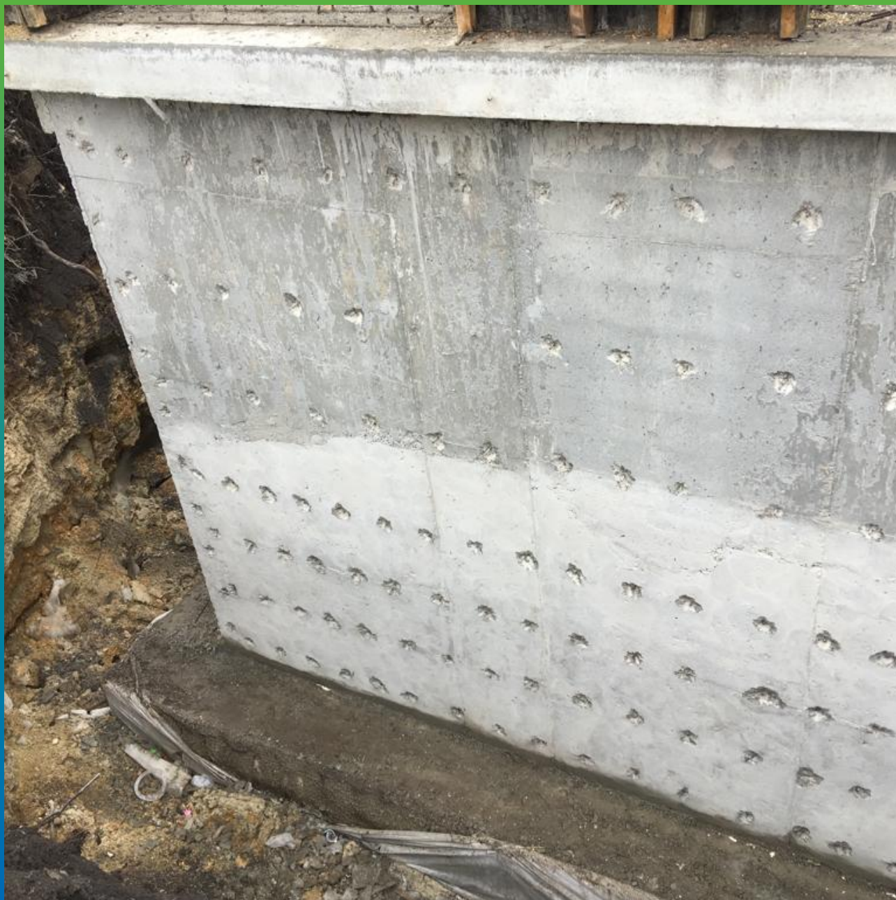
Расшивка технологических отверстий