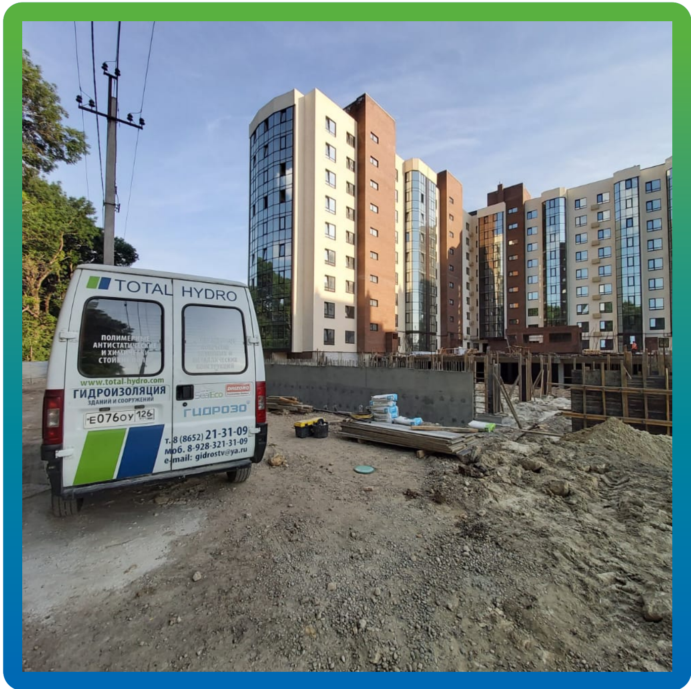
Общий вид жилого комплекса