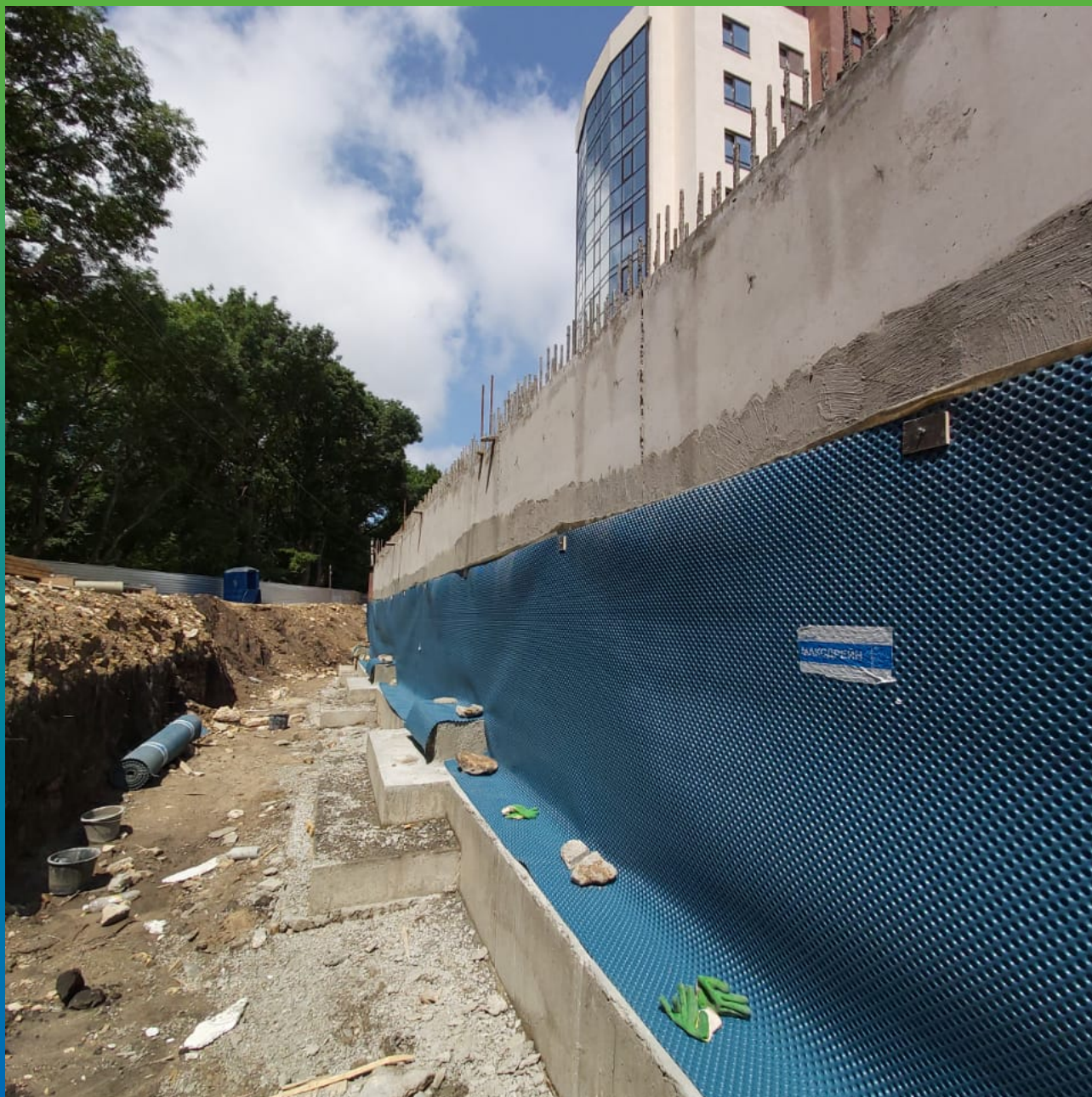
Монтаж мембраны Максдрейн 8