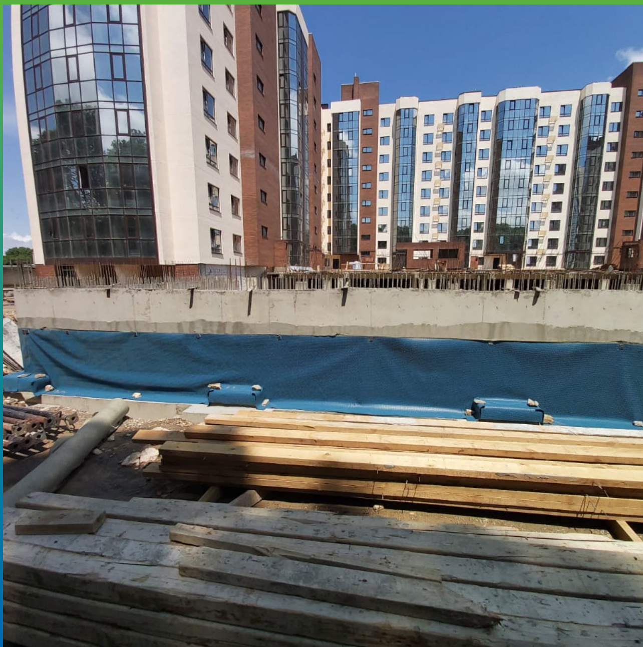
Смонтированная дренажная мембрана Максдрейн 8 поверх обмазочной гидроизоляции