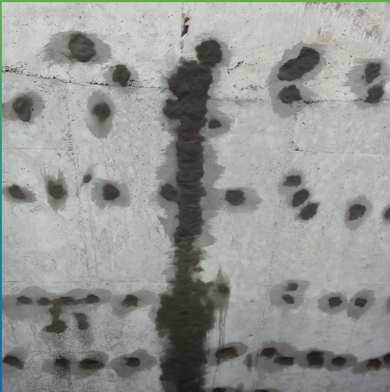
Зачеканка технологических отверстий безусадочным раствором Стармекс РМЗ