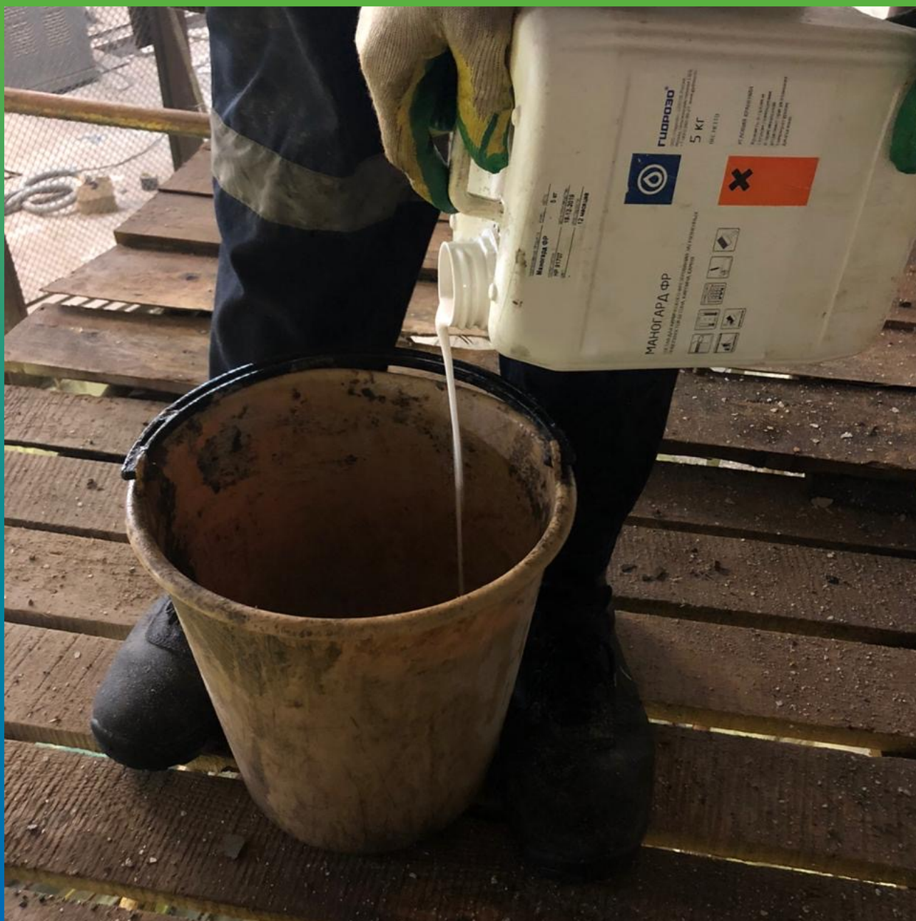
Подготовка материала к нанесению