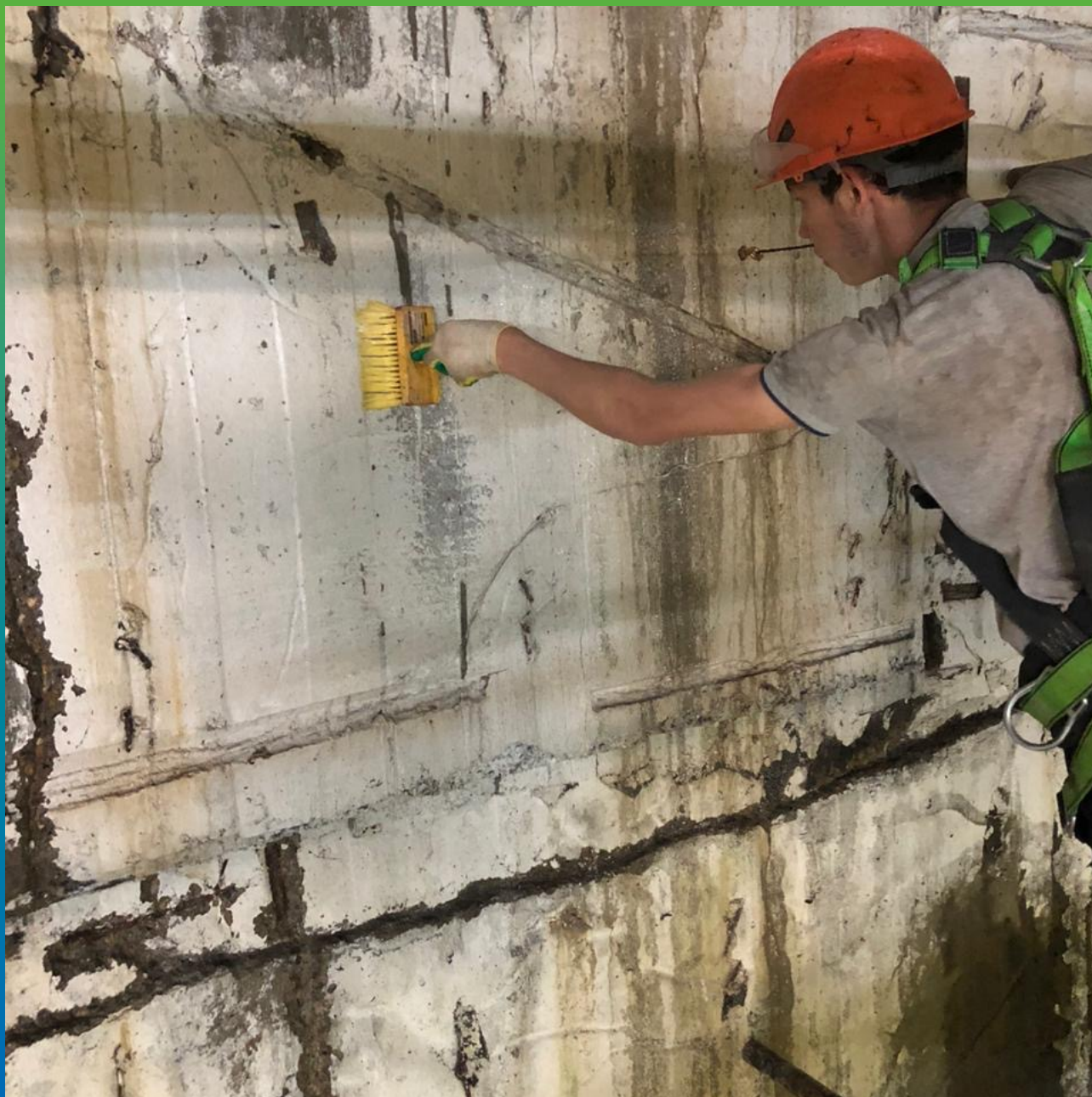
Нанесение материала на ЖБ поверхность