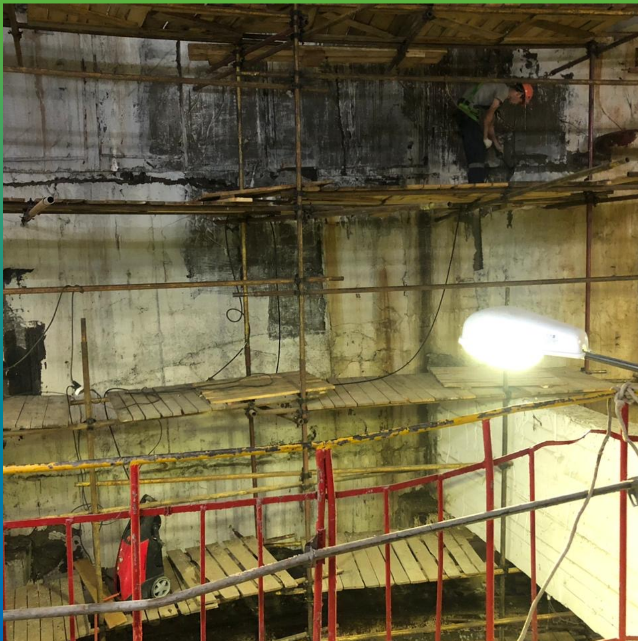
Вид поверхности (темные участки) после нанесения Маногард ФР