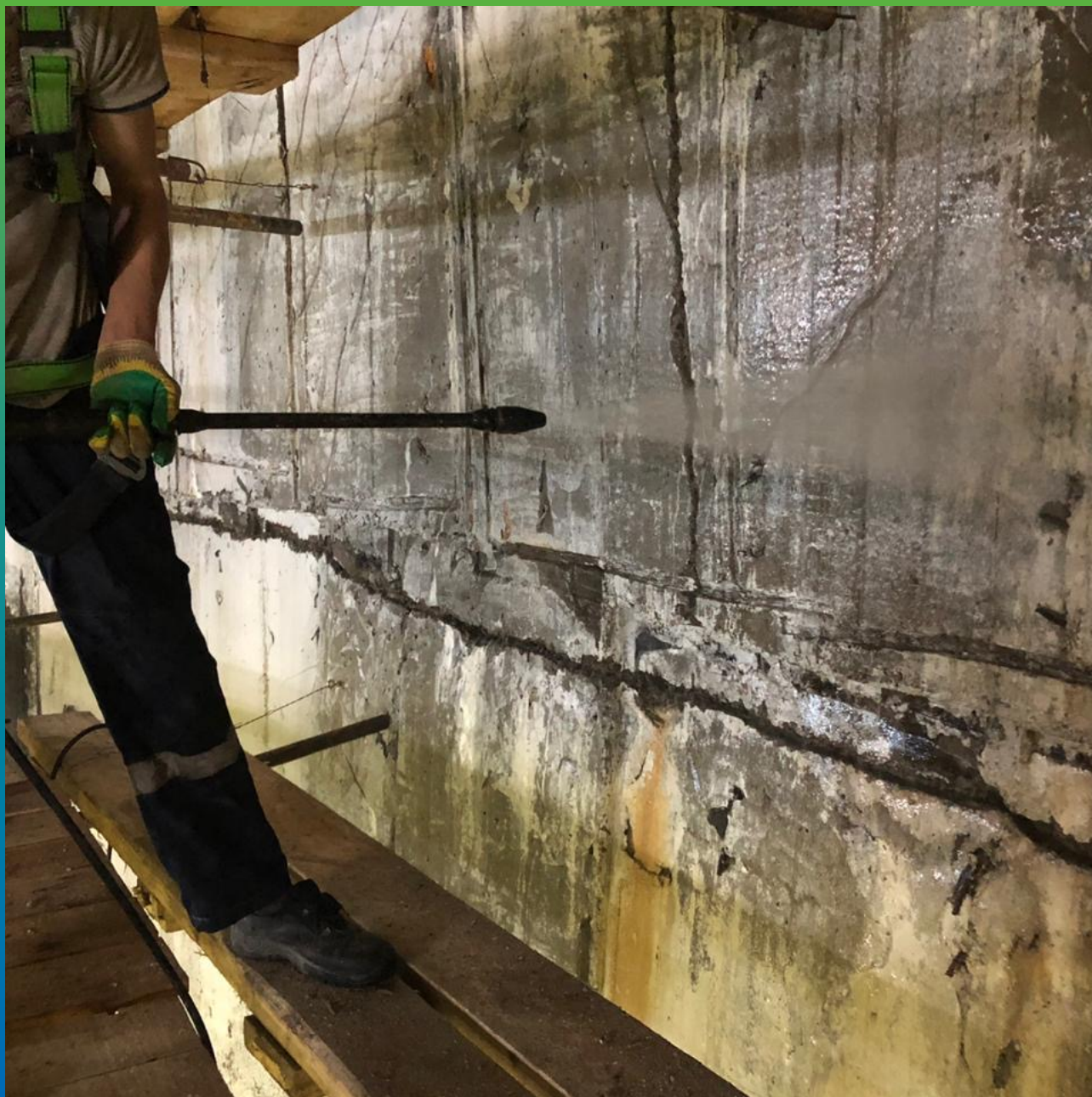
Очистка поверхности после нанесения материала Маногард ФР