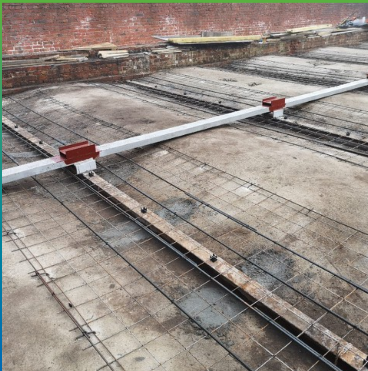
Закрытие пустот составом Маноцем Микс