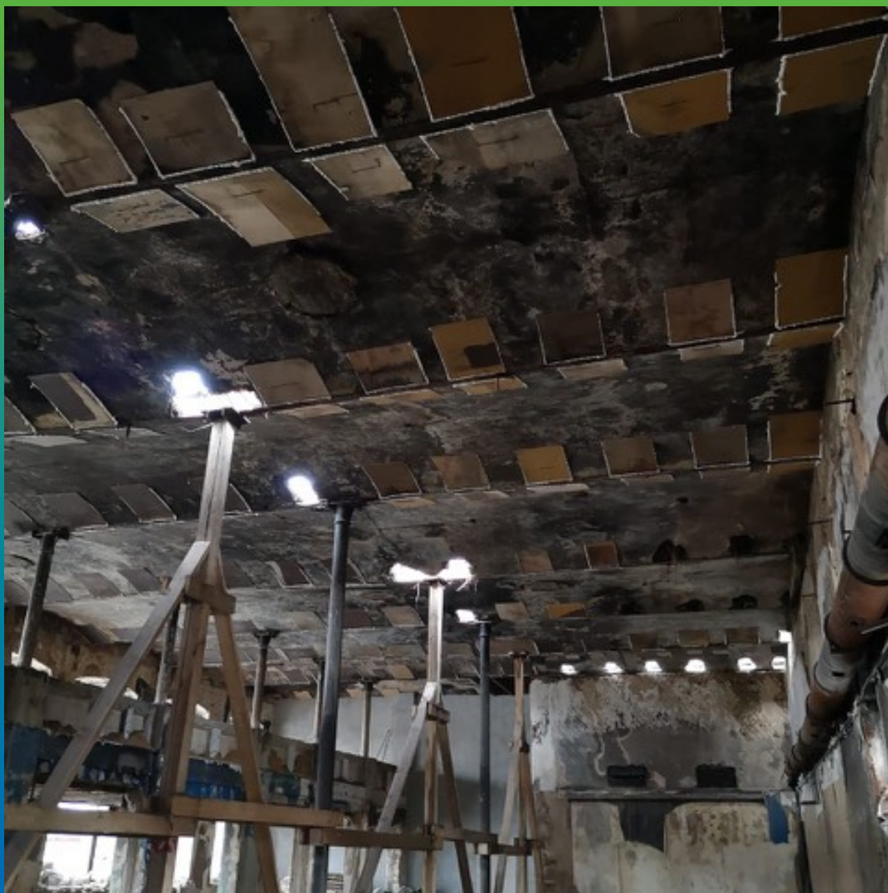
Вид перекрытия из помещения