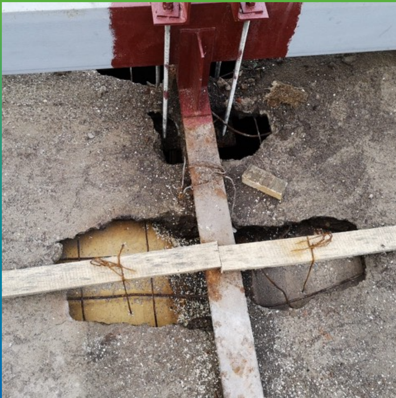
Вид перекрытия до ремонтно-восстановительных работ