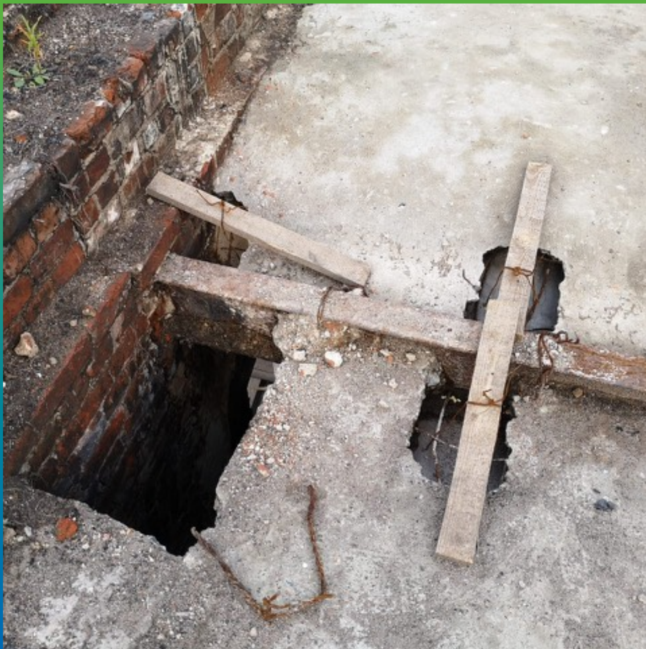
Вид перекрытия до ремонтно-восстановительных работ