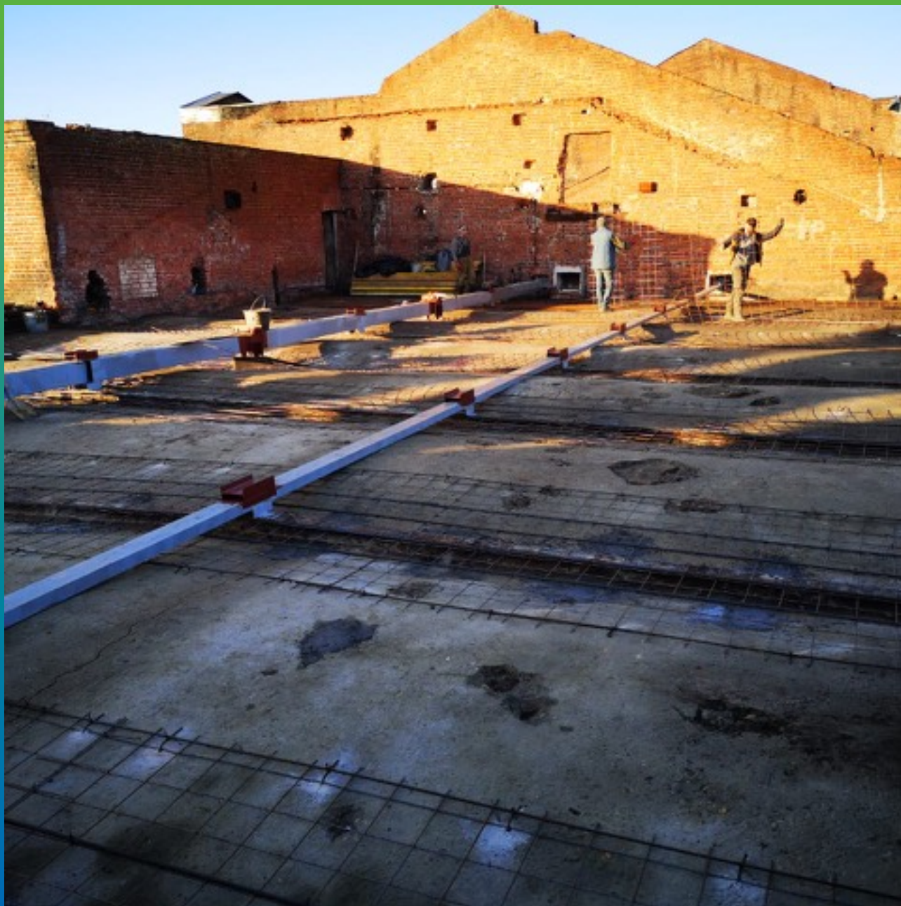
Расстил сетки под последующую заливку