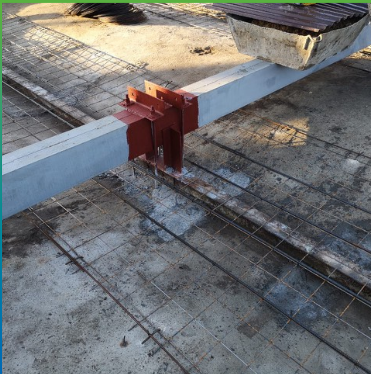
Закрытие пустот составом Маноцем Микс