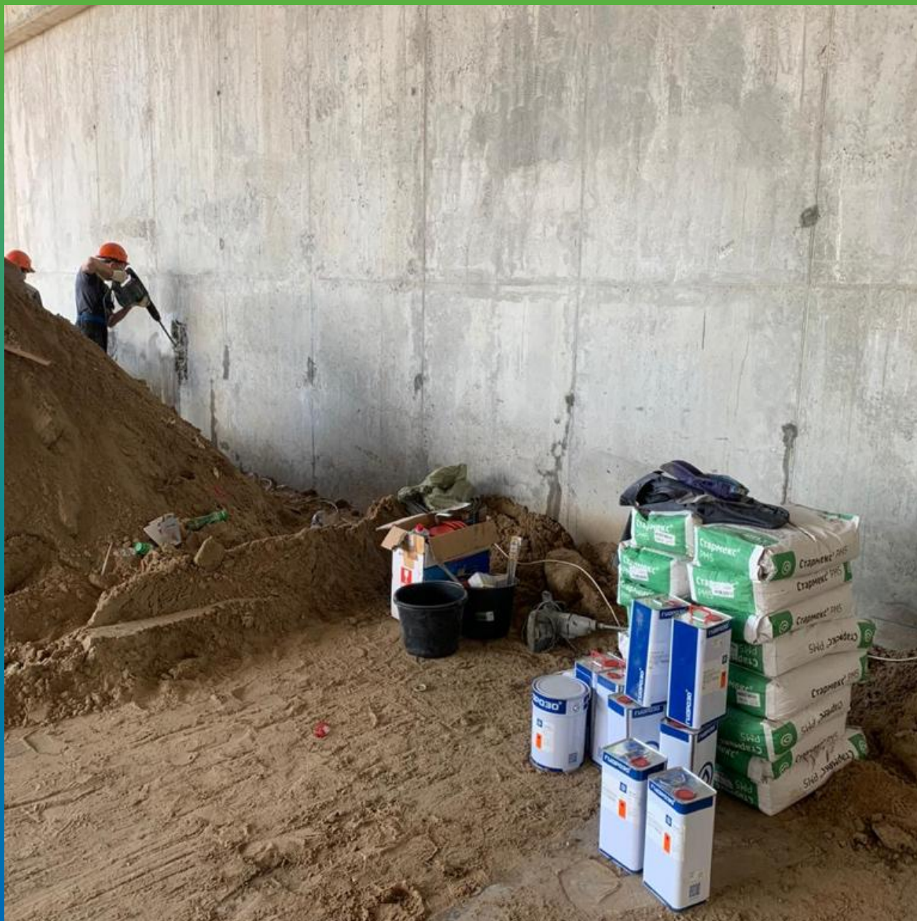
Демонтаж структурно не прочных участков бетона