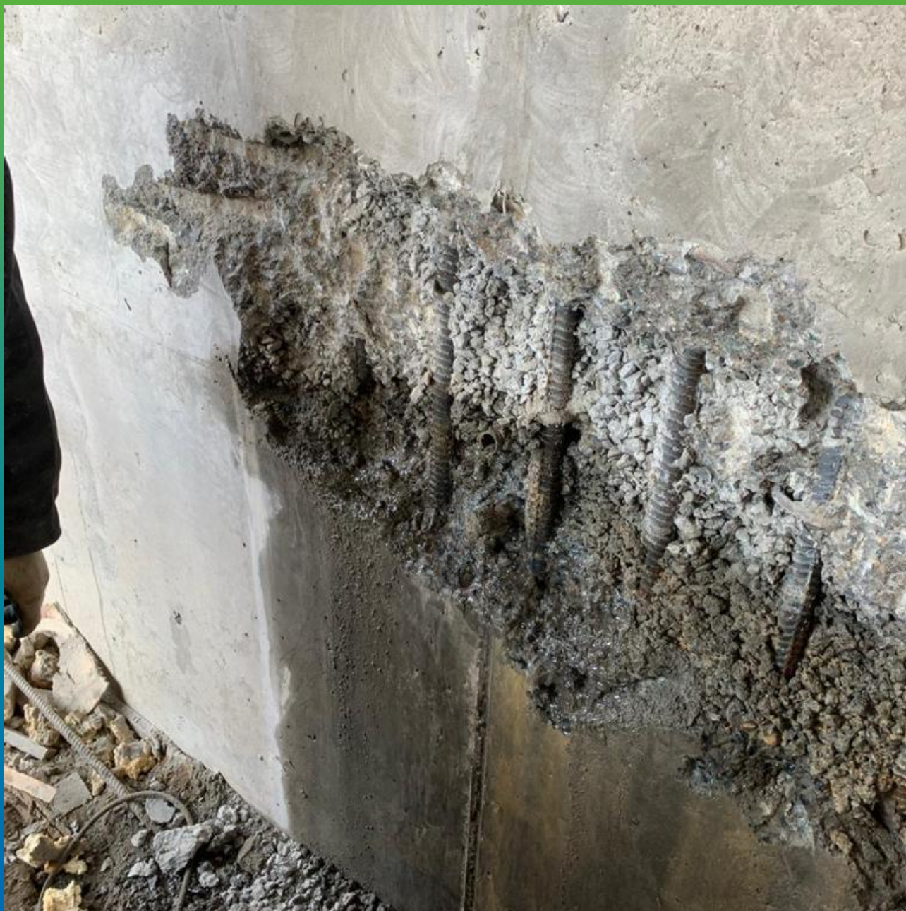
Основание, подготовленное к производству ремонтных работ