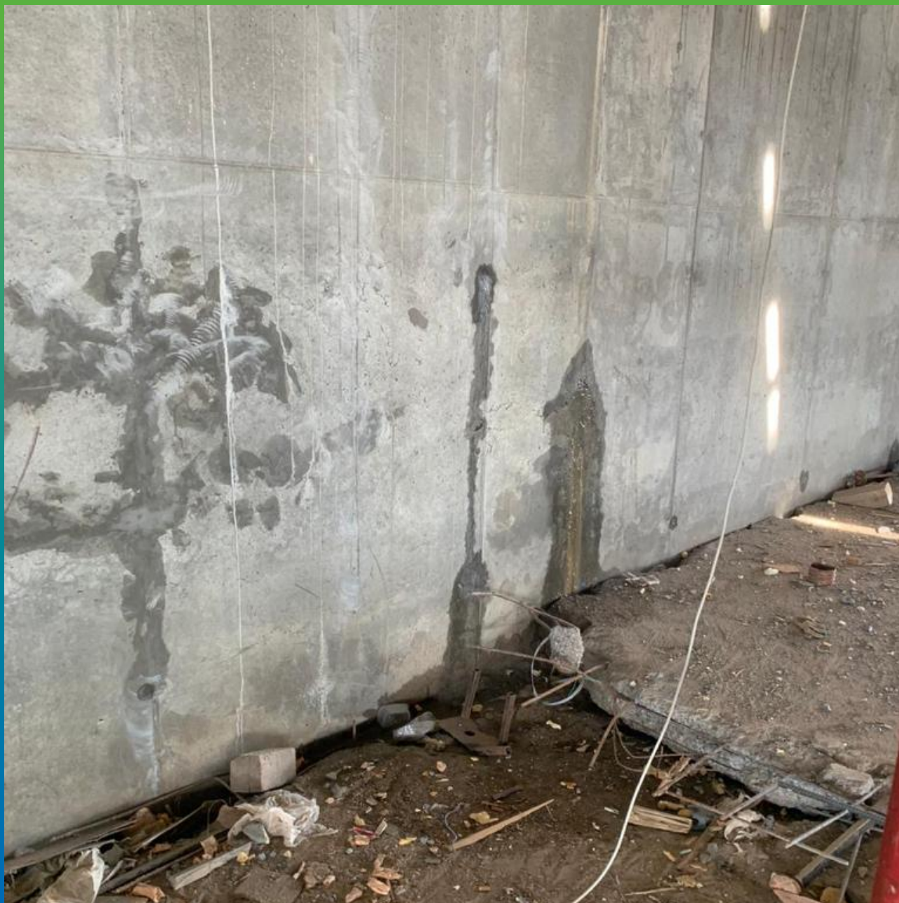
Подпорная стена с участками активных течей.