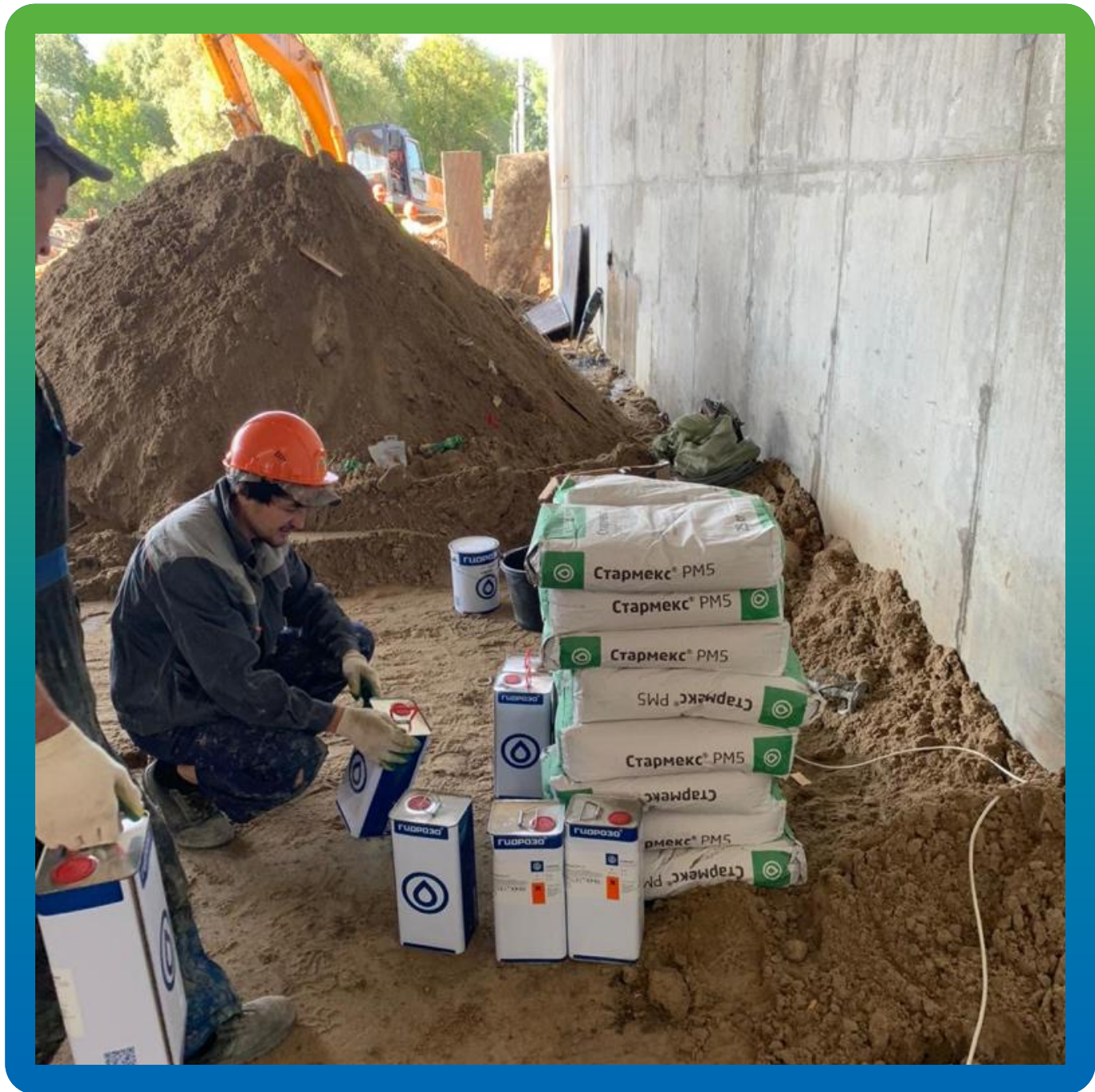
Подготовка материала к выполнению работ