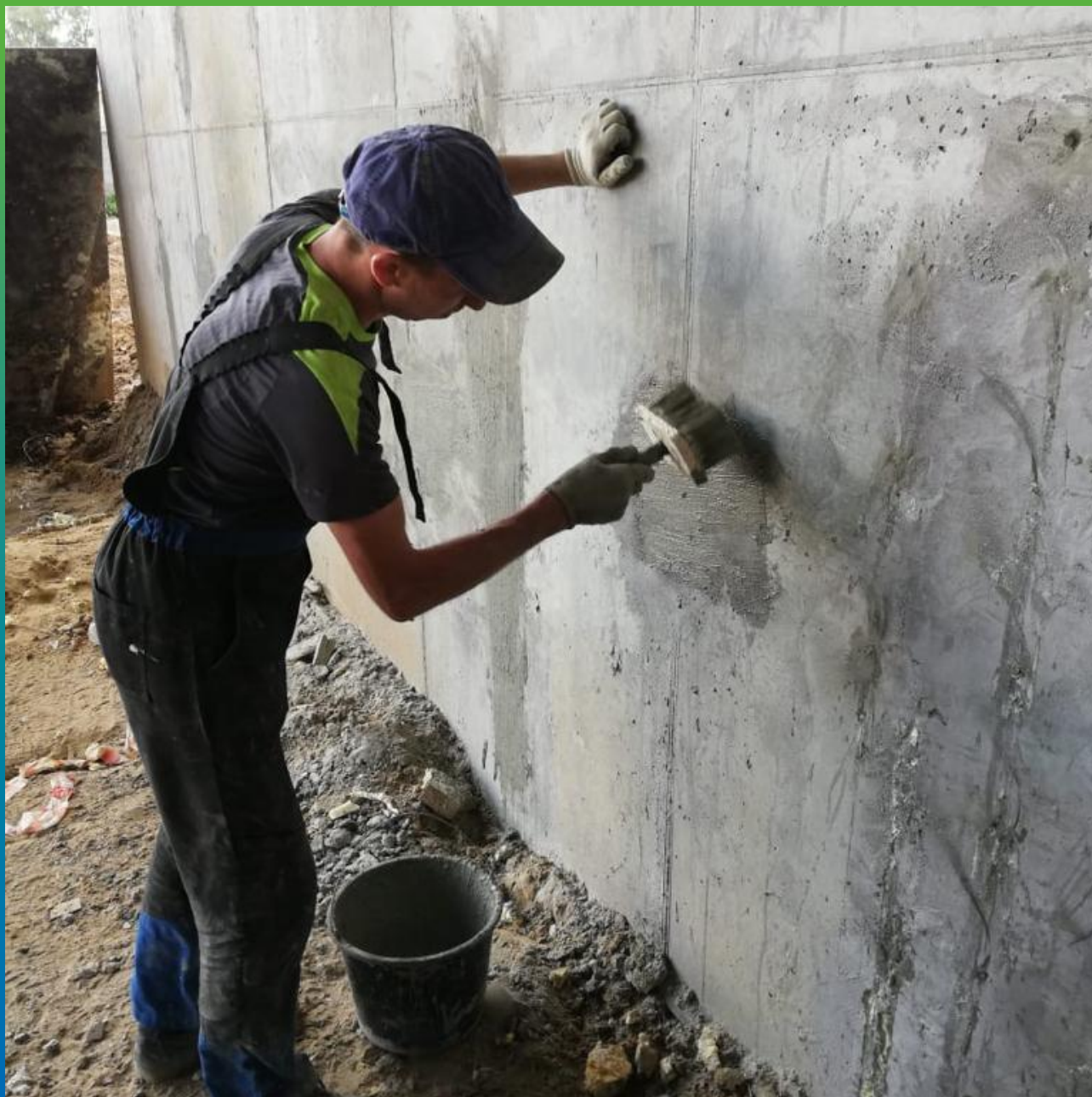
Покрытие ремонтного участка гидроизоляционным составом Стармекс Сил