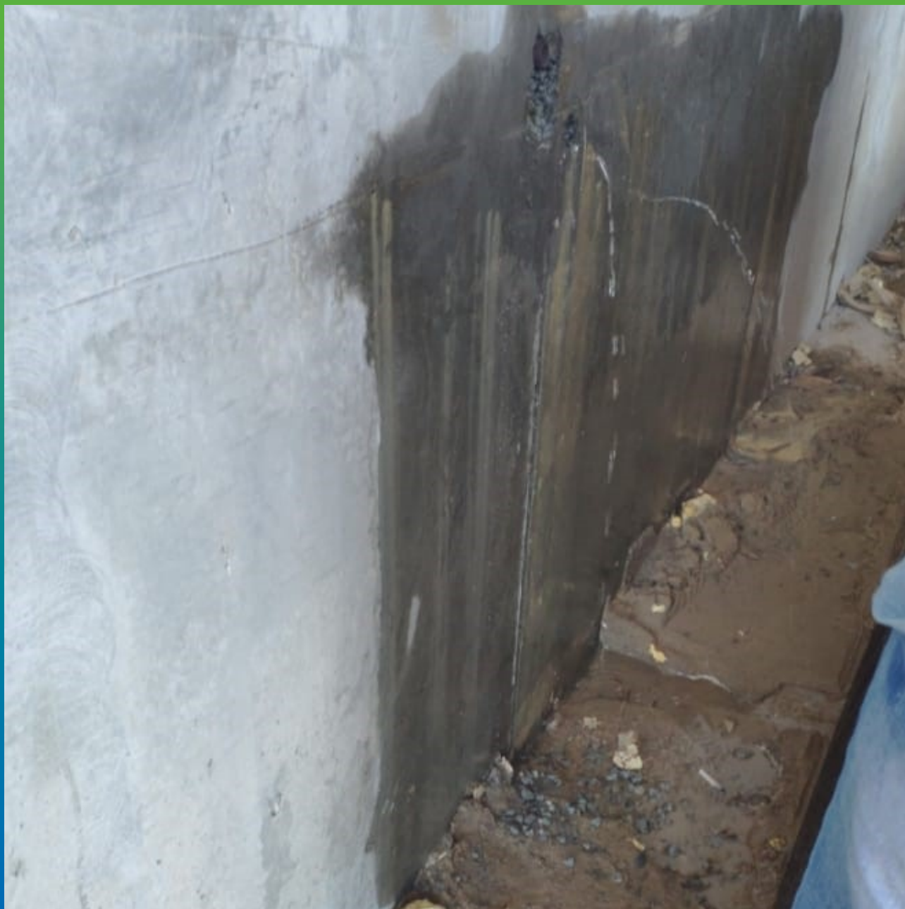
Подпорная стена с участками активных течей.