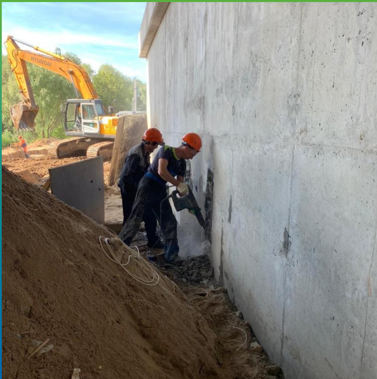
Демонтаж структурно не прочных участков бетона