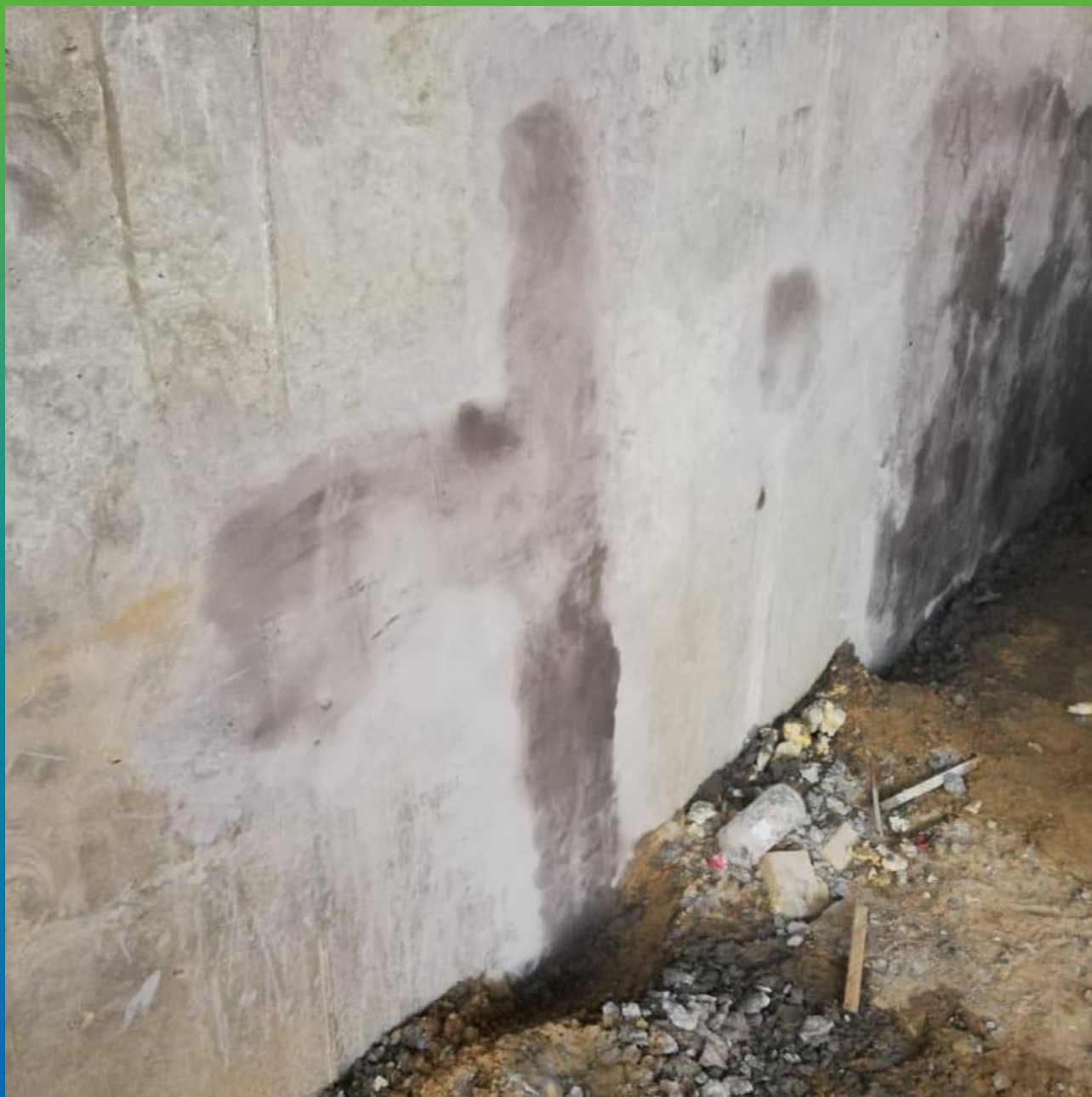
Отремонтированные участки бетонного основания