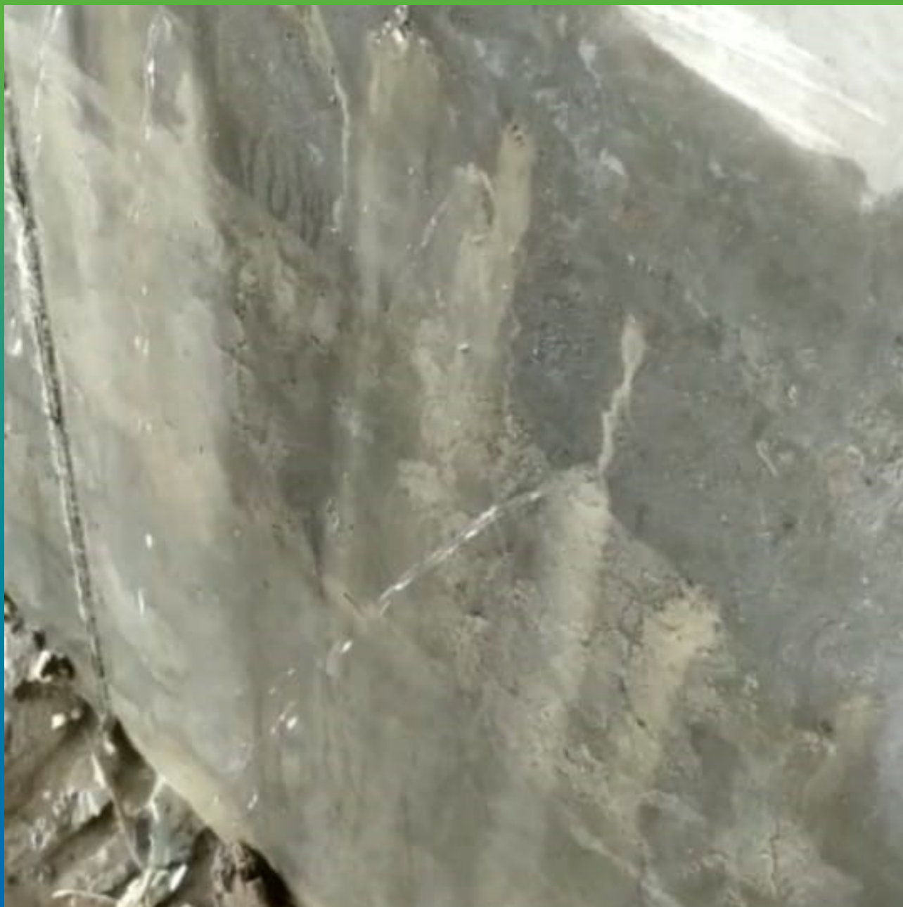
Подпорная стена с участками активных течей.