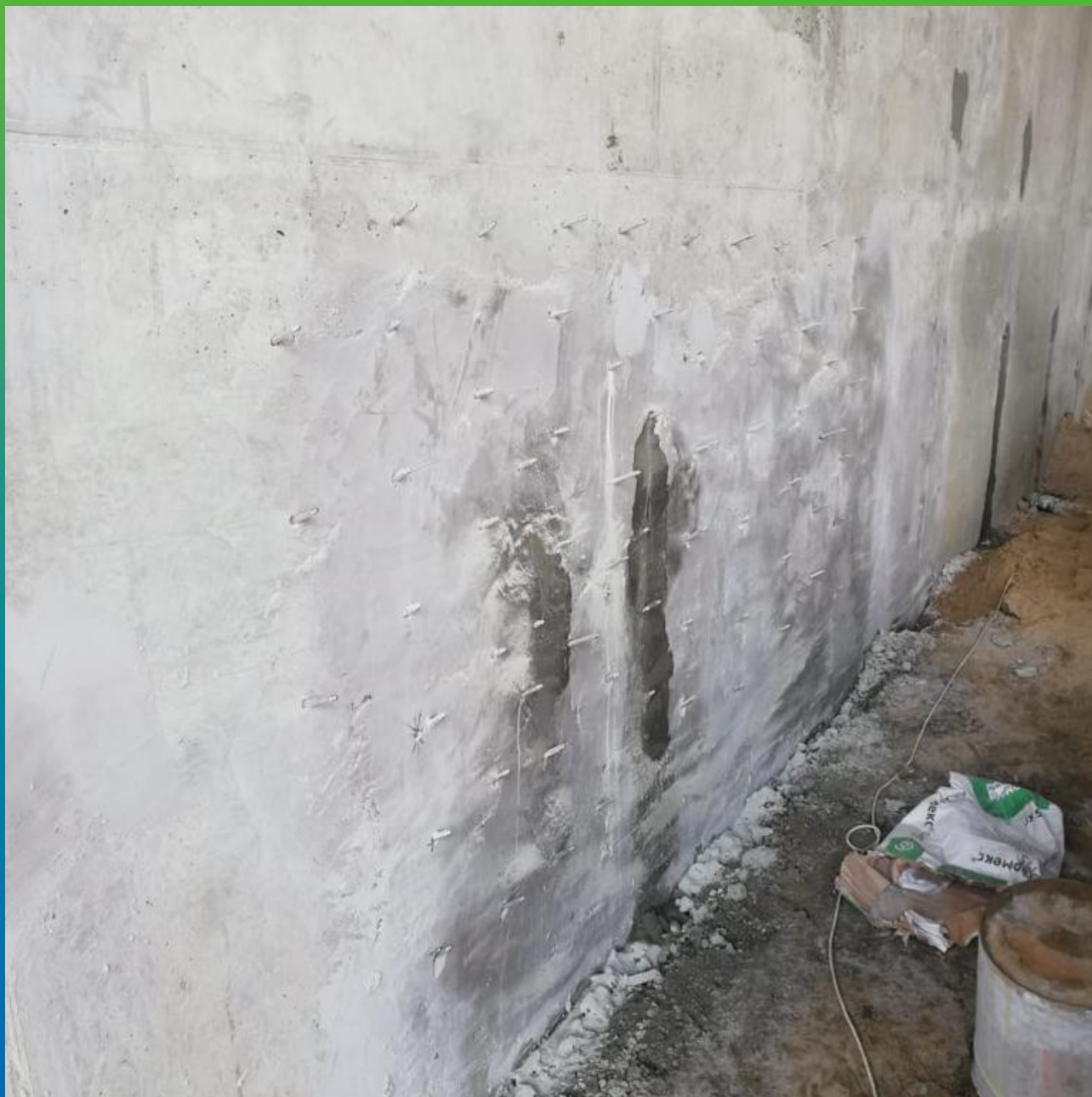
Монтаж пакеров для проведения работ по инъектированию