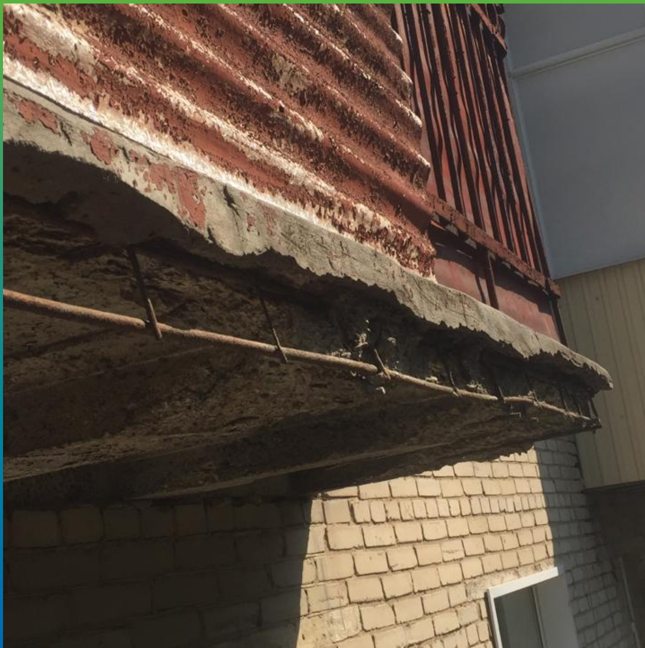
Разрушения ж/б плит балконов