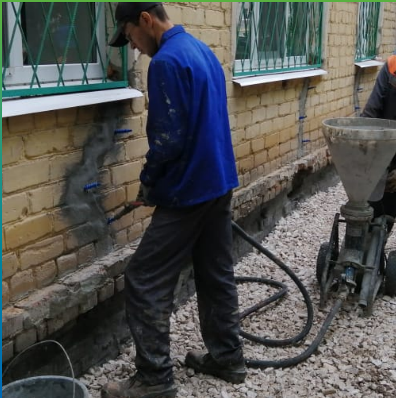
Инъектирование трещин на фасаде составом Маноцем Гроут насосом БМП6