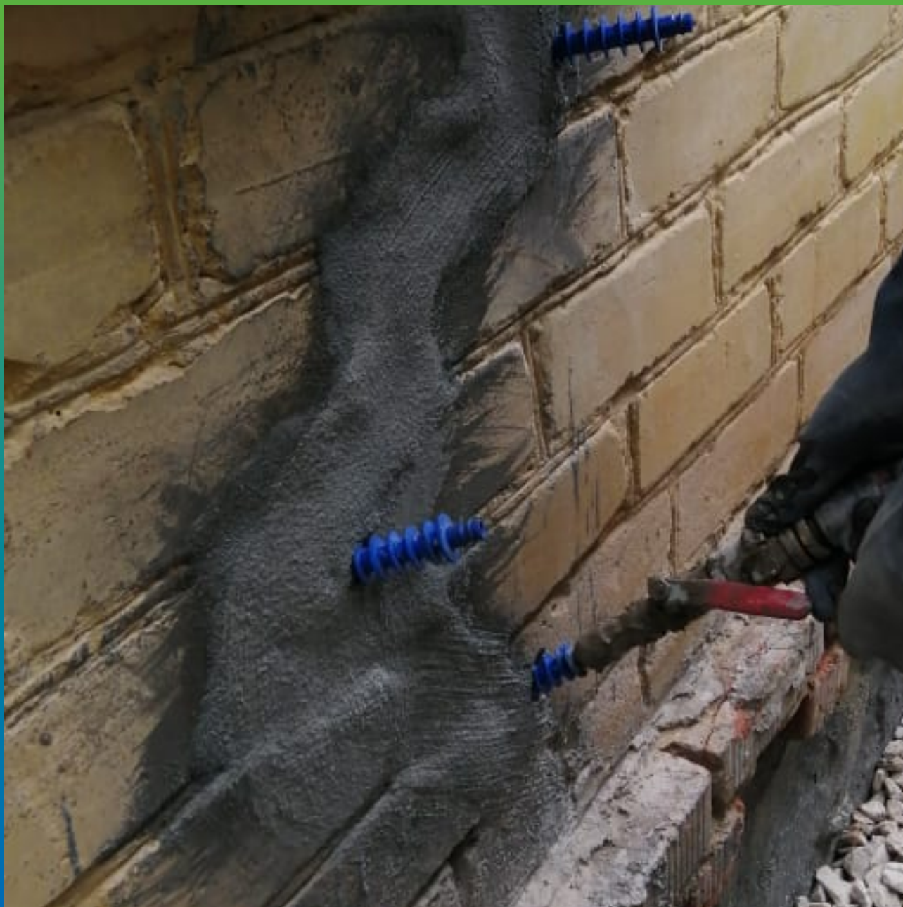
Инъектирование трещин на фасаде составом Маноцем Гроут