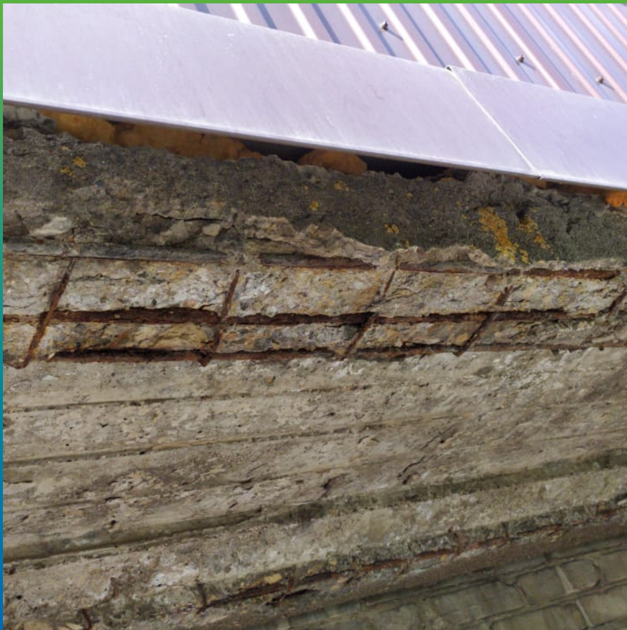
Разрушения ж/б плит балконов