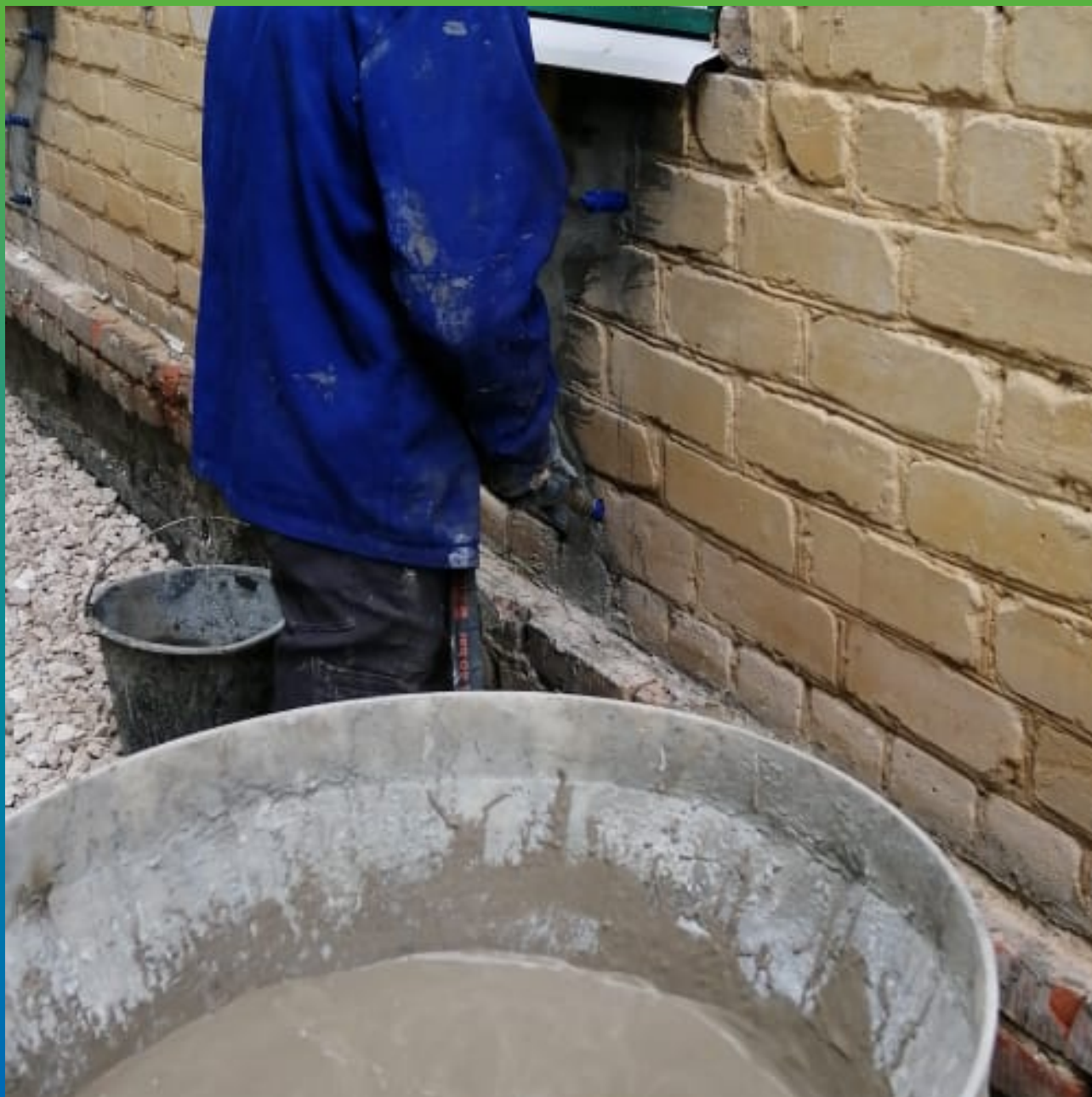
Инъектирование трещин на фасаде составом Маноцем Грут