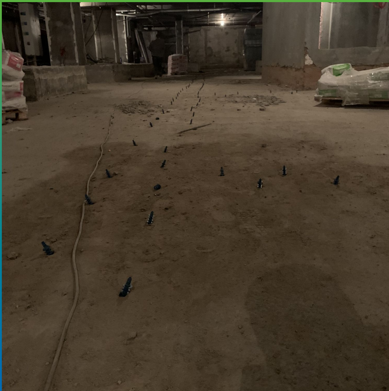
Пакеры БМ 2839, установленные в плиту основания