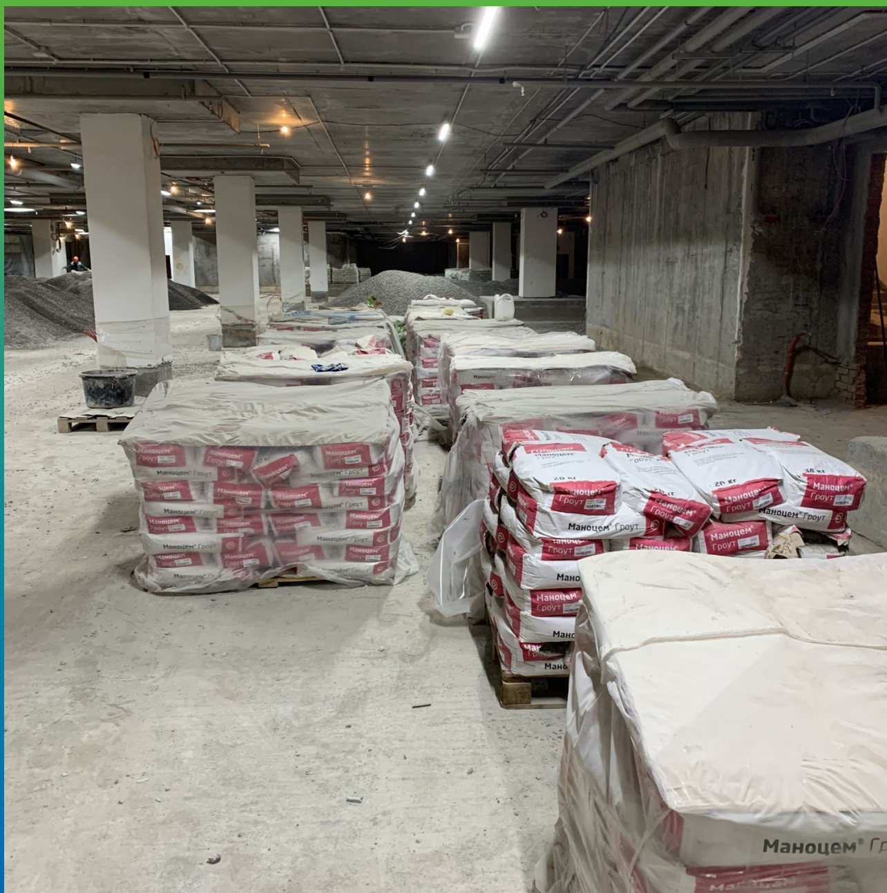
Материал на объекте