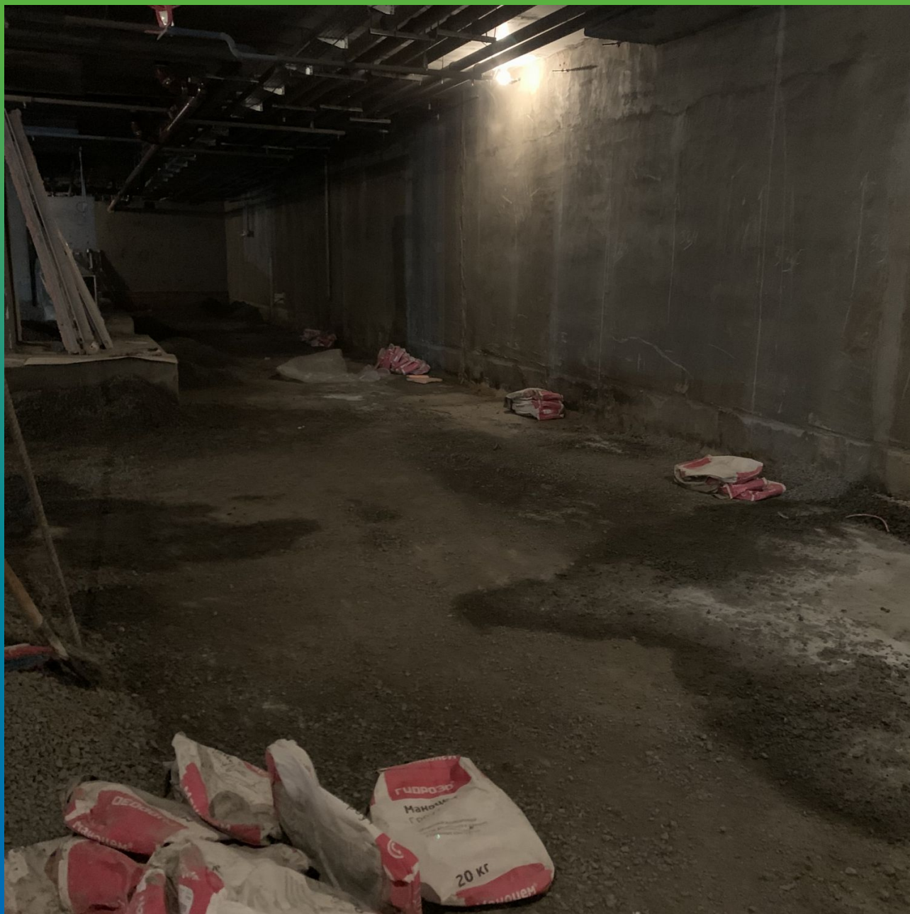
Стены, проинъектированные Манодем Грунт