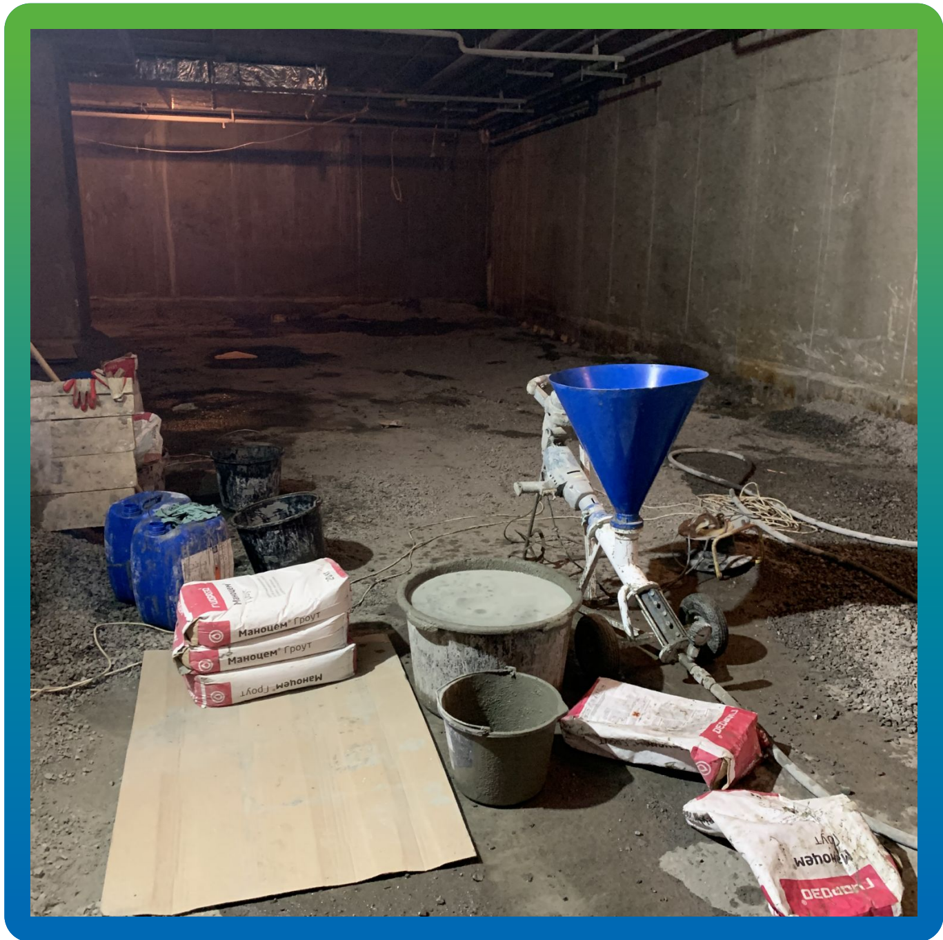
В процессе инъектирования Маноцем Грунт за стены