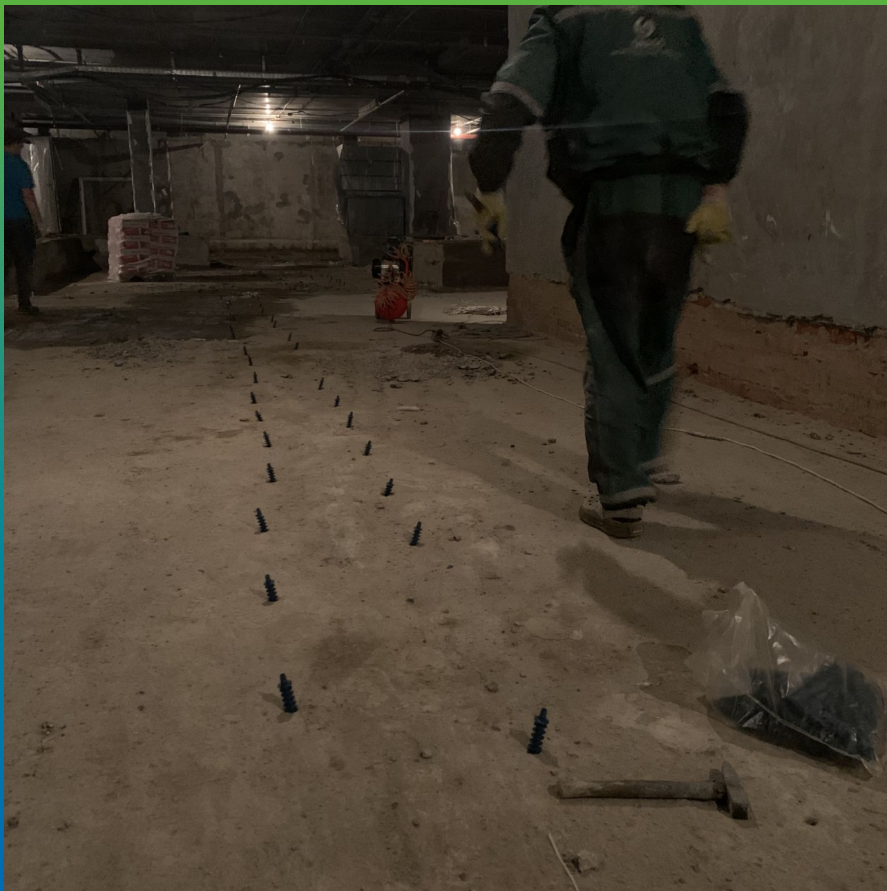
Установка пакеров БМ 2839 в плиту основания для дальнейшего инъектирования Маноцем Гроут