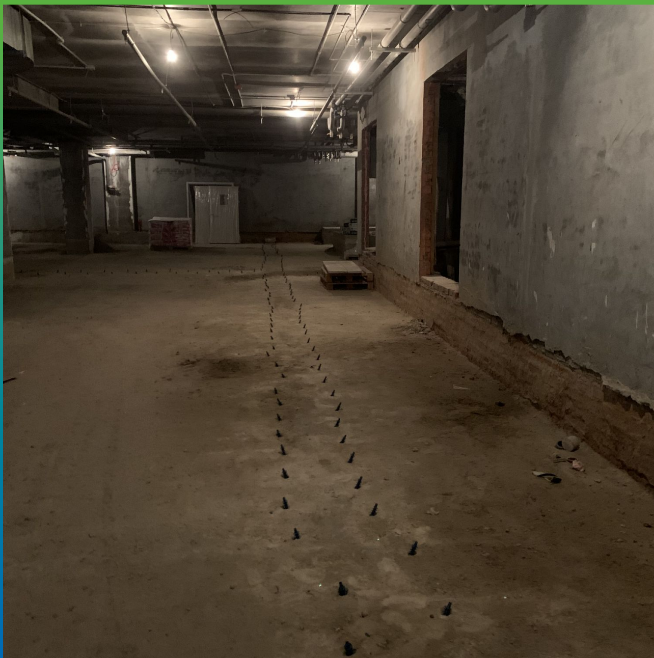
Пакеры БМ 2839, установленные в плиту основания