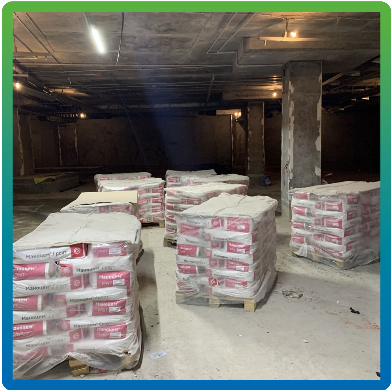
Материал на объекте