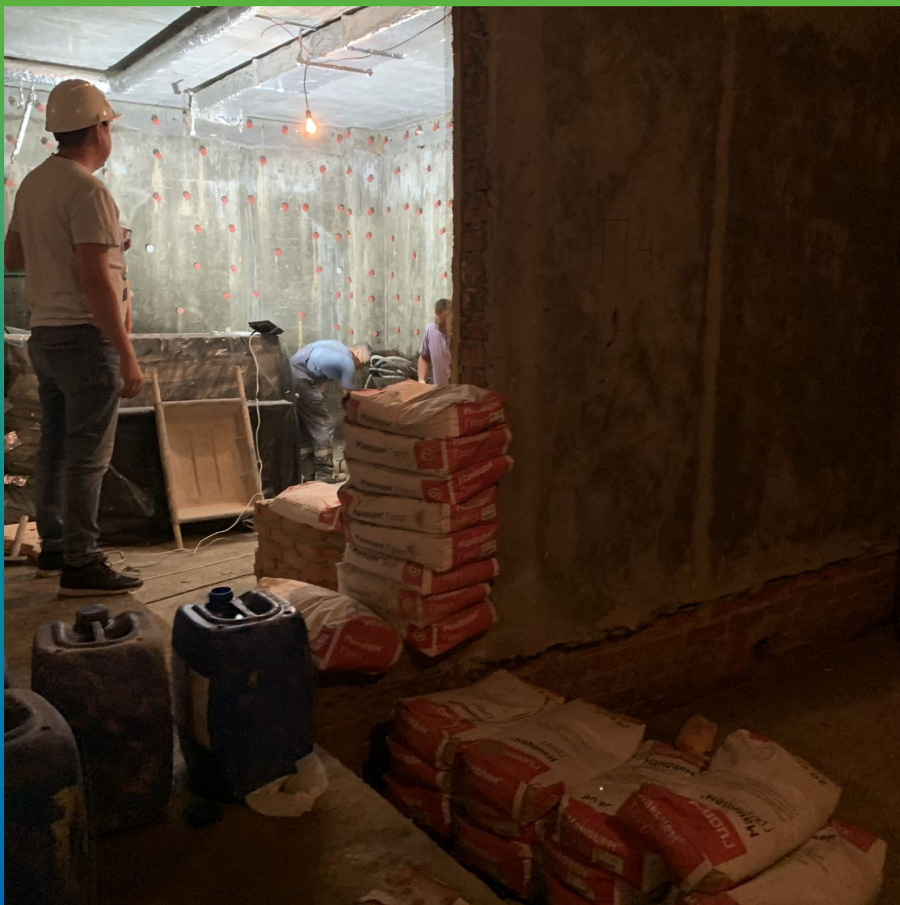
Подготовка к инъектированию