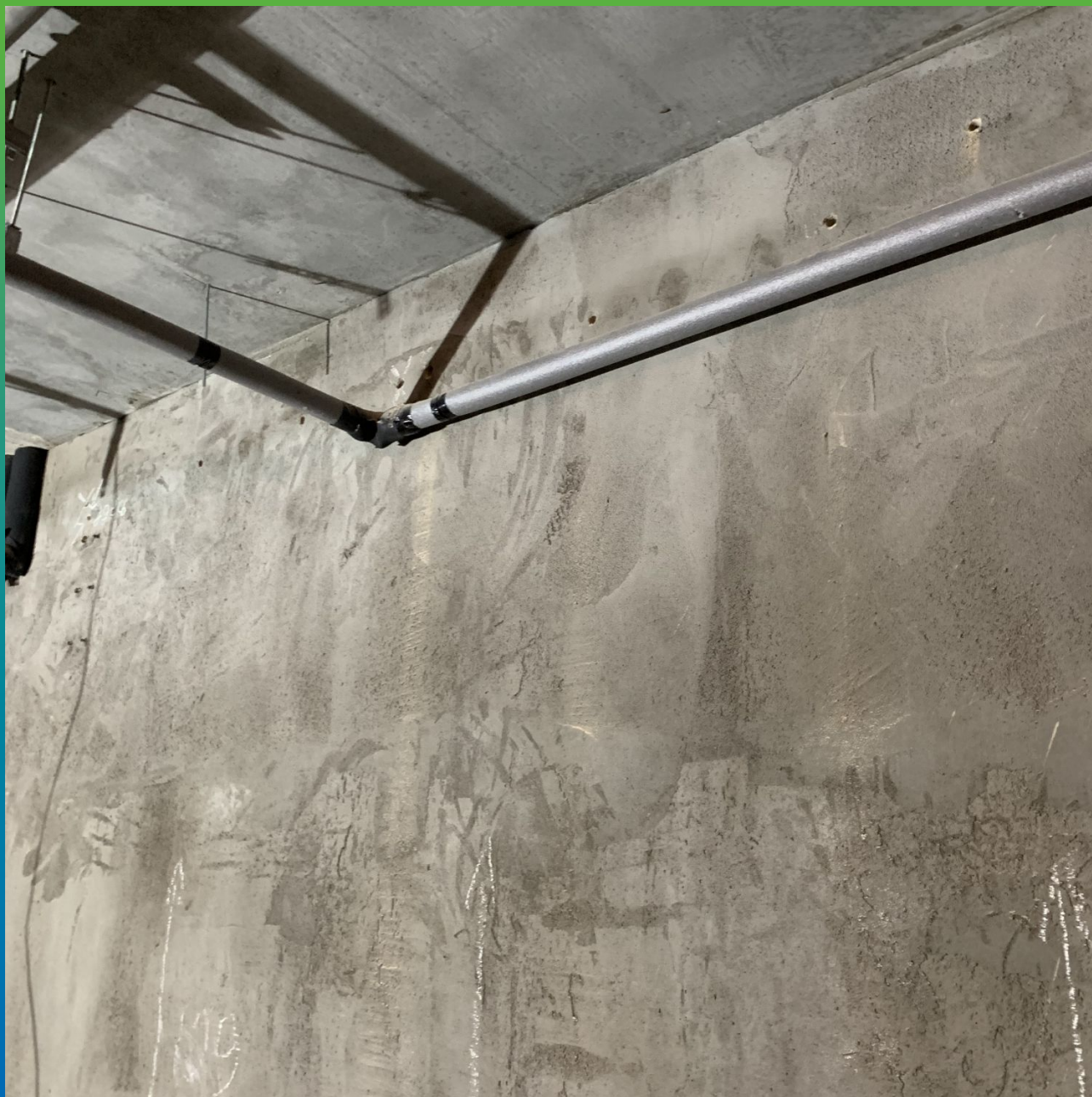
Отверстия в стенах для установки пакеров БМ 2839