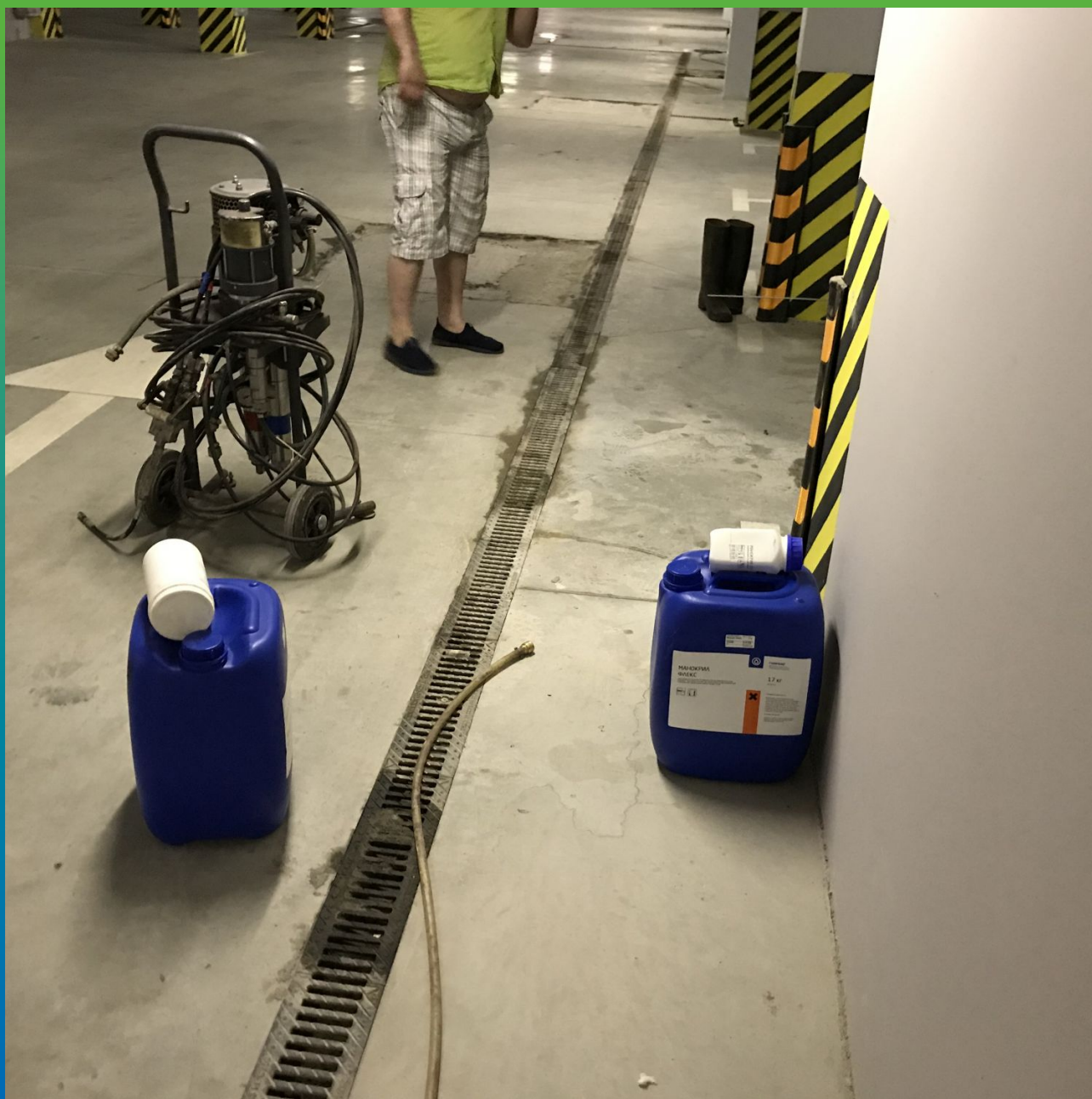
Подготовка насоса и материала Манокрил Гель В