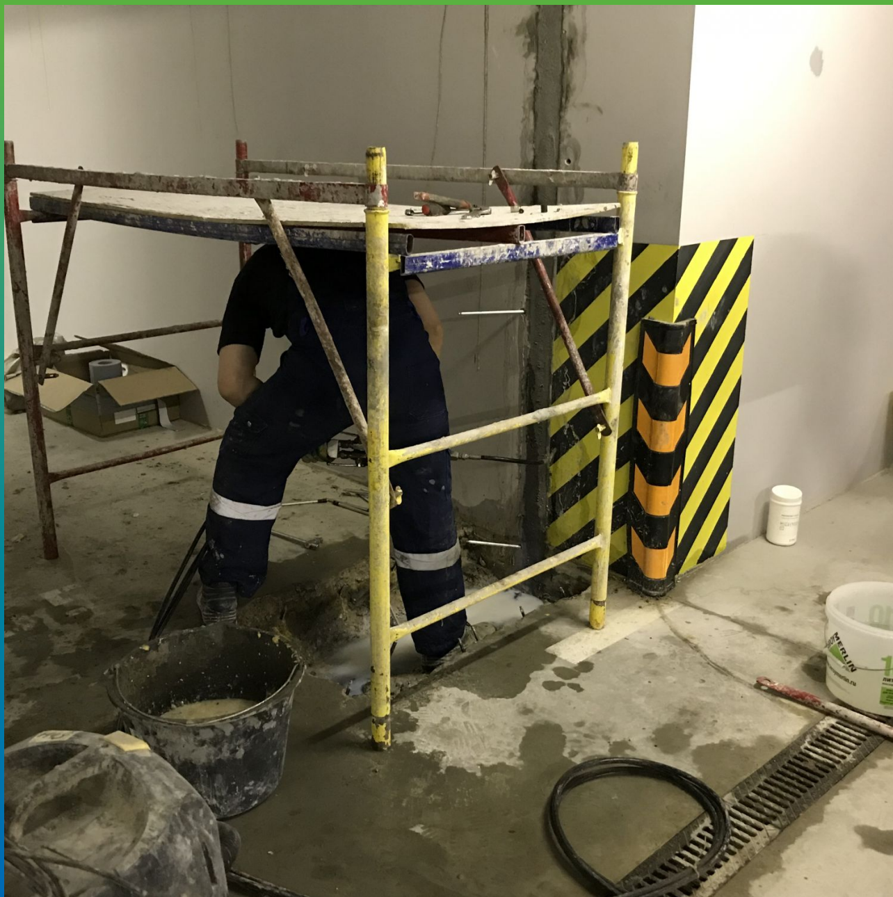
Инъектирование состава в деформационный шов