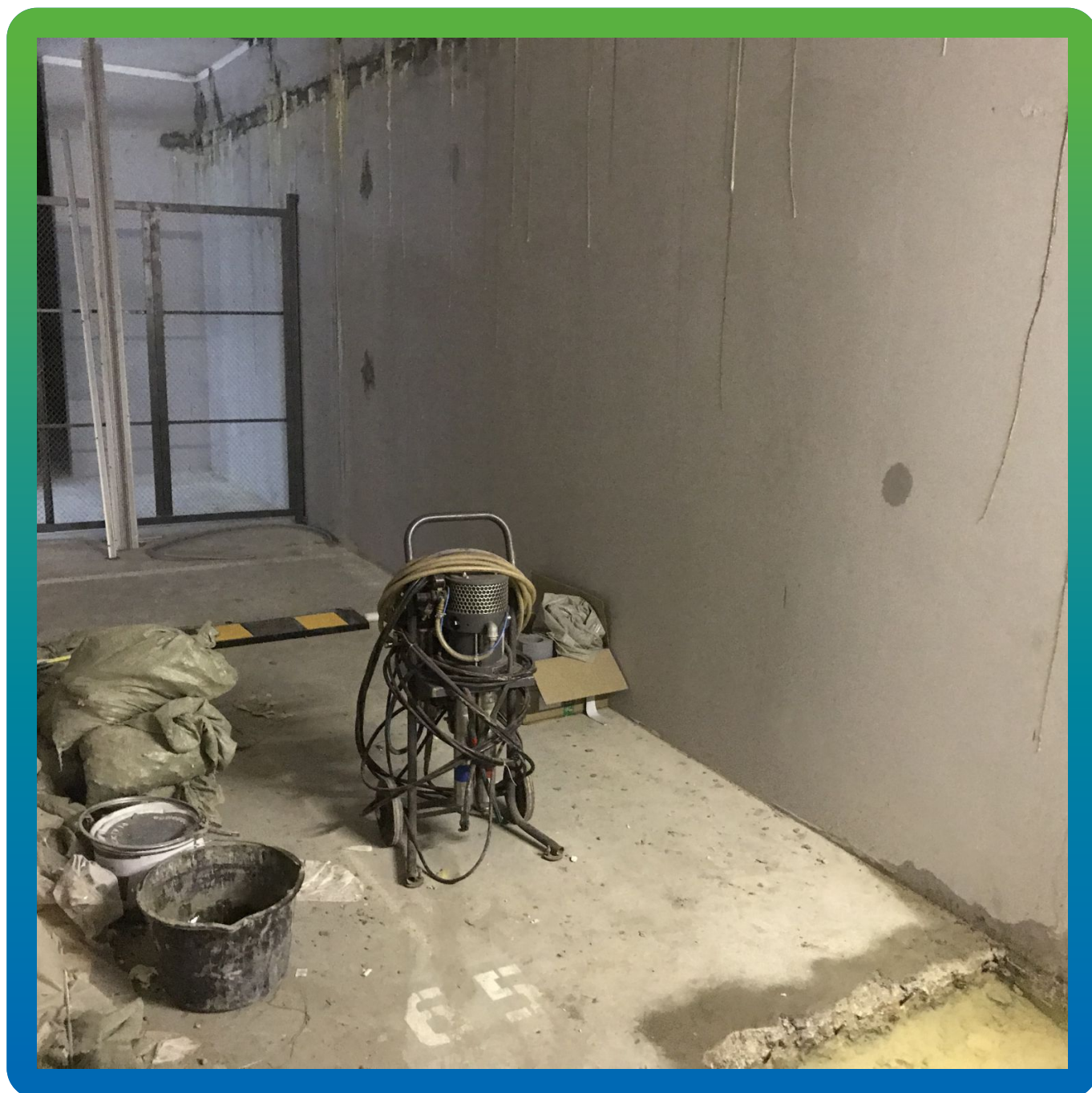
Проблемная зона деформационных швов