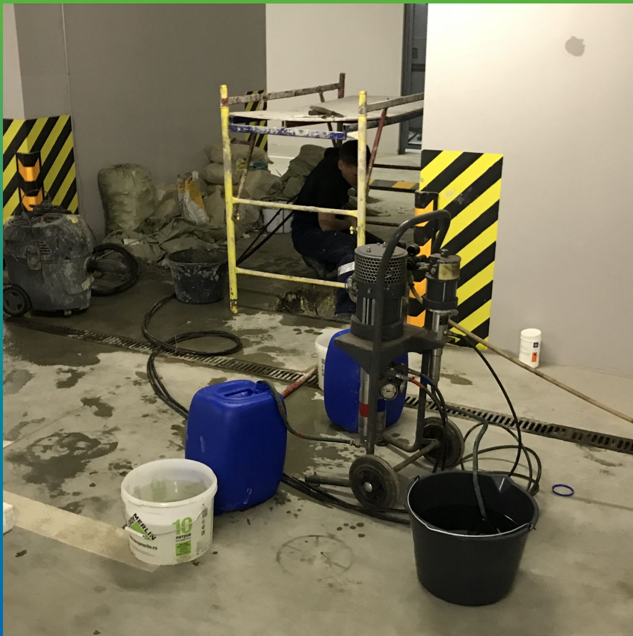
Подготовленный насос БМ 1425 и материал Манокрил Гель В к проведению работ