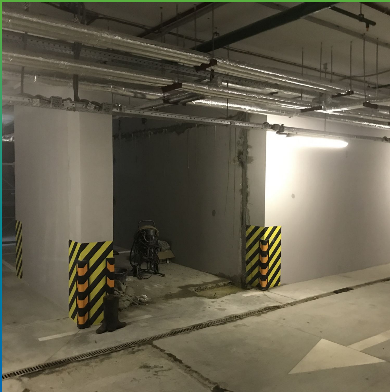
Протечки в зоне деформационных швов