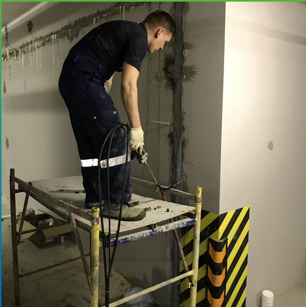
Инъектирование состава в деформационный шов