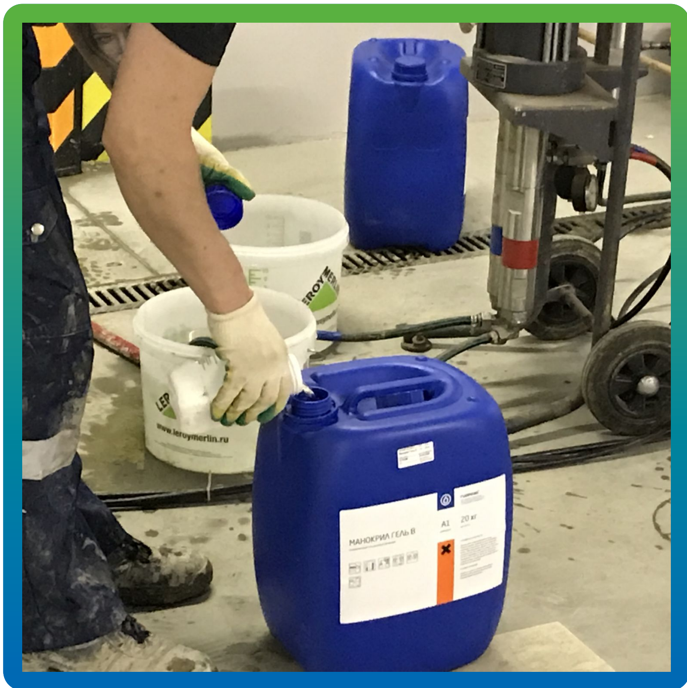
Подготовка материала к инъектированию