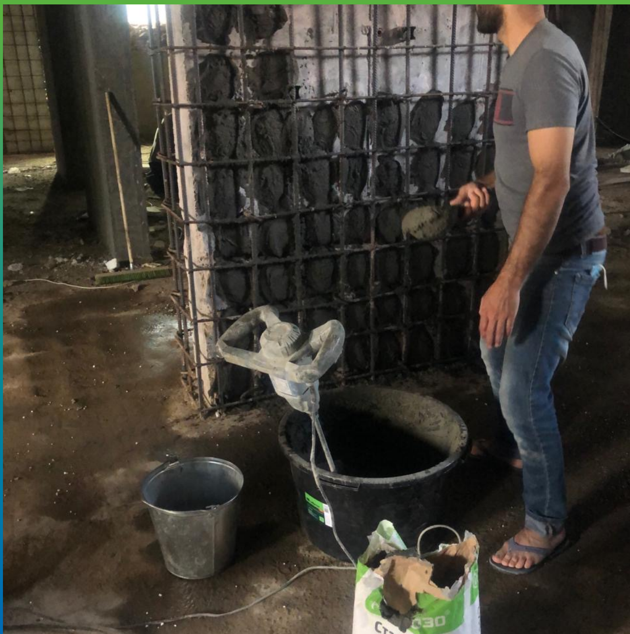
Нанесение Стармекс РМ 3 на колонну методом оштукатуривания