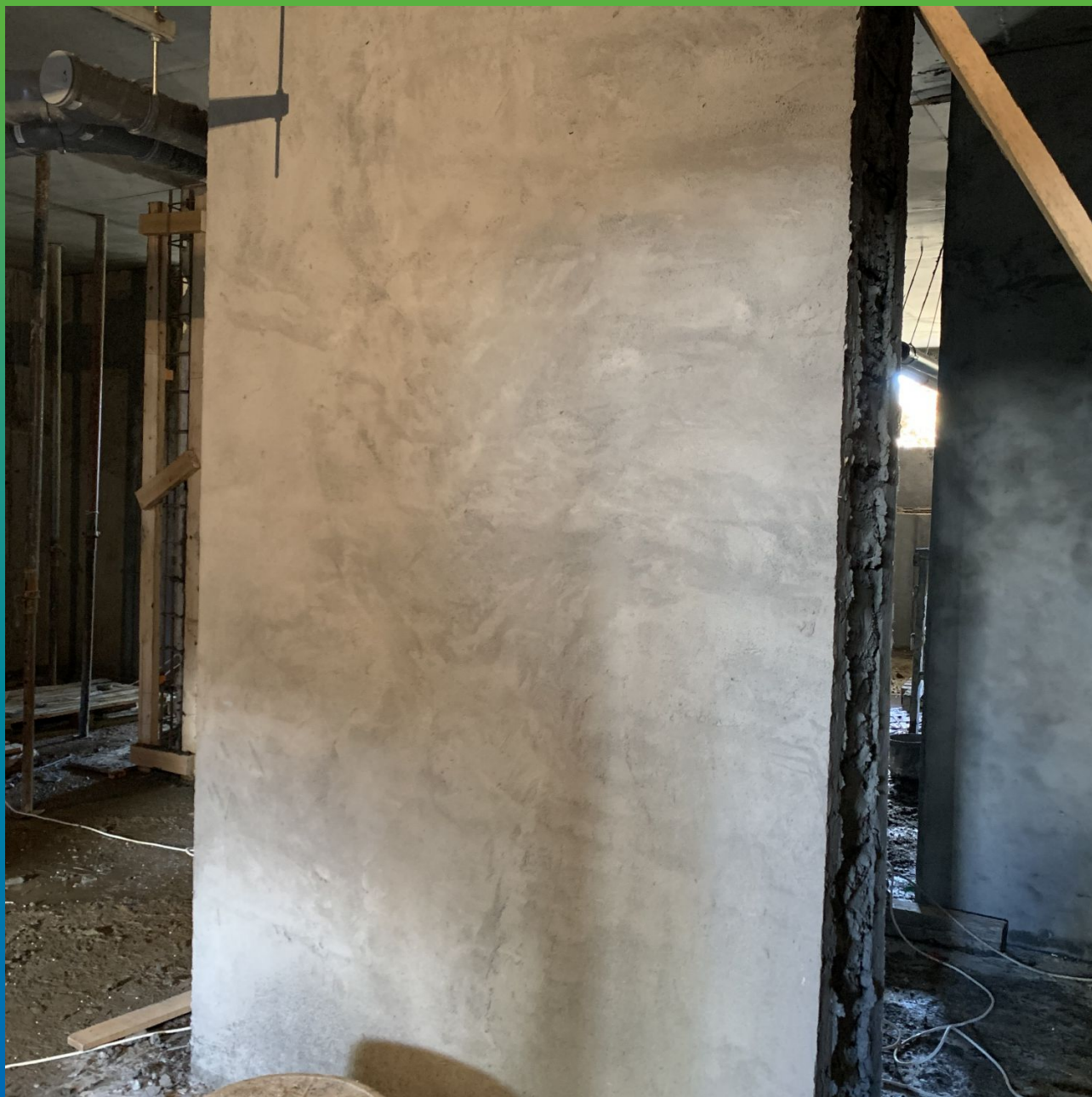
Финишный вид колонны с двумя слоями рем. состава Стармекс РМЗ