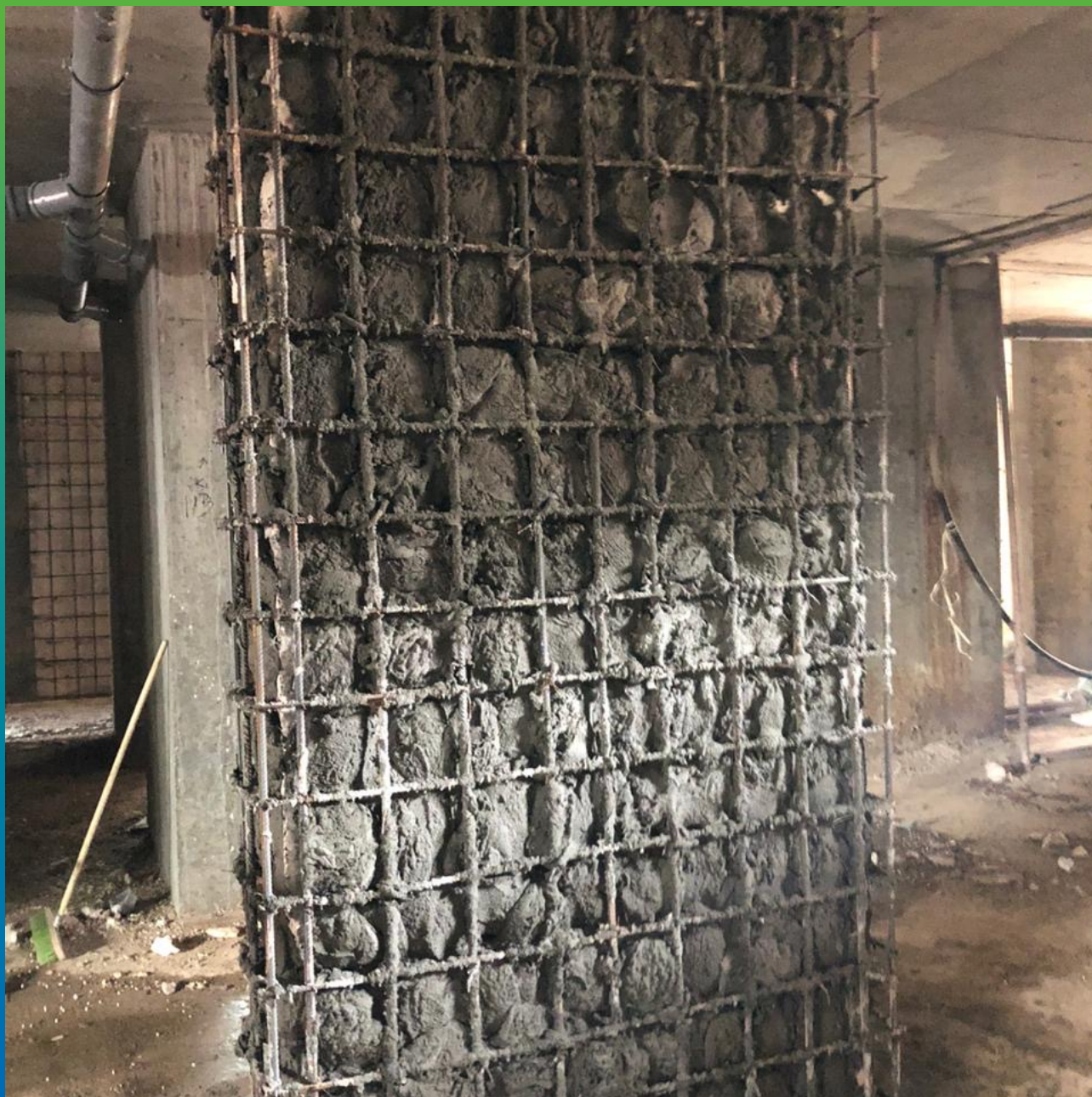
Первый слой состава Стармекс РМЗ