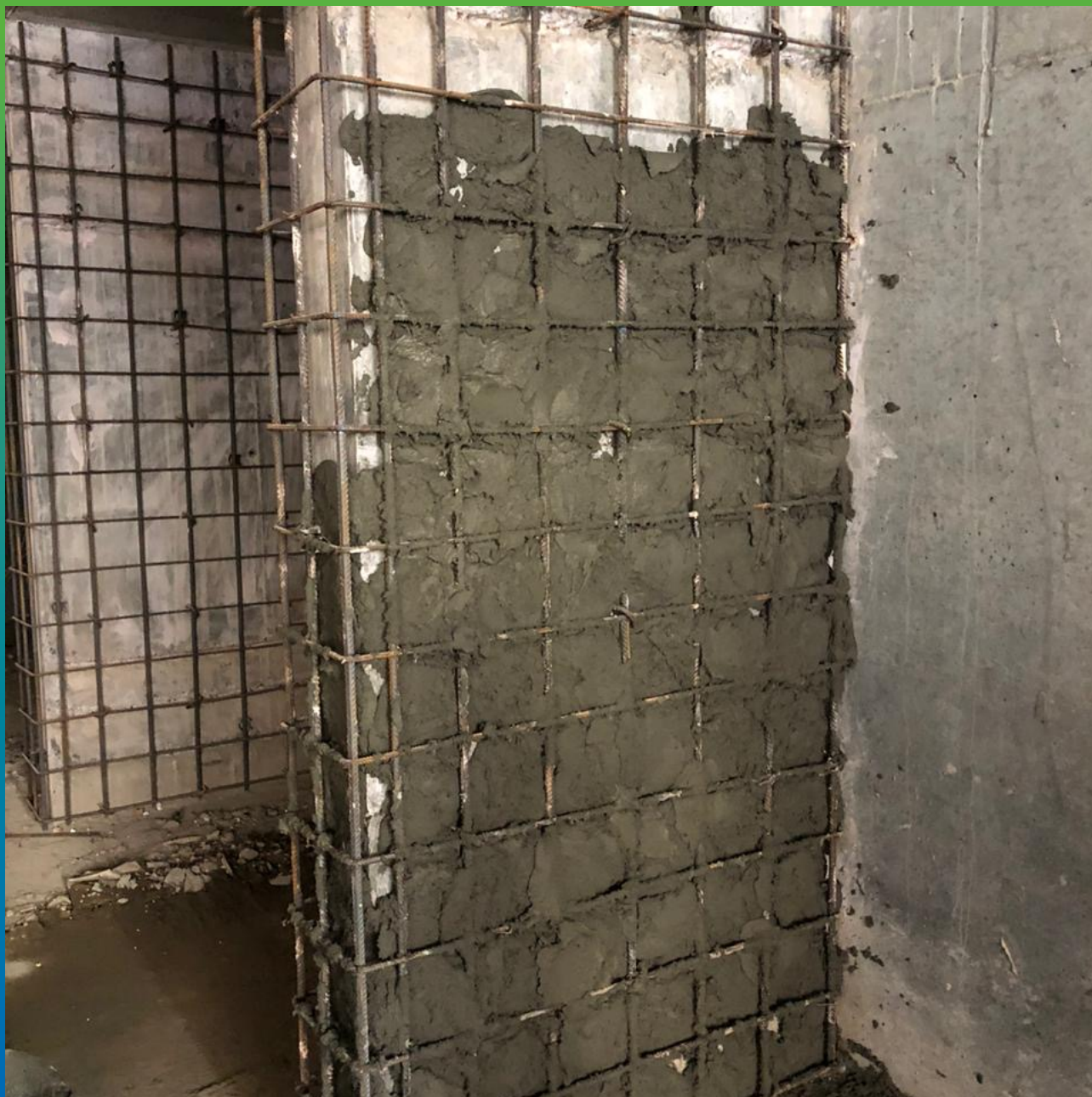
Первый слой состава Стармекс РМЗ