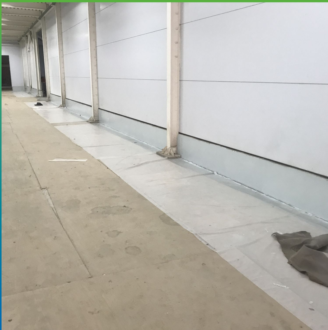
Нанесение состава ДенсТоп ЭП 205 на цоколи