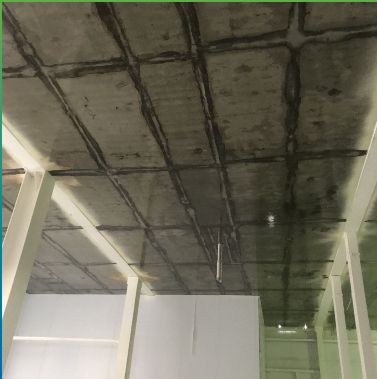
Грунтование поверхности составом ДенсТоп ЭП 106