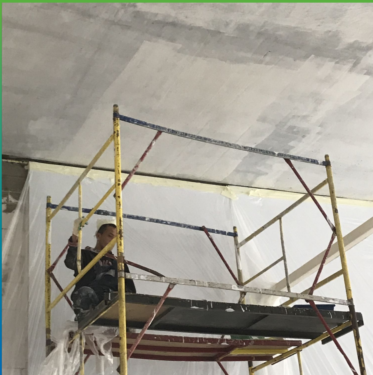
Первый слой ДенсТоп ЭП 201 на перекрытии