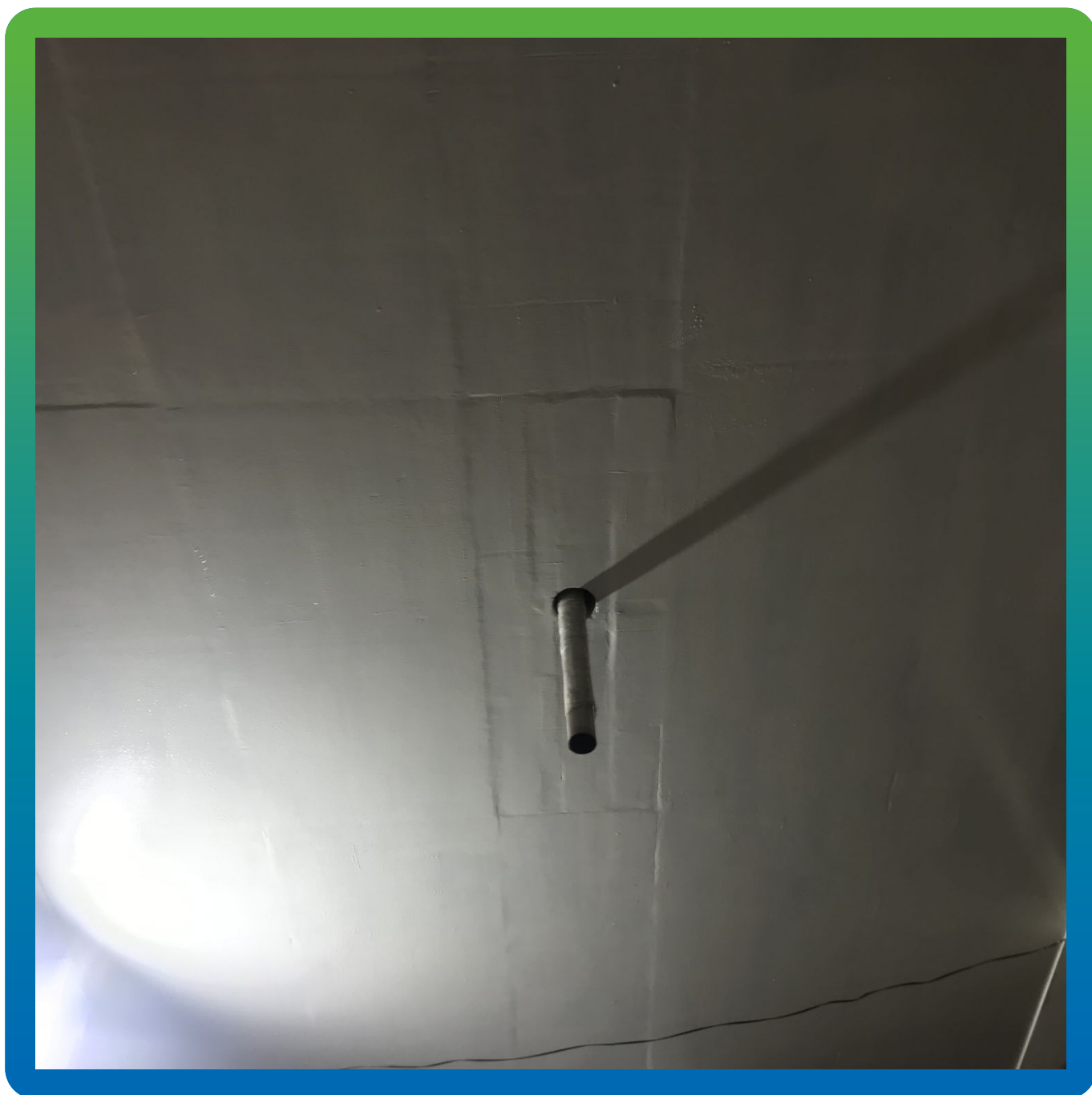
Финишный вариант покрытия