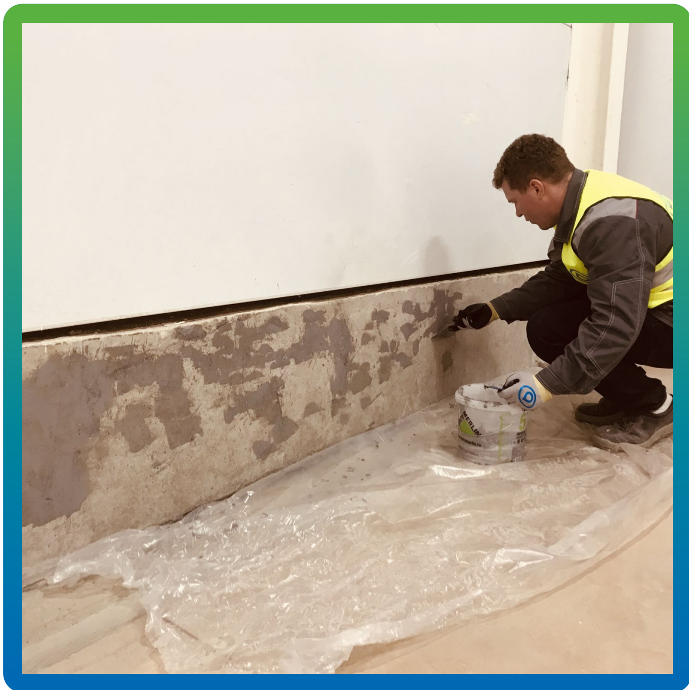
Подготовка поверхности цоколей и перекрытия составом Манопокс 331