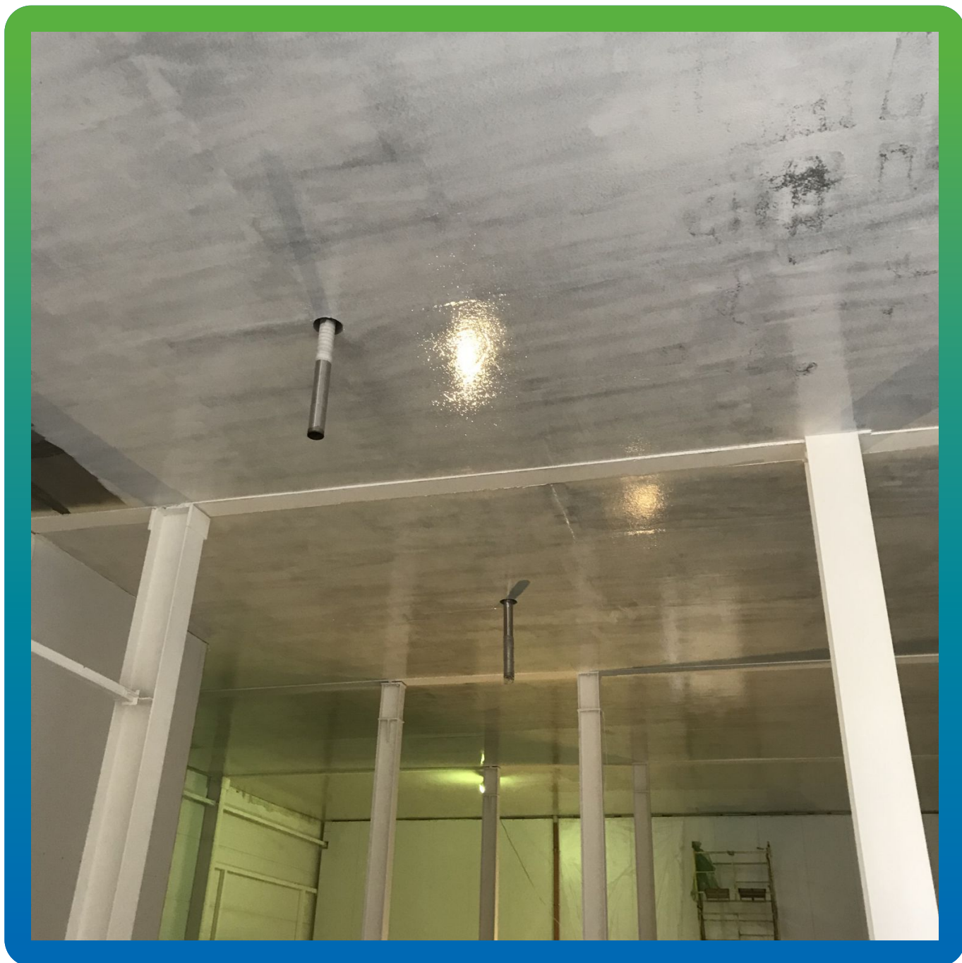
Первый слой ДенсТоп ЭП 201