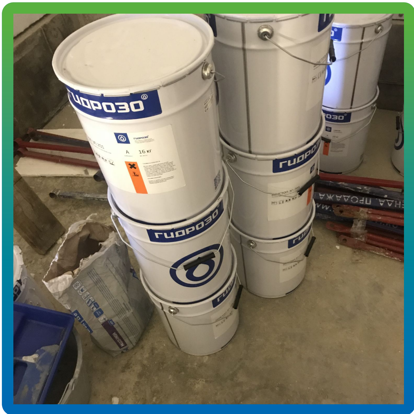
Материалы на объекте