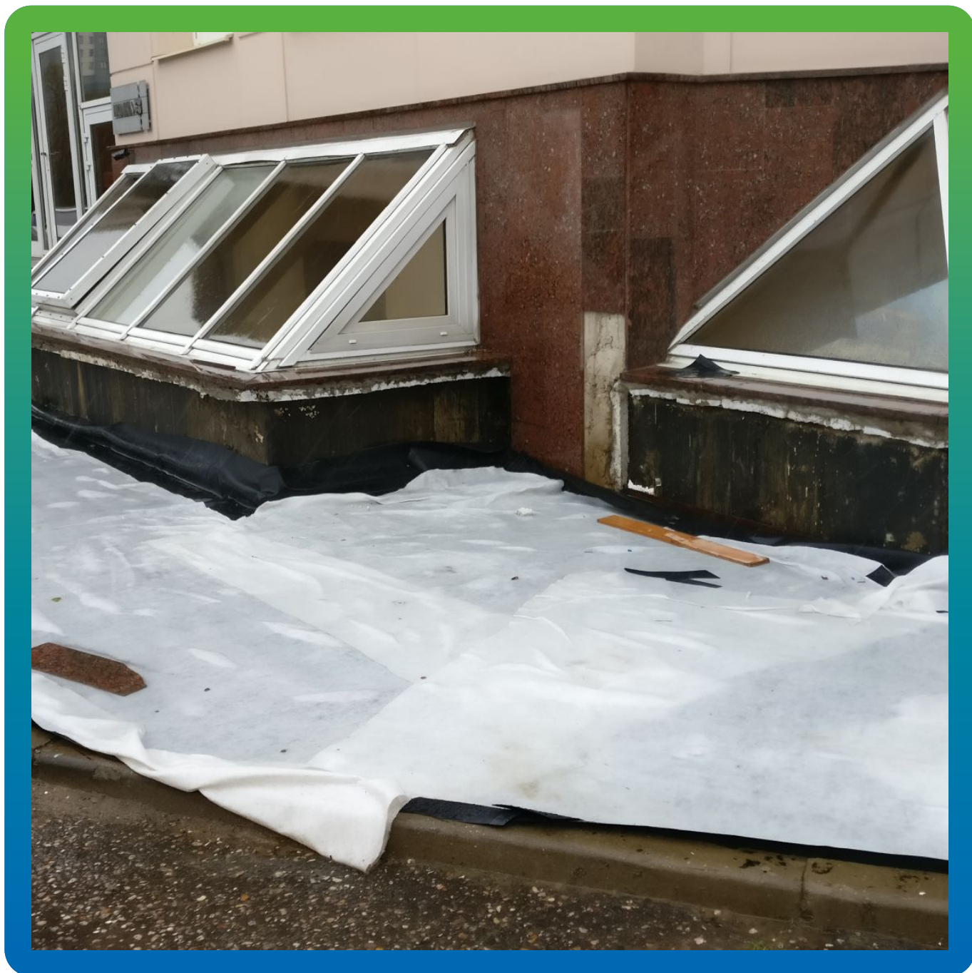
Последующее устройство геотекстильной подложки