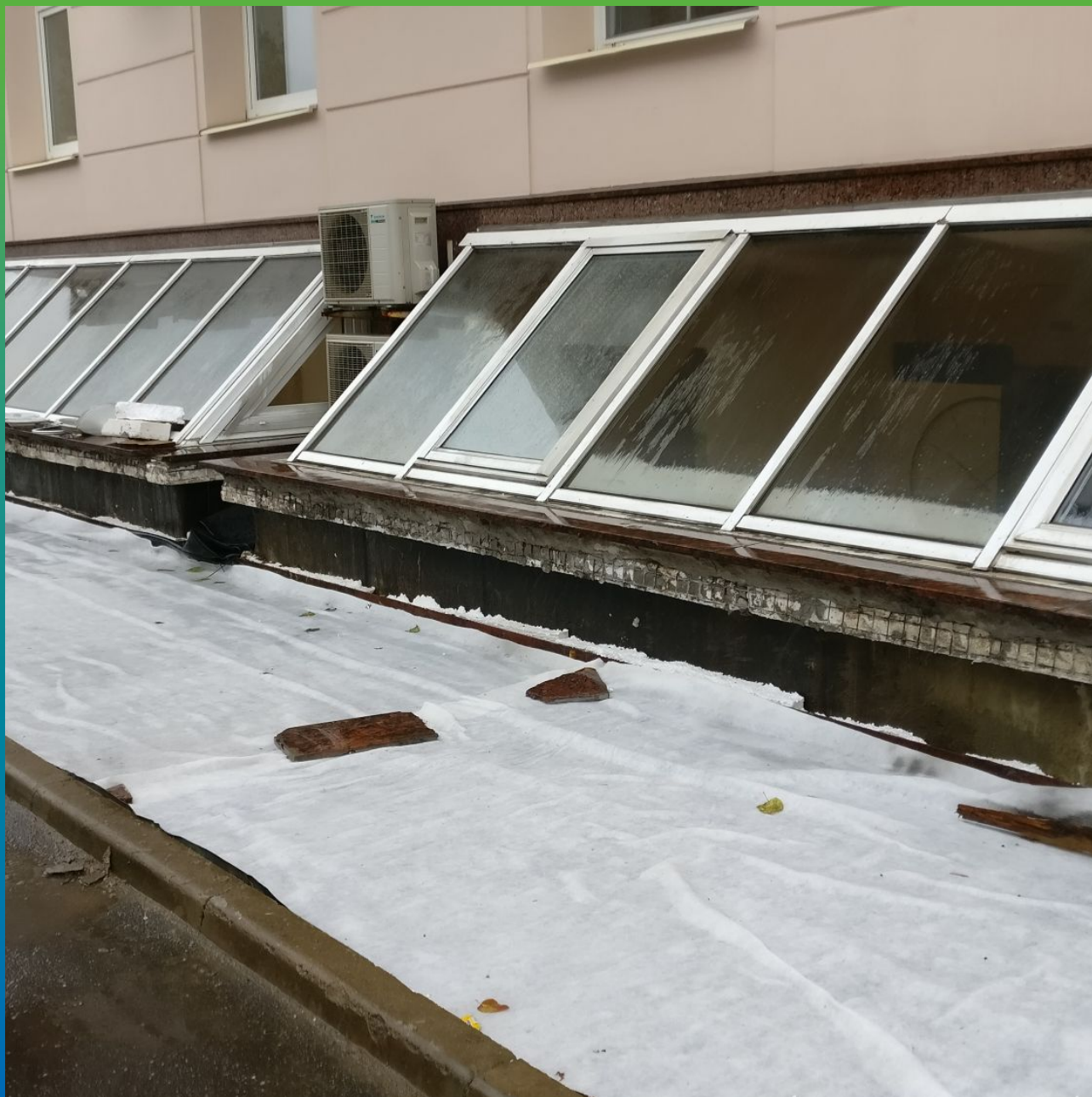
Последующее устройство геотекстильной подложки