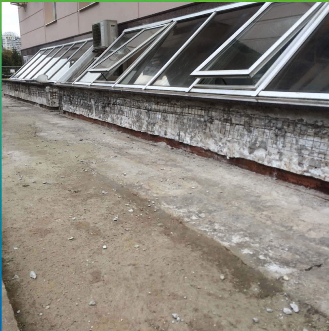
Выравнивание и подготовка основания