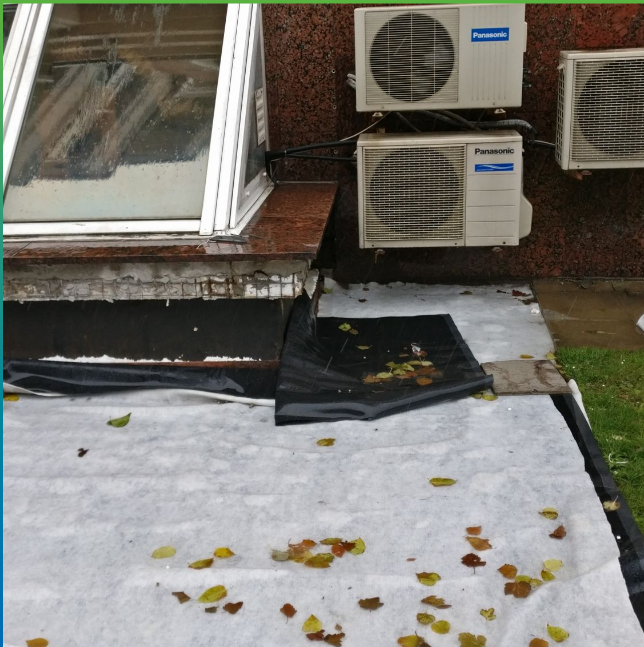
Последующее устройство геотекстильной подложки