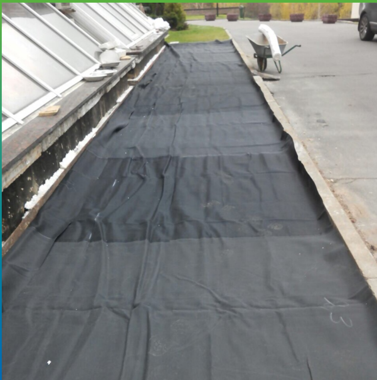
Расстил мембраны ЭПДМ Преласта СТ1.2