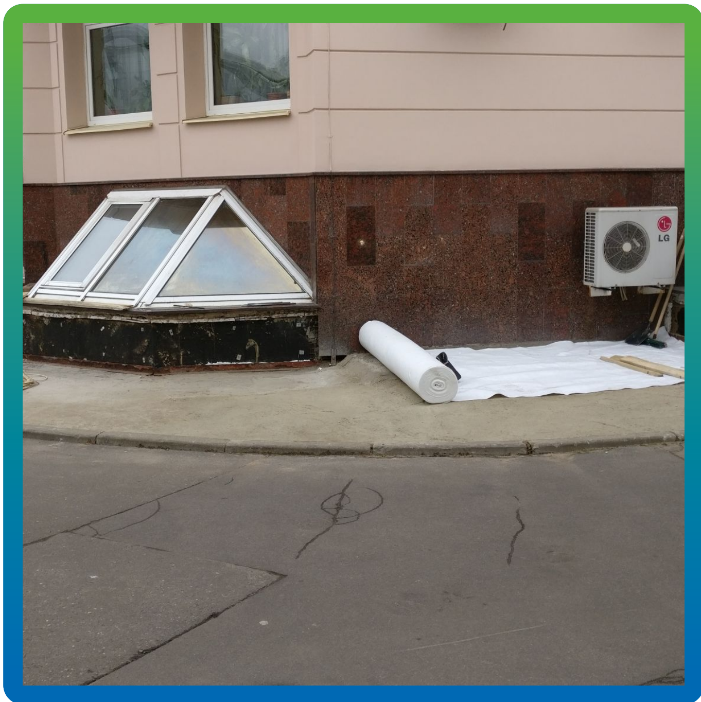
Укладка геотекстильного слоя