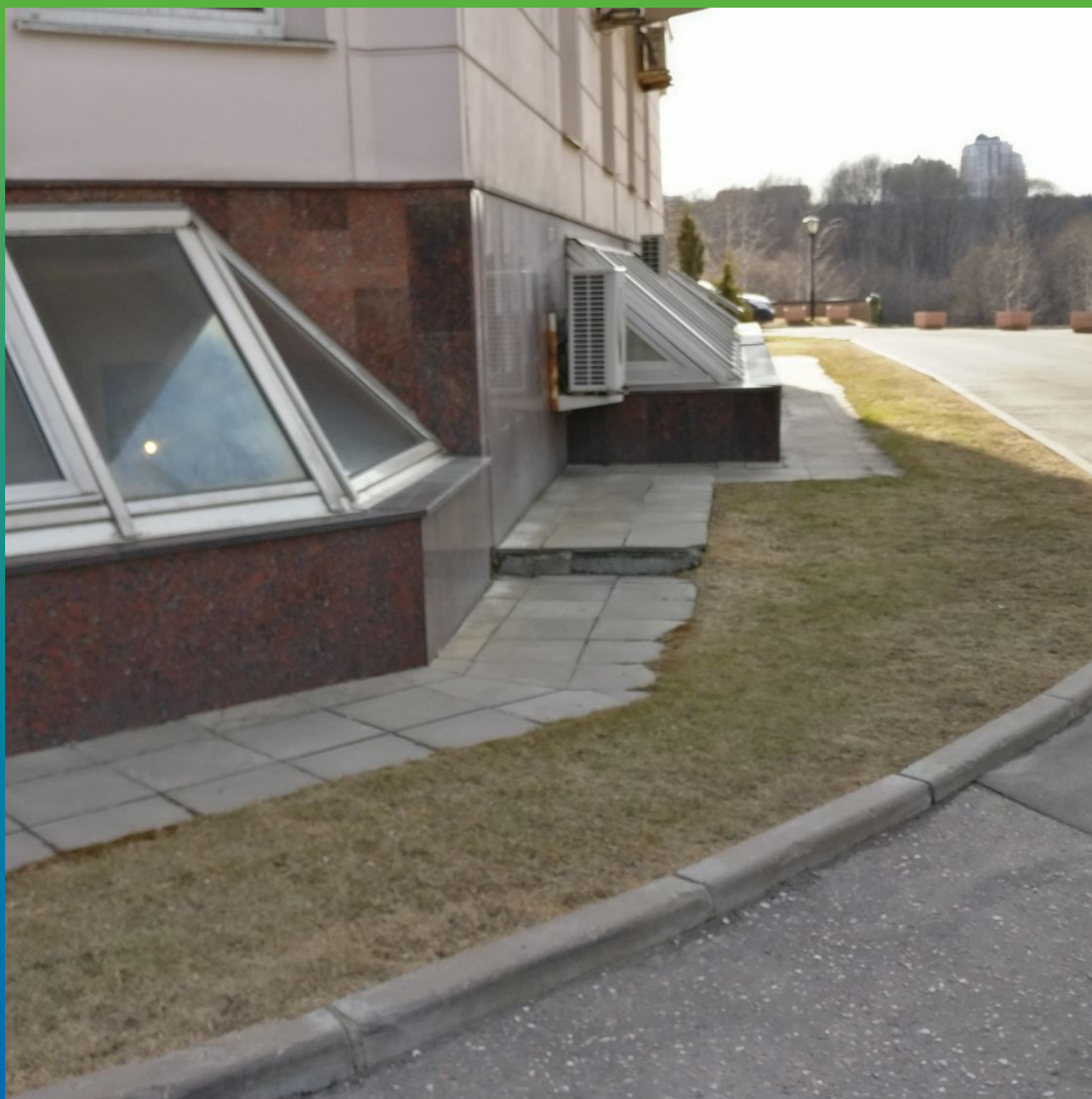
Вид устройства отмостной зоны и стилобата до начала работ