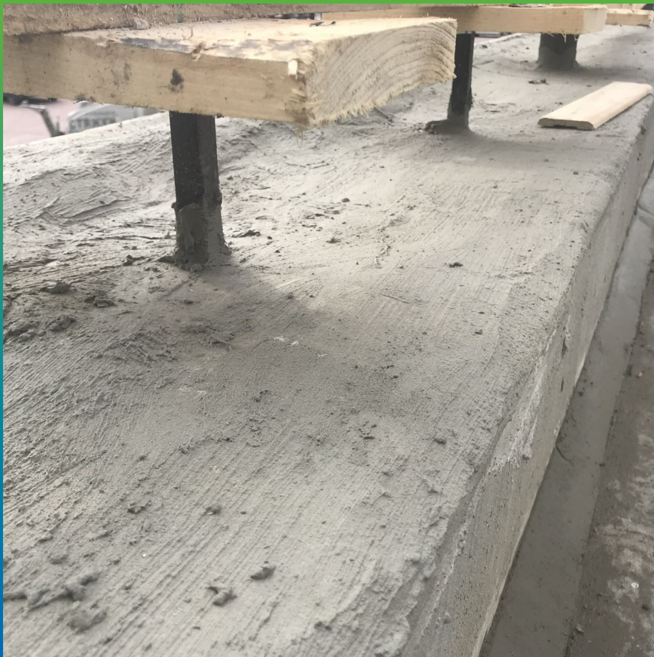
Стармекс Сил Флекс на парепете