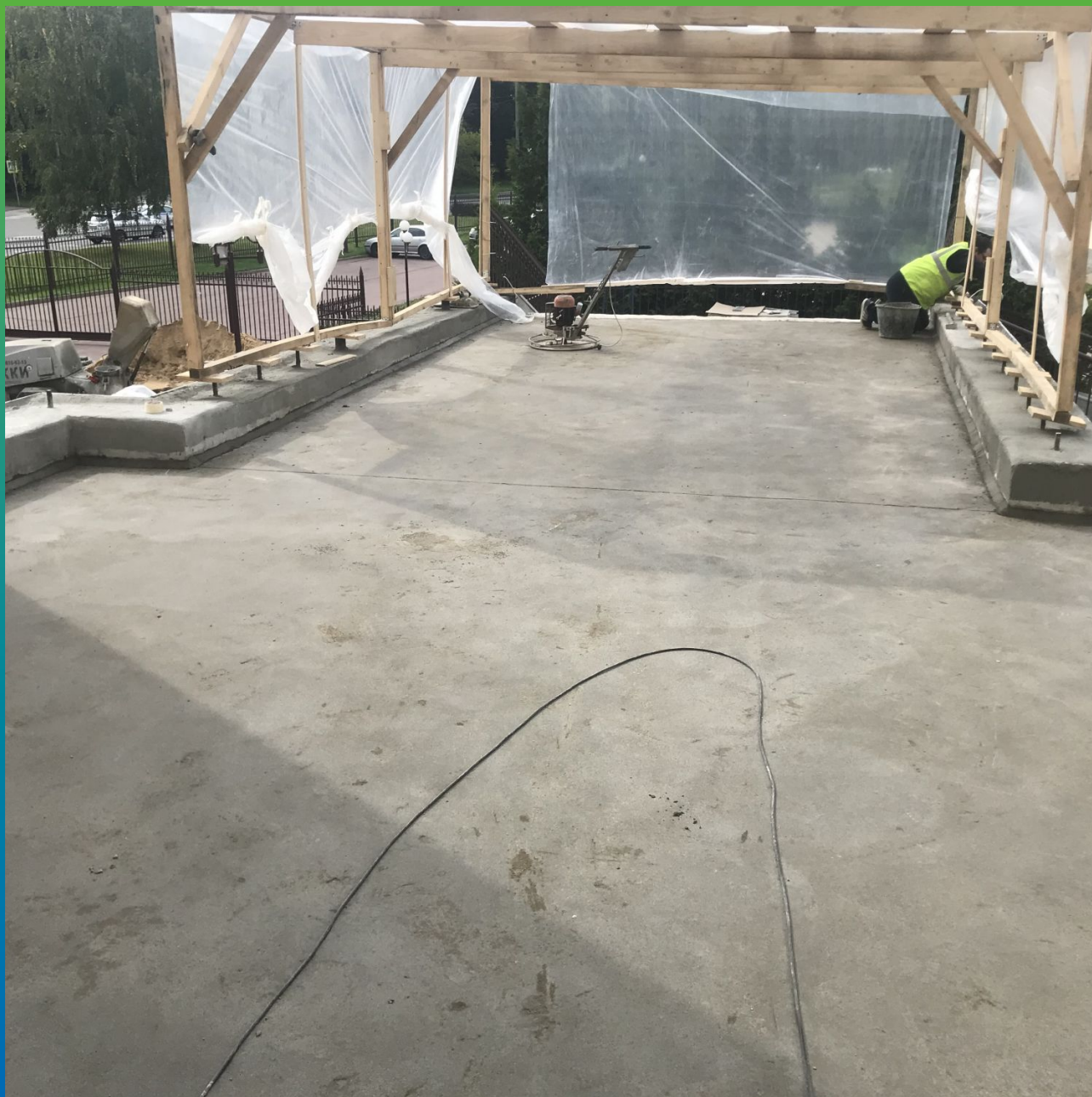
Готовое основание под укладку гидроизоляционного слоя из ЭПДМ Прелести 1.2