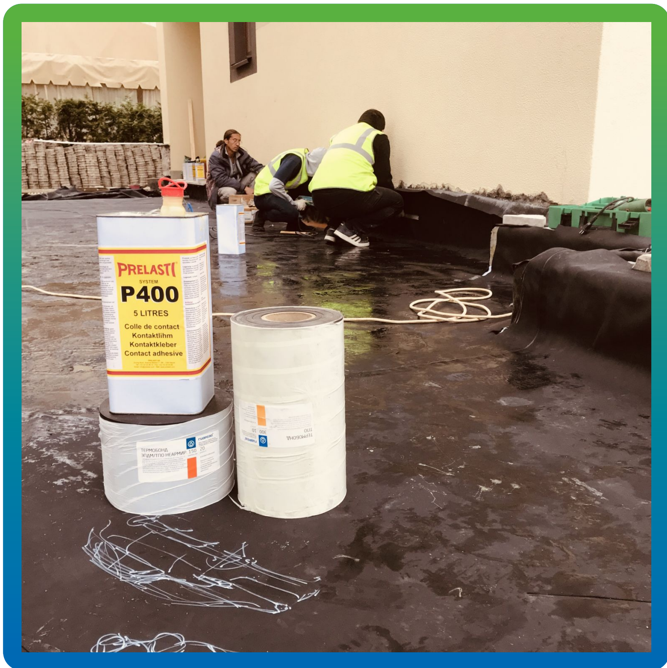
Мотажные работы на объекте