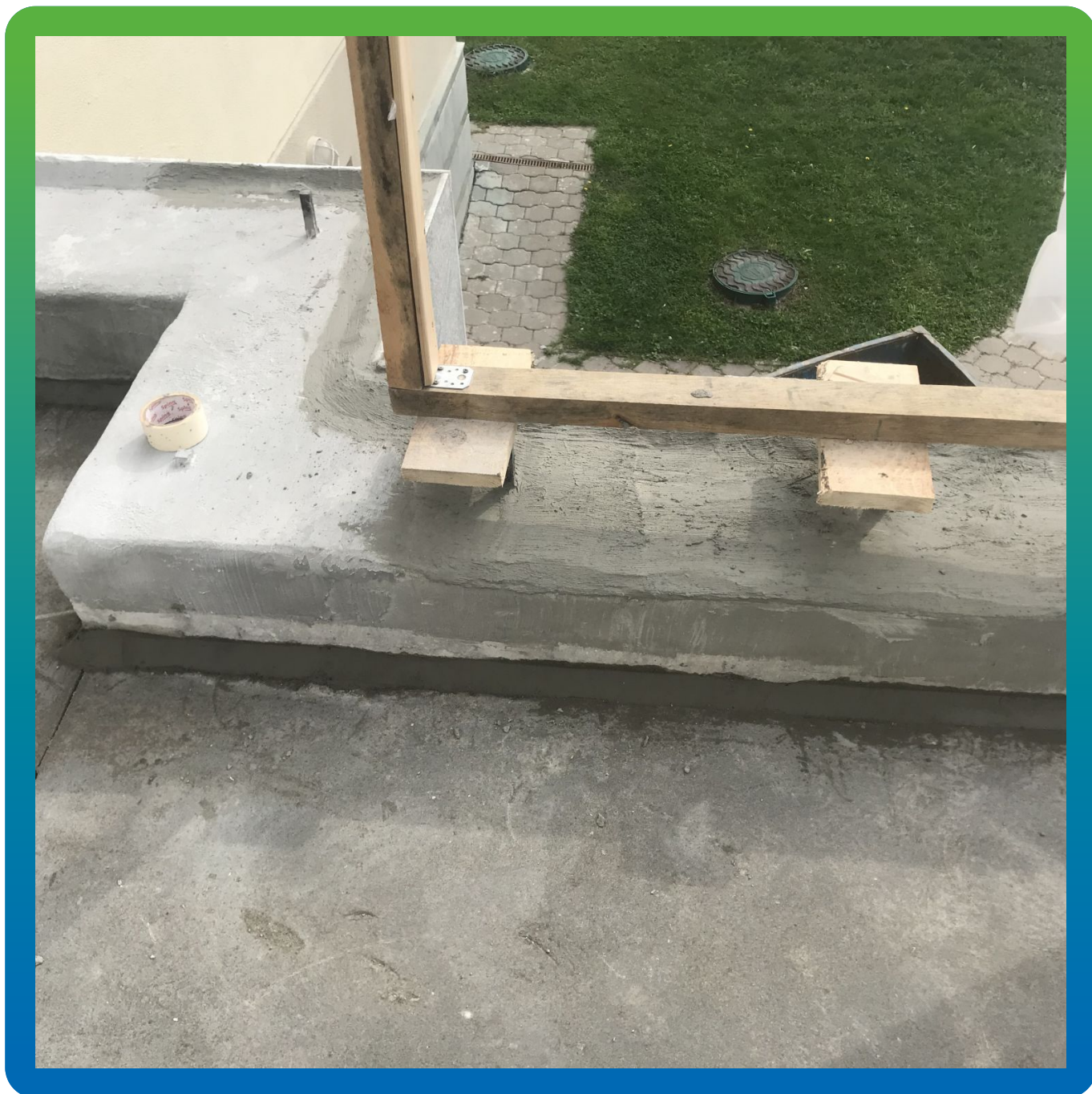
Зона парапетов заранее подготовлена и обмазана Стармекс Сил Флекс