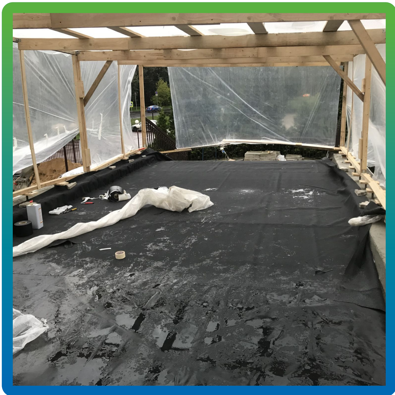
Заведение мембраны на парапеты и последующее крепление