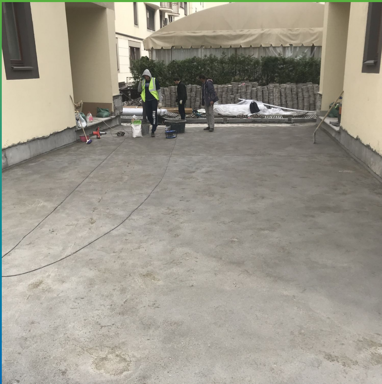
Готовое основание под укладку гидроизоляционного слоя из ЭПДМ мембраны Преласта 1.2