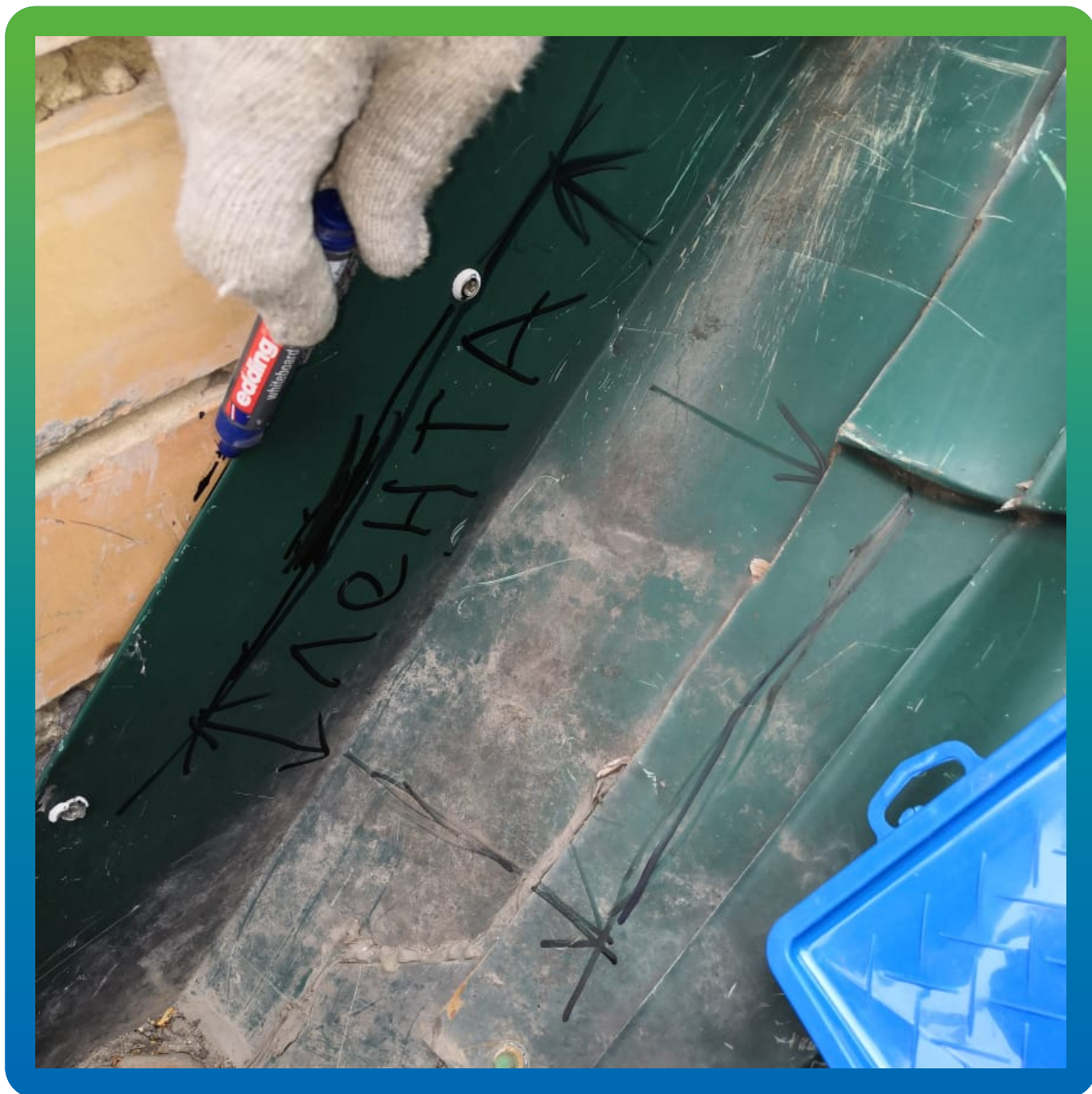
Участки, требующие герметизации