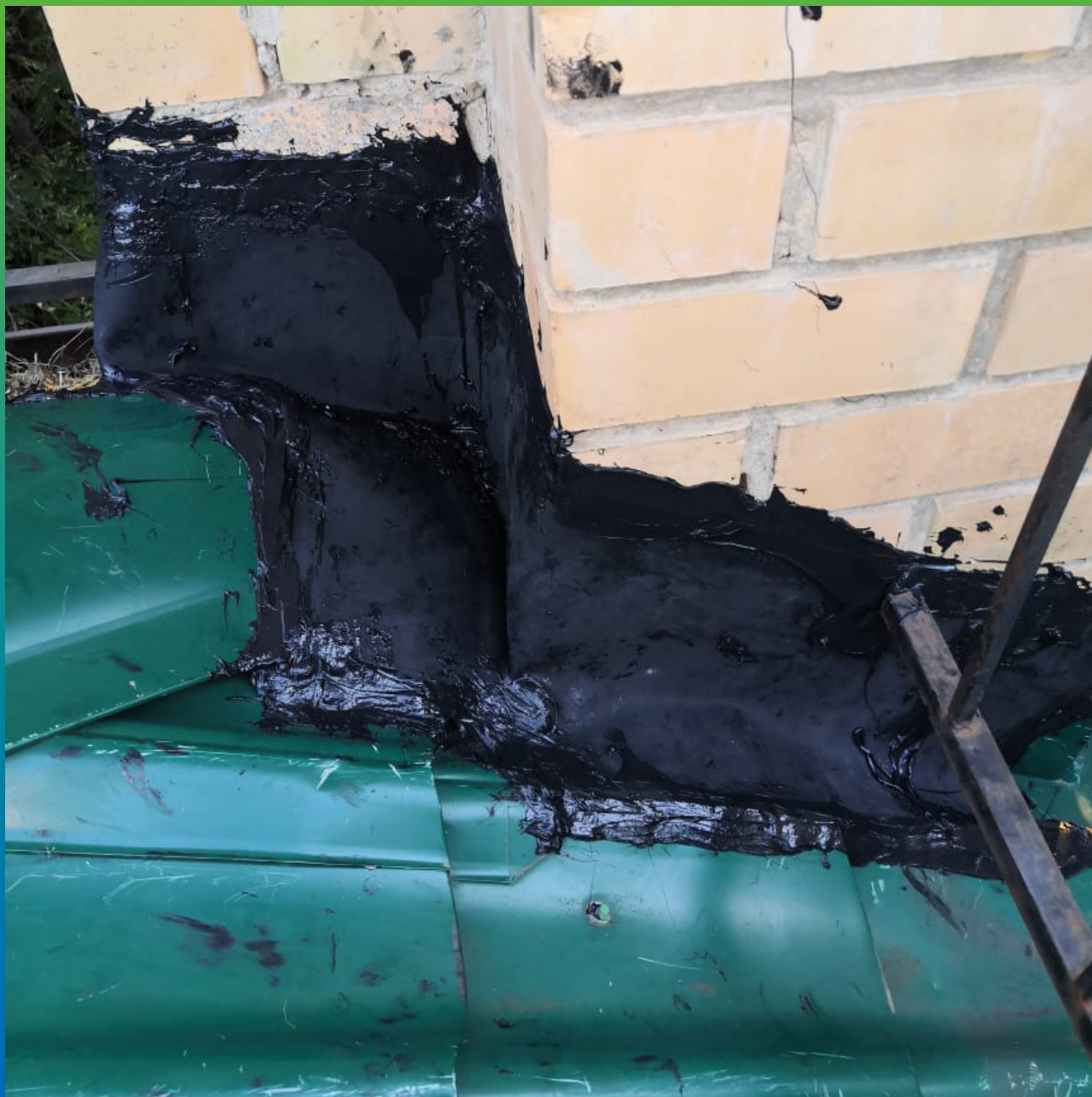
Герметизация стыков и зазоров при помощи мембраны и герметика