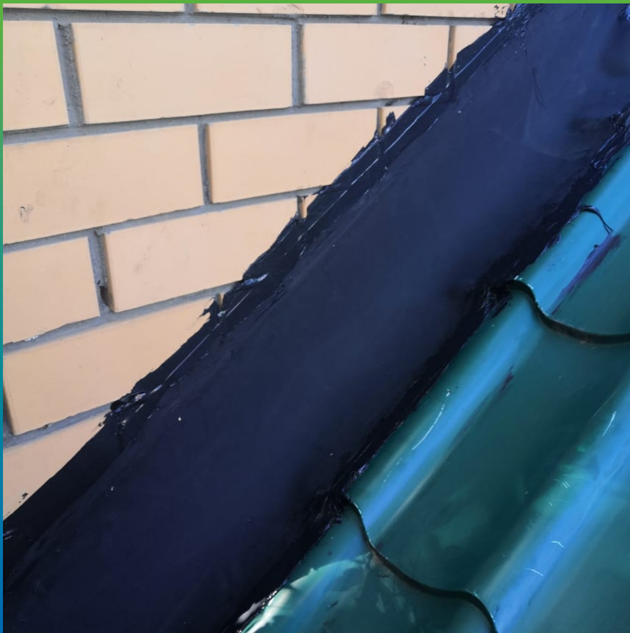
Герметизация стыков и зазоров на кровле с помощью мембраны