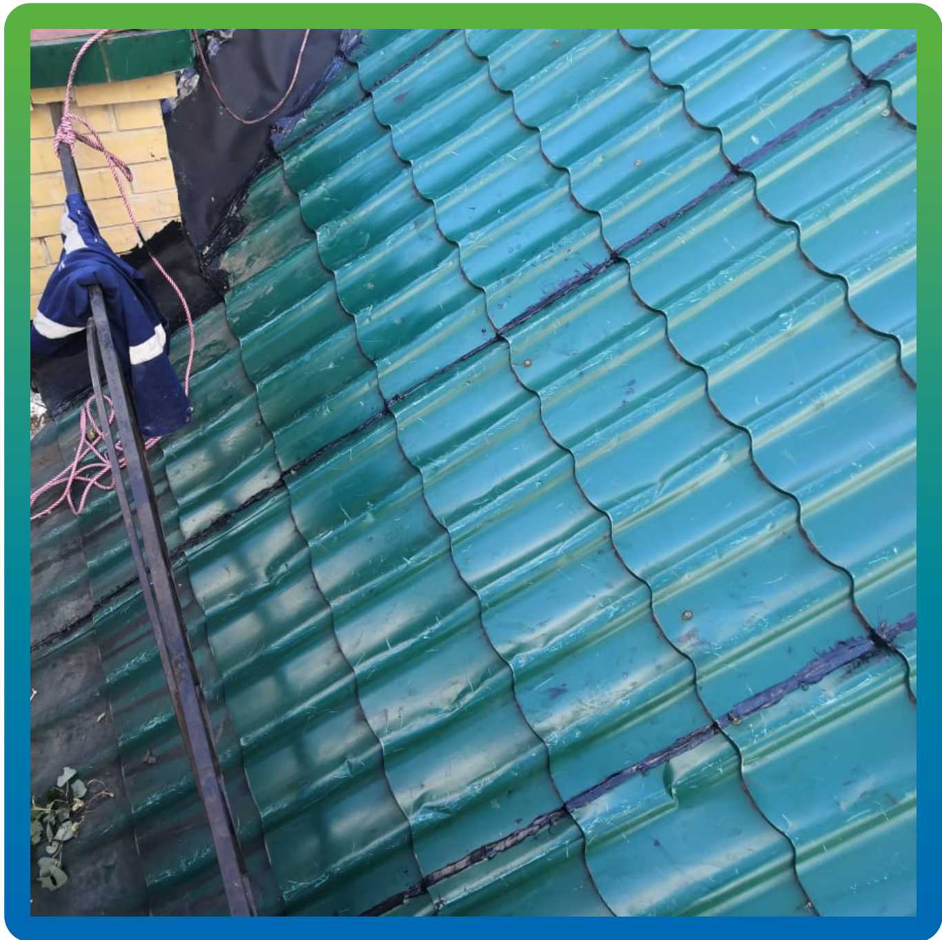
Герметизация стыков и зазоров на кровле