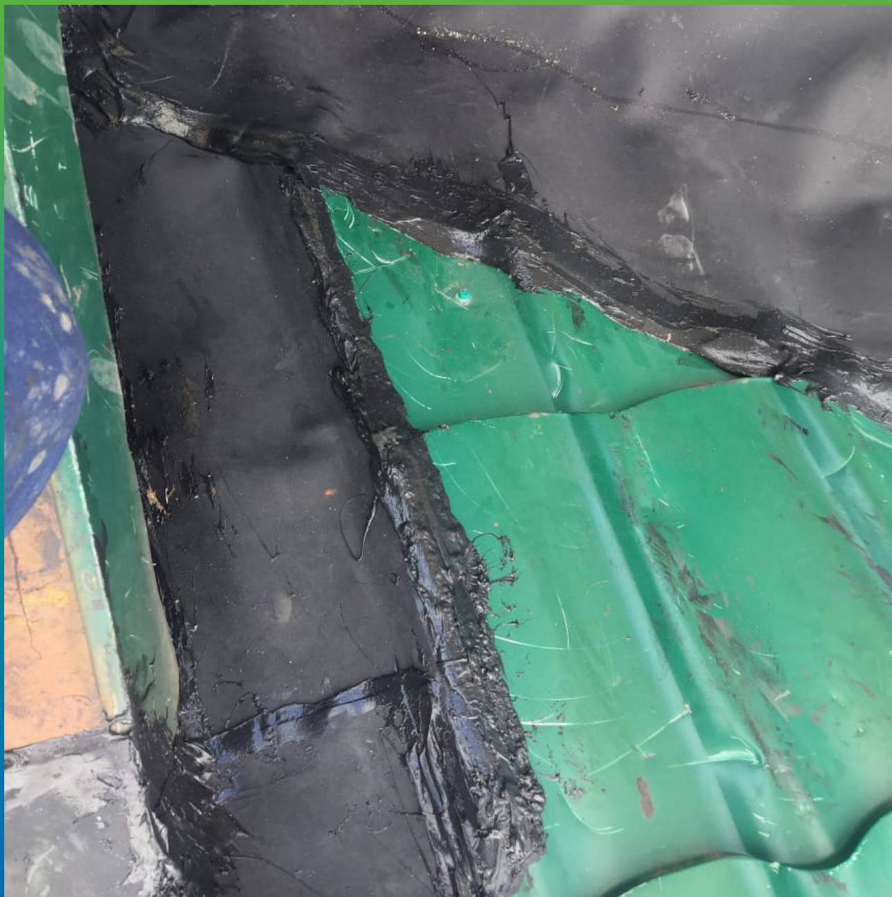
Герметизация стыков и зазоров при помощи мембраны и герметика