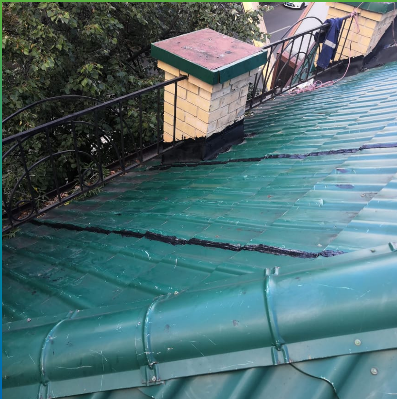
Герметизация стыков на кровле с помощью герметика