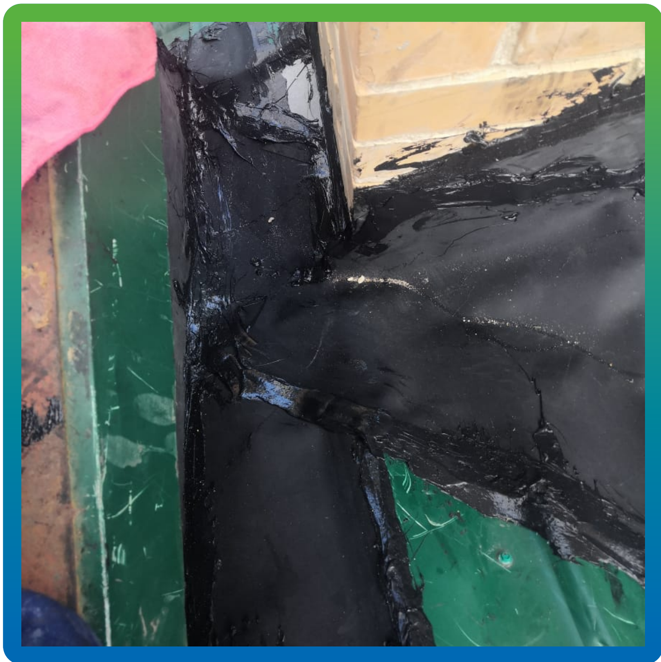
Герметизация стыков и зазоров при помощи мембраны и герметика