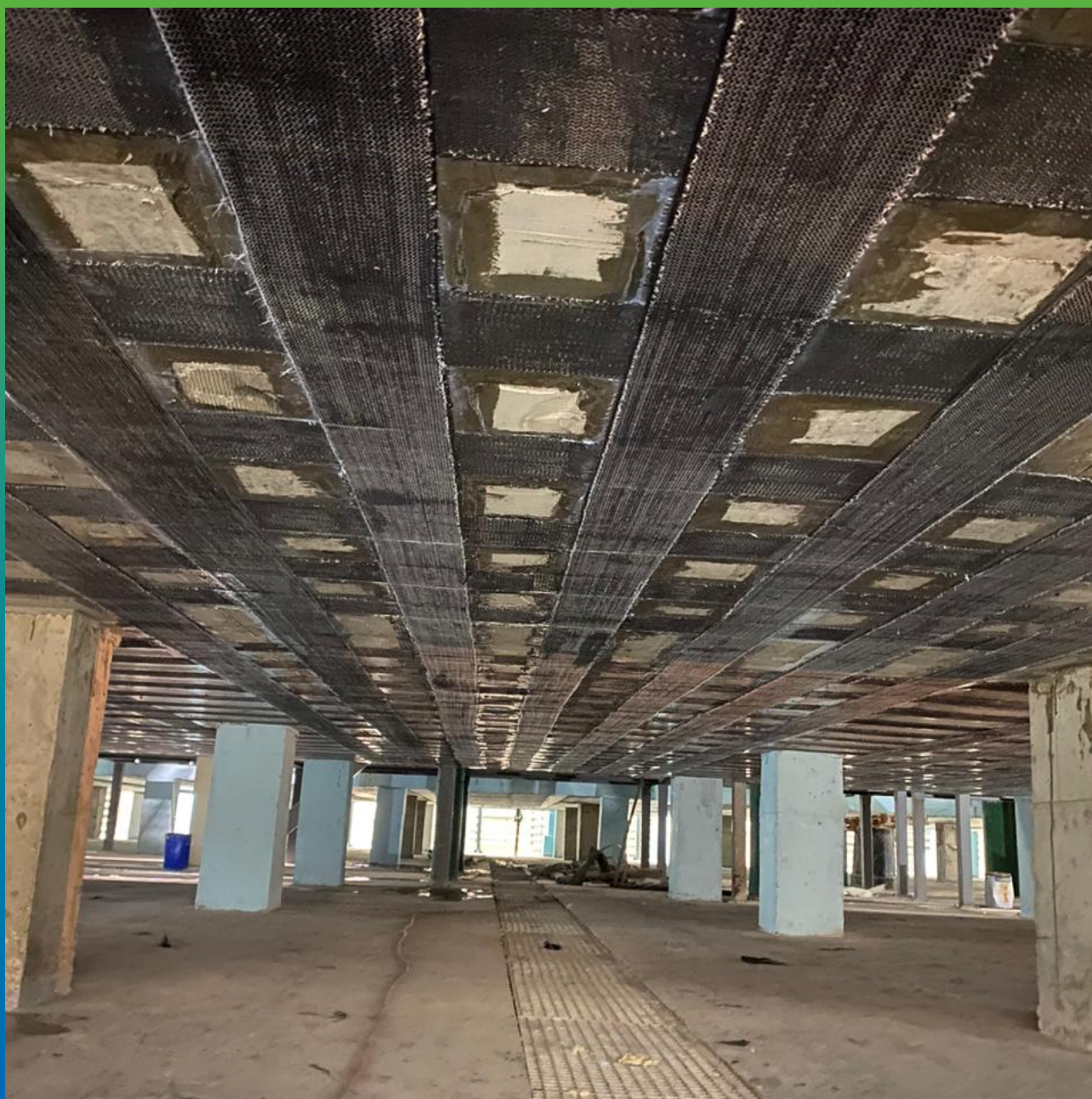
Монтаж КСУ в поперечном направлении, второй слой