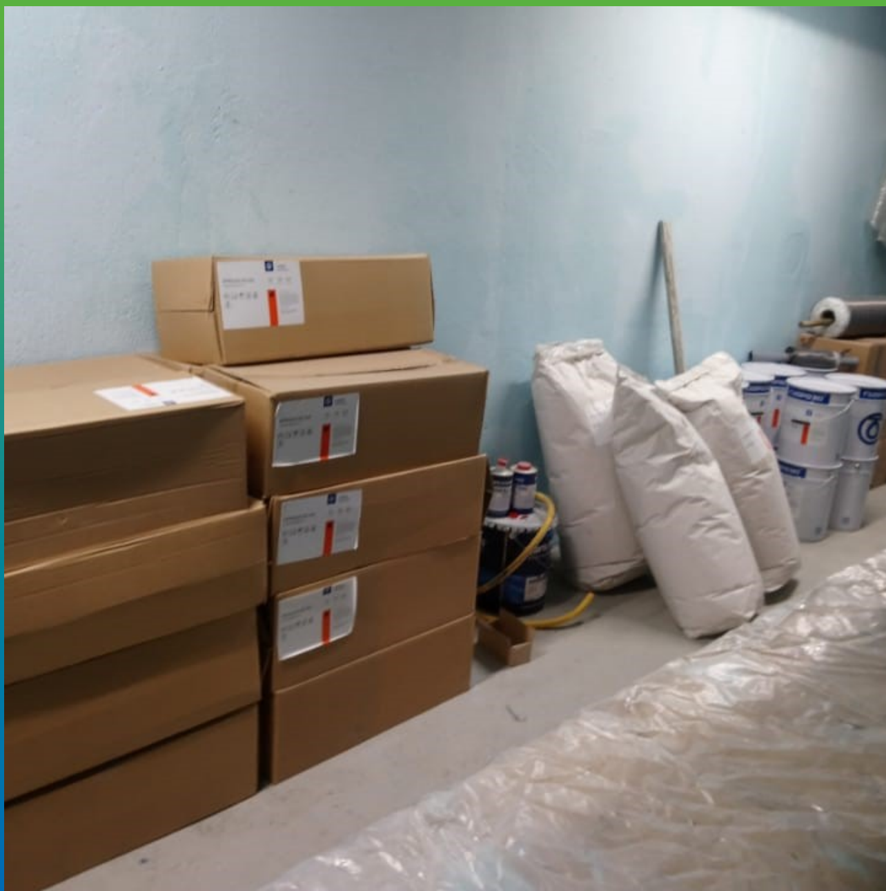
Материал на объекте, подготовленный к производству работ