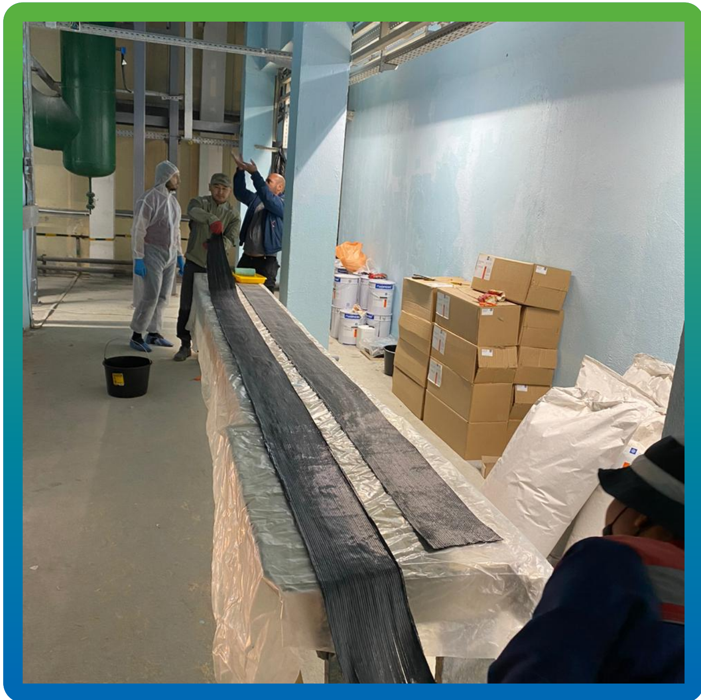
Нарезка холстов требуемого размера