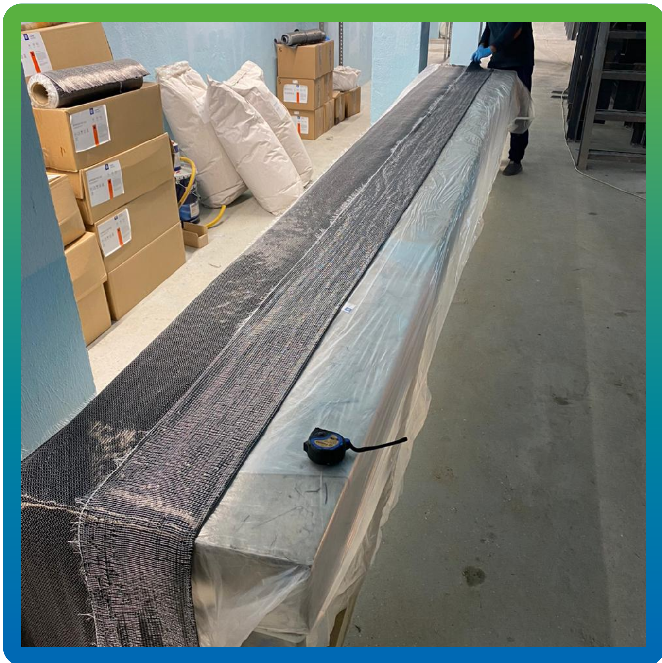
Нарезка холстов требуемого размера