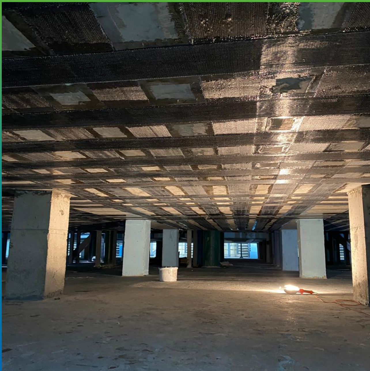
Внешний вид дна резервуара, усиленного композитом