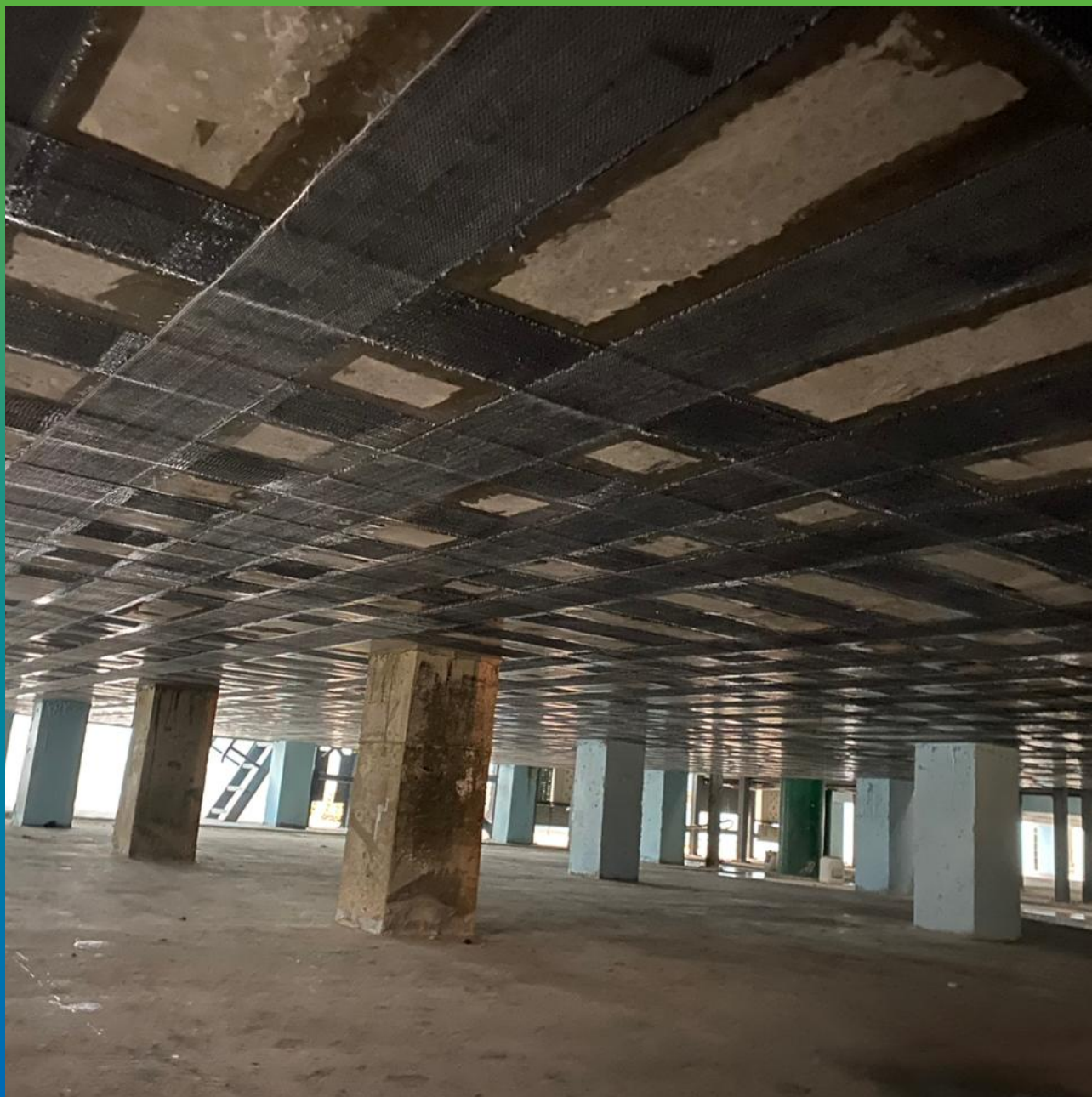
Монтаж КСУ в продольном направлении, второй слой