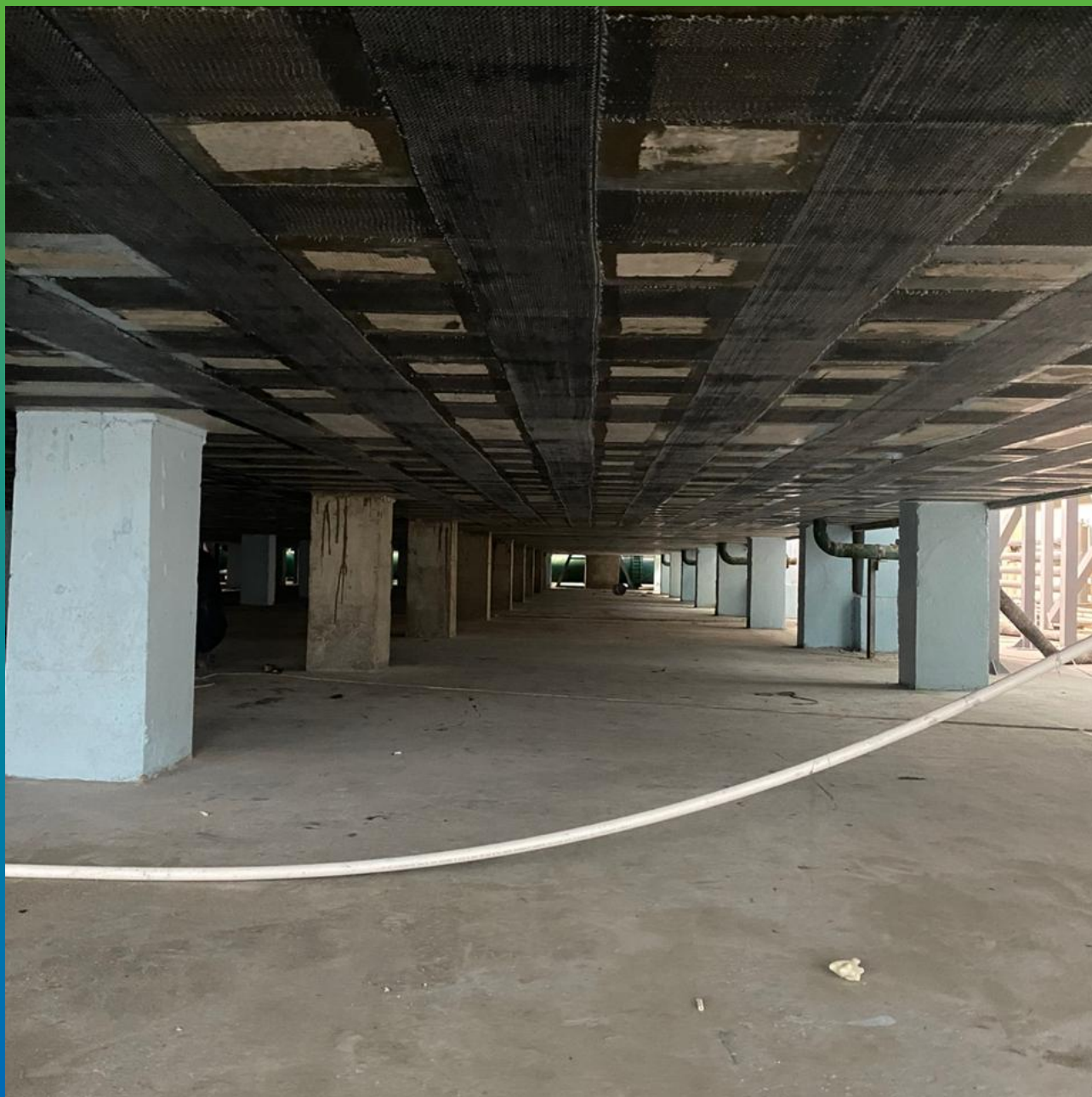
Монтаж КСУ в продольном направлении, второй слой