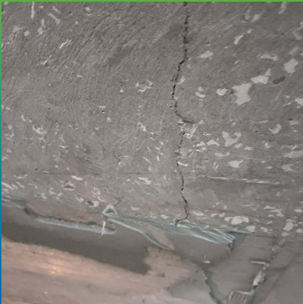
Дефекты бетонирования, открывшиеся в процессе подготовки основания