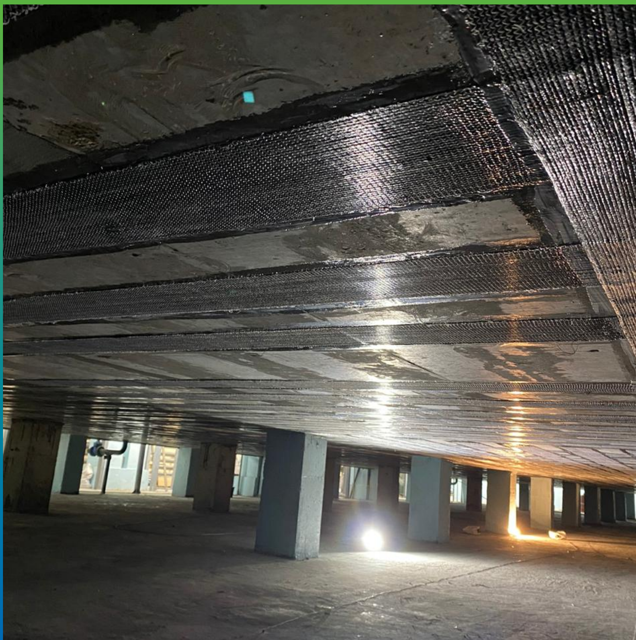
Монтаж КСУ в поперечном направлении, первый слой