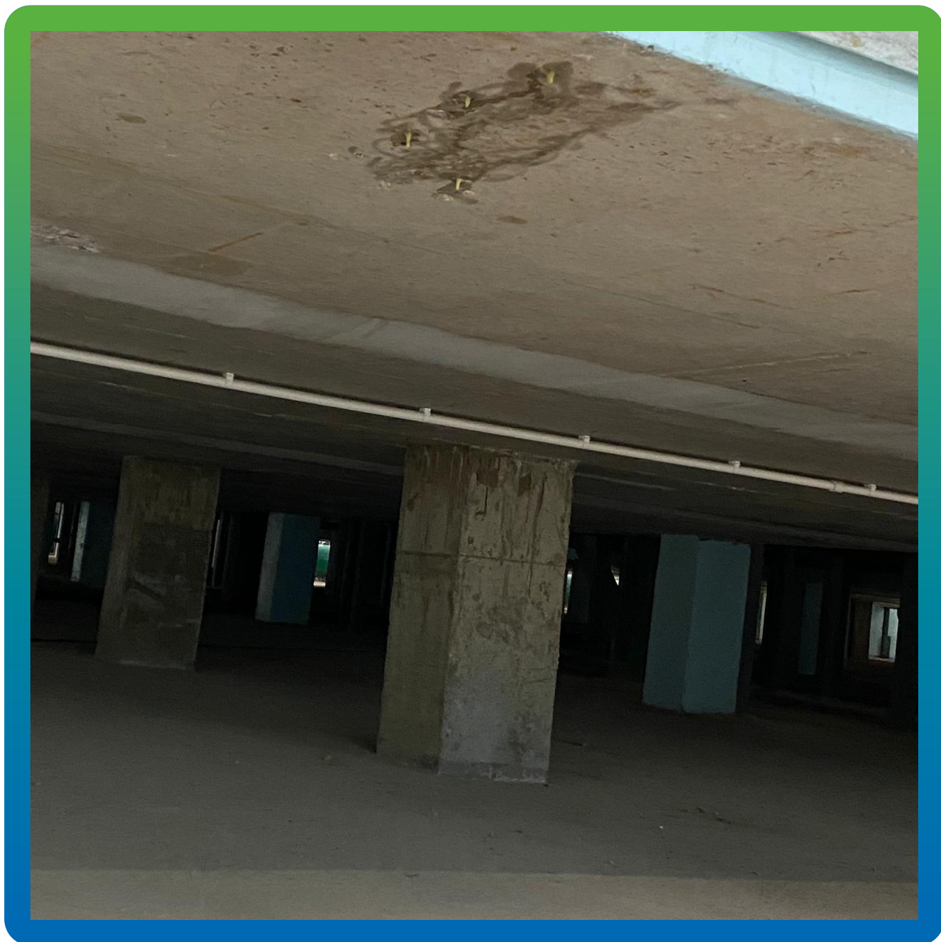
Устранение дефектов методом инъектирования