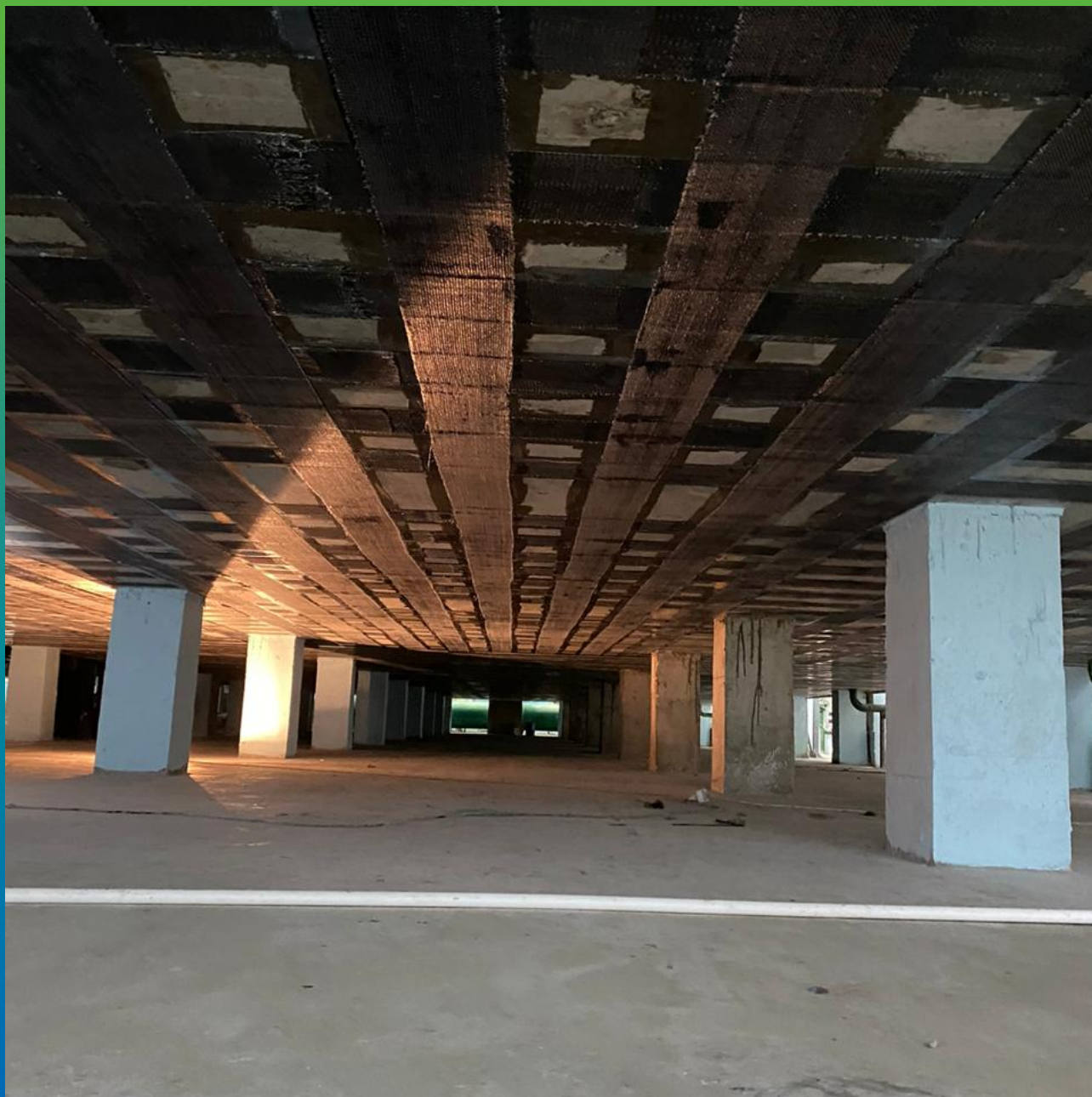
Монтаж КСУ в поперечном направлении, первый слой