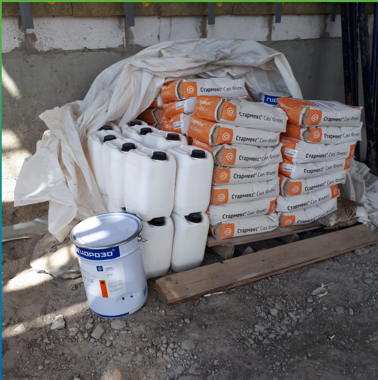
Материалы Гидрозо на объекте