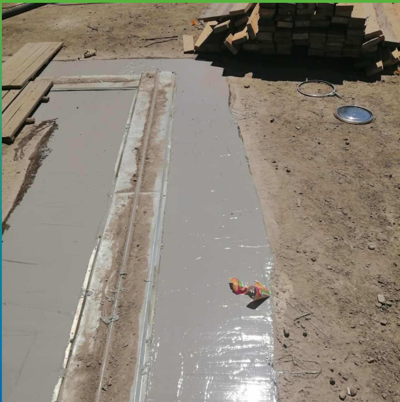
Защита от трещин по 0,5 м с каждой стороны от дш эластичным материалом ДенсТоп МС 351