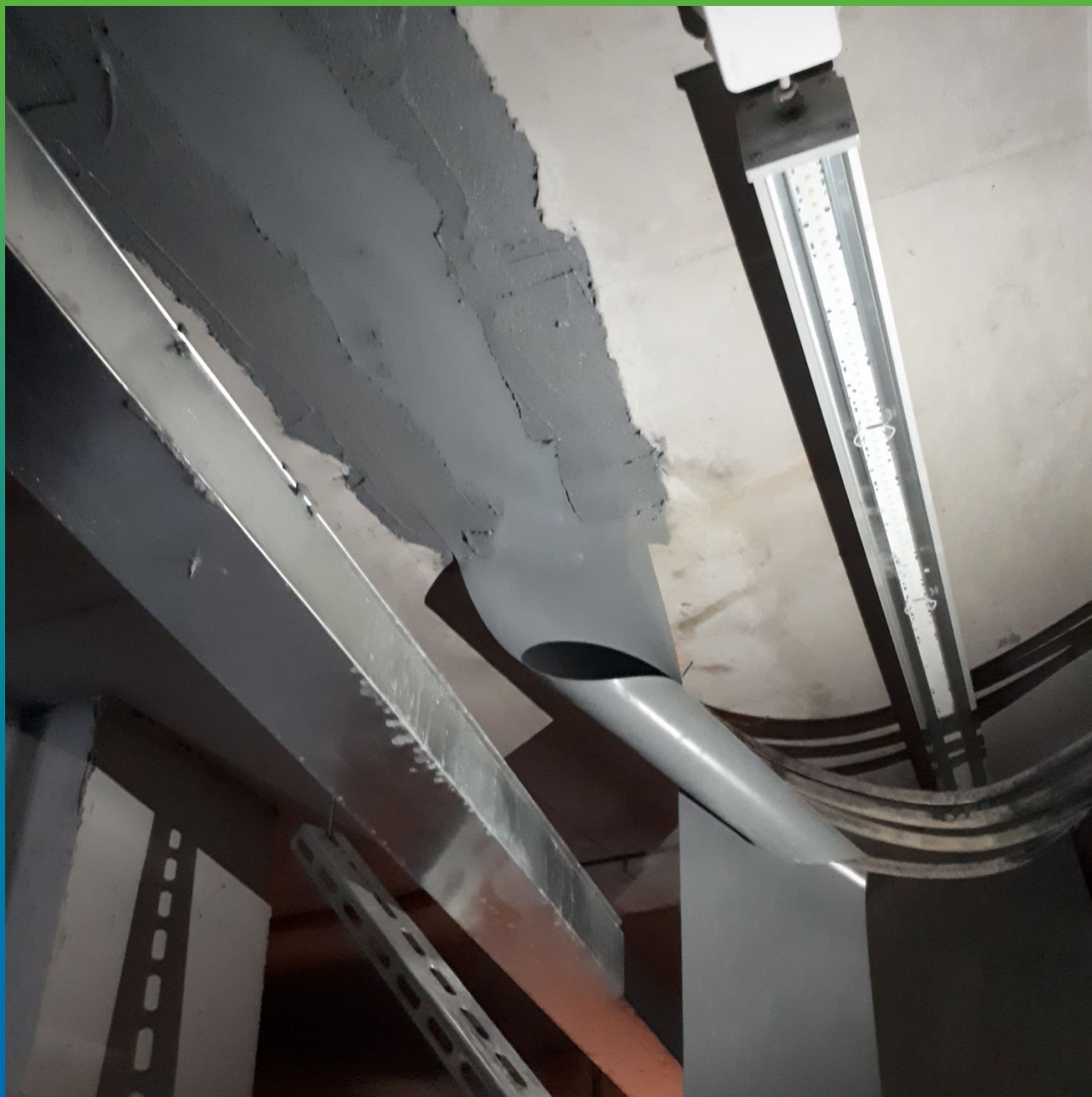
Гидроизоляция деф.шва изнутри при помощи ленты Мандил Про по клею Манопокс 331