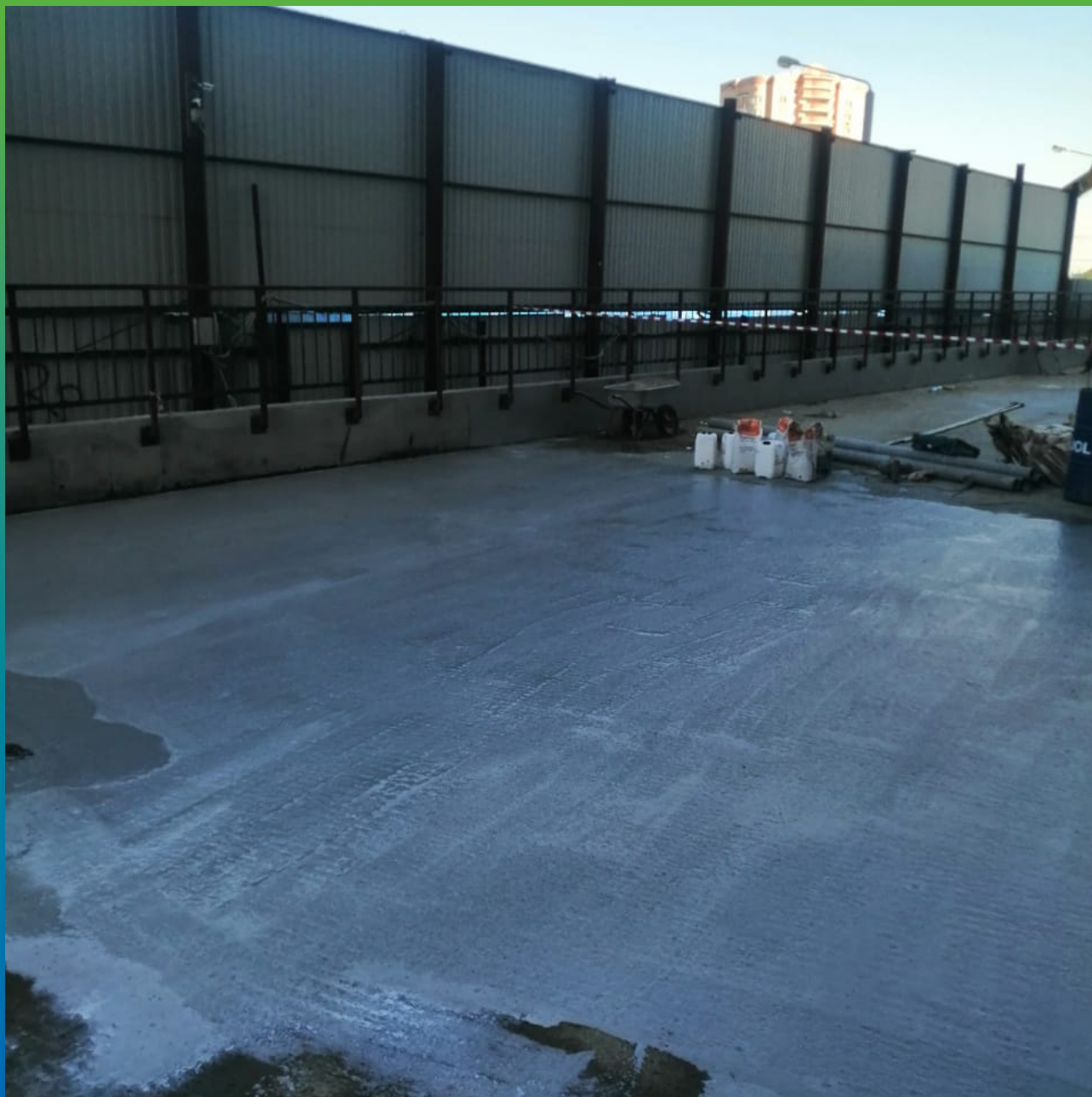
Нанесенный Стармекс Сил Флекс по плите