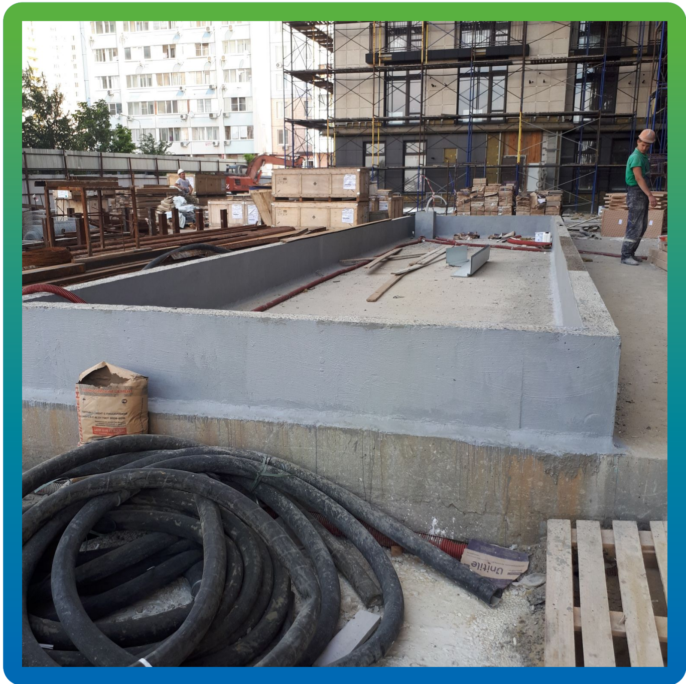
Гидроизолированные бортики клумбы материалов Стармекс Сил Флекс