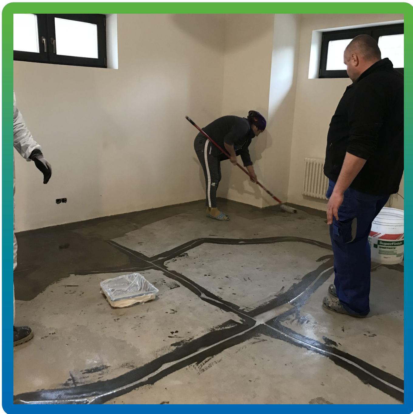
Нанесение грунта ДенсТоп ЭП 100