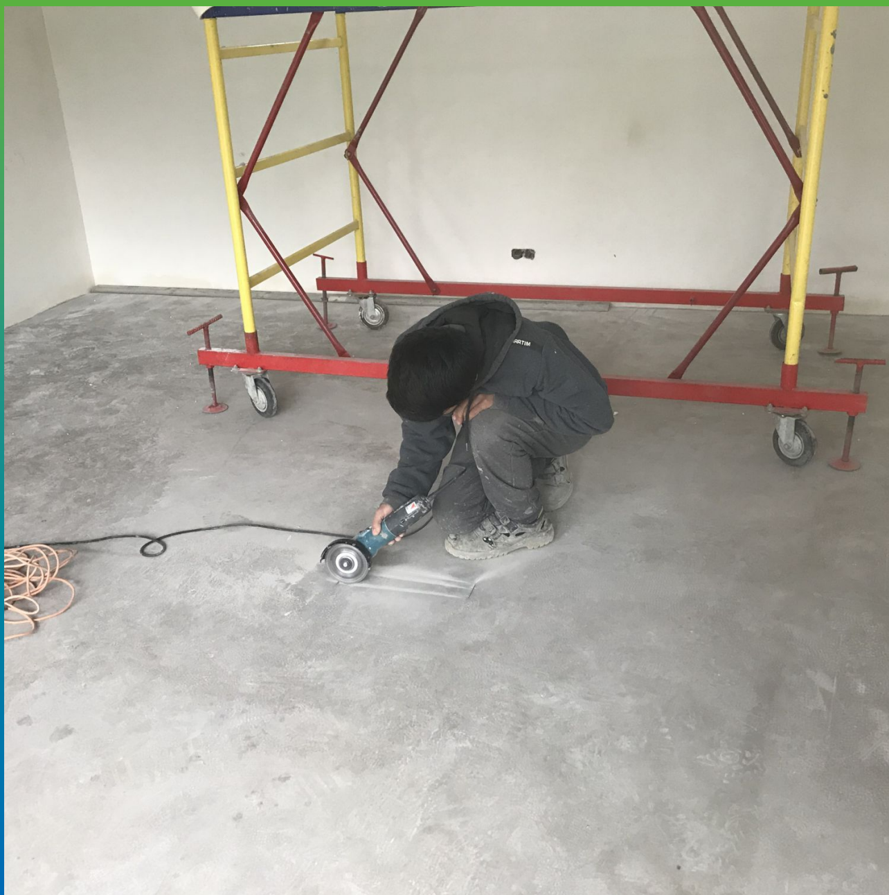
Расшивка трещин под ремонт перед нанесением грунтовочного состава ДенсТоп ЭП 100