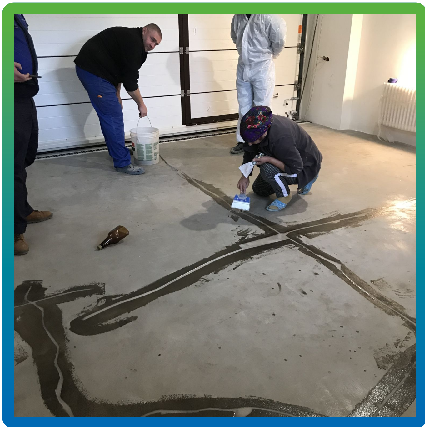
Ремонт трещин в полах грунтом ДенТоп ЭП 100 + ДенТоп Филлер 004