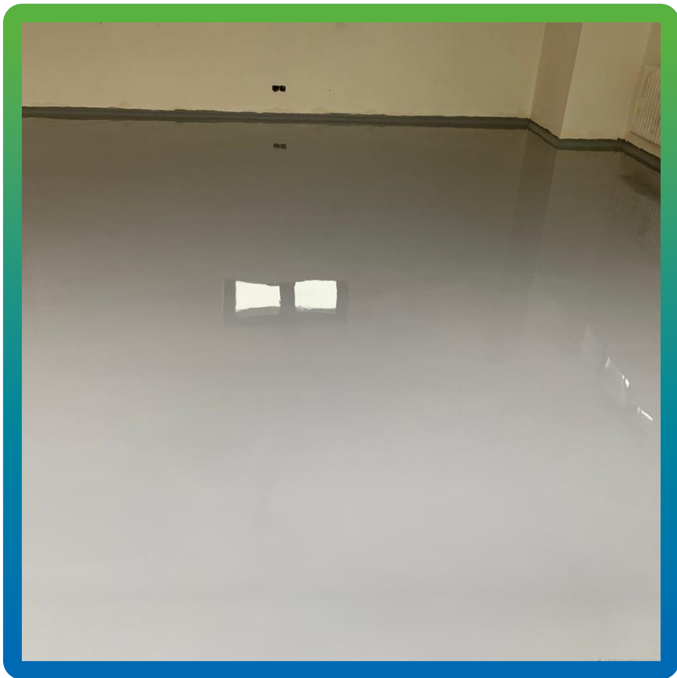
Финишный вид покрытия