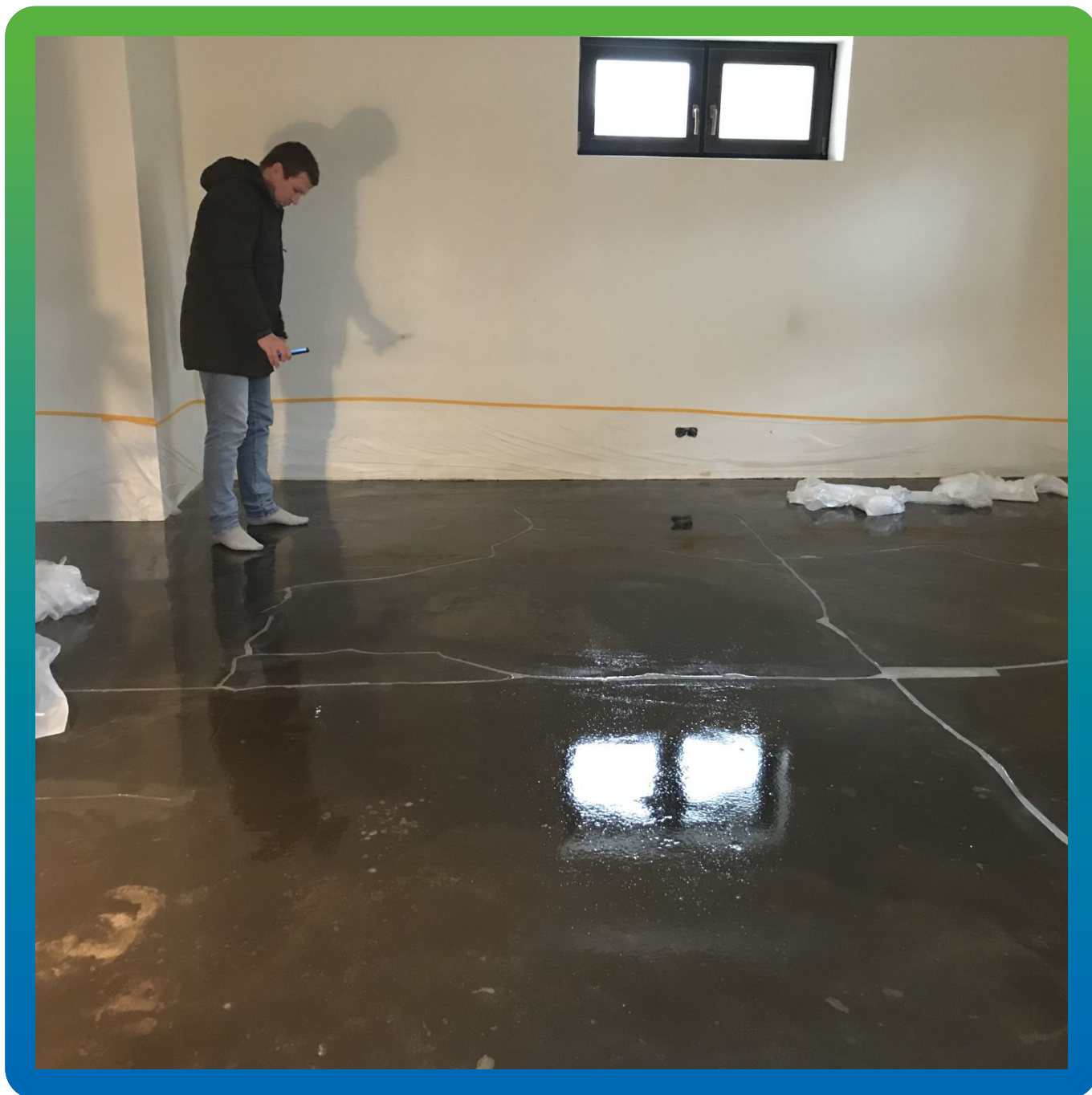
Общий вид загрунтованной поверхности