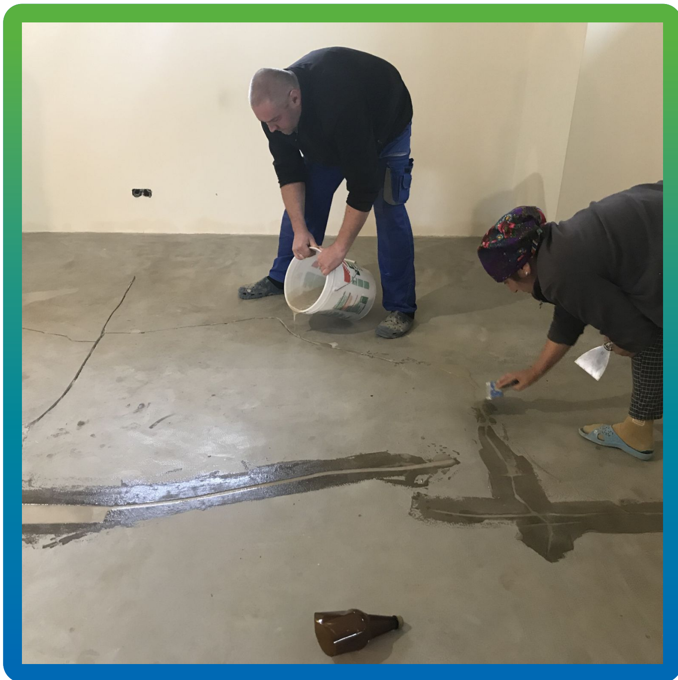
Заливка трещин подготовленным ремонтным составом