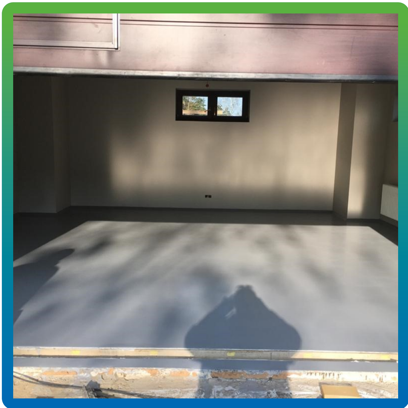
Финишный вид покрытия после нанесения матового лака ДенсТоп ПУ 310