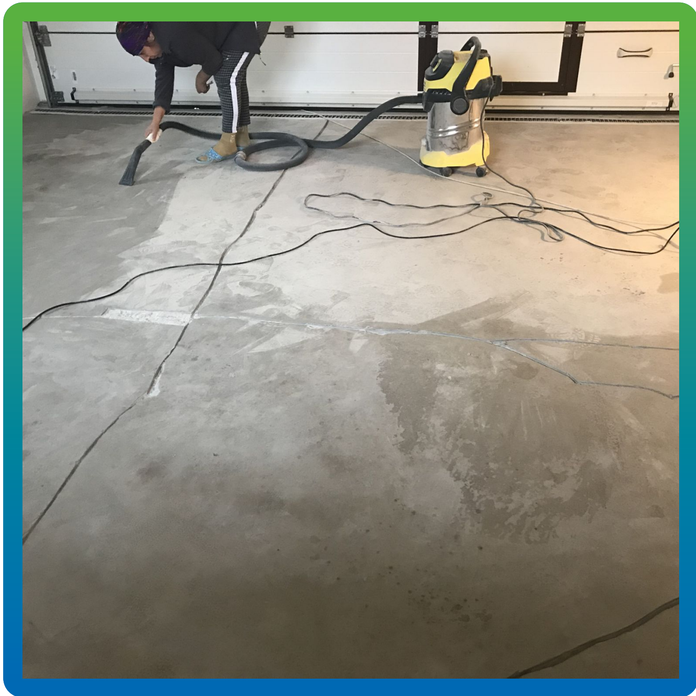
Обеспыливание подготовленных к ремонту трещин