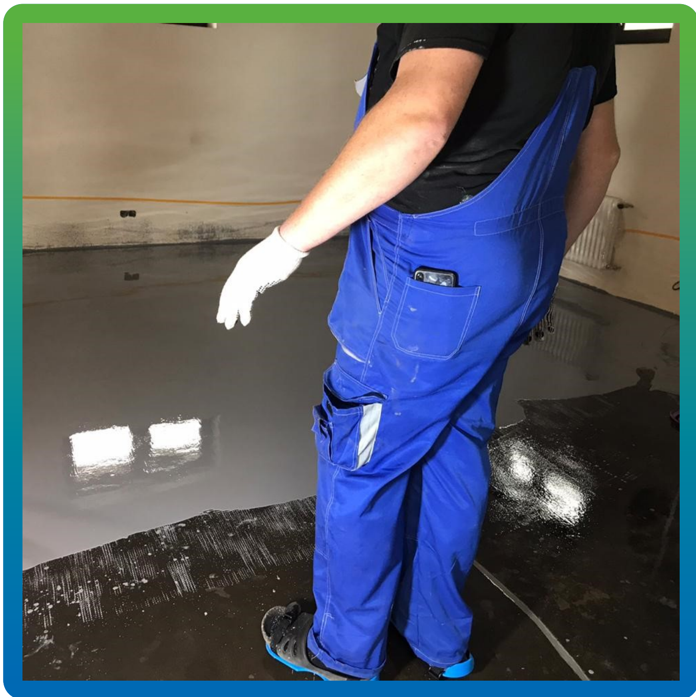
Нанесение ДенсТоп ЭП 501