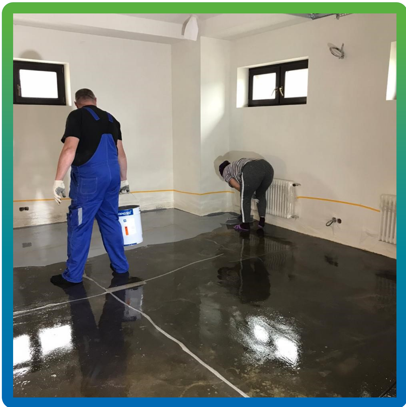
Нанесение эпоксидного цветного покрытия ДенТоп ЭП 501