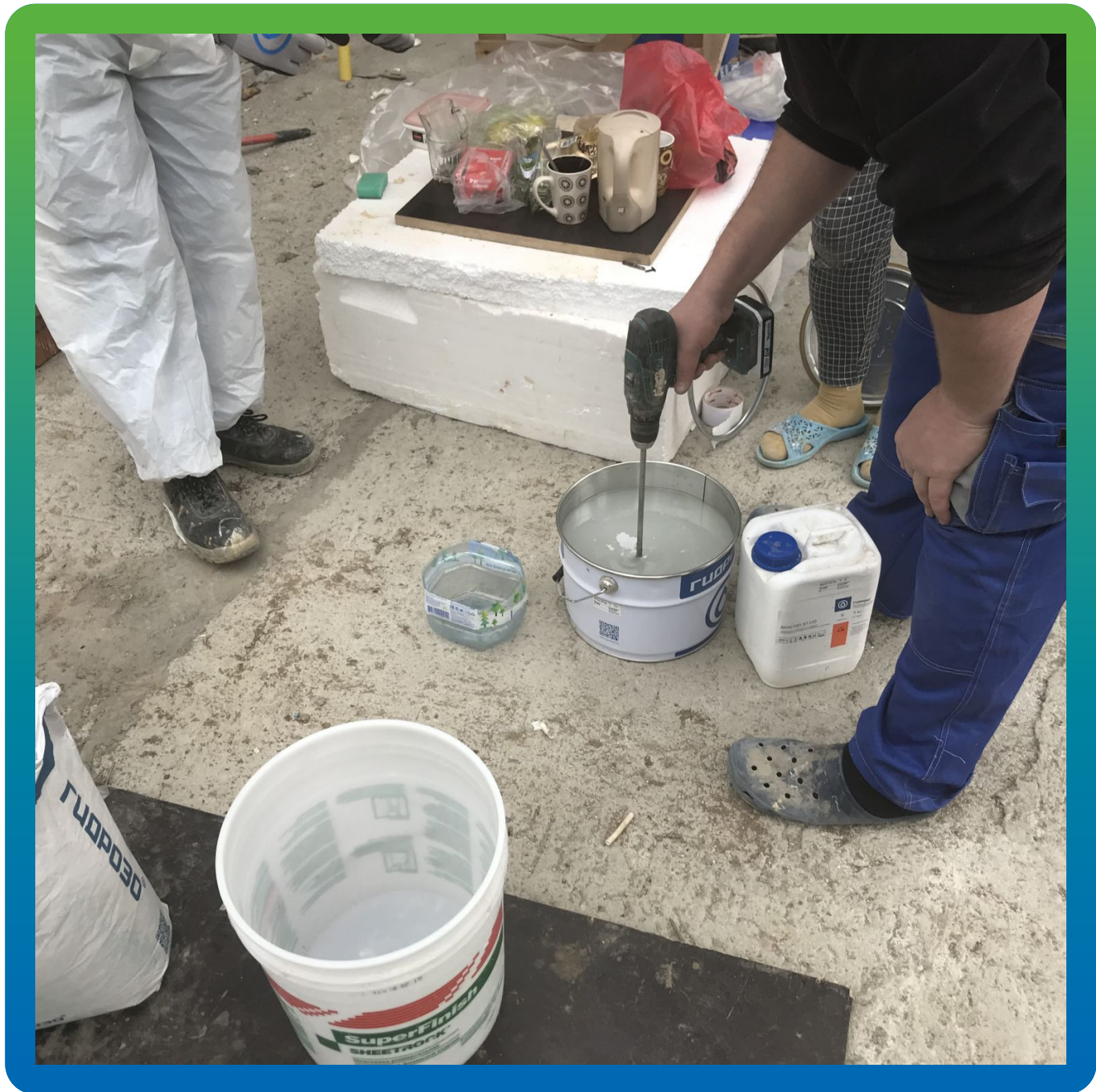
Подготовка ремонтного состава для трещин грунтовка ДенТоп ЭП 100 + ДенТоп Филлер 004