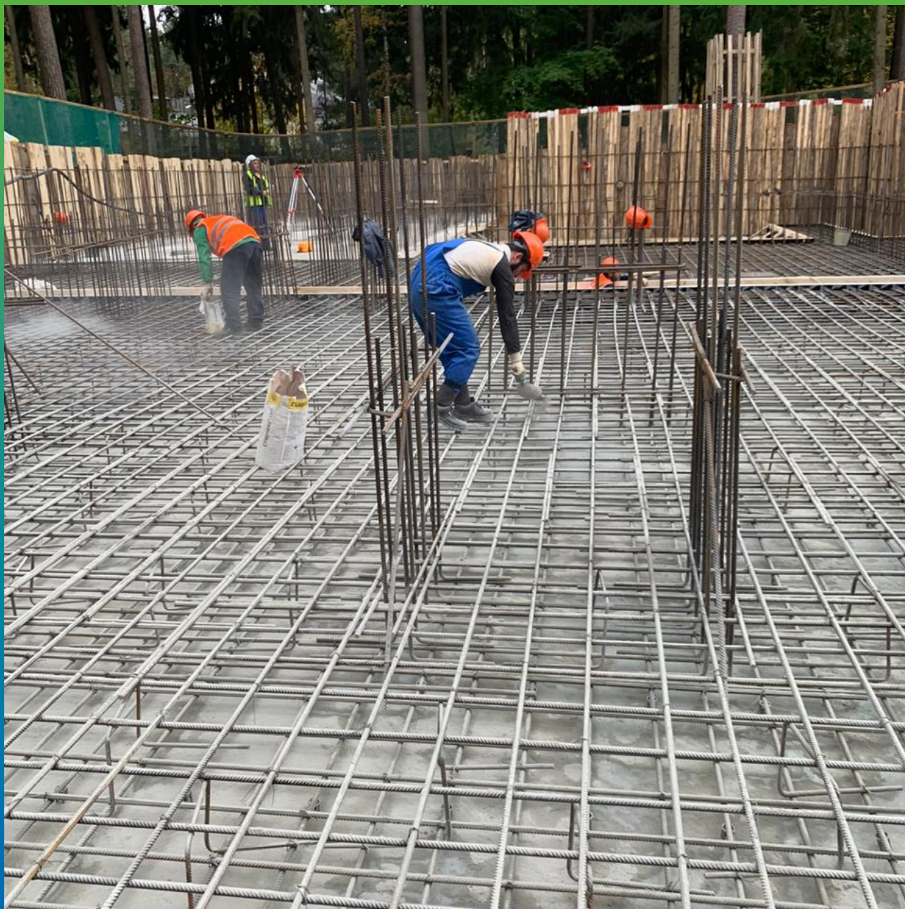
Процесс просыпки гидроизоляционного материала Стармекс Сил