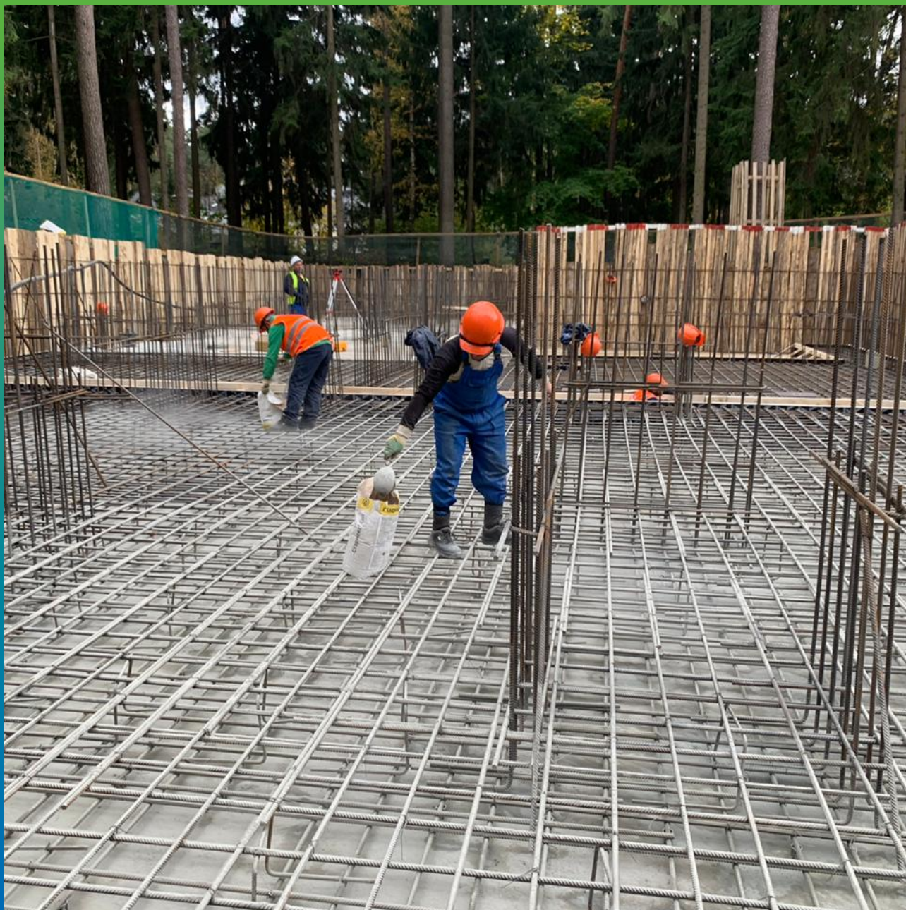
Процесс просыпки гидроизоляционного материала Стармекс Сил