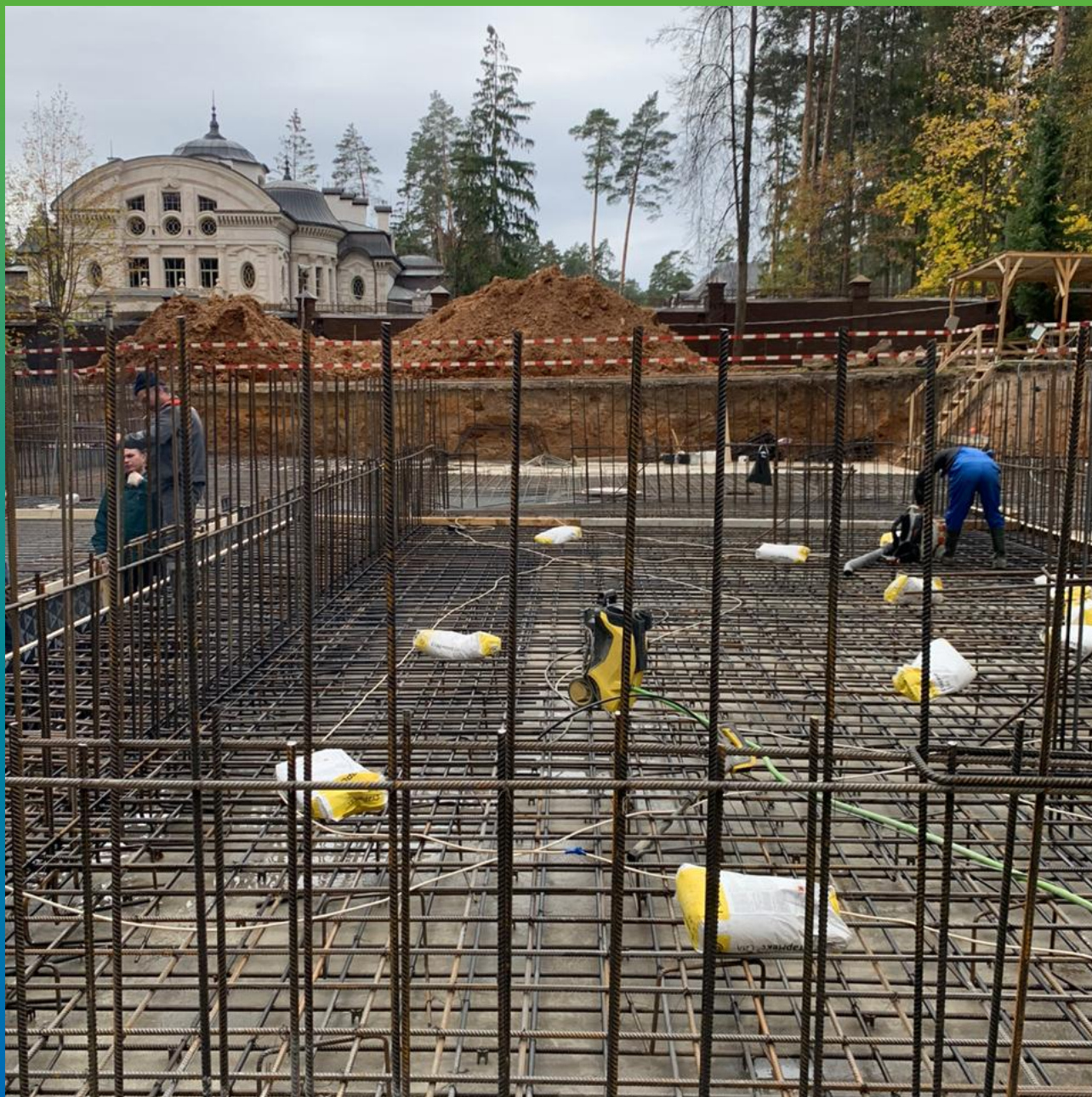
Подготовка перед гидроизоляцией методом просыпки