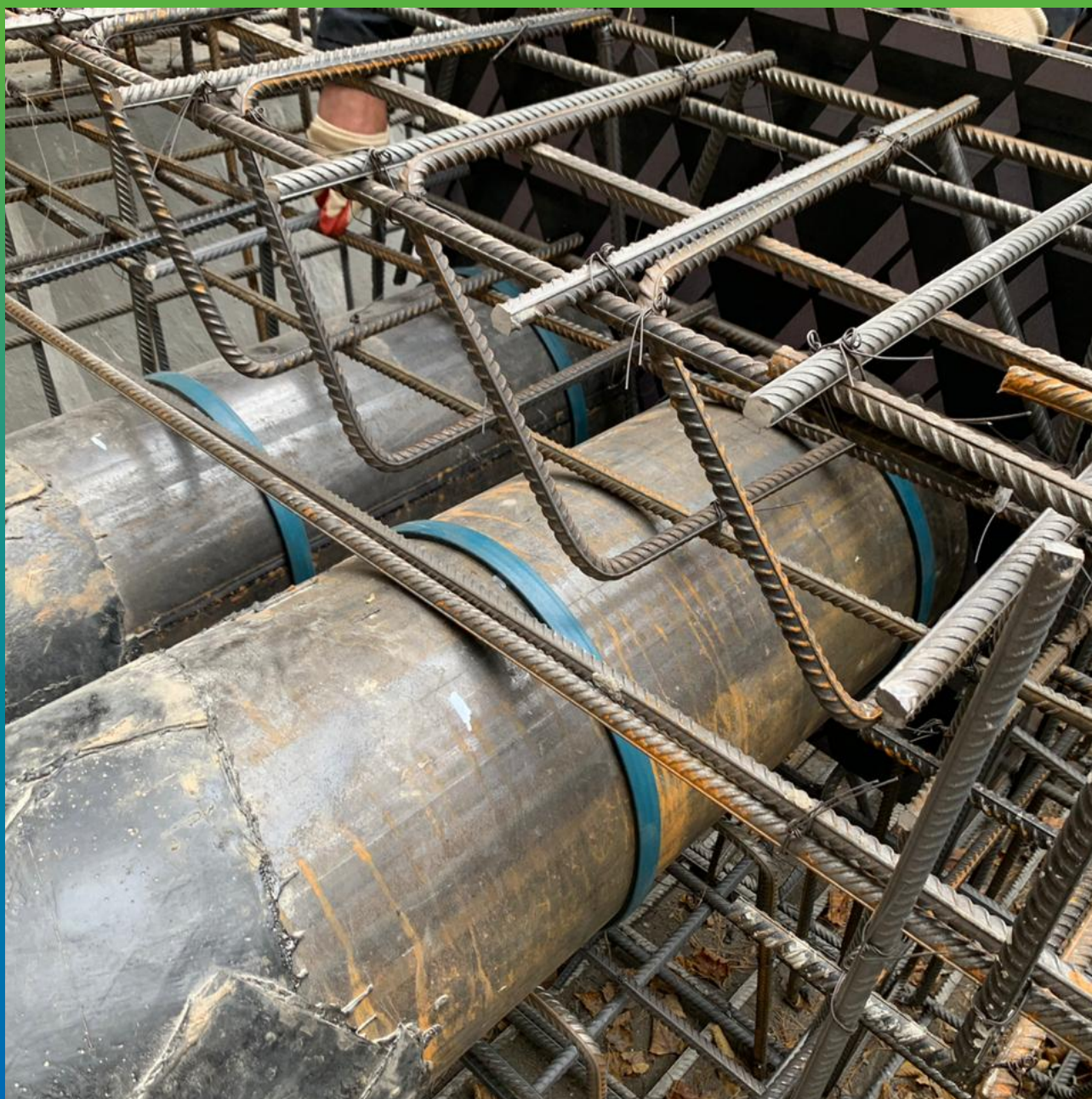
Гидроизоляция ввода коммуникаций при новом строительстве с помощью Манодил Свелл