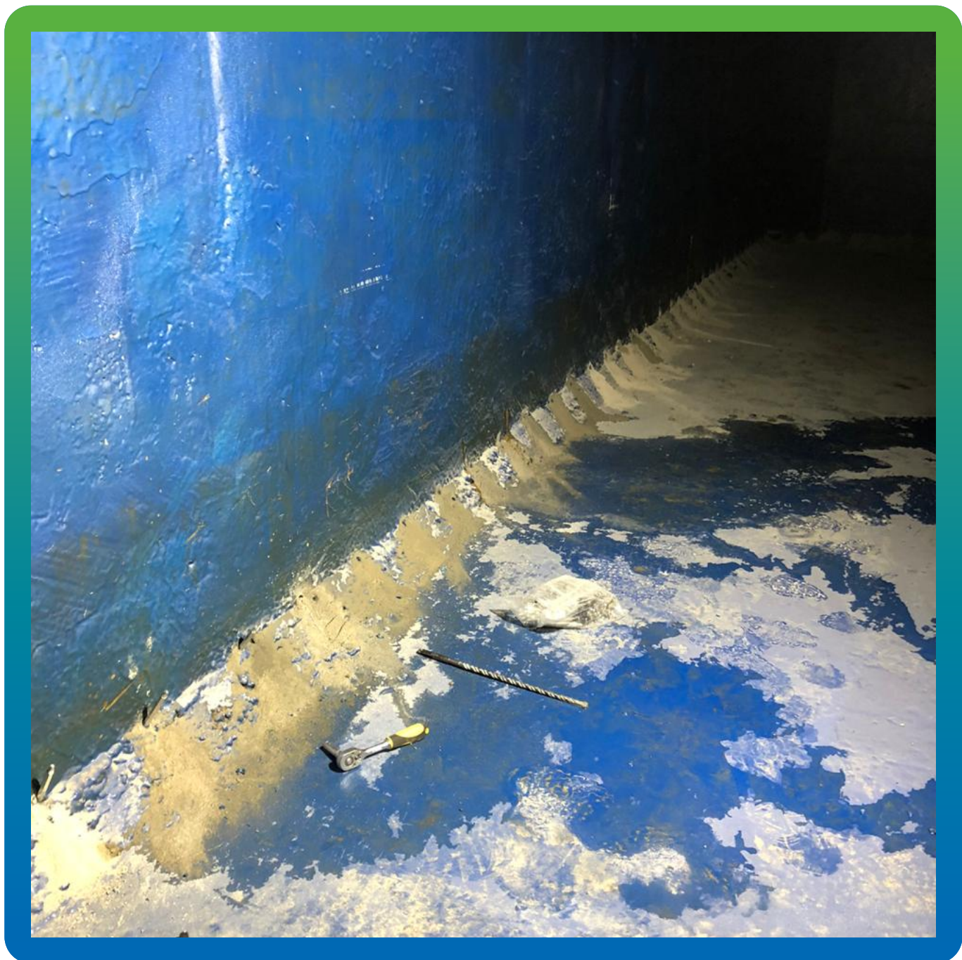
Бурение инъекционных каналов