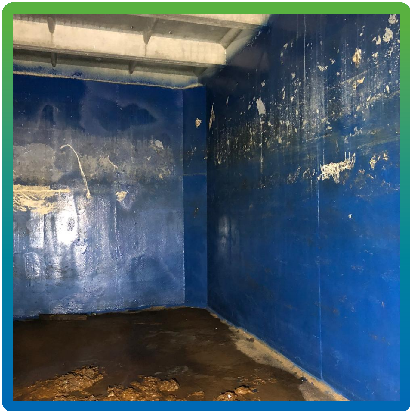
Резервуар до проведения работ