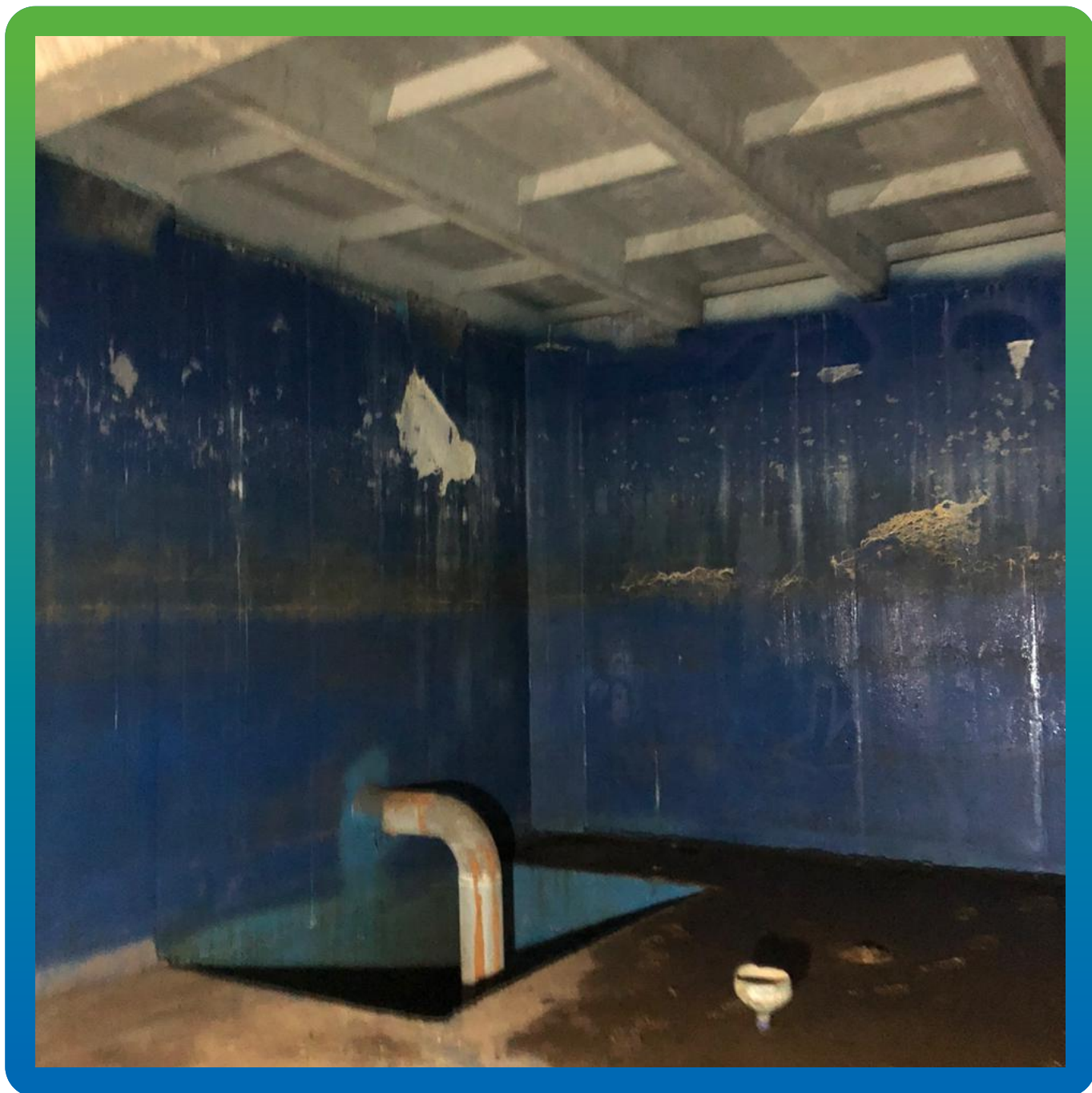
Резервуар до проведения работ