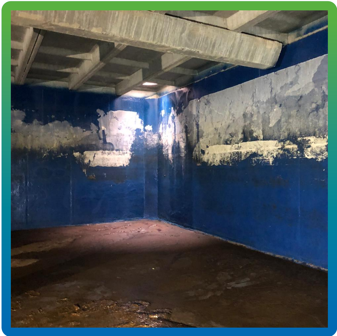
Резервуар до проведения работ