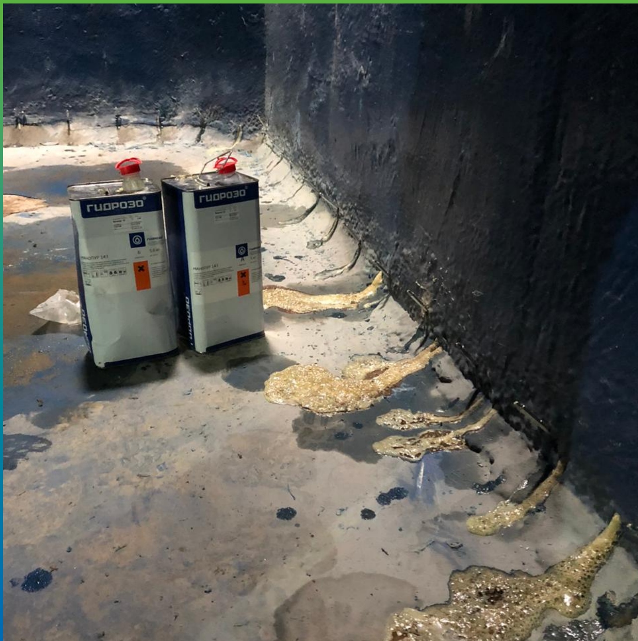
Шов, инъецированный составом Манопур 143