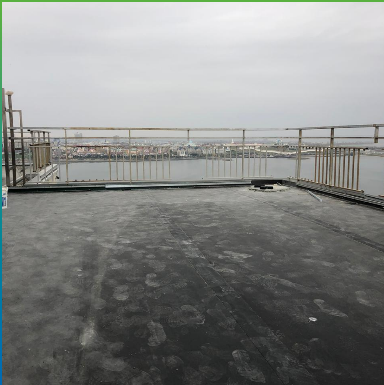
Гидроизоляция открытой террасы ЭПДМ мембраной Преласта СТ и герметиком Манодил Бонд Ф