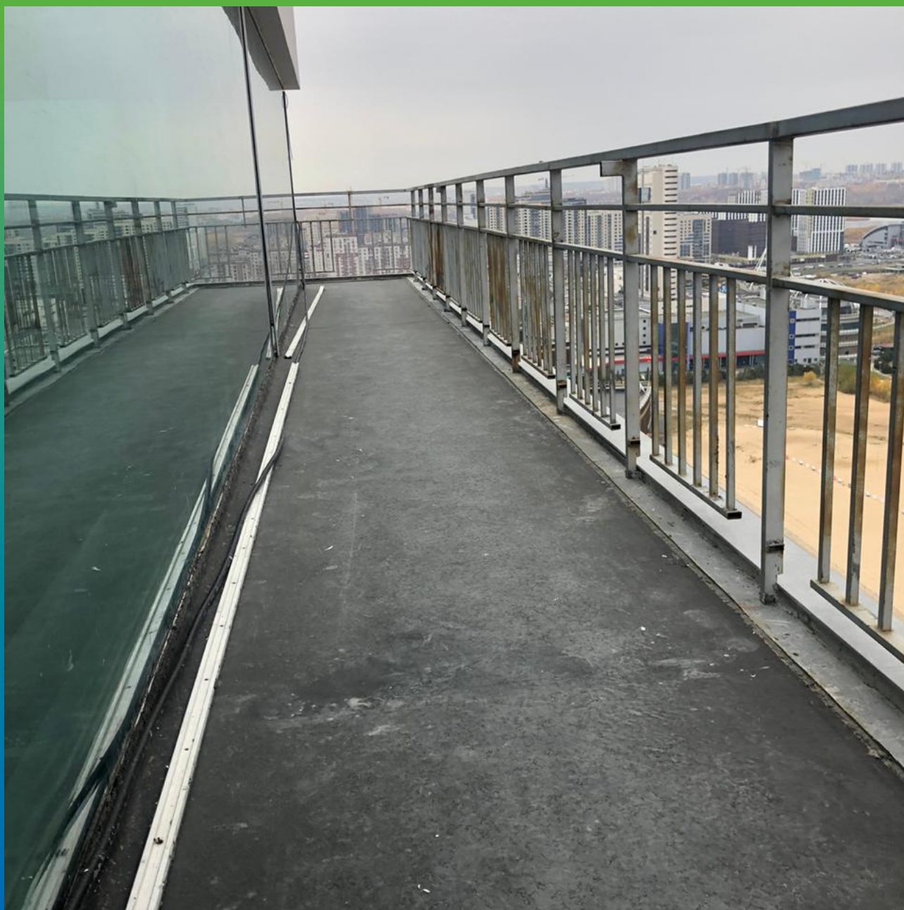
Внешний вид готового объекта