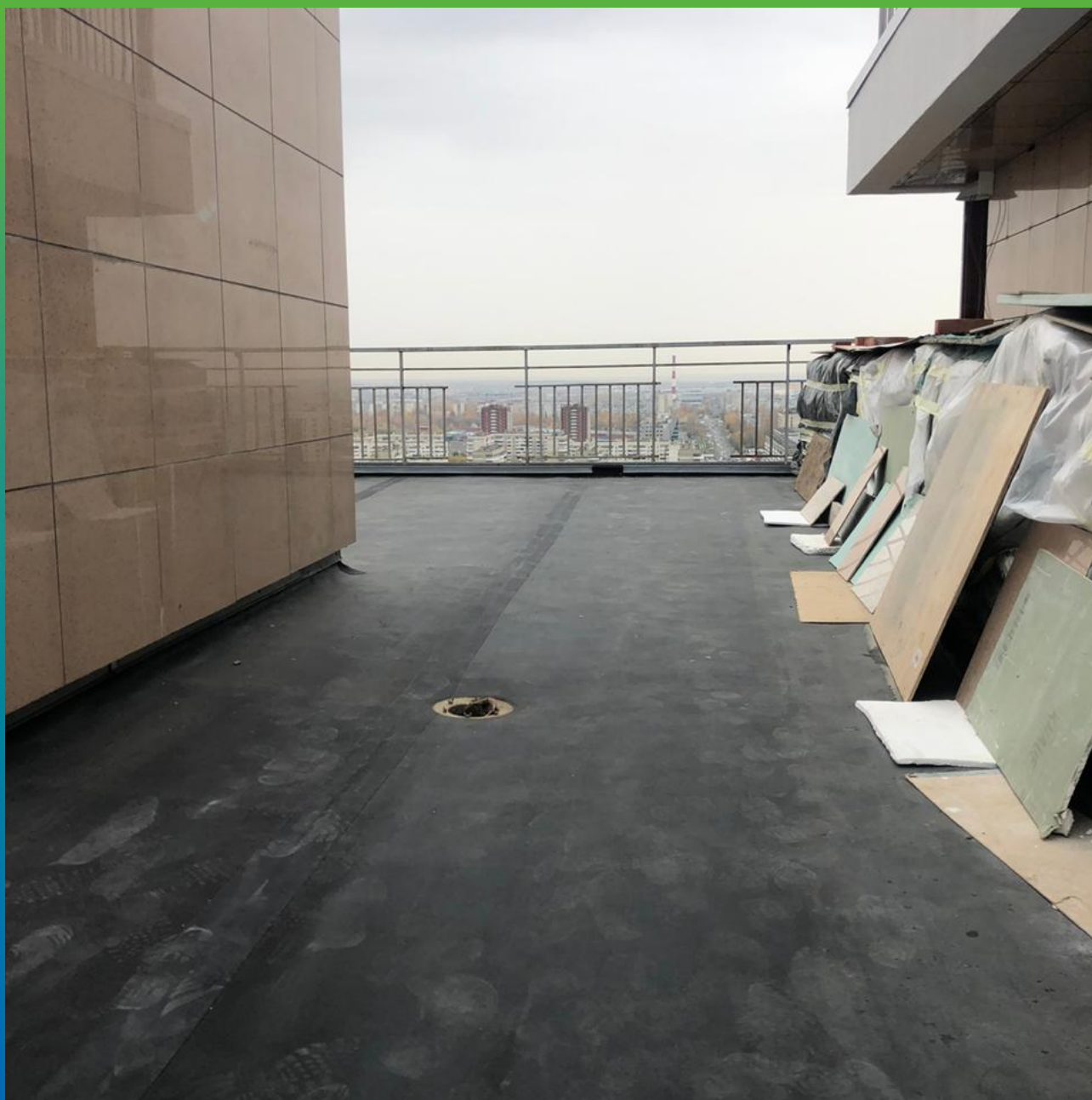
Гидроизоляция открытой террасы ЭПДМ мембраной Преласта СТ и герметиком Манодил Бонд Ф