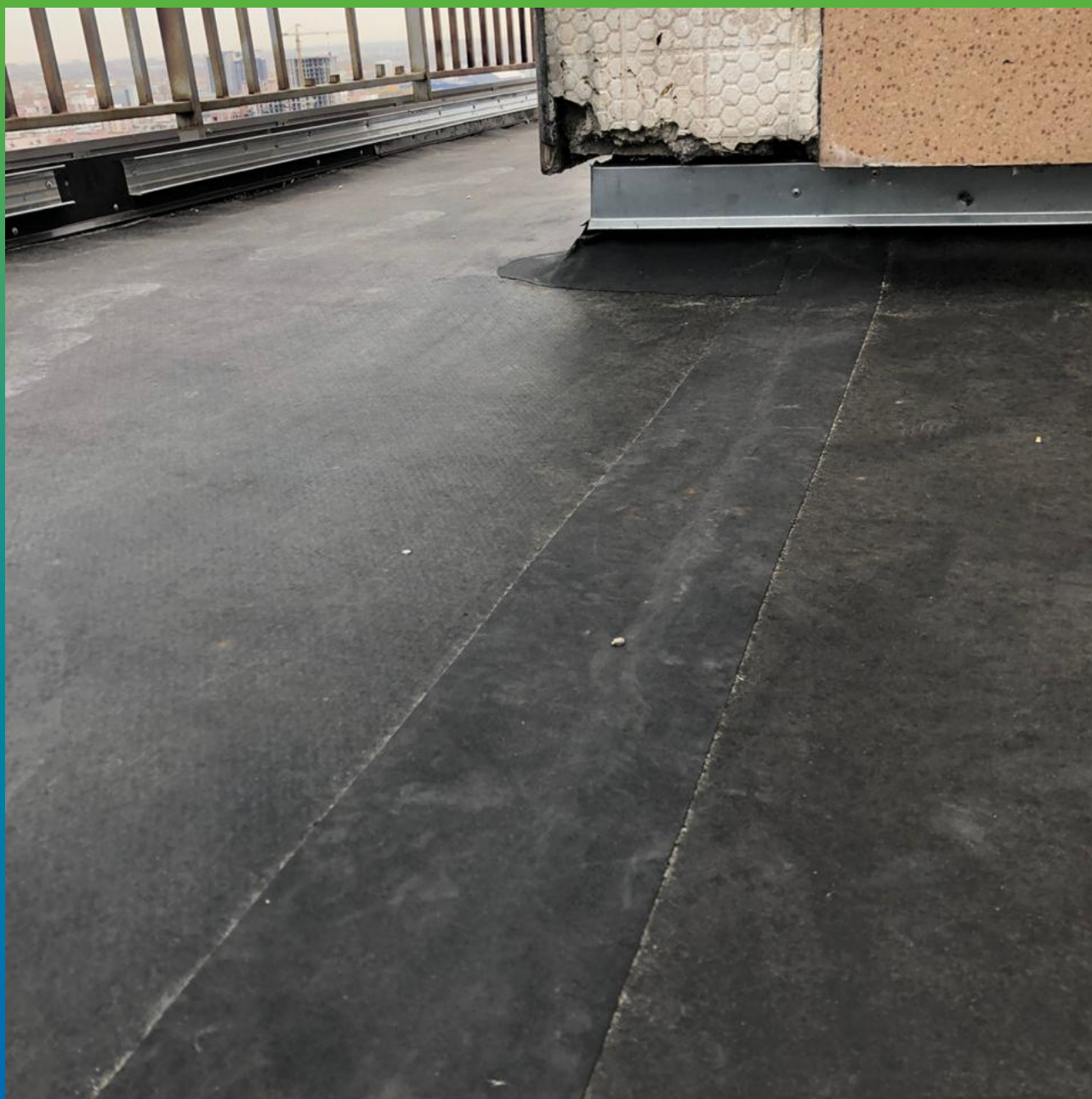
Гидроизоляция открытой террасы ЭПДМ мембраной Преласта СТ и герметиком Манодил Бонд Ф