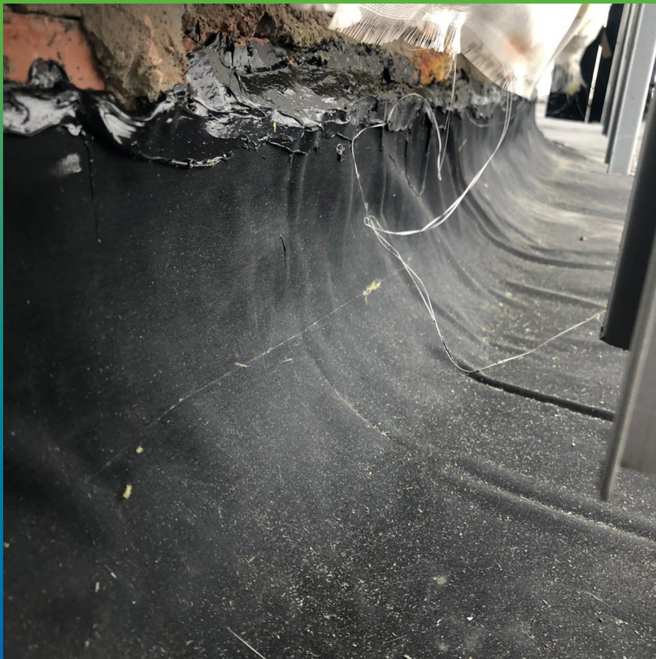
Заведение и герметизация мембраны на вертикальных частях