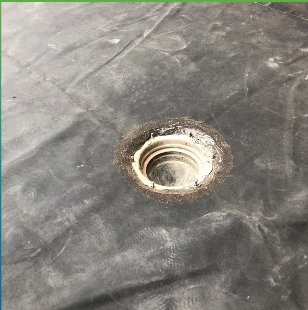
Герметизация водосливных воронок