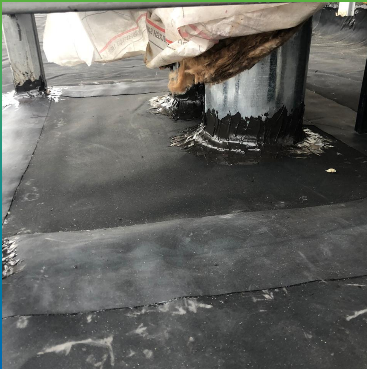
Герметизация вводов коммуникаций