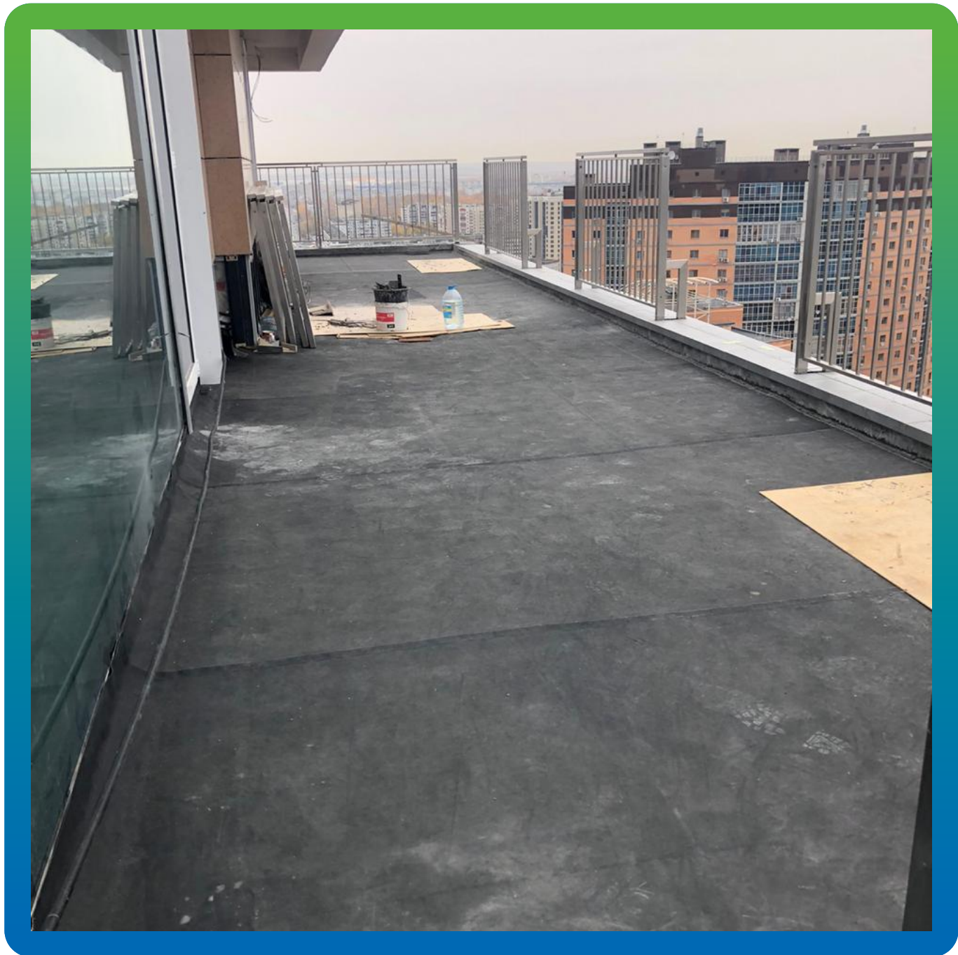
Гидроизоляция открытой террасы ЭПДМ мембраной Преласта СТ и герметиком Манодил Бонд Ф